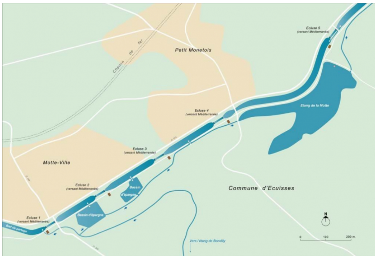
Carte schématique de l'alimentation de l'échelle d'écluses d'Écuisses.

71, Écuisses, lieu dit : bief de partage