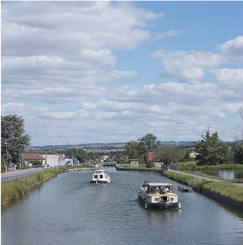
Echelle d'écluses depuis le pont sur l'écluse 01.