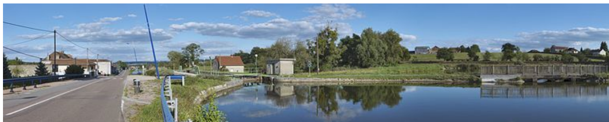
La maison éclusière 02 en contrebas du bief 02. Le réservoir de dépôt lié à la rigole alimentaire et régulatrice de l'échelle d'écluses. 71, Écuisses, lieudit : bief de partage

N° de l'illustration : 20127100331NUC4AQ