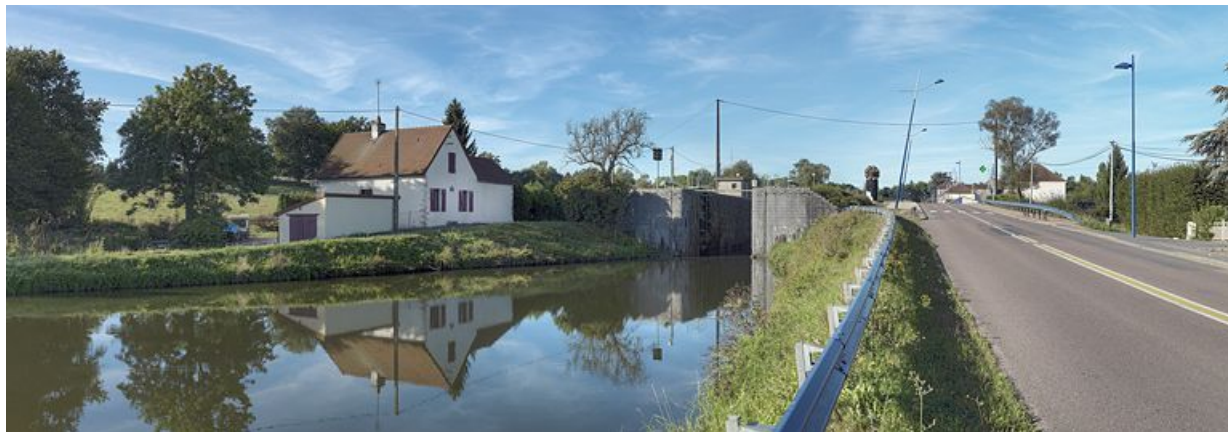
Maison 03 dans le bief 04. Le site d'écluse 03 est en amont de la maison éclusière. En arrière-plan, la borne des 7 écluses. 71, Écuisses, lieudit : bief 03 du versant Saône-Méditerranée

N° de l'illustration : 20127100337NUC4AQ