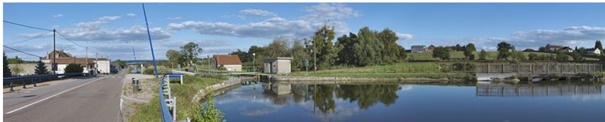
La maison éclusière 02 en contrebas du bief 02. Le réservoir de dépôt lié à la rigole alimentaire et régulatrice de l'échelle d'écluses. 71, Écuisses, lieudit : bief de partage

N° de l'illustration : 20127100331NUC4AQ