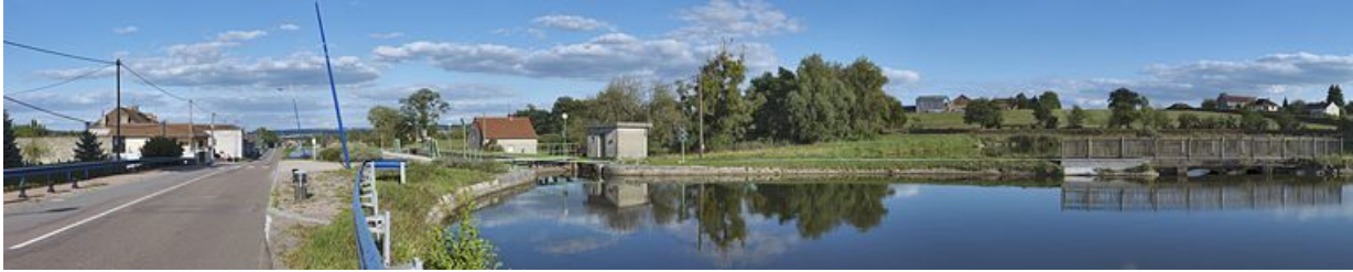
La maison éclusière 02 en contrebas du bief 02. Le réservoir de dépôt lié à la rigole alimentaire et régulatrice de l'échelle d'écluses. 71, Écuisses, lieudit : bief de partage

N° de l'illustration : 20127100331NUC4AQ