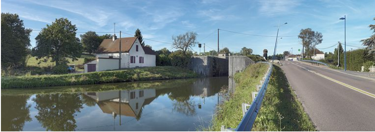
Maison 03 dans le bief 04. Le site d'écluse 03 est en amont de la maison éclusière. En arrière-plan, la borne des 7 écluses. 71, Écuisses, lieudit : bief 03 du versant Saône-Méditerranée

N° de l'illustration : 20127100337NUC4AQ