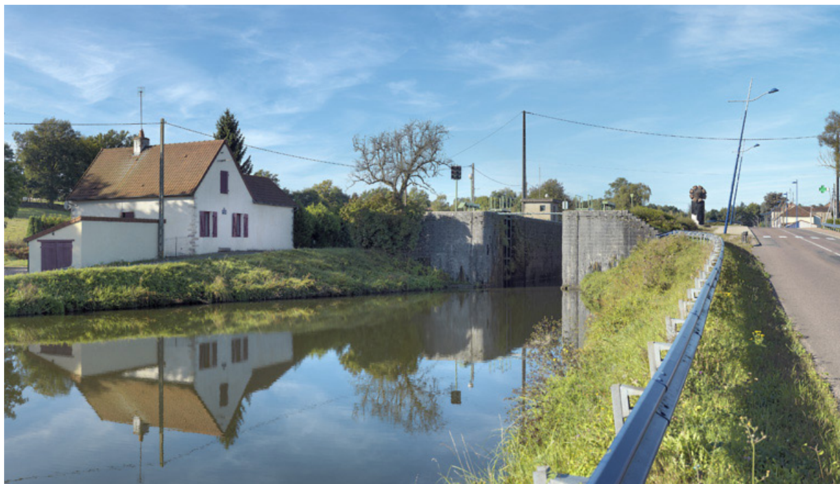
Maison 03 dans le bief 04. Le site d'écluse 03 est en amont de la maison éclusière. En arrière-plan, la borne des 7 écluses. 71, Écuisses, lieudit : bief 03 du versant Saône-Méditerranée