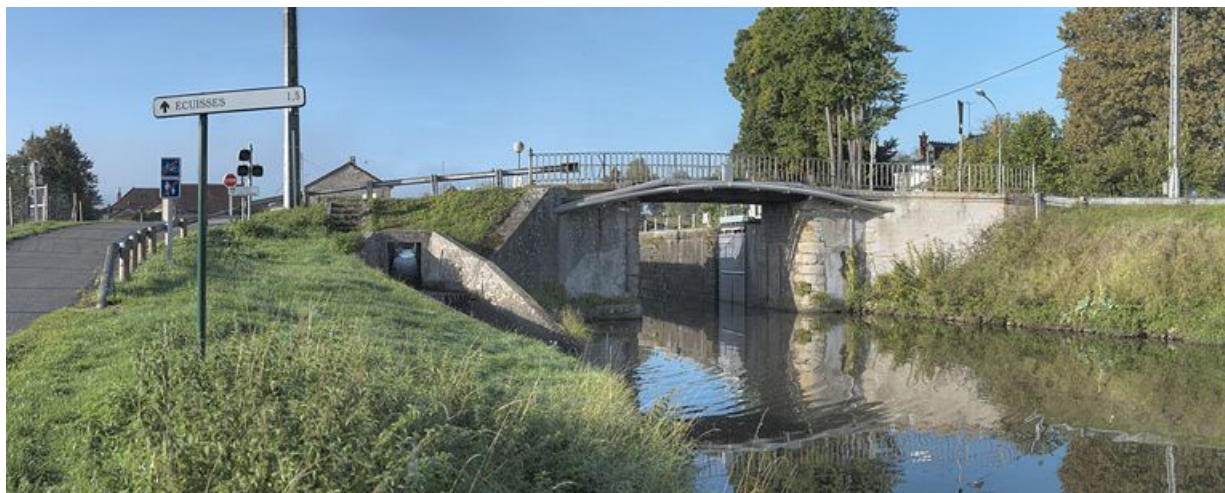
Le site d'écluse 05 vu du bief 06. Pont sur écluse avec escalier. Arrivée de la rigole régulatrice des biefs. 71, Écuisses, lieudit : bief 05 du versant Saône-Méditerranée

N° de l'illustration : 20127100370NUC4AQ