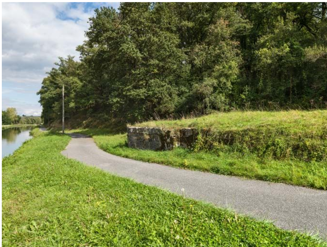
Vue du mur de bajoyer, vestige de l'ancien site d'écluse.

71, Saint-Julien-sur-Dheune, lieudit : bief 10 du versant Saône-Méditerranée