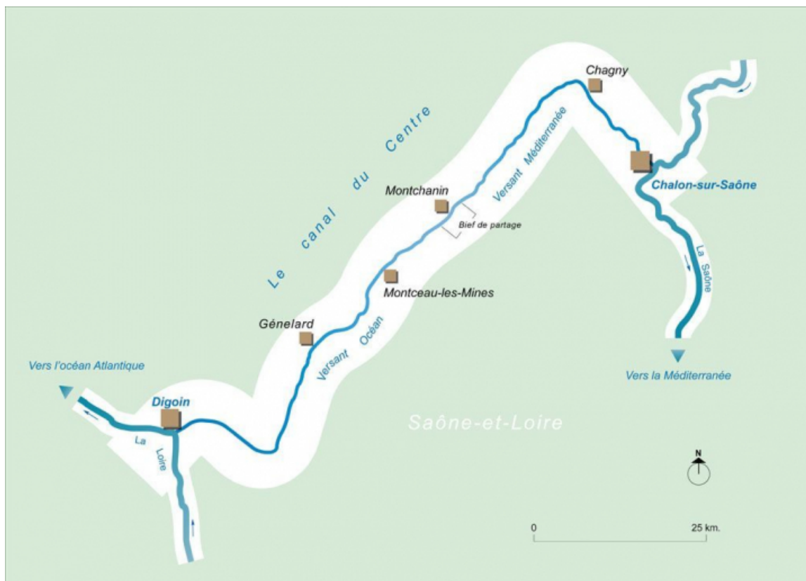
Carte schématique du tracé du canal du Centre.