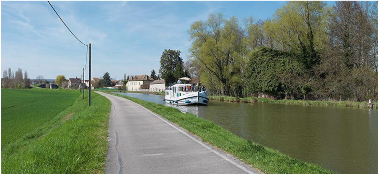
La maison éclusière XXXVII depuis la rive droite et d'aval.

71, Rully, lieudit : bief 28 du versant Saône-Méditerranée