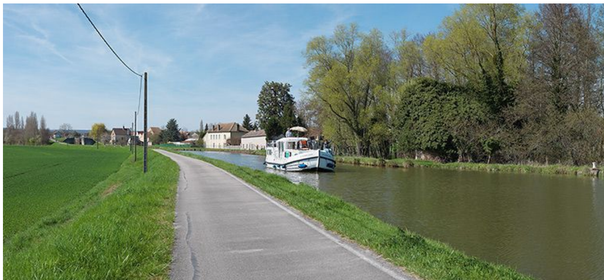
La maison éclusière XXXVII depuis la rive droite et d'aval.

71, Rully, lieudit : bief 28 du versant Saône-Méditerranée