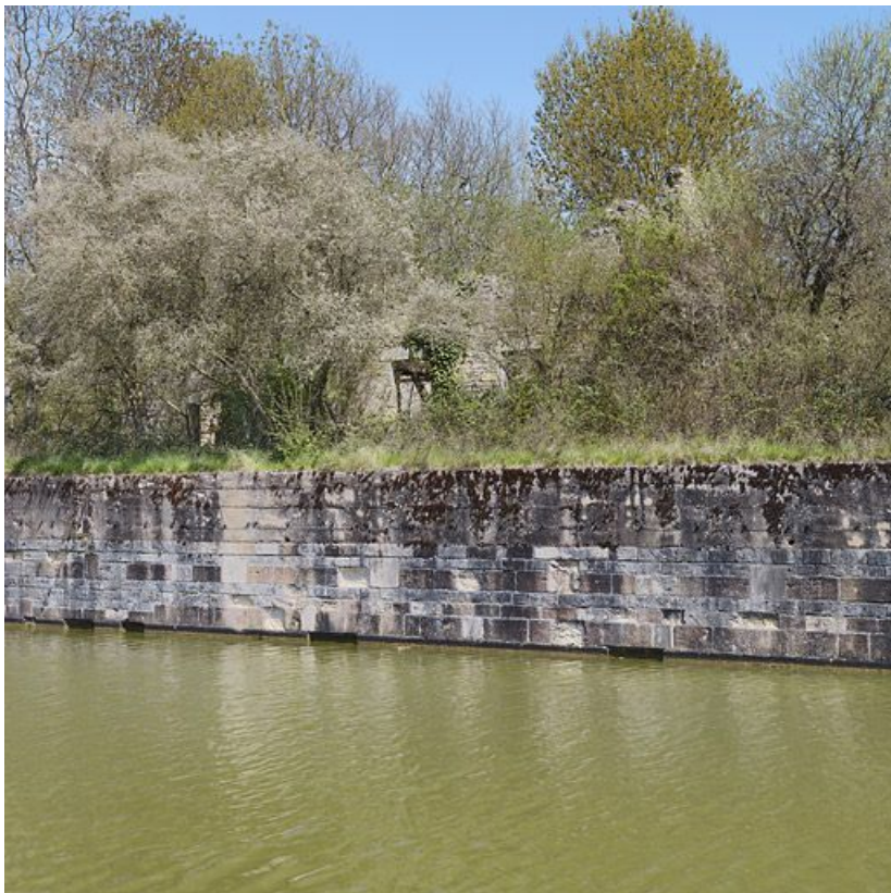
Vue rapprochée sur le bajoyer. On aperçoit la maison éclusière derrière la végétation. 71, Rully, lieudit : bief 29 du versant Saône-Méditerranée