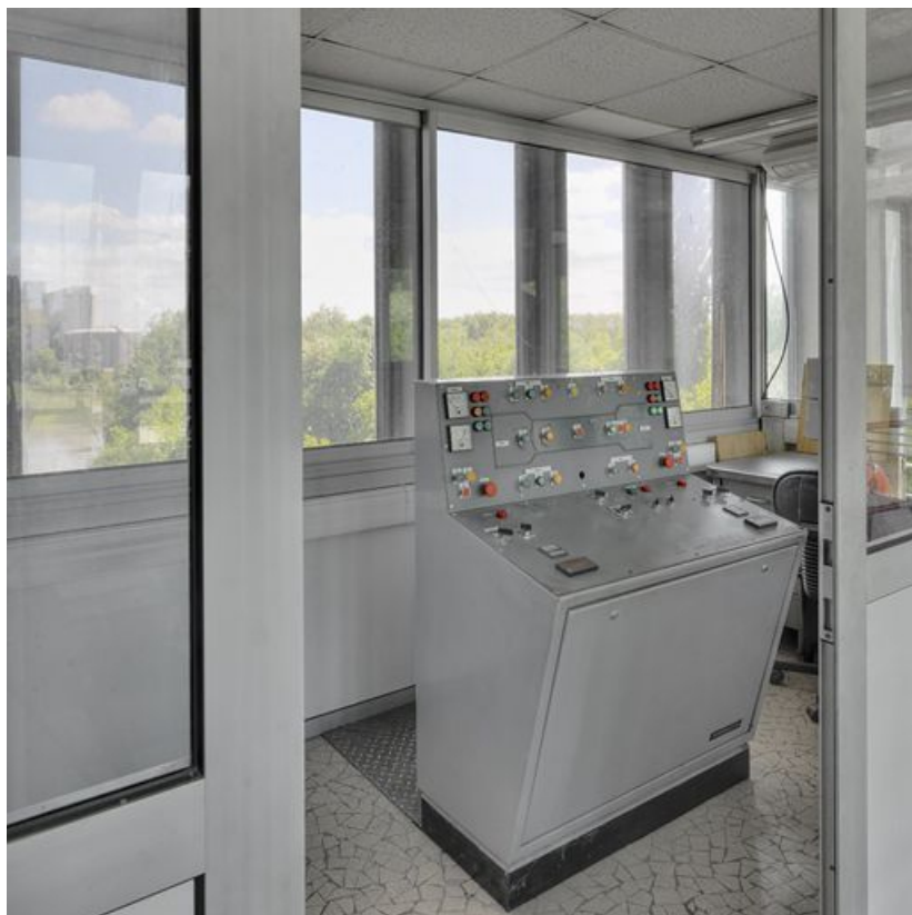
Vue intérieure de l'ancien poste de commande.

71, Crissey, lieudit : bief 34 bis du versant Saône-Méditerranée