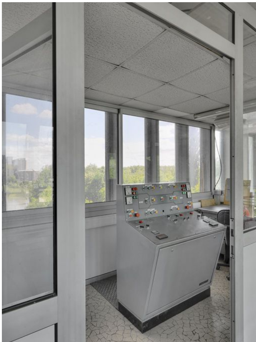
Vue intérieure de l'ancien poste de commande.

71, Crissey, lieudit : bief 34 bis du versant Saône-Méditerranée