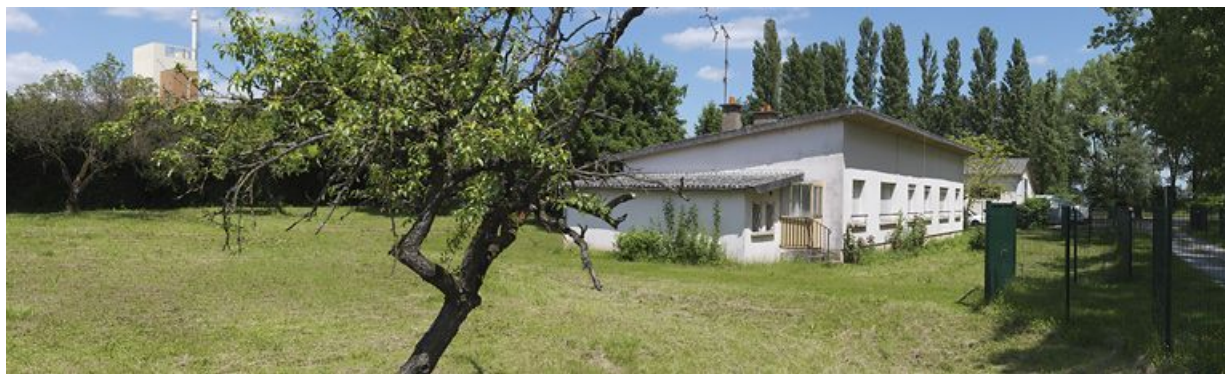
Rive droite, vue rapprochée de la maison éclusière.

71, Crissey, lieudit : bief 34 bis du versant Saône-Méditerranée