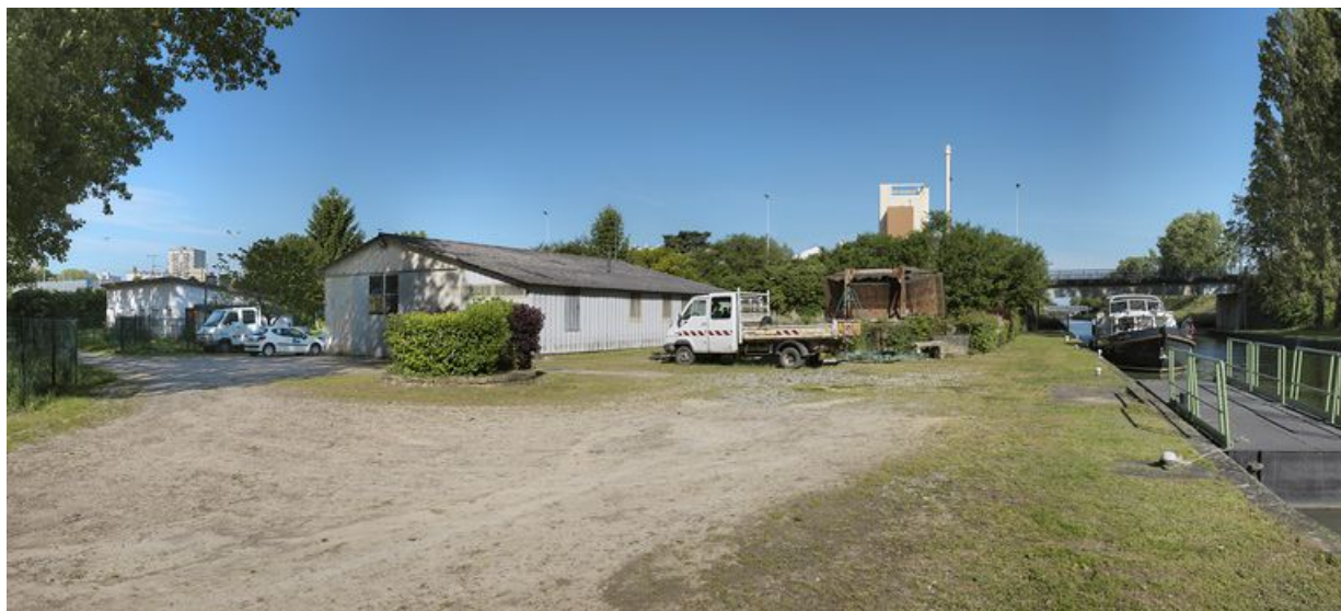
Rive droite, vue de l'atelier et de la maison éclusière.

71, Crissey, lieudit : bief 34 bis du versant Saône-Méditerranée