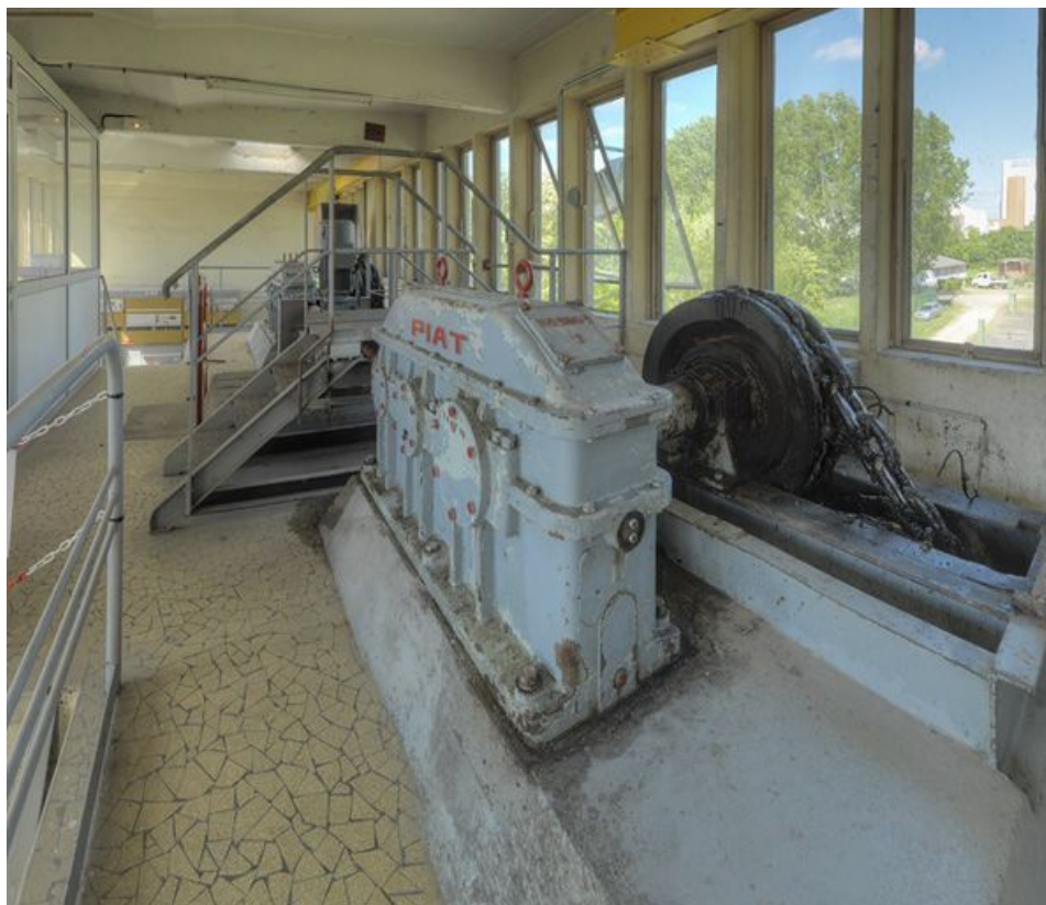
Vue intérieure de l'ancien poste de commande avec ses installations.

71, Crissey, lieudit : bief 34 bis du versant Saône-Méditerranée