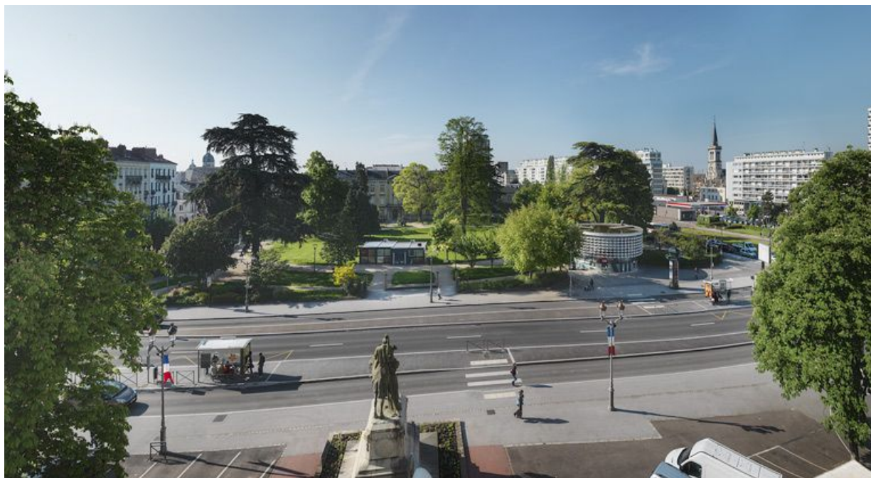
Vue du square Chabas, anciennement bassin de la Gloriette. A droite, l'avenue Nicéphore Niépce et en arrière-plan, l'église Saint-Cosme.