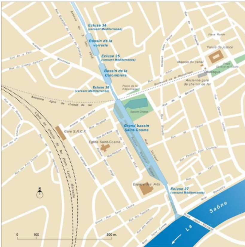
Carte schématique de l'ancien tracé du canal du Centre dans la ville de Chalon-sur-Saône. Détail. 71, Chalon-sur-Saône