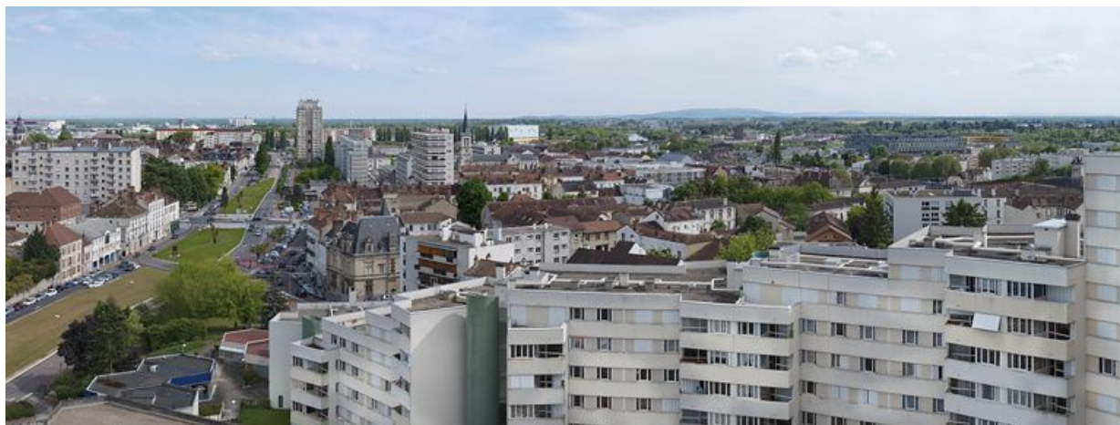
Panorama de la ville de Chalon-sur-Saône : à gauche, l'ancien tracé du canal, aujourd'hui avenue Nicéphore Niépce, au centre, l'église Saint-Cosme et à droite, l'hôpital William Morey.