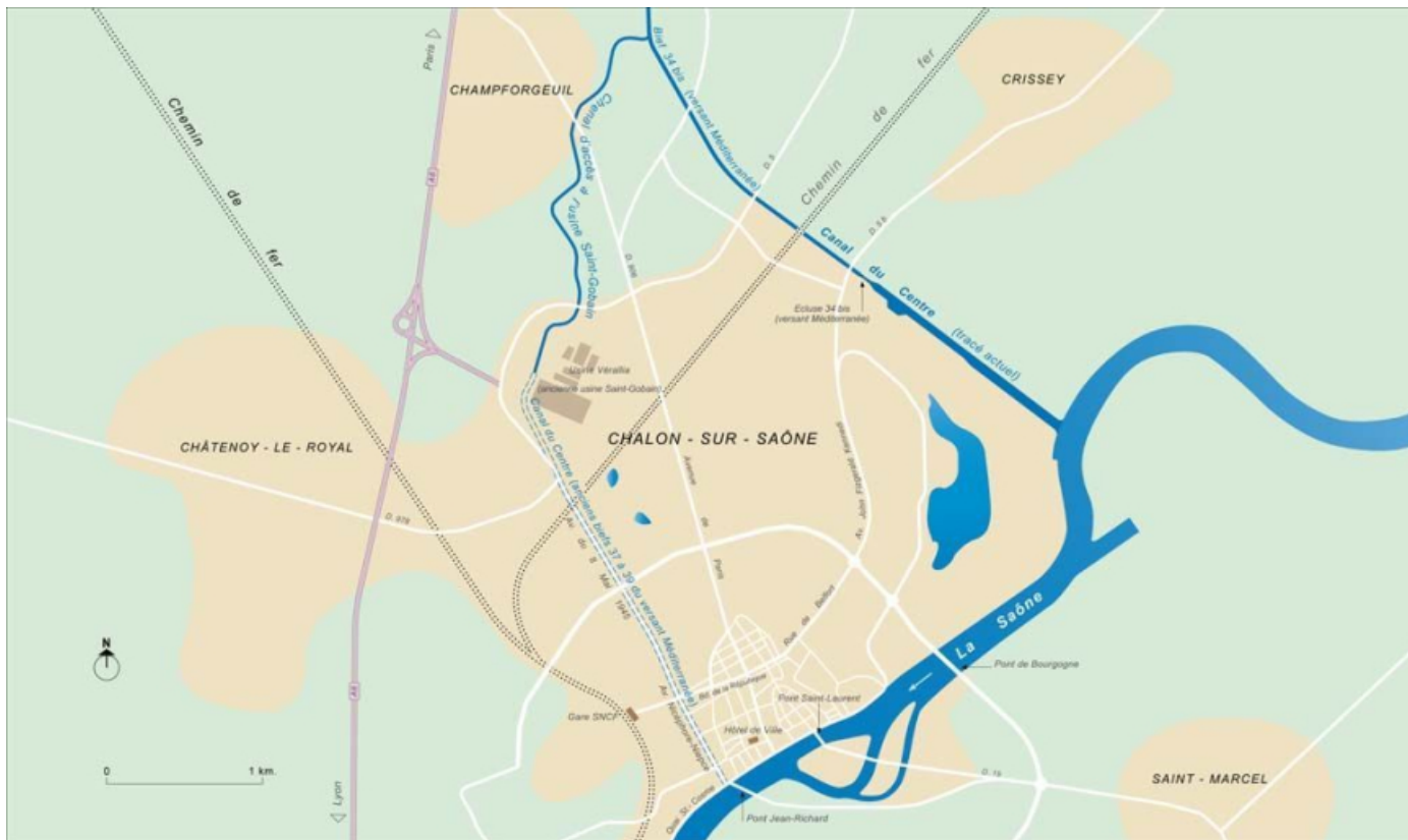
Carte schématique de l'ancien tracé du canal du Centre dans la ville de Chalon-sur-Saône. 71, Chalon-sur-Saône