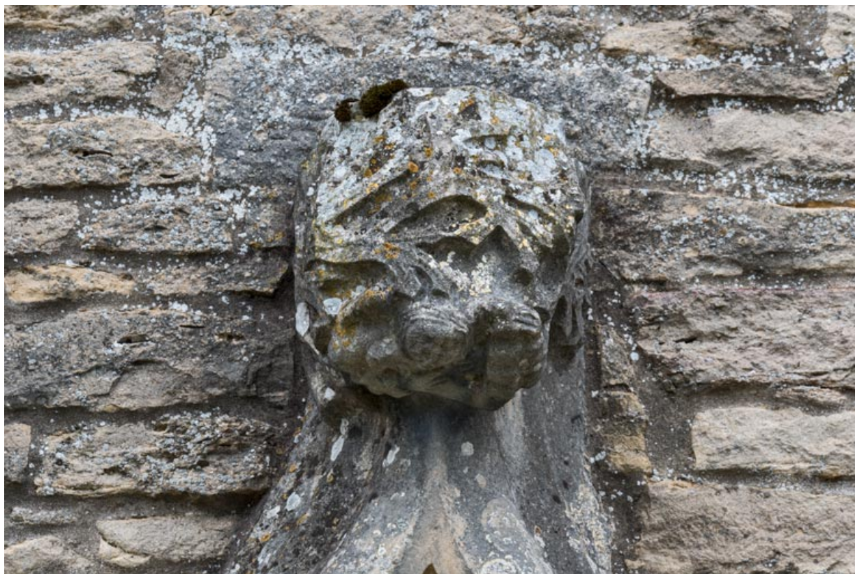
Détail de l'arc en accolade, faite : feuilles et personnages.

71, Laives montée de Lenoux, lieudit : Lenoux