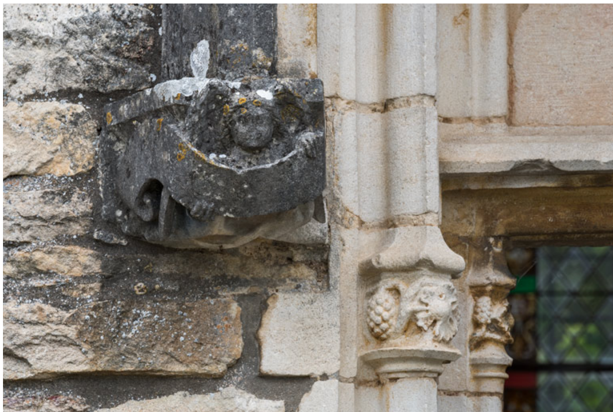
Détail de l'arc en accolade, décor de la retombée de gauche : ange portant un phylactère.

71, Laives montée de Lenoux, lieudit : Lenoux