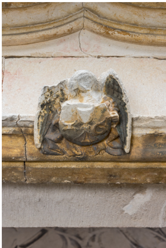
Linteau, détail : ange portant l'écu de Jehan Géliot.

71, Laives montée de Lenoux, lieudit : Lenoux