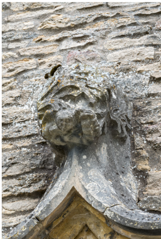
Détail de l'arc en accolade, faite : feuilles et personnage.

71, Laives montée de Lenoux, lieudit : Lenoux