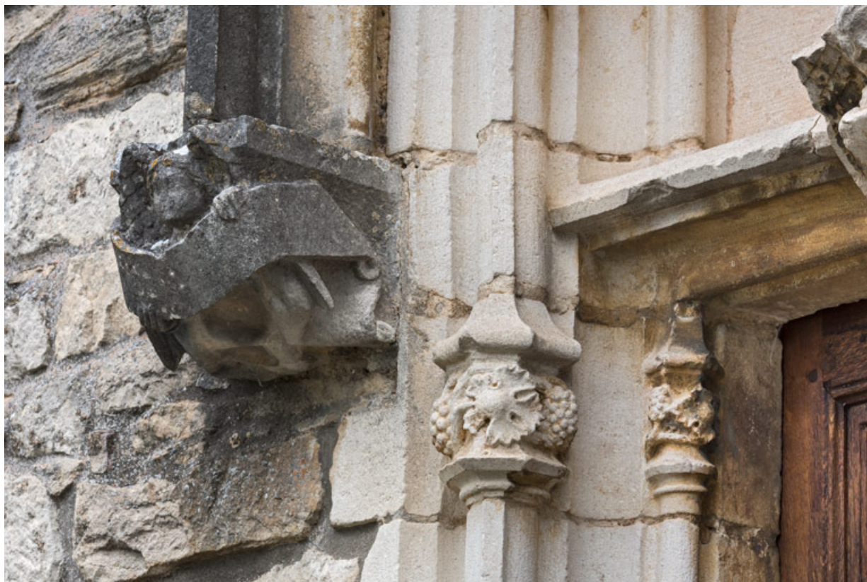
Détail de l'arc en accolade, décor de la retombée de gauche : ange portant un phylactère.

71, Laives montée de Lenoux, lieudit : Lenoux