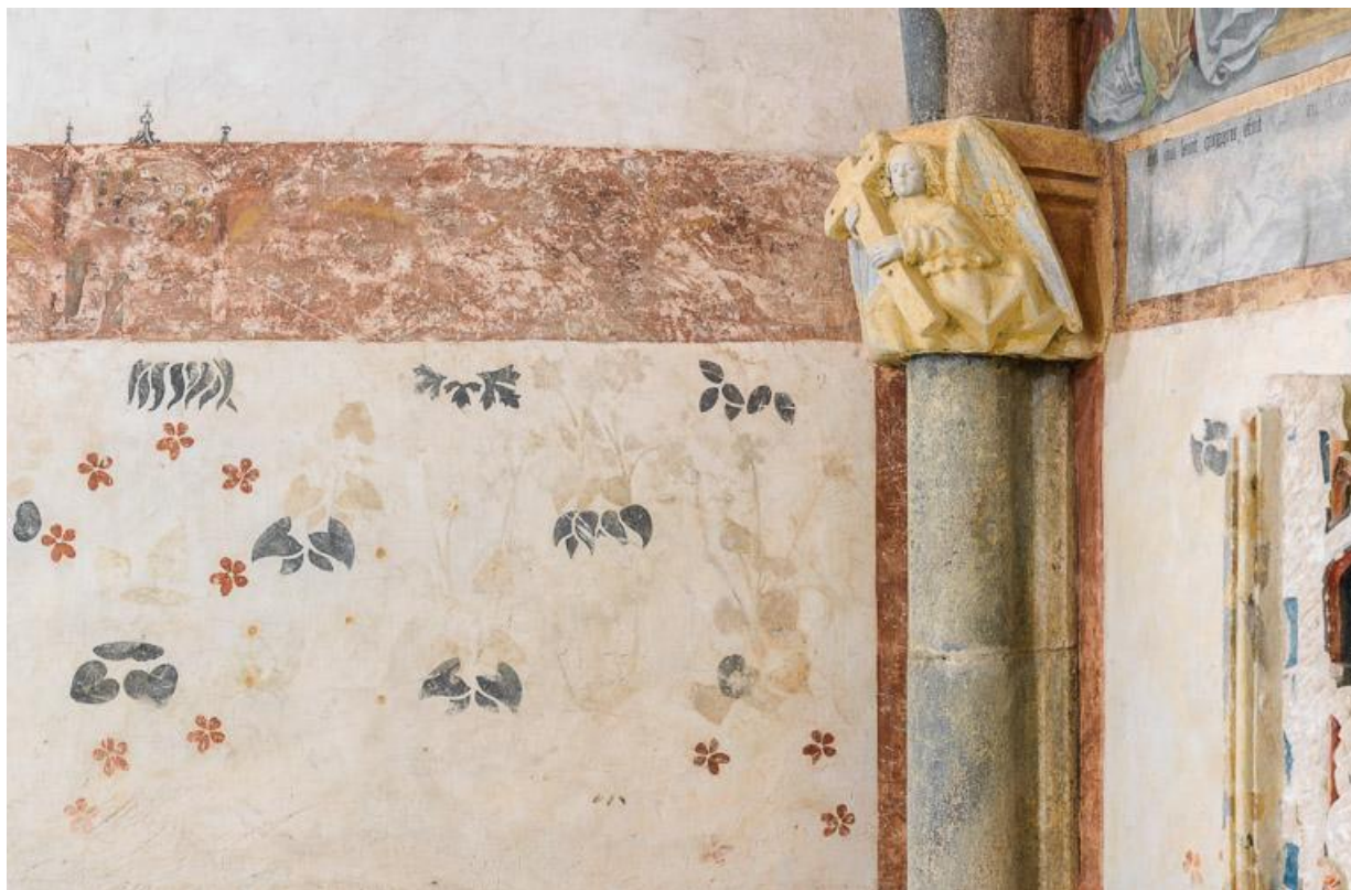
Détail des peintures murales du mur gauche, récemment restaurées.

71, Laives montée de Lenoux, lieudit : Lenoux