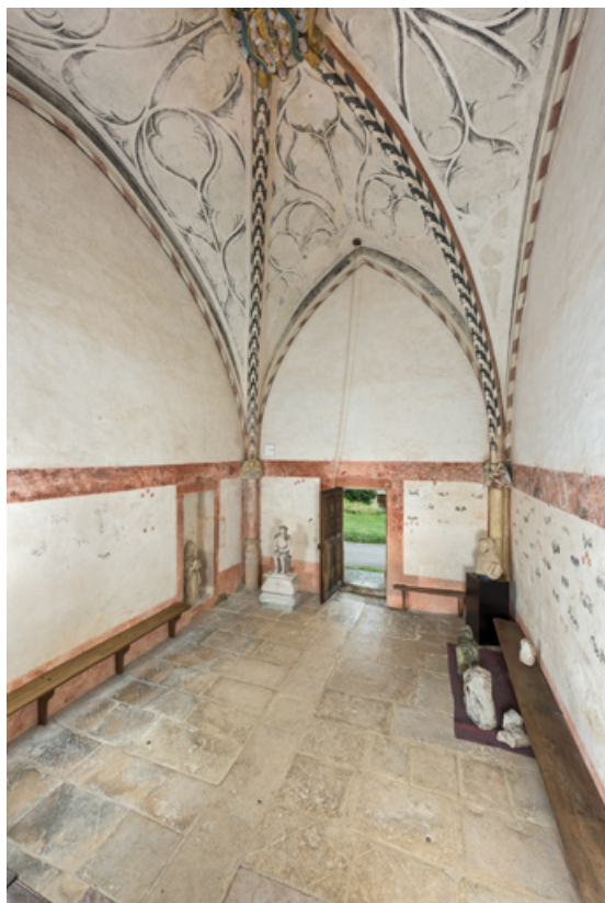
Vue d'ensemble de l'intérieur, en direction de l'entrée (porte ouverte).

71, Laives montée de Lenoux, lieudit : Lenoux