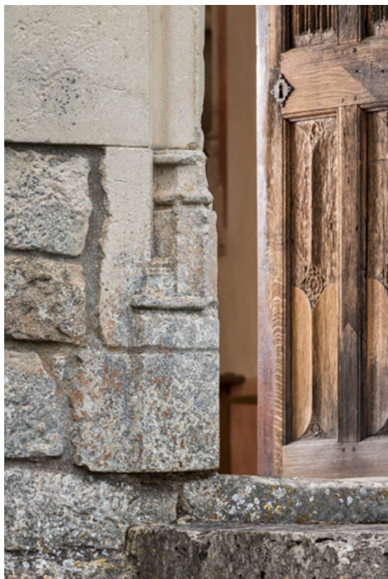
Piédroit, détail de la partie inférieure, gauche.

71, Laives montée de Lenoux, lieudit : Lenoux