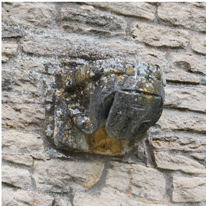
Console en façade à l'écu de Jehan Géliot, vue de trois quarts.

71, Laives montée de Lenoux, lieudit : Lenoux