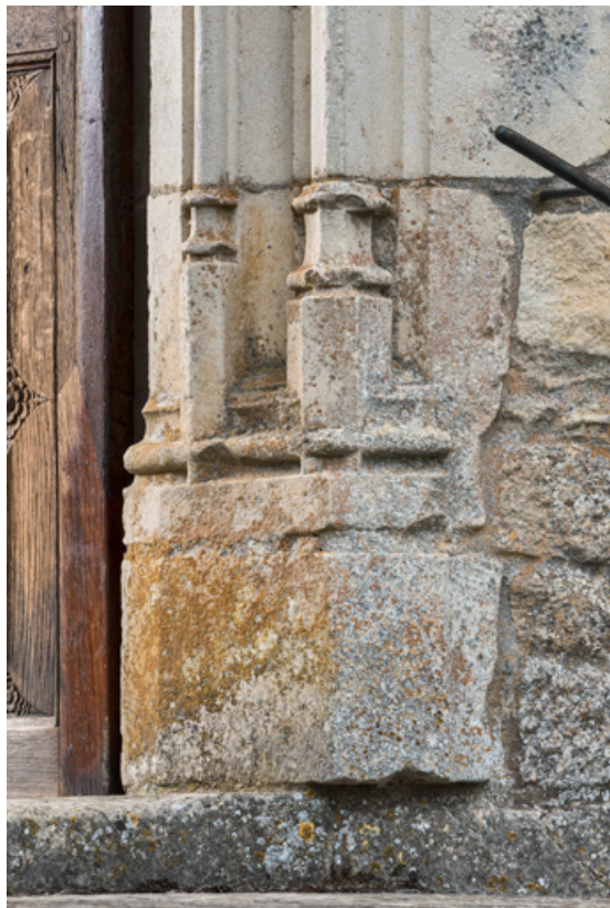
Piédroit, détail de la partie inférieure, droite.

71, Laives montée de Lenoux, lieudit : Lenoux