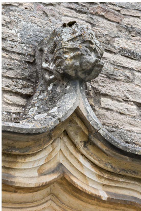
Détail de l'arc en accolade, faite : feuilles et personnage.

71, Laives montée de Lenoux, lieudit : Lenoux