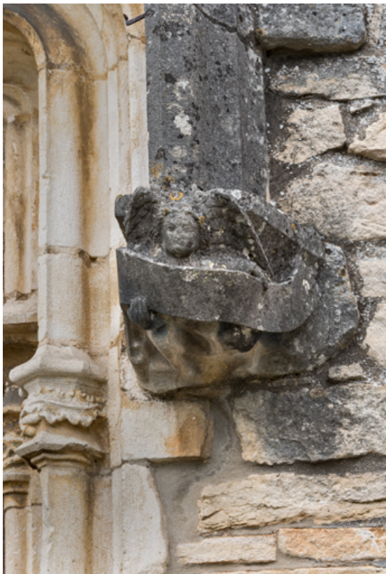
Détail de l'arc en accolade, décor de la retombée de droite : ange portant un phylactère.

71, Laives montée de Lenoux, lieudit : Lenoux