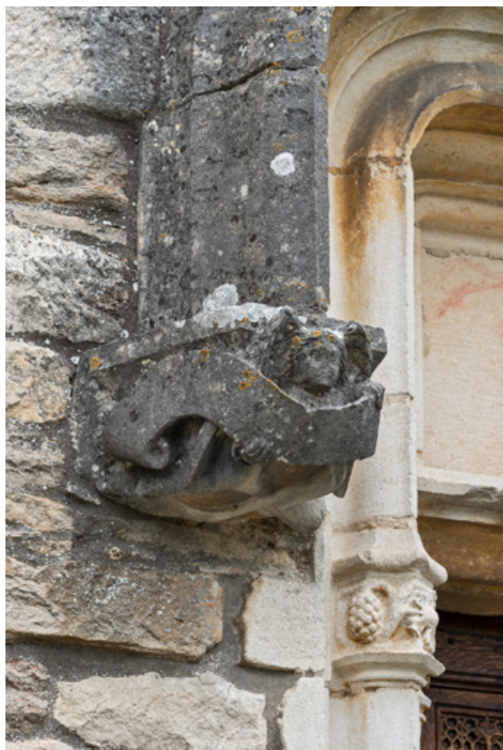
Détail de l'arc en accolade, décor de la retombée de gauche : ange portant un phylactère.

71, Laives montée de Lenoux, lieudit : Lenoux