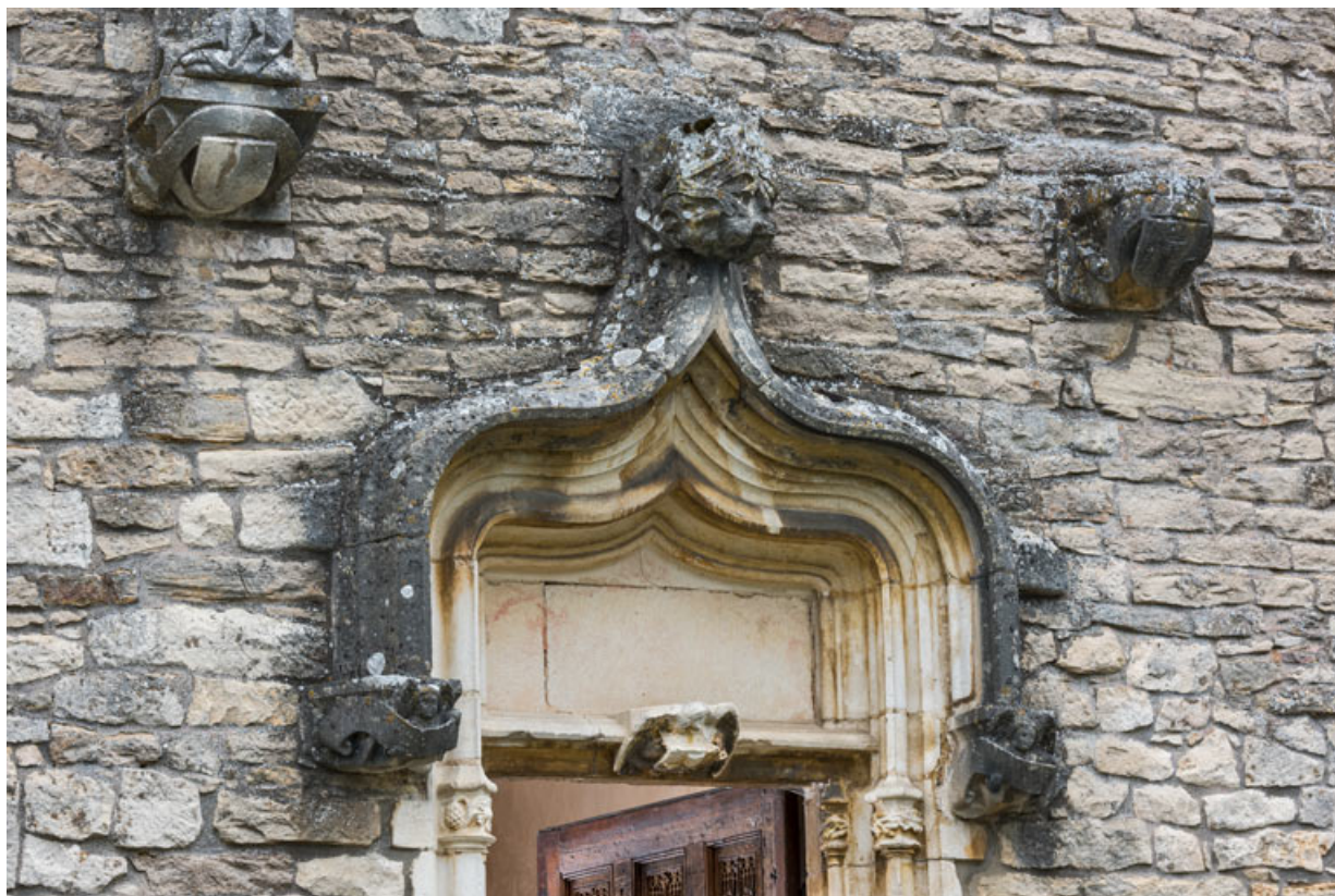
Tympan surmonté d'un arc en accolade.

71, Laives montée de Lenoux, lieudit : Lenoux