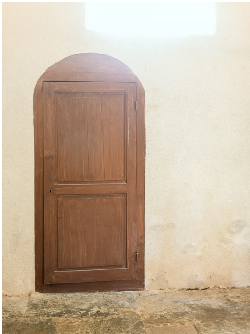
Nef, deuxième travée, élévation sud, porte murée transformée en placard.

71, Dezize-lès-Maranges place Etienne-Saveron