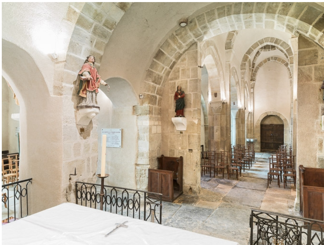
Arcades de la chapelle sud et vaisseau central.

71, Dezize-lès-Maranges place Etienne-Saveron