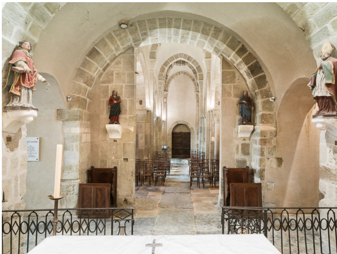
Vaisseau central, depuis le chœur.

71, Dezize-lès-Maranges place Etienne-Saveron