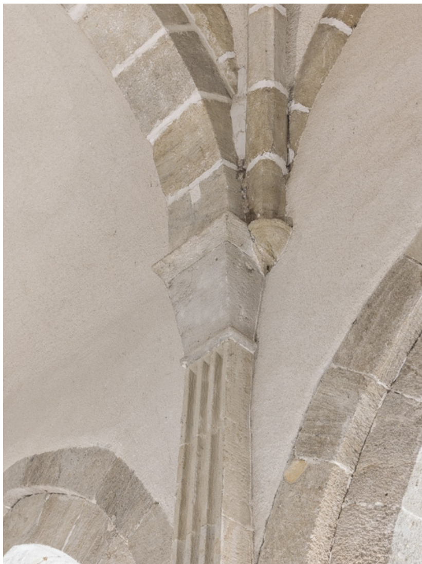
Détail d'un chapiteau de la nef.

71, Dezize-lès-Maranges place Etienne-Saveron