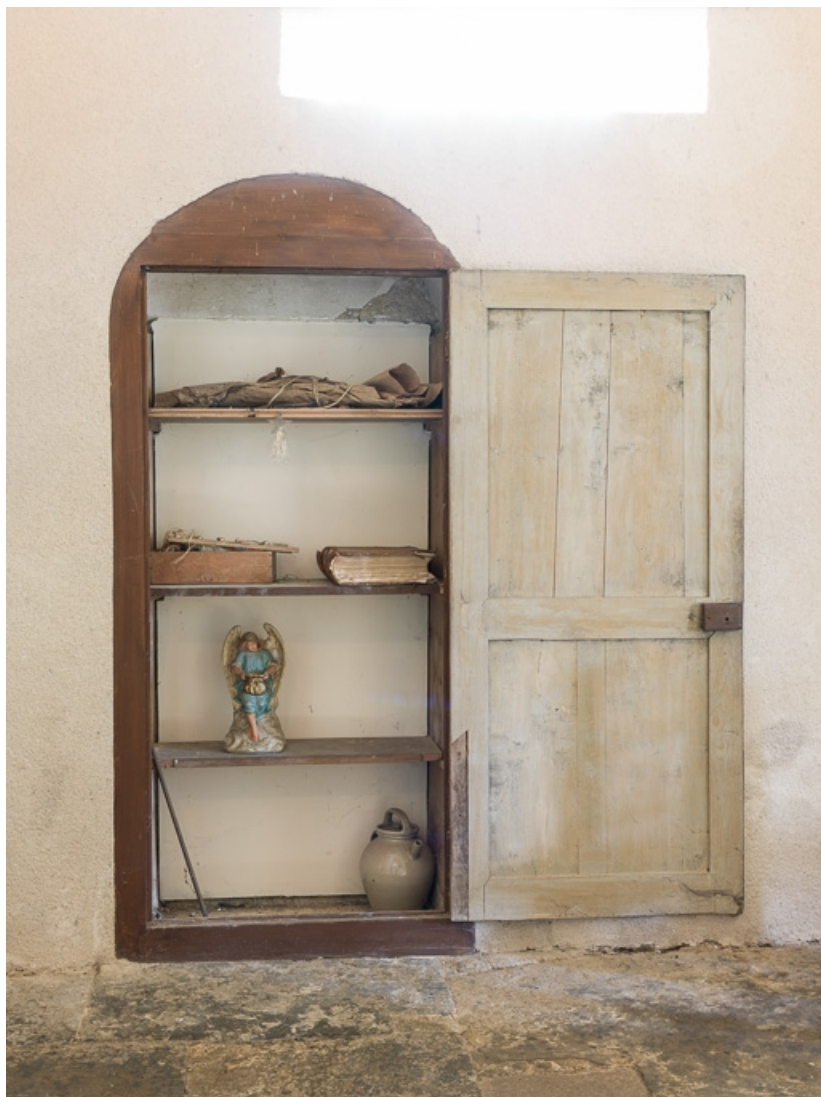
Nef, deuxième travée, élévation sud, porte murée transformée en placard.

71, Dezize-lès-Maranges place Etienne-Saveron