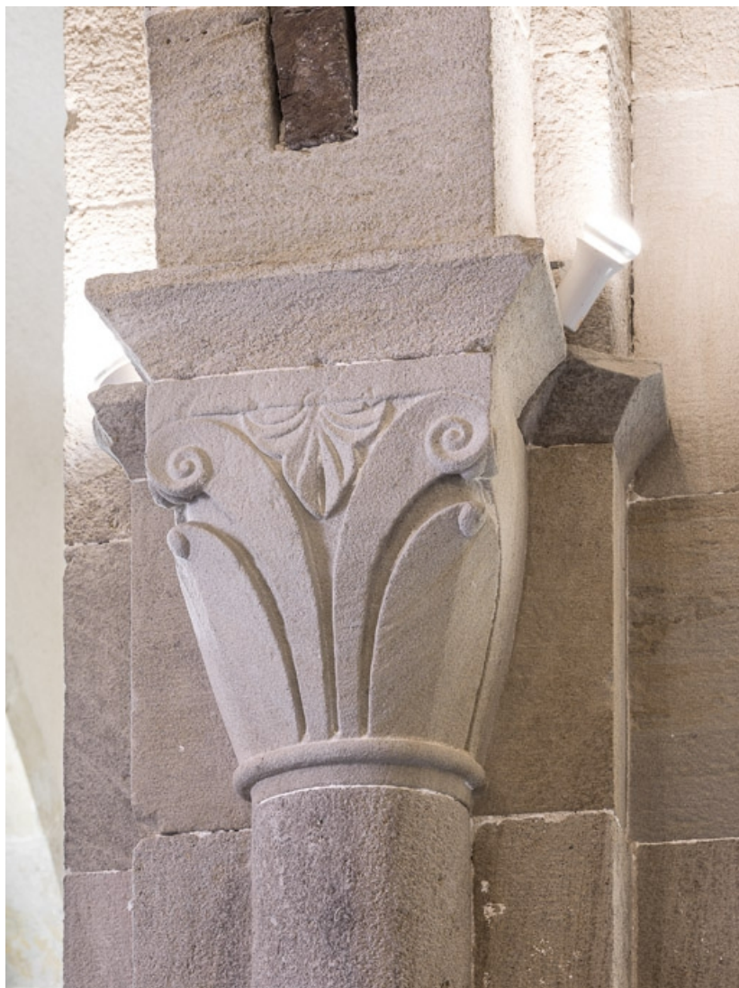
Détail d'un chapiteau de la nef.

71, Dezize-lès-Maranges place Etienne-Saveron