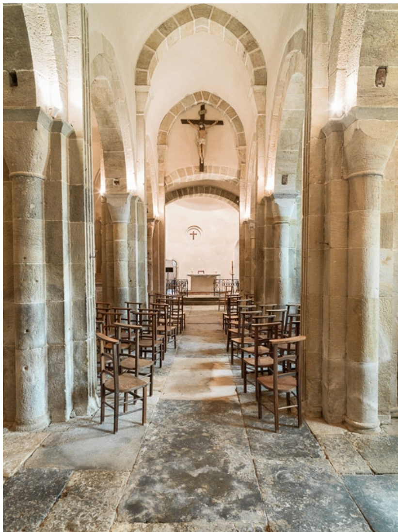
Vue du vaisseau central depuis l'entrée.

71, Dezize-lès-Maranges place Etienne-Saveron