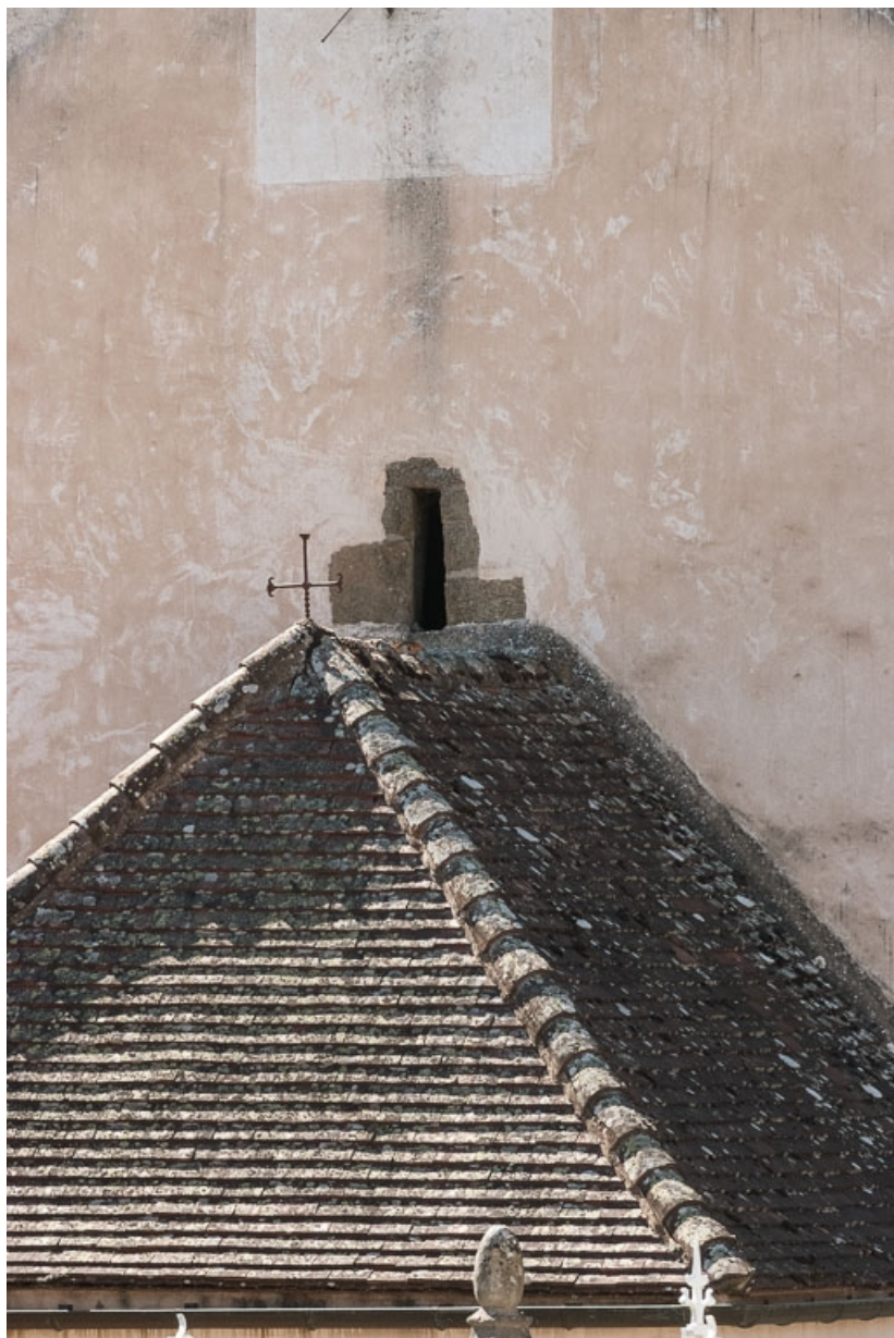
Détail d'une petite baie au dessus du toit de la sacristie.

71, Dezize-lès-Maranges place Etienne-Saveron