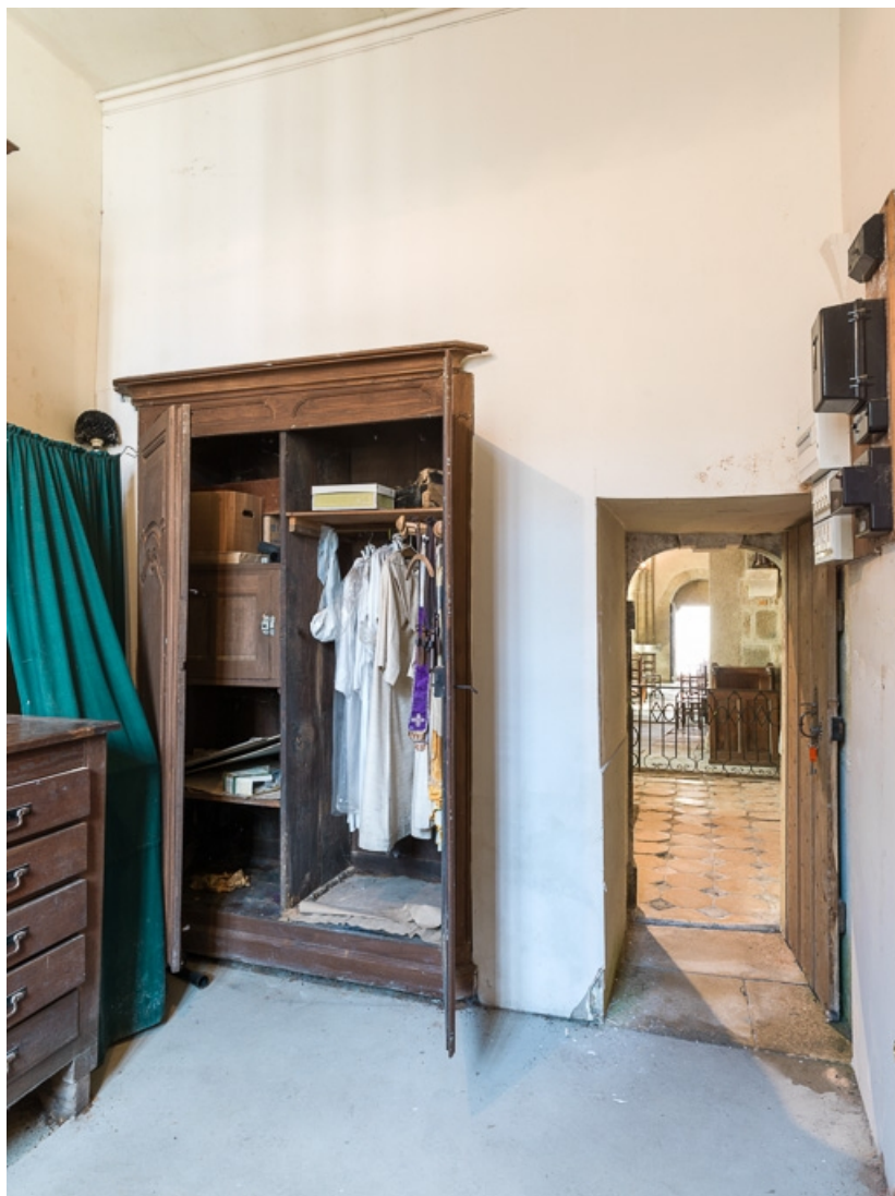
Vue de la sacristie avec porte ouverte sur le coeur.

71, Dezize-lès-Maranges place Etienne-Saveron