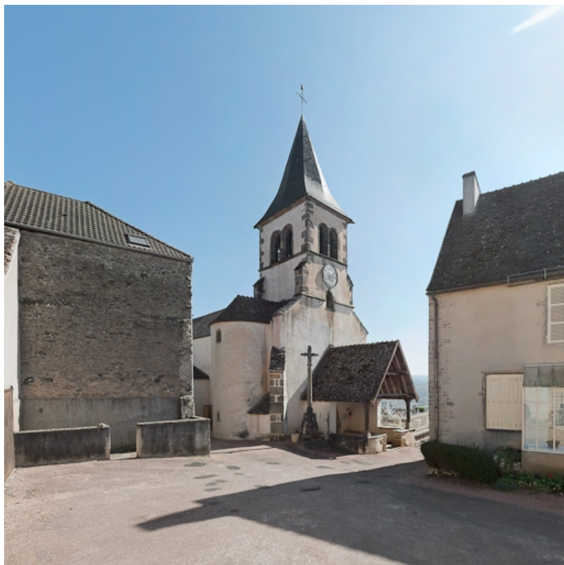
Vue d'ensemble de la façade et du clocher.

71, Dezize-lès-Maranges place Etienne-Saveron