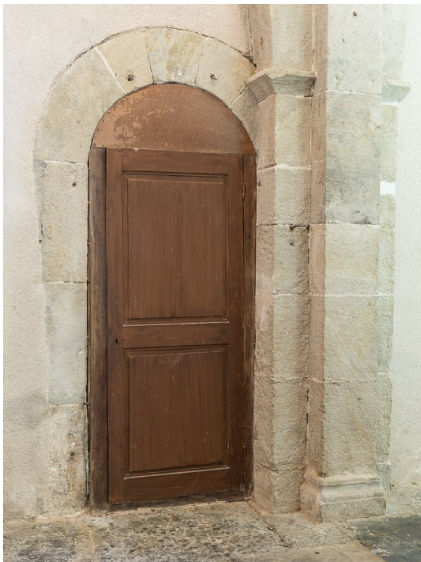
Nef, troisième travée, élévation sud, porte murée transformée en placard. 71, Dezize-lès-Maranges place Etienne-Saveron