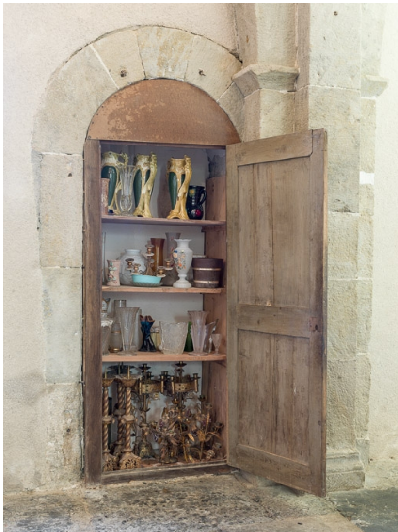
Nef, troisième travée, élévation sud, porte murée transformée en placard. 71, Dezize-lès-Maranges place Etienne-Saveron