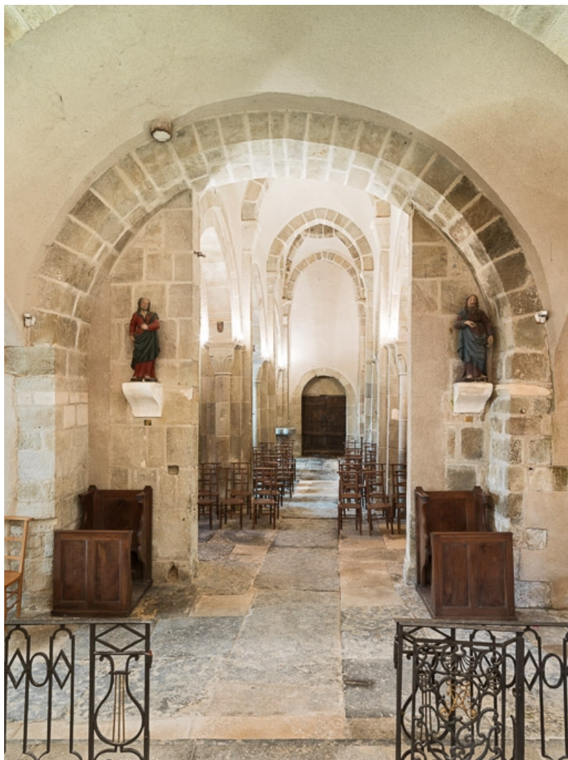
Vaisseau central, depuis le chœur.

71, Dezize-lès-Maranges place Etienne-Saveron