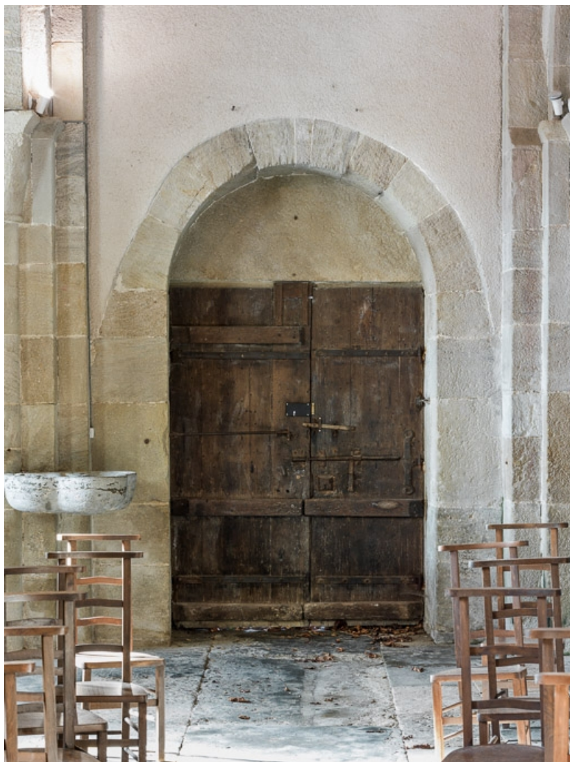
Porte d'entrée, côté intérieur.

71, Dezize-lès-Maranges place Etienne-Saveron