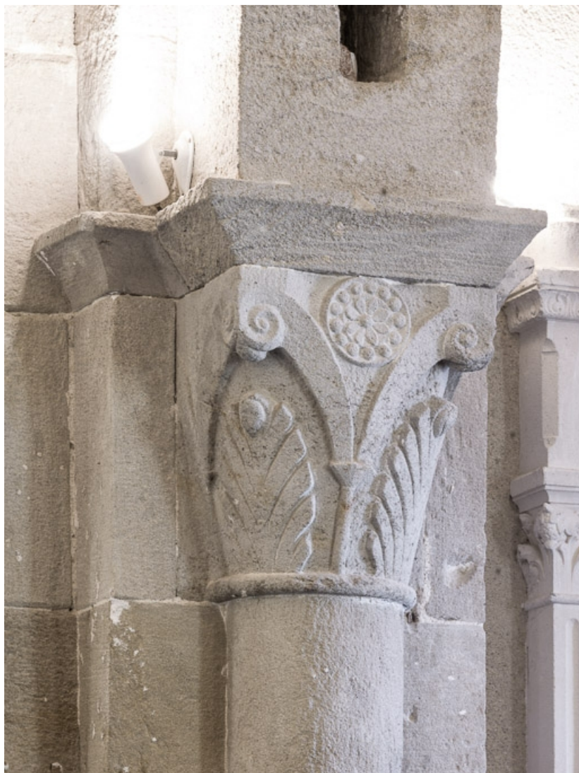
Détail d'un chapiteau de la nef.

71, Dezize-lès-Maranges place Etienne-Saveron