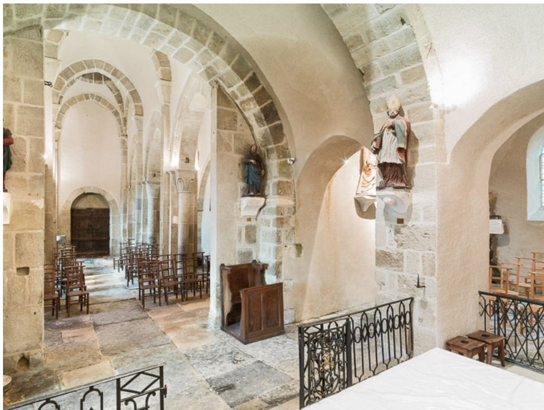
Arcades de la chapelle nord et vaisseau central.

71, Dezize-lès-Maranges place Etienne-Saveron