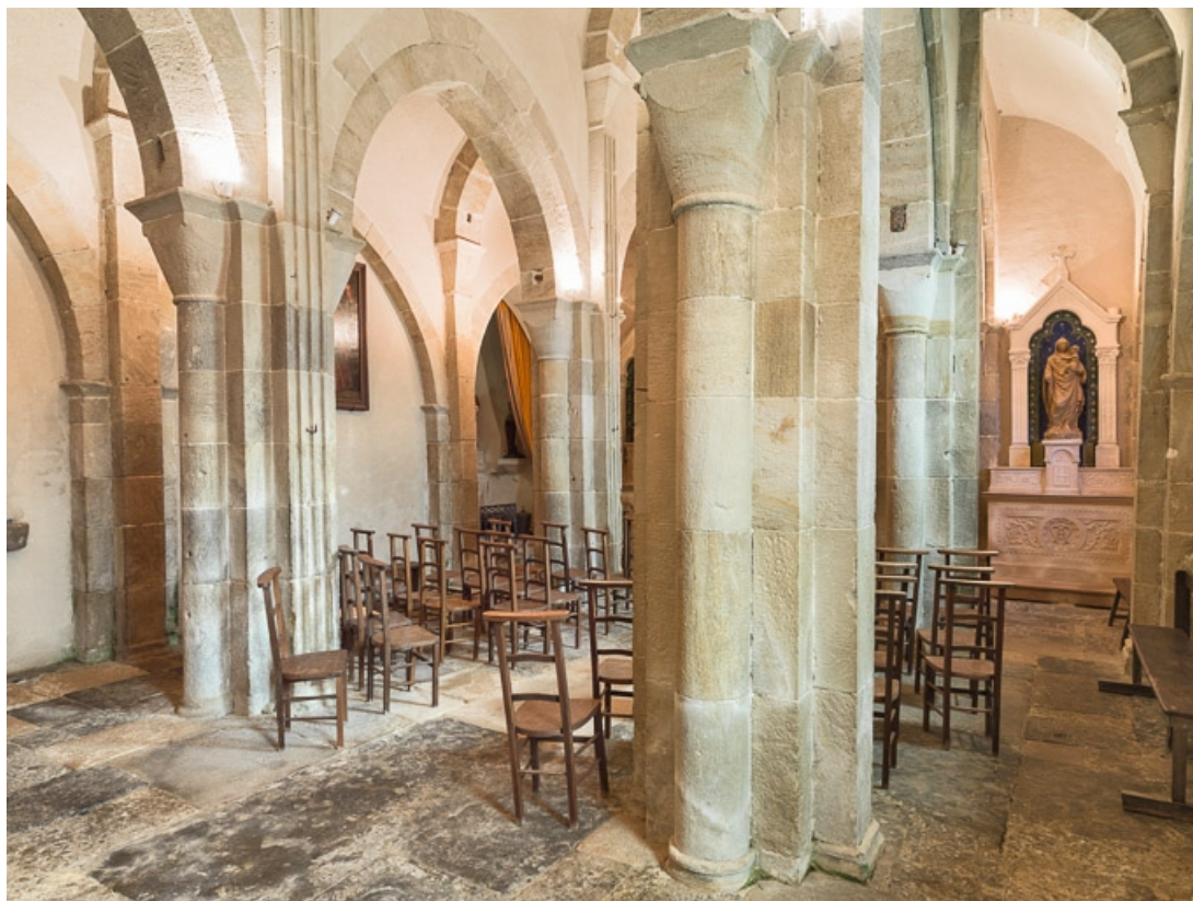
Vue de trois quarts depuis le bas-côté sud.

71, Dezize-lès-Maranges place Etienne-Saveron