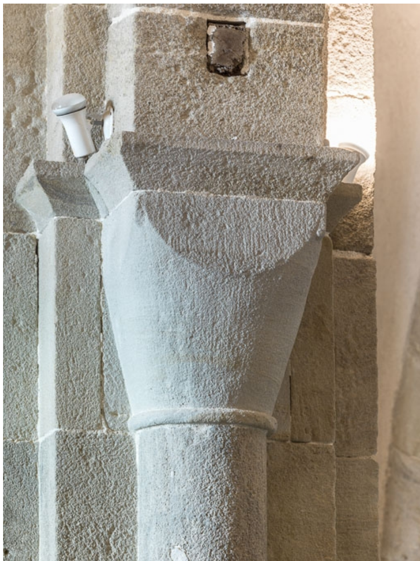
Détail d'un chapiteau de la nef.

71, Dezize-lès-Maranges place Etienne-Saveron