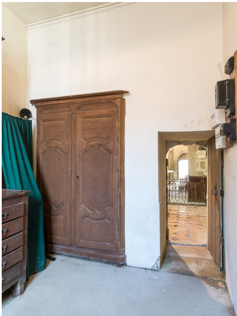
Vue de la sacristie avec porte ouverte sur le coeur.

71, Dezize-lès-Maranges place Etienne-Saveron