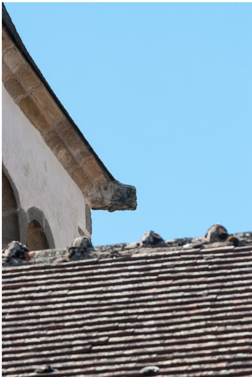
Détail d'une gargouille du clocher.

71, Dezize-lès-Maranges place Etienne-Saveron