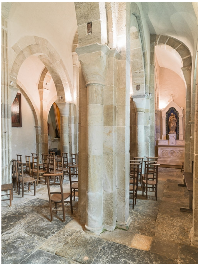
Vue de trois quarts depuis le bas-côté sud. 71, Dezize-lès-Maranges place Etienne-Saveron