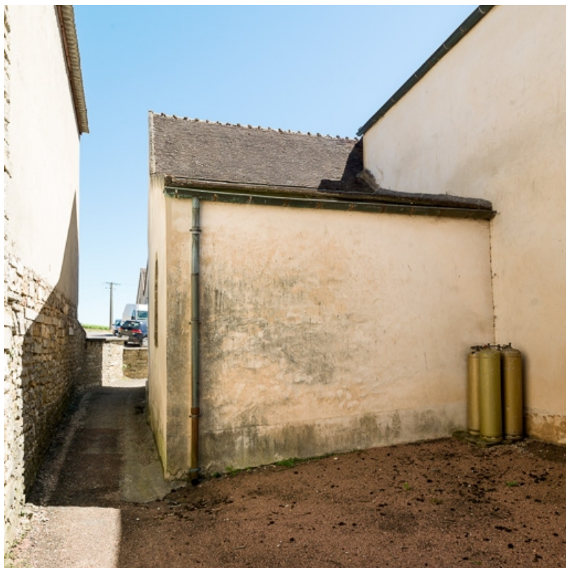
Chapelle de la dernière travée du bas-côté nord.

71, Dezize-lès-Maranges place Etienne-Saveron