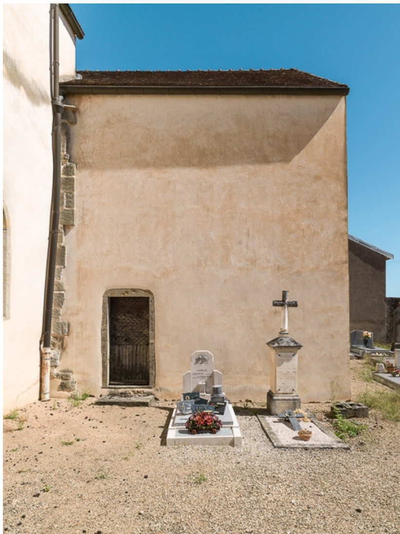
Élévation ouest de la chapelle sud.

71, Dezize-lès-Maranges place Etienne-Saveron