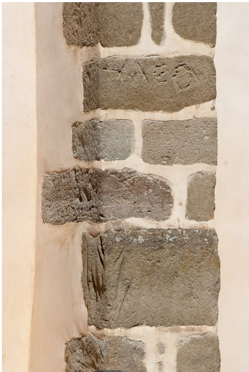
Contrefort de la nef, détail de marques dans la pierre.

71, Dezize-lès-Maranges place Etienne-Saveron