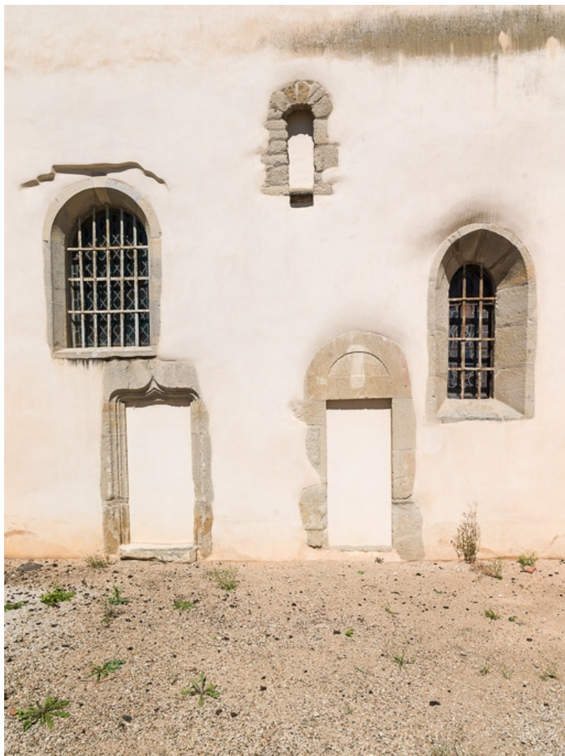
Baies et portes murées de l'élévation sud de la nef.

71, Dezize-lès-Maranges place Etienne-Saveron