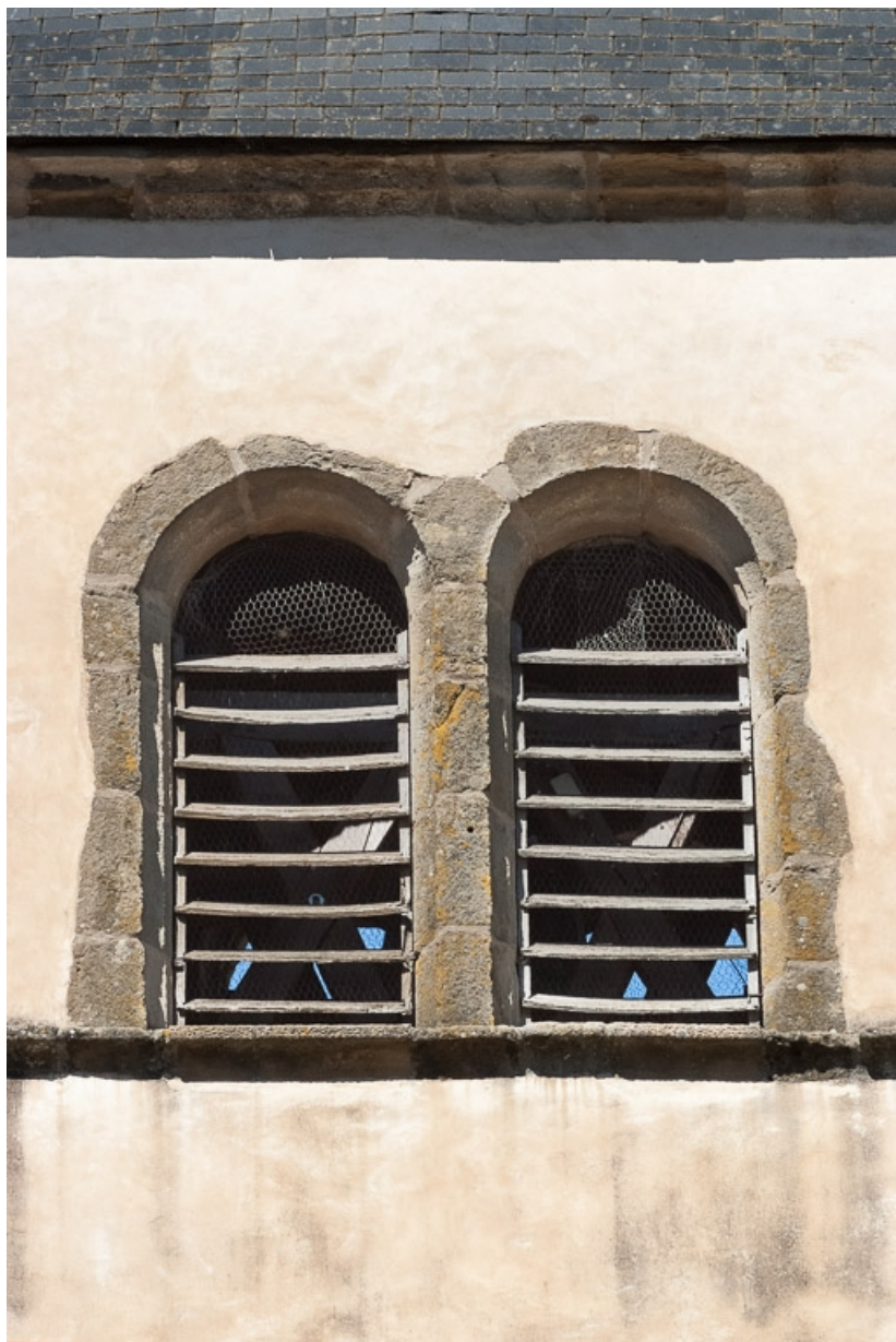
Clocher, détail de deux baies jumelées.

71, Dezize-lès-Maranges place Etienne-Saveron