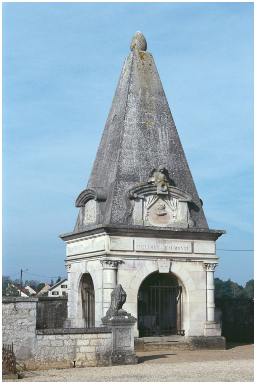
Vue d'ensemble du mausolée Pailloux-Haumonté, façade antérieure.