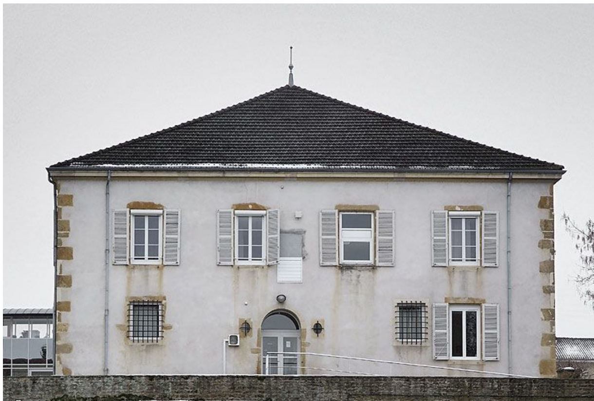
Bâtiment donnant sur la rue de la Gare : élévation latérale du corps gauche.