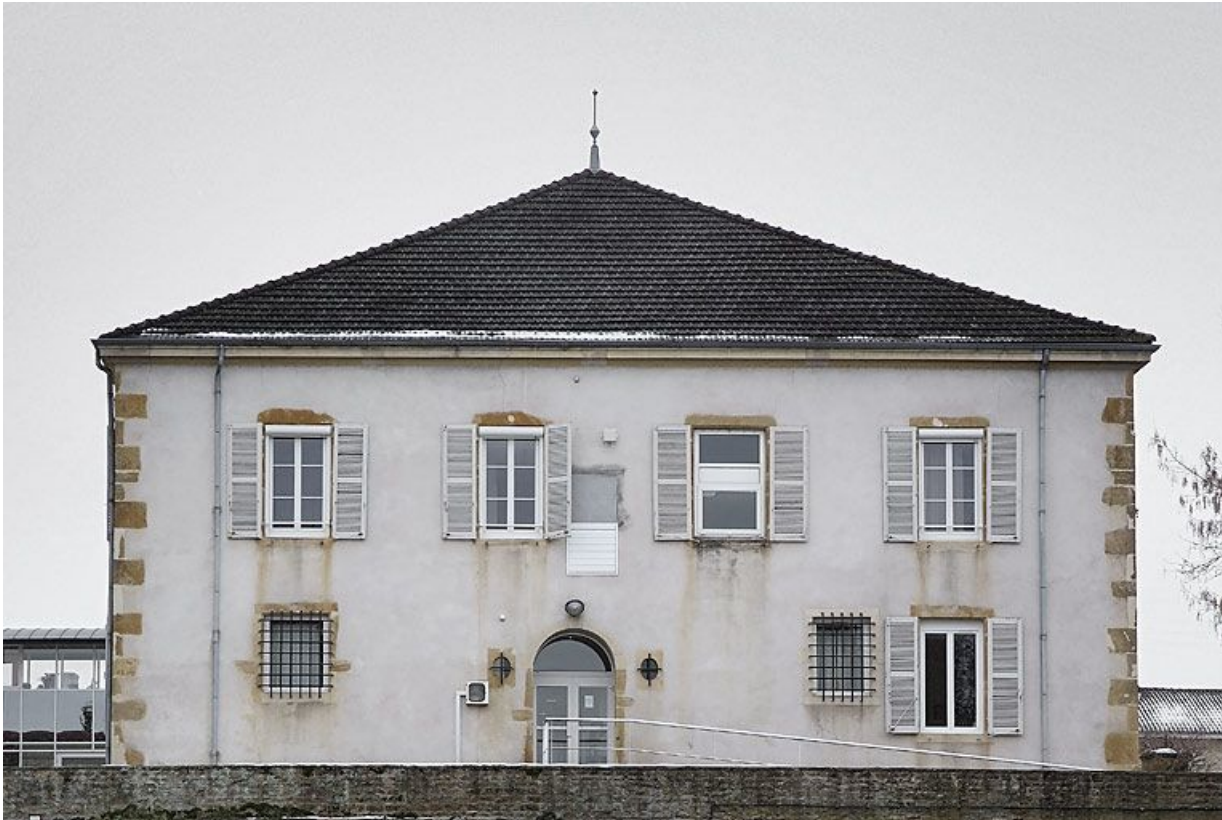
Bâtiment donnant sur la rue de la Gare : élévation latérale du corps gauche.