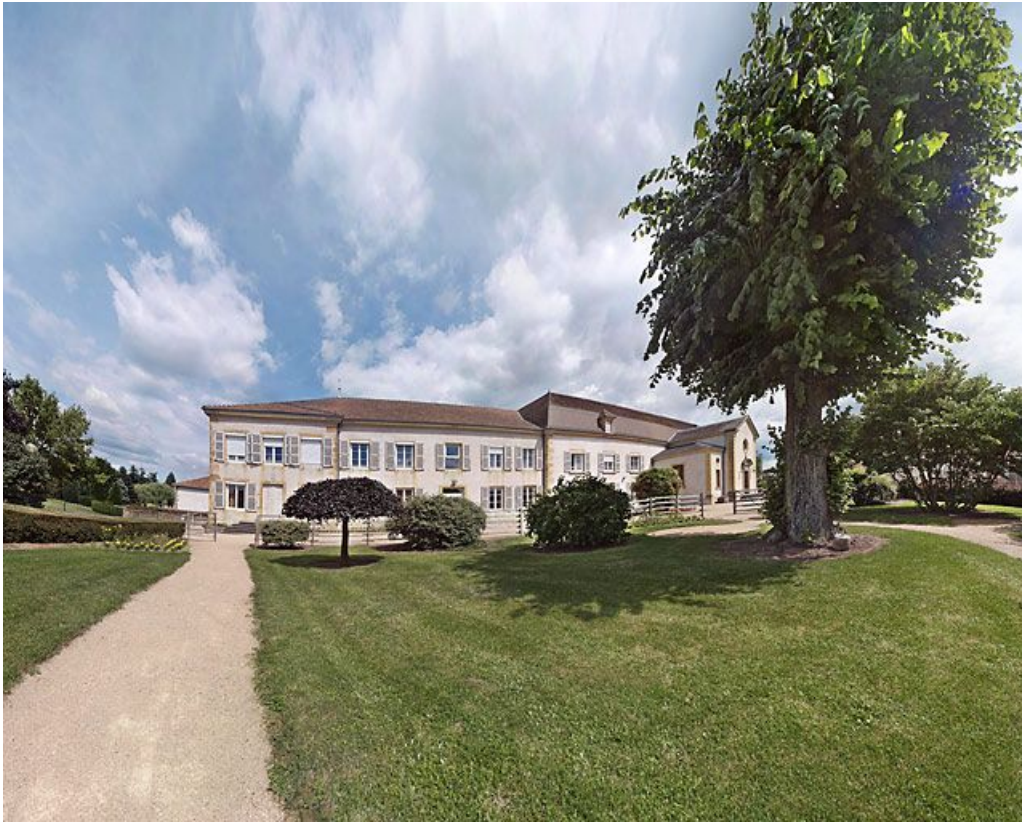
Bâtiment donnant rue de la Gare.