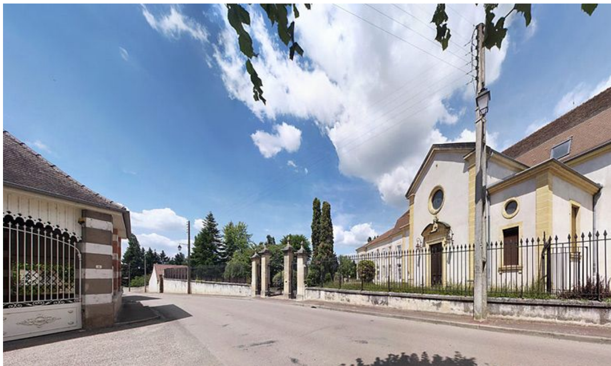
Façade du bâtiment donnant rue de la Gare.