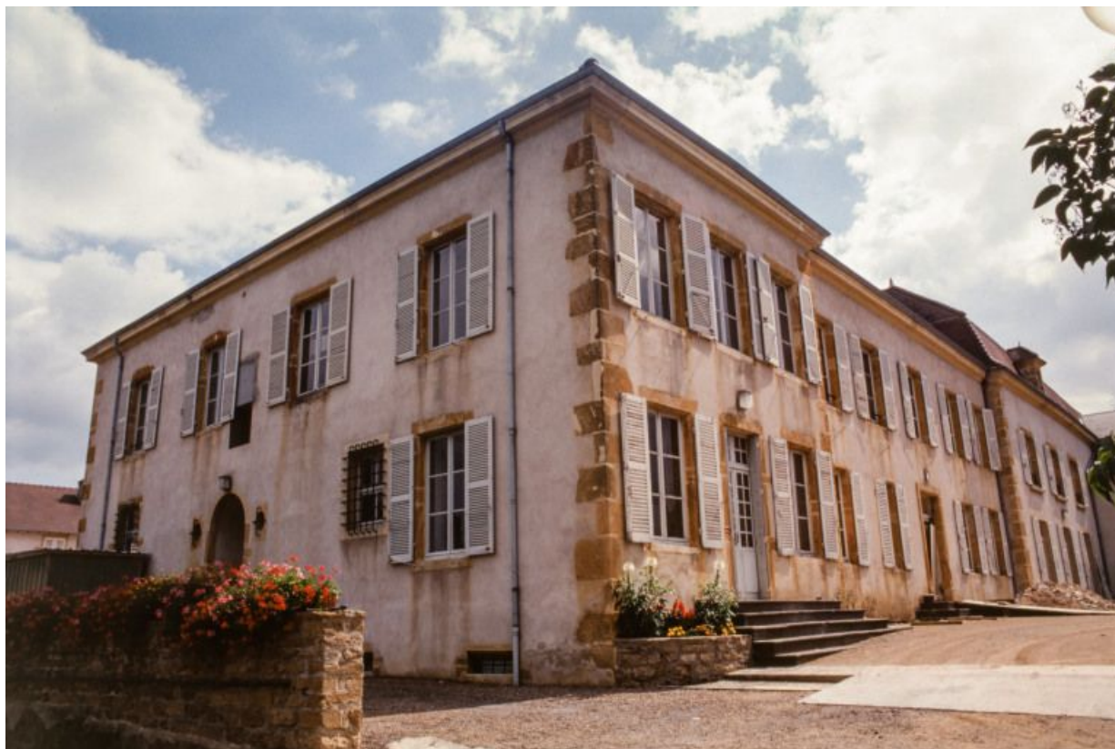
Façade antérieure et élévation gauche.