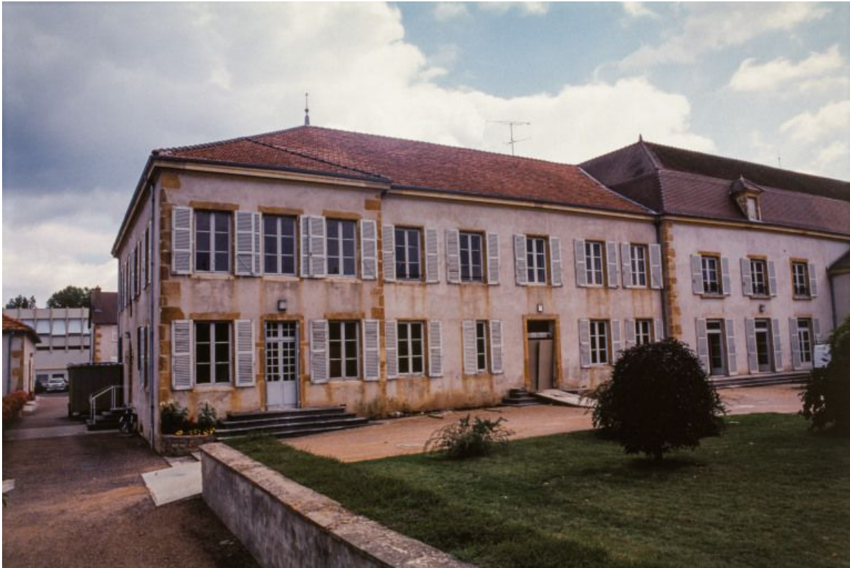
Façade antérieure, partie gauche.