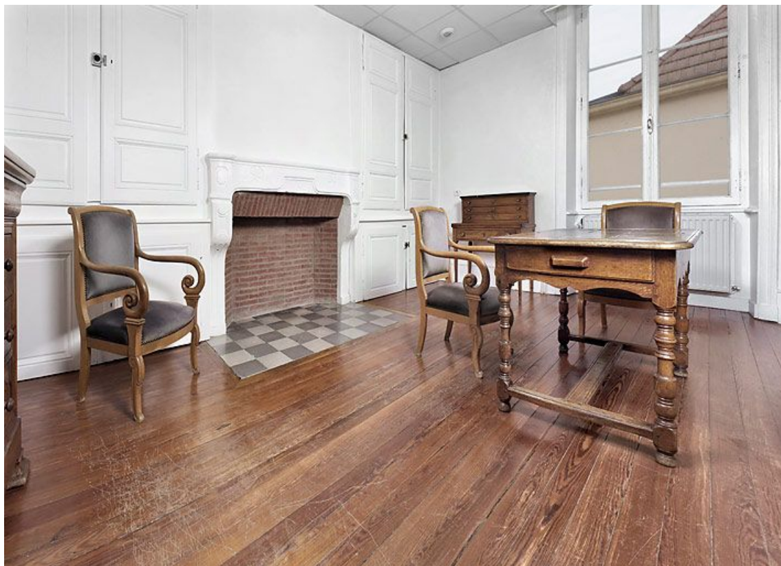
Bâtiment donnant rue de la Gare : bureau à l'étage.