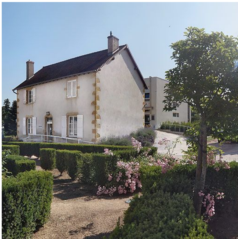
Petit bâtiment de dépendance situé à l'est de la cour intérieure, derrière l'hôpital moderne.