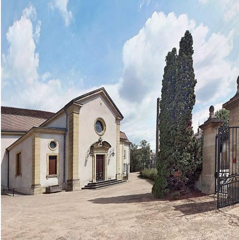
Bâtiment donnant rue de la Gare, façade de la chapelle.