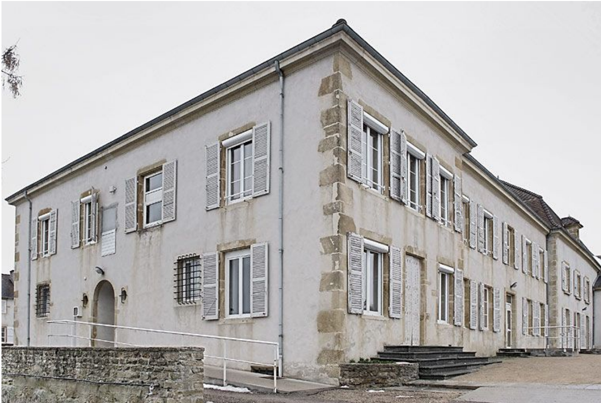
Bâtiment donnant sur la rue de la Gare, corps gauche.