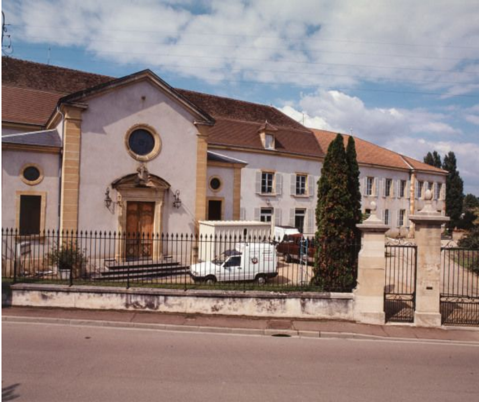
Façade antérieure et chapelle.