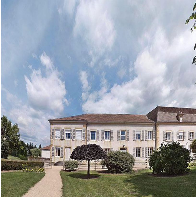
Bâtiment donnant rue de la Gare, corps gauche.