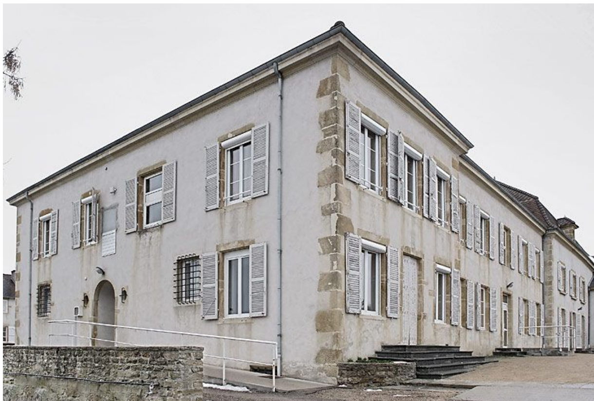
Bâtiment donnant sur la rue de la Gare, corps gauche.