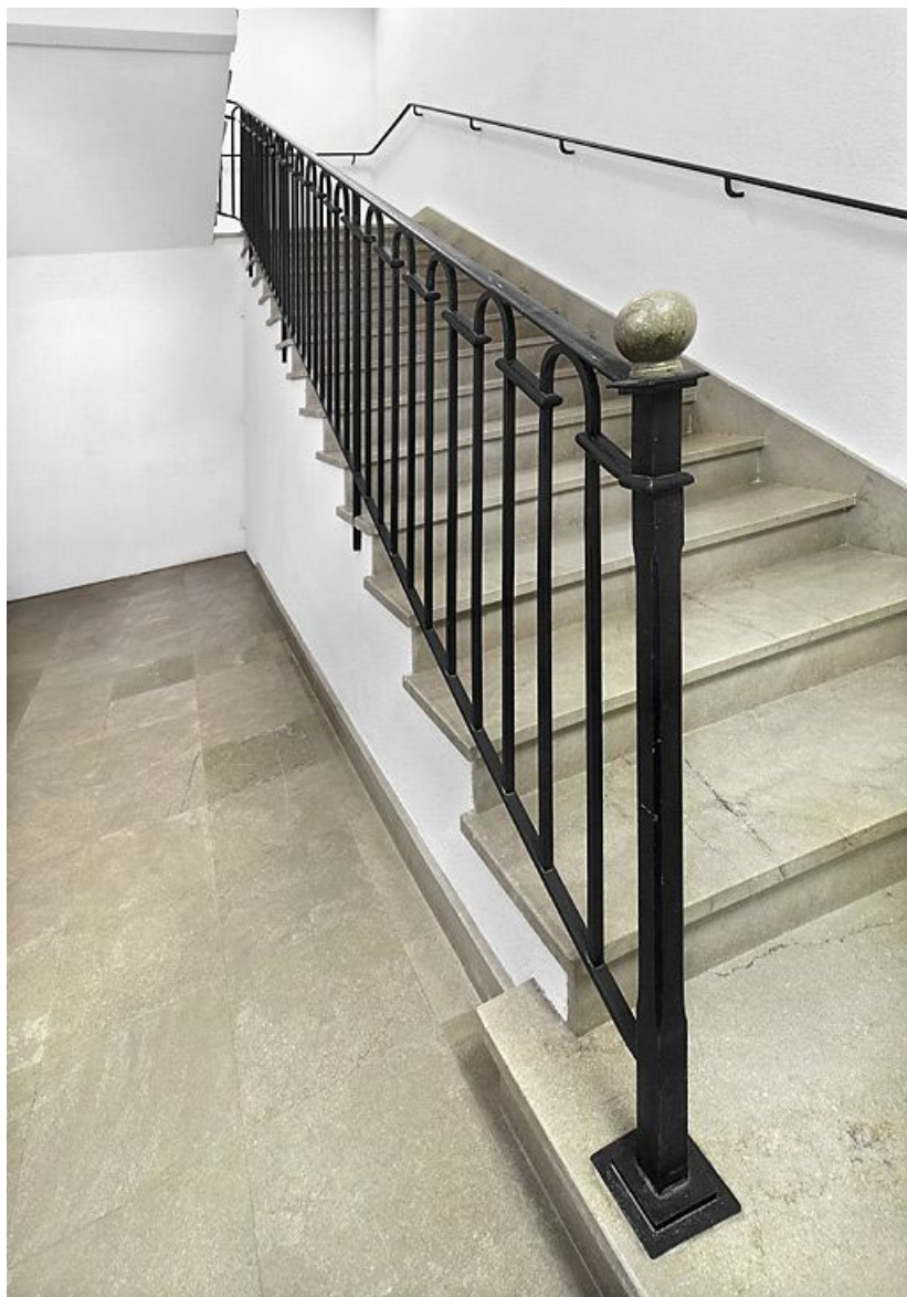
Bâtiment donnant rue de la Gare : escalier.