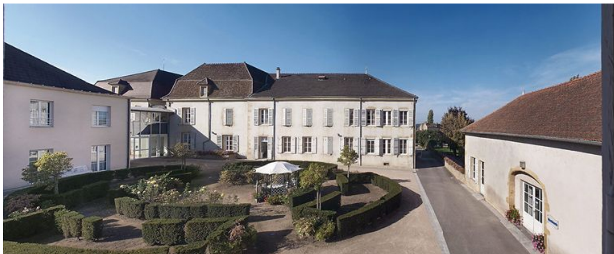
Bâtiment donnant rue de la Gare, façade postérieure du corps gauche.