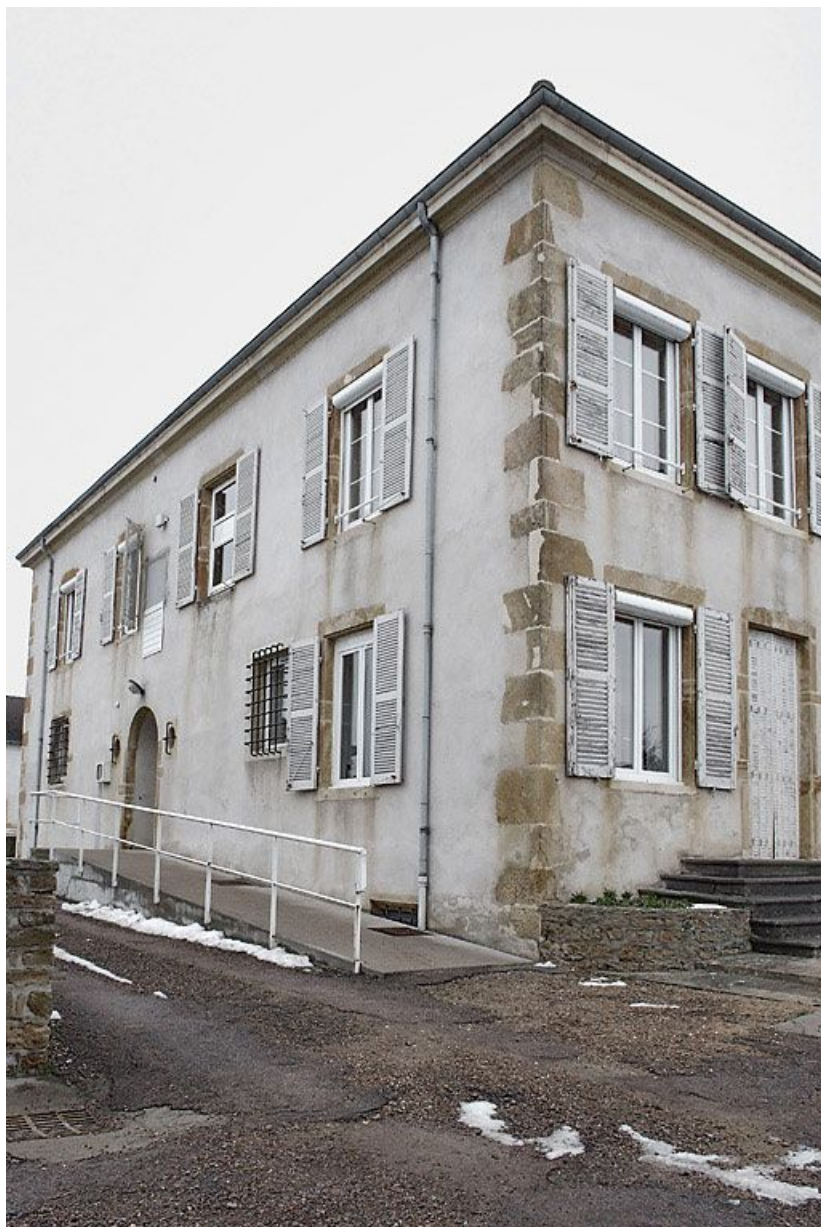
Bâtiment donnant sur la rue de la Gare : élévation latérale du corps gauche vue de trois-quarts. 71, Marcigny, 1 place Irène-Popart