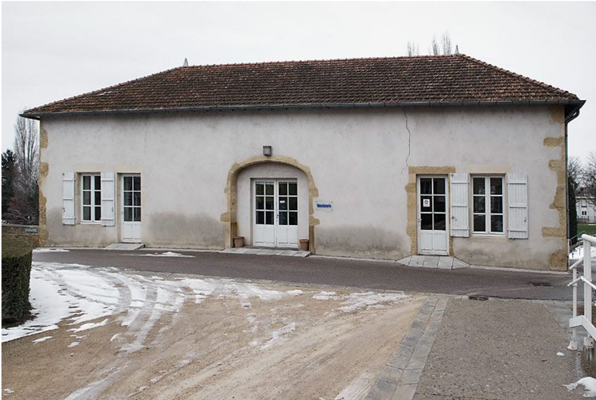
Ancien bâtiment de dépendance situé au sud de la cour intérieure.