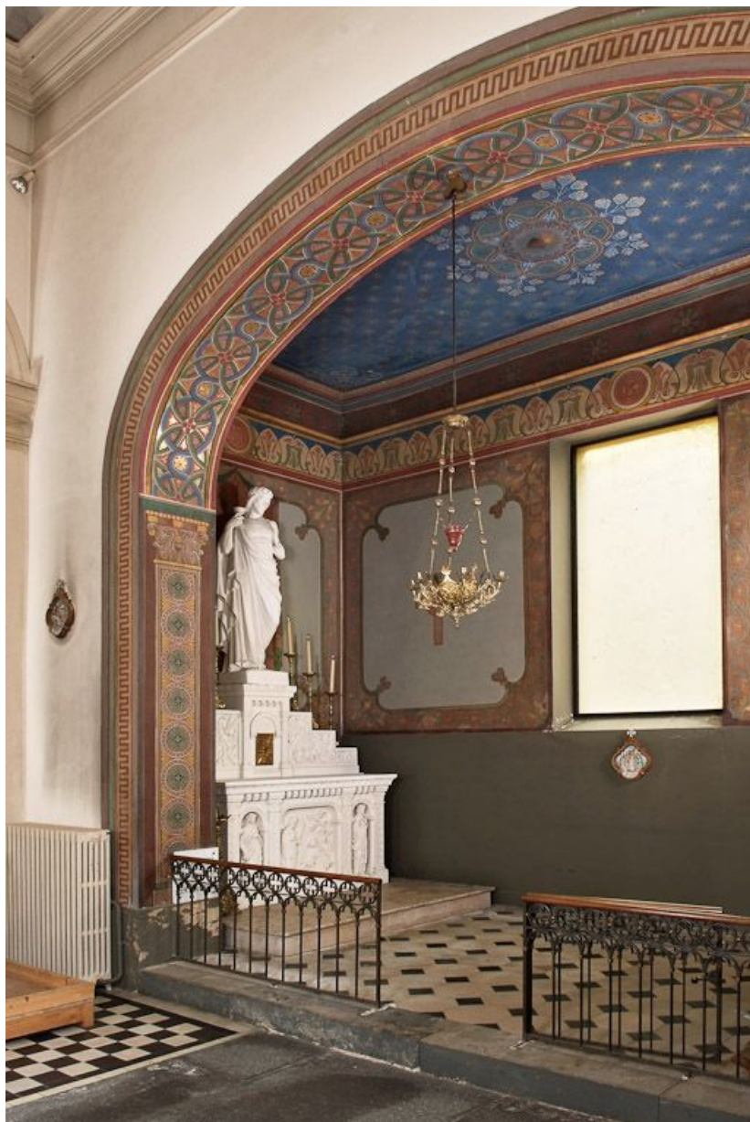
Chapelle, vue de la chapelle latérale droite.