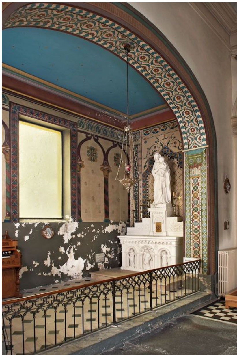
Chapelle, vue de la chapelle latérale gauche. 71, Marcigny, 1 place Irène-Popart