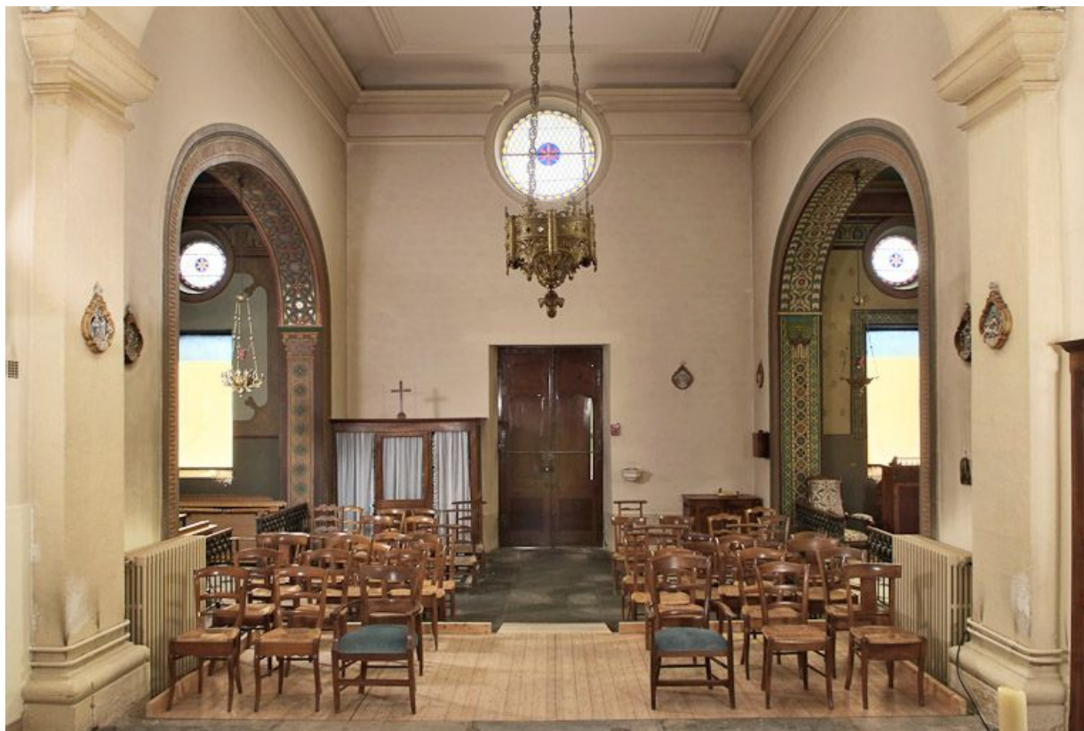
Chapelle, vue de la nef.