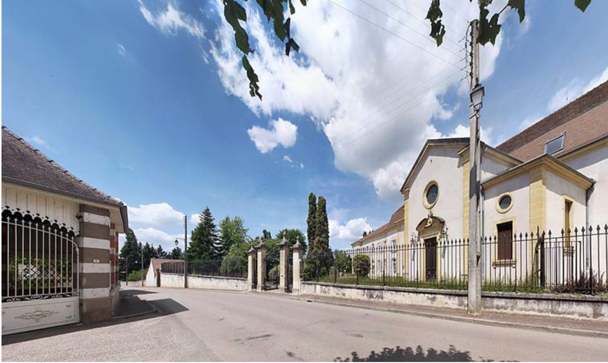
Façade du bâtiment donnant rue de la Gare.