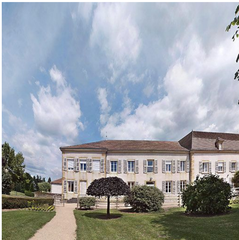
Bâtiment donnant rue de la Gare, corps gauche.