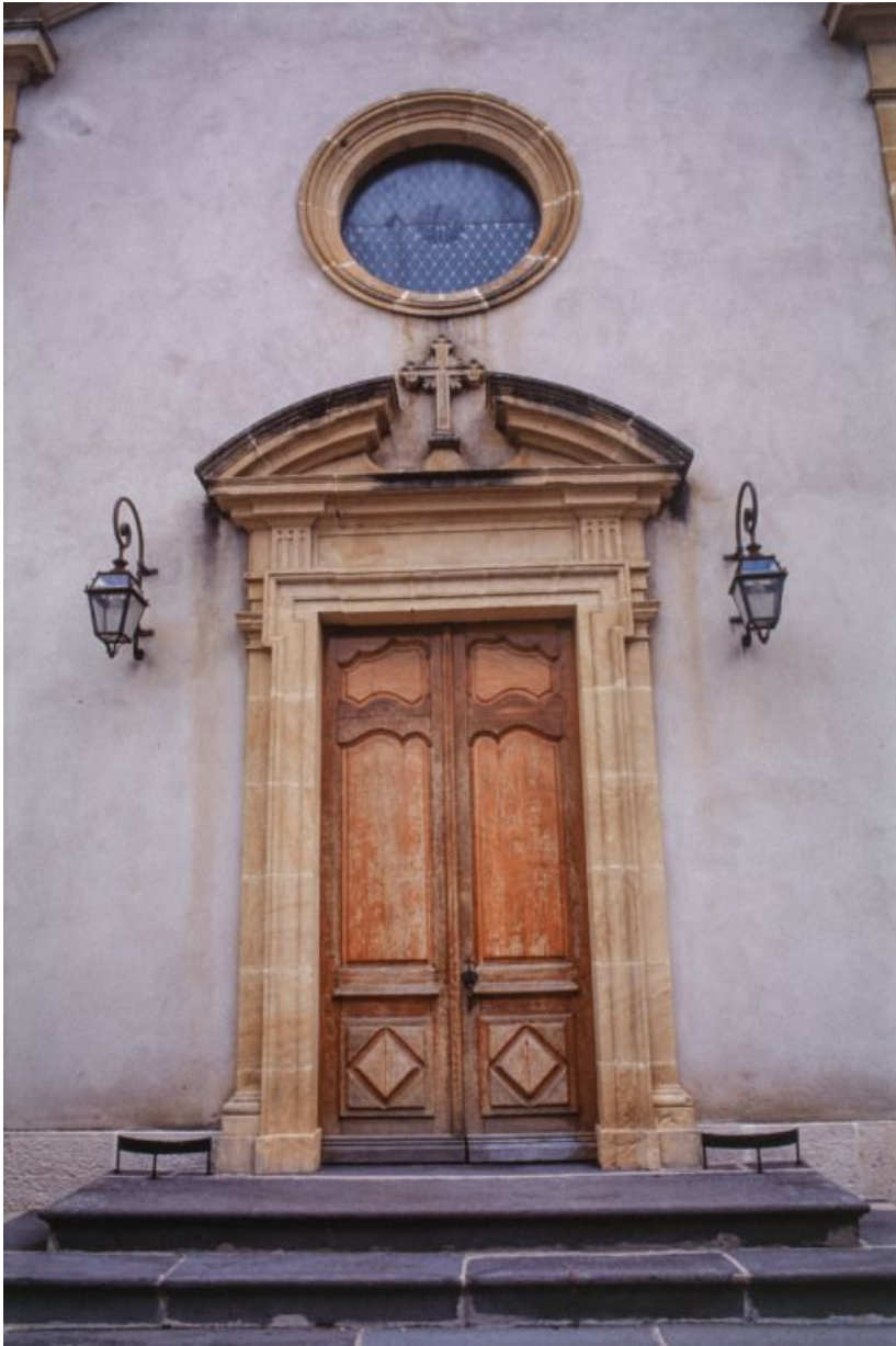
Portail de la chapelle.