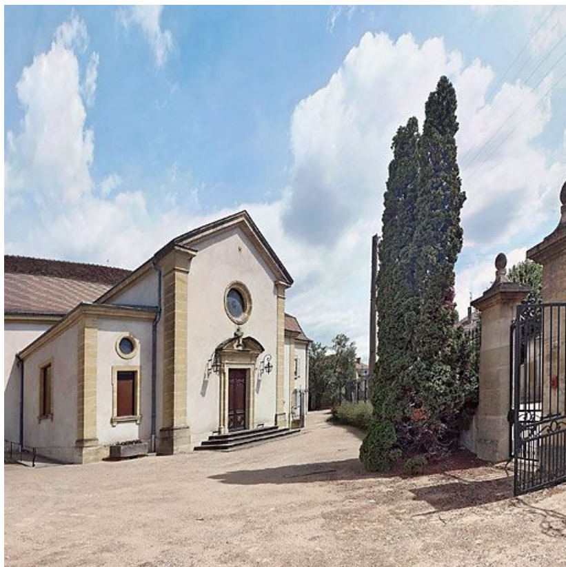
Bâtiment donnant rue de la Gare, façade de la chapelle.