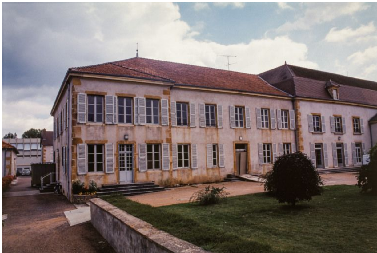
Façade antérieure, partie gauche.