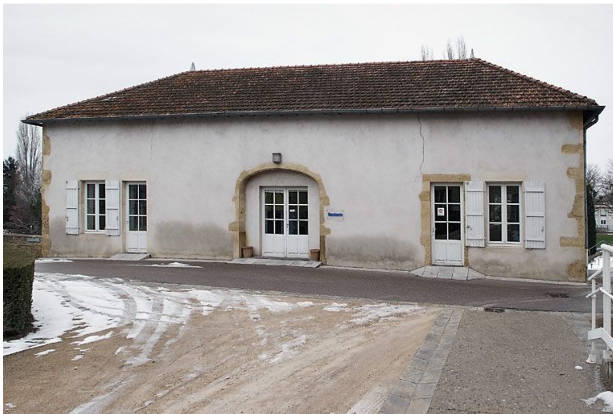
Ancien bâtiment de dépendance situé au sud de la cour intérieure.