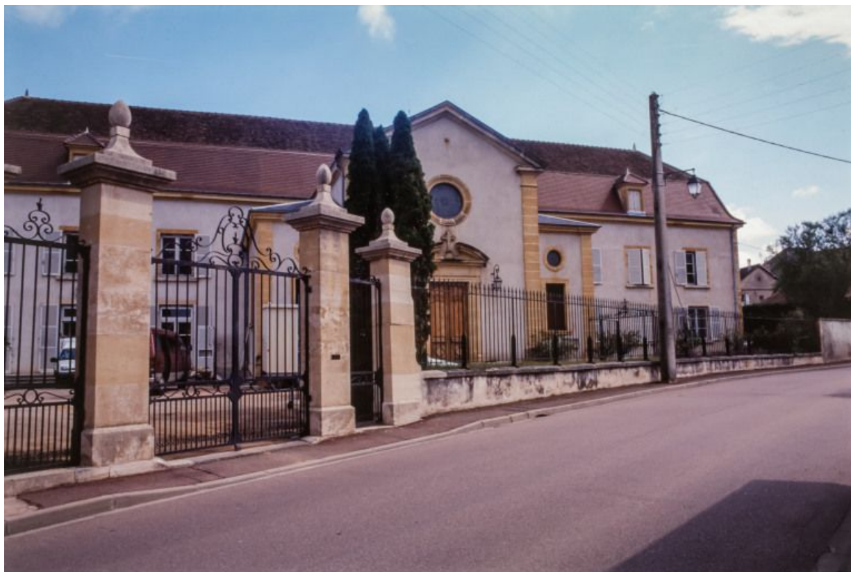
Façade antérieure, partie droite.