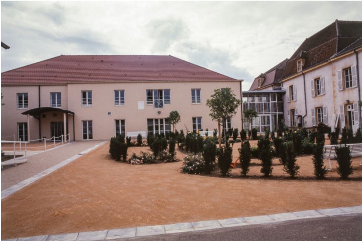
Bâtiment du XXe siècle.