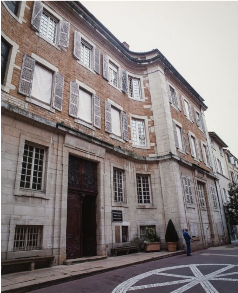
Façade sur rue.