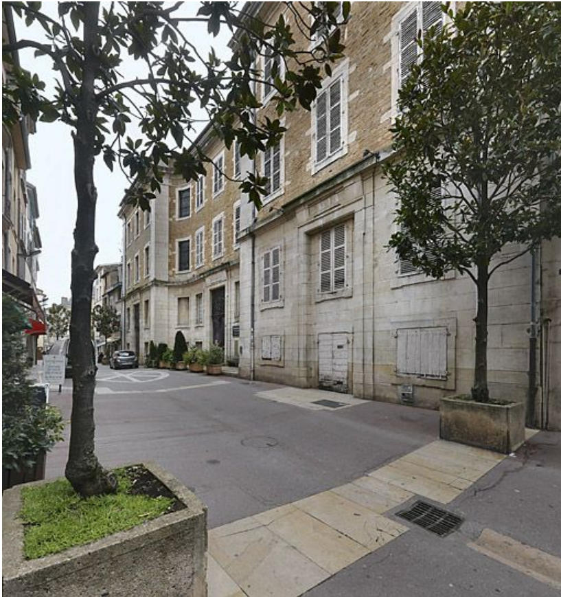
Vue de la façade principale rue Carnot.