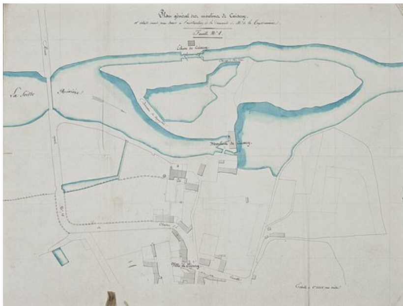
"Plan des moulins de Cuisery et détails divers devant servir à l'instruction de la demande M. de la Teyssonnière, feuille n°1". Sans doute vers 1842. (Archives VNF-direction territoriale Centre-Bourgogne ; subdivision de Montceau-les-Mines) 71, Cuisery