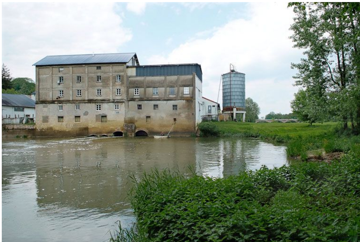
Le moulin vu d'aval.