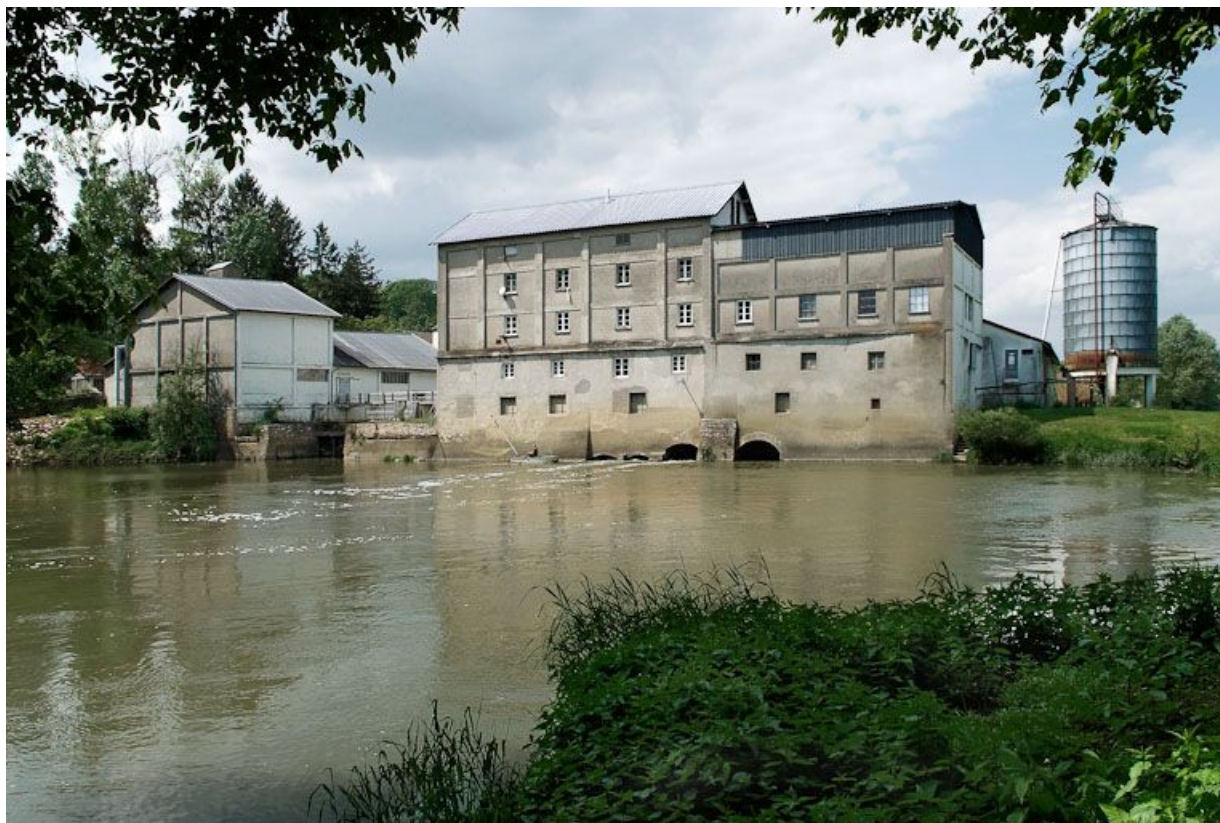
Le moulin : vue d'ensemble d'aval.