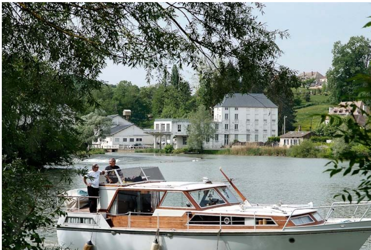
Les bâtiments modernes du moulin vus d'amont. Bateau de plaisance au premier plan. 71, Cuisery