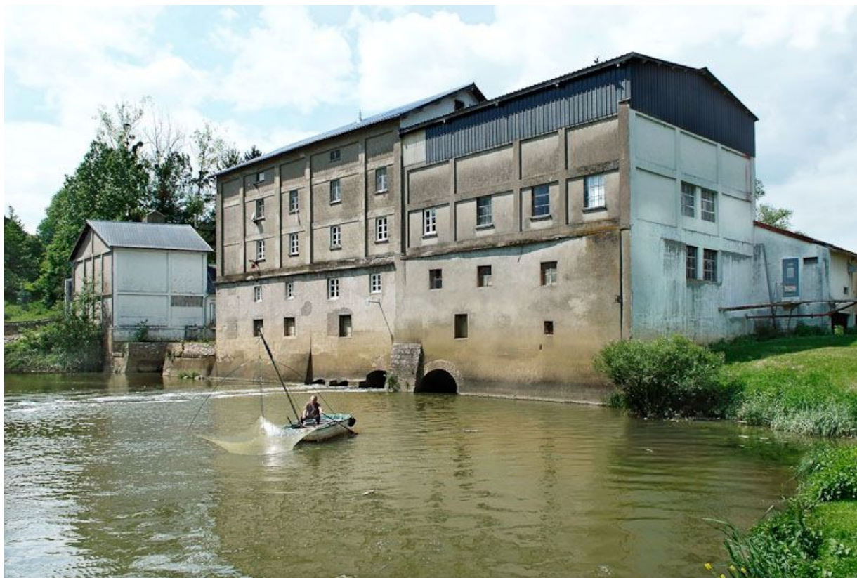
Moulin vu d'aval avec pêcheur au carrelet. 71, Cuisery