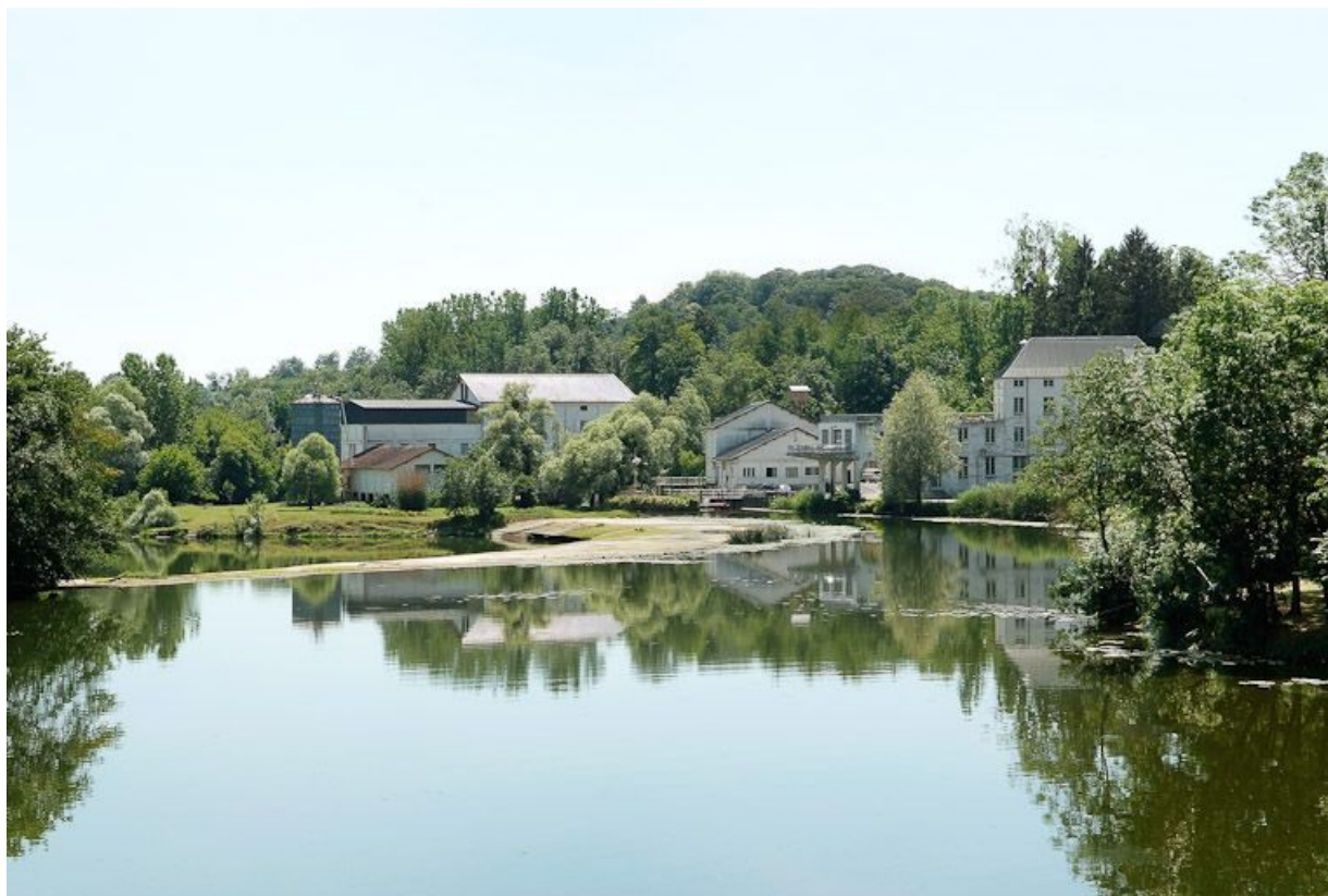
Le moulin vu d'amont. Le barrage en amont. 71, Cuisery