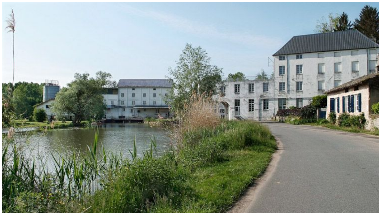
Le moulin vu d'amont depuis la route qui y mène.