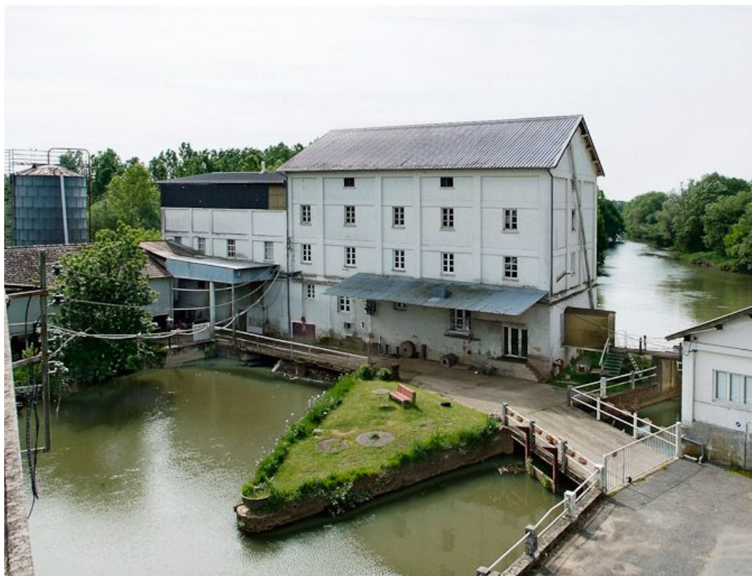
Moulin, bâtiment principal. La Seille de part et d'autre du moulin. 71, Cuisery