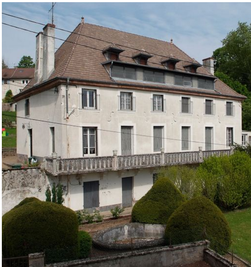
Moulin : habitation.