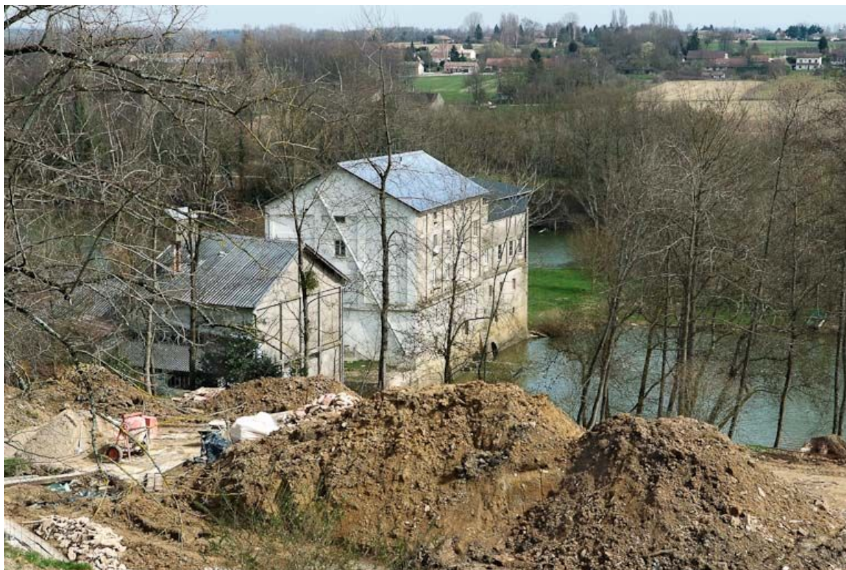
Le moulin vu du dessus.