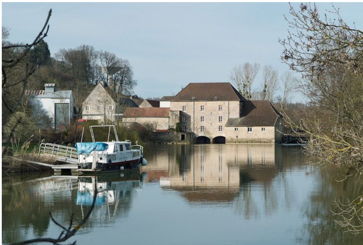
Moulin de Loisy, vu d'aval. Un appontement moderne à gauche au premier plan.