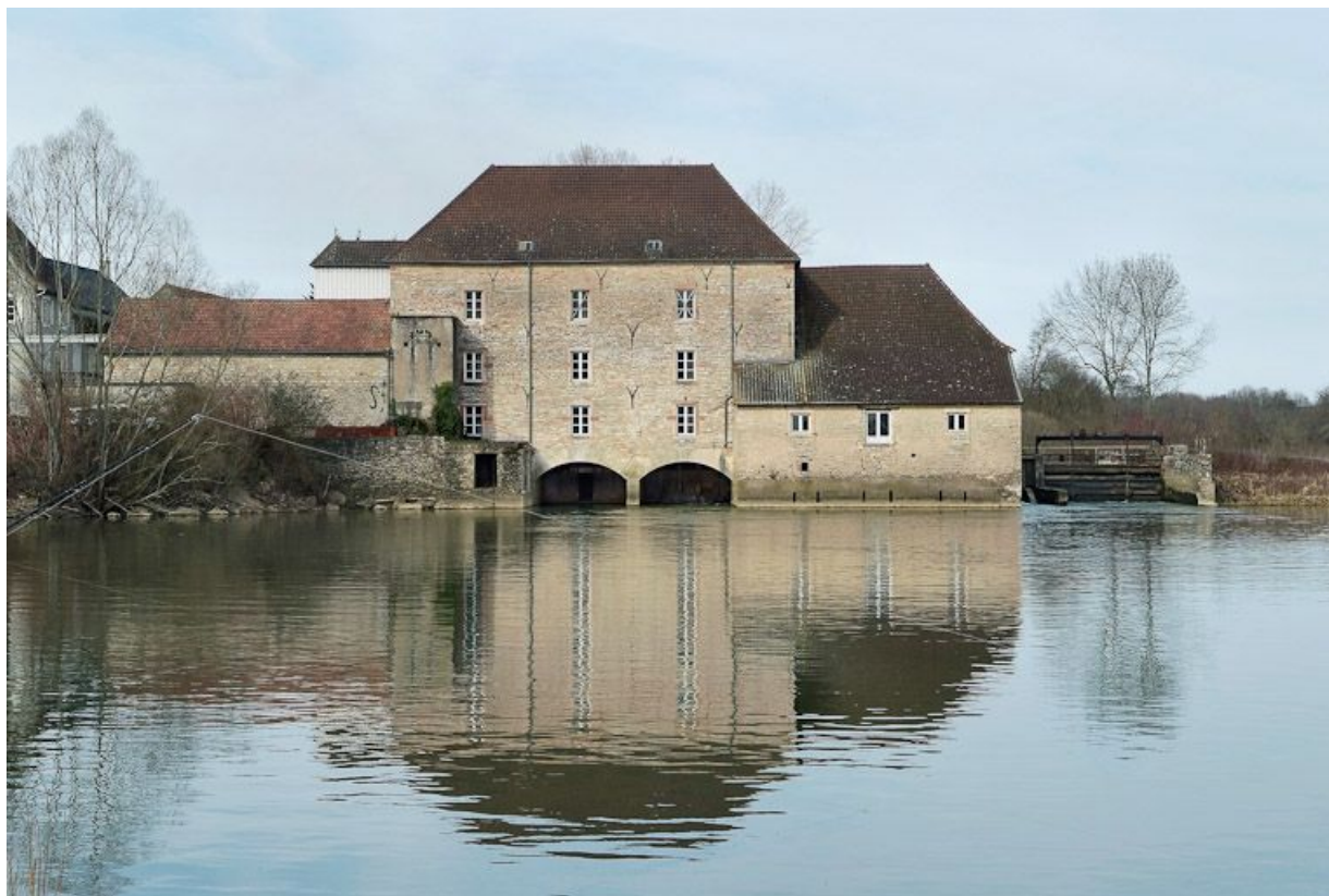
Moulin de Loisy, vu d'aval.