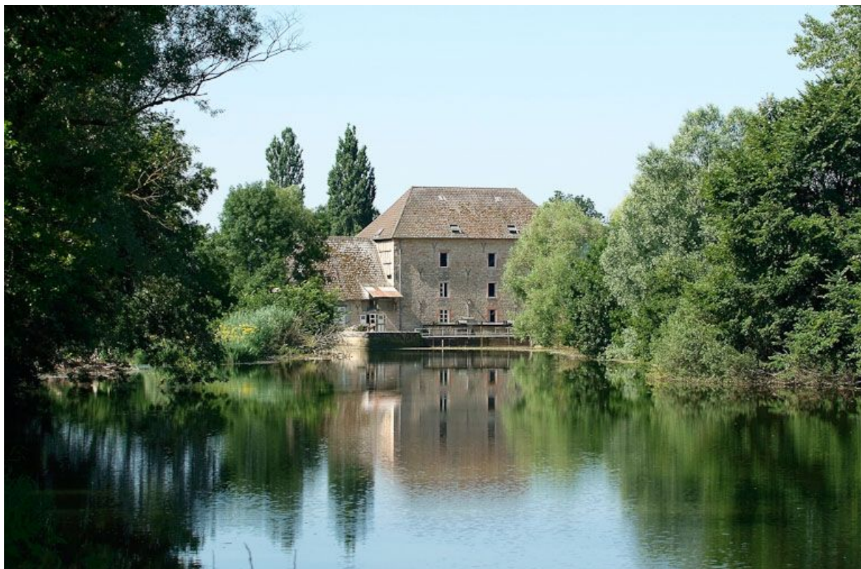
Moulin de Loisy, vu d'amont.