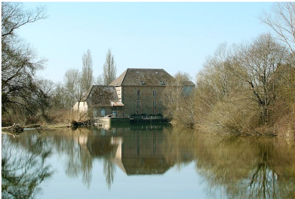
Moulin de Loisy, vu d'amont.