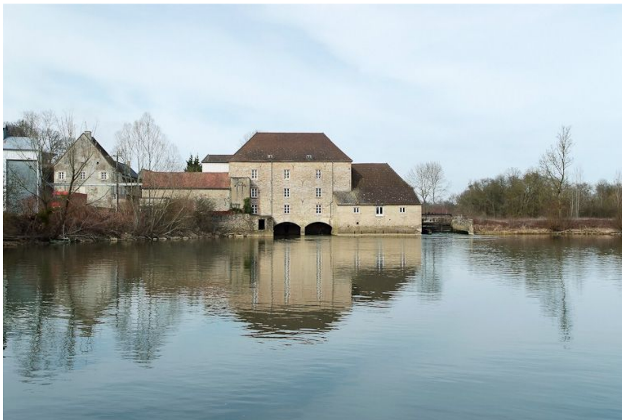
Moulin de Loisy, vu d'aval.