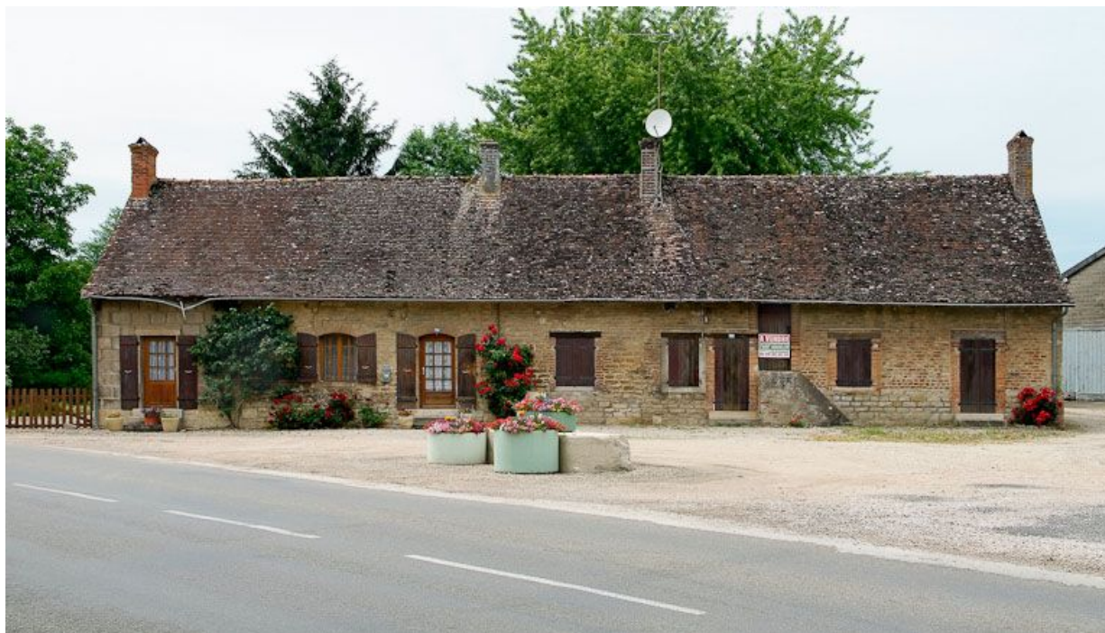
Logements ouvriers (?) à gauche du moulin principal, le long de la route.