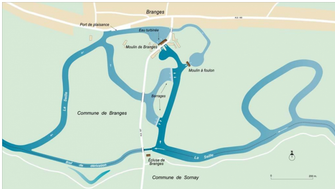
Plan schématique du site de l'écluse de Branges, des barrages et des moulins.