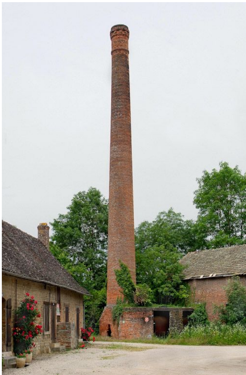
Cheminée entre les logements ouvriers et le moulin principal.