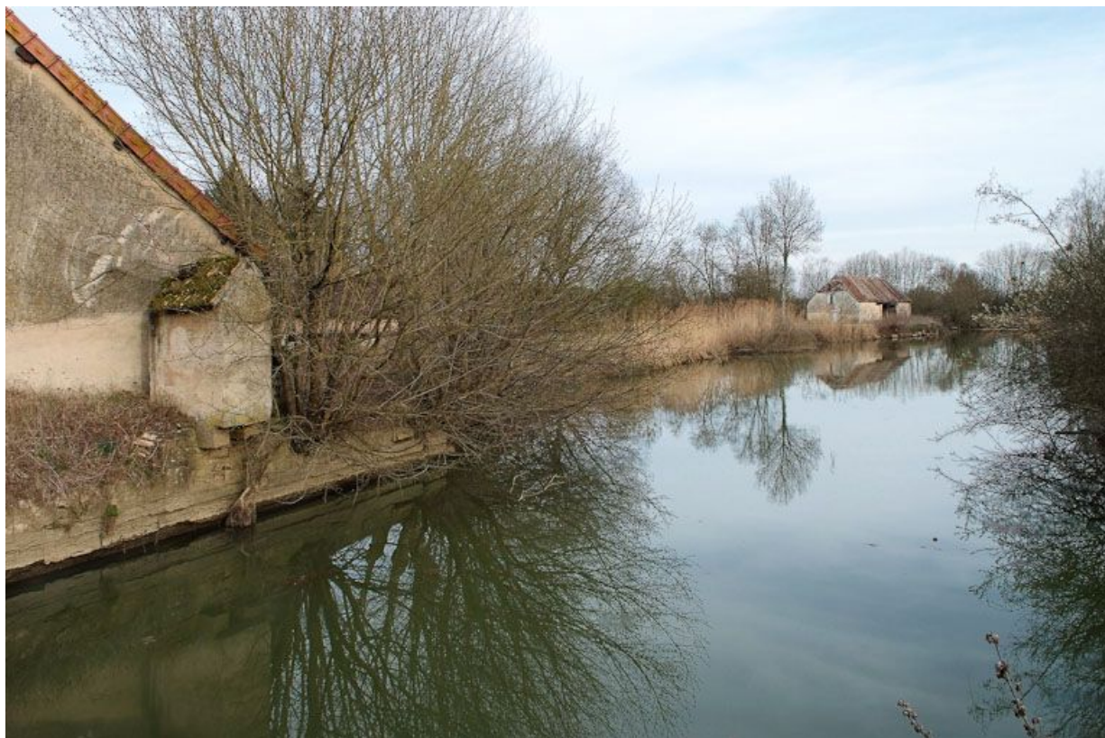
A gauche, latrines d'un bâtiment annexe au moulin principal. Au fond, le moulin à foulon. 71, Branges R. D. 167