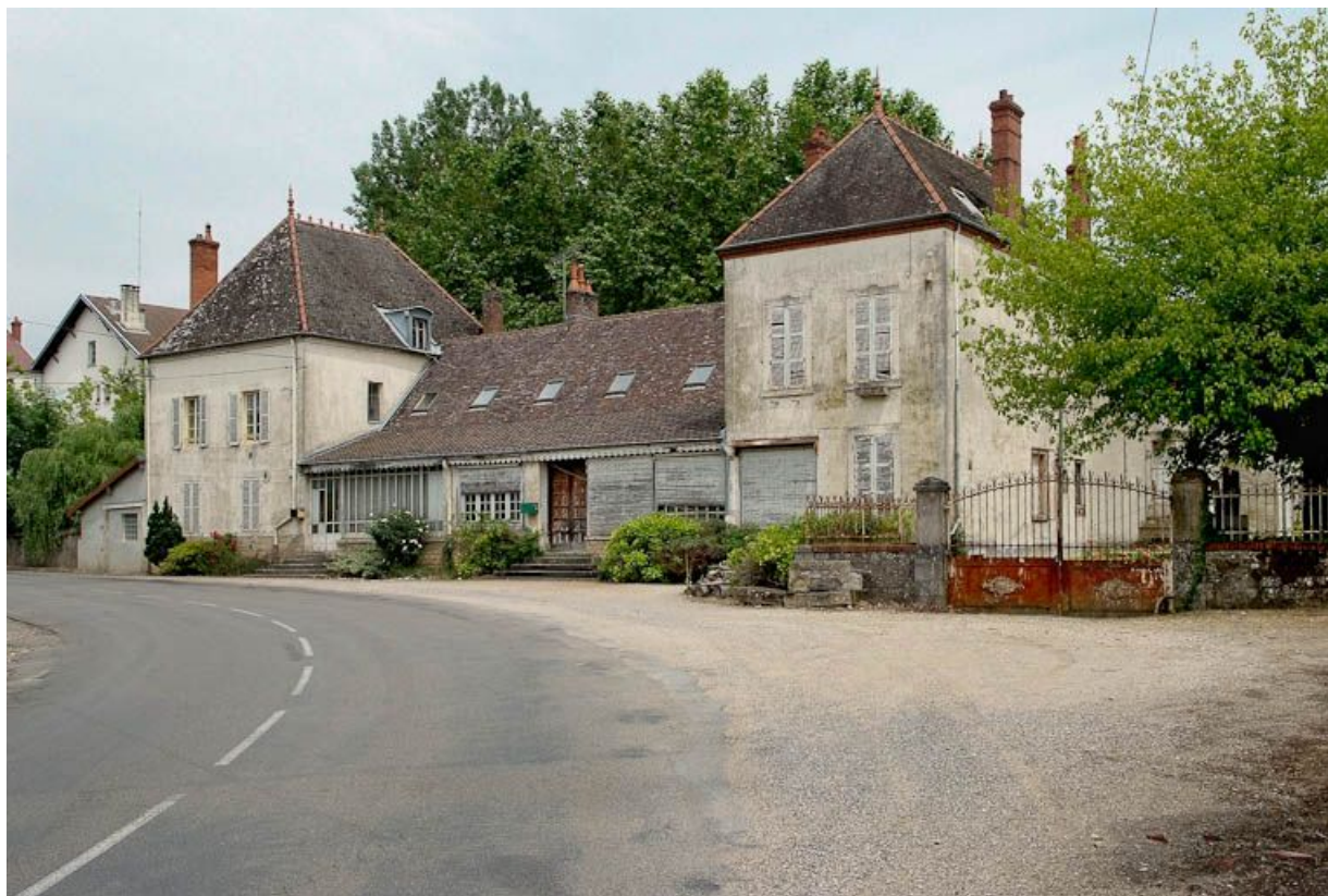
Bâtiment administratif ou logement patronal lié aux moulins.