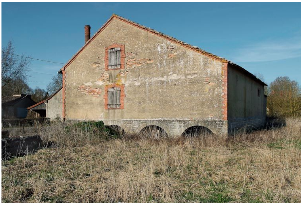
Bâtiment annexe au moulin principal, à usage d'entrepôt, construit sur arcades.