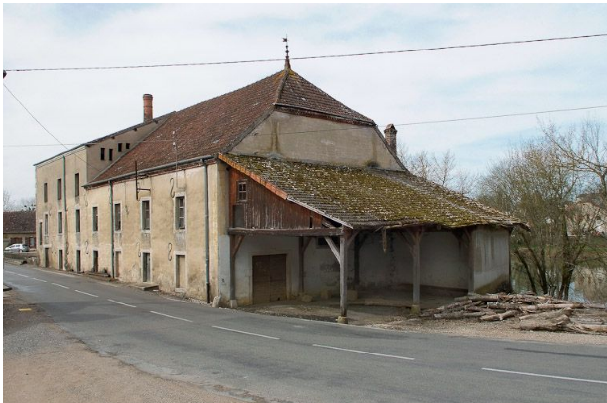
Bâtiment du moulin principal, vu de la route.