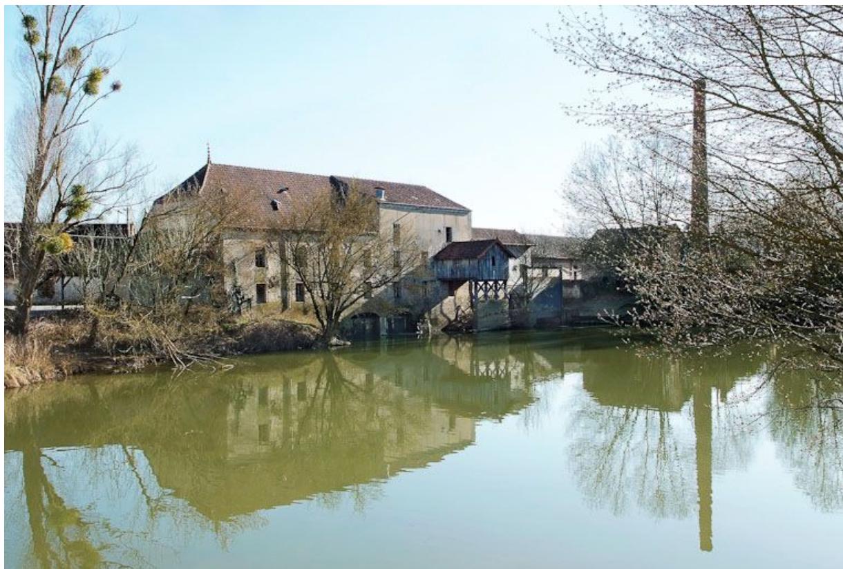
Vue d'ensemble des moulins de Branges, prise d'aval. la cheminée à droite. 71, Branges R. D. 167