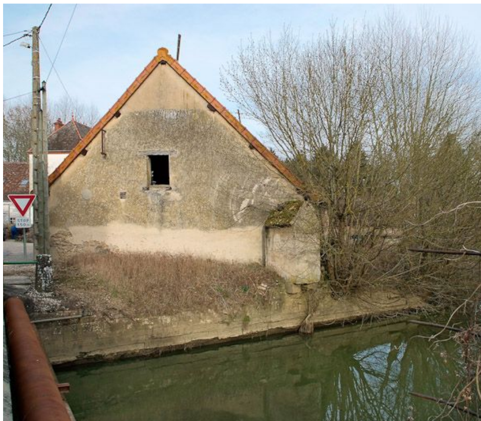
Bâtiment annexe au moulin principal, latrines au-dessus de la Seille. 71, Branges R. D. 167