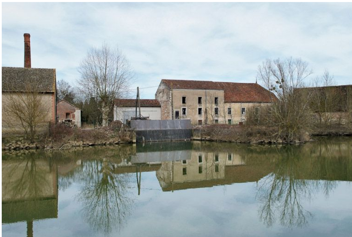
Vue d'ensemble des moulins de Branges, prise d'amont.