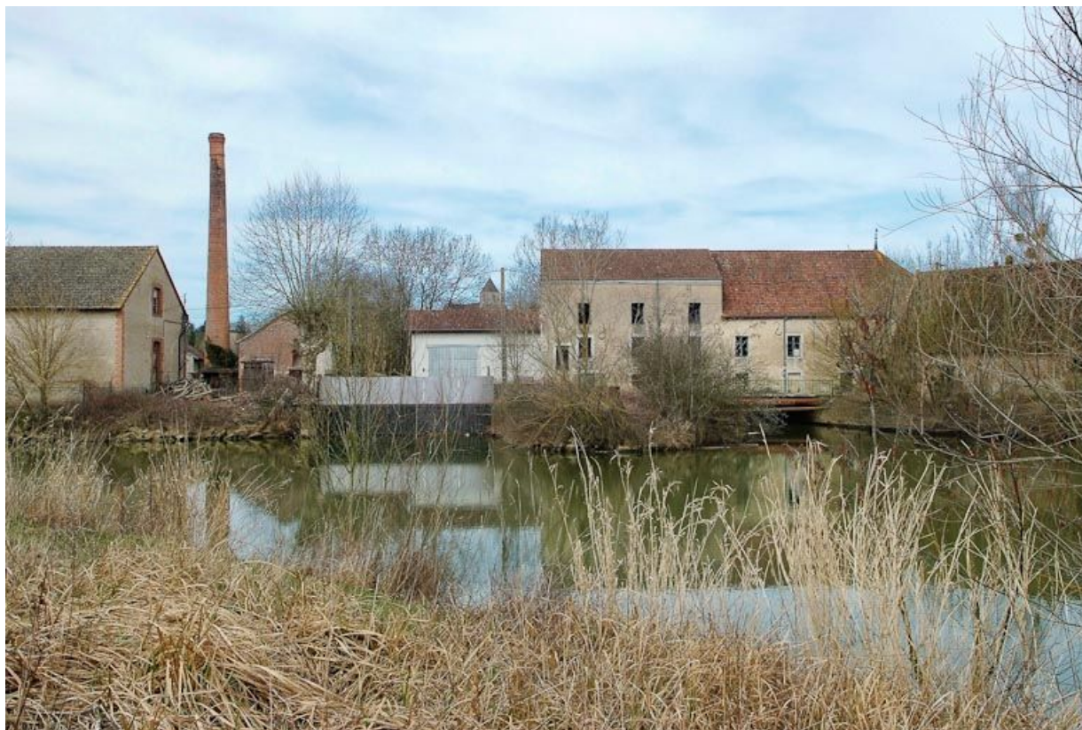
Vue d'ensemble des moulins de Branges, prise d'amont. Cheminée à gauche. 71, Branges R. D. 167