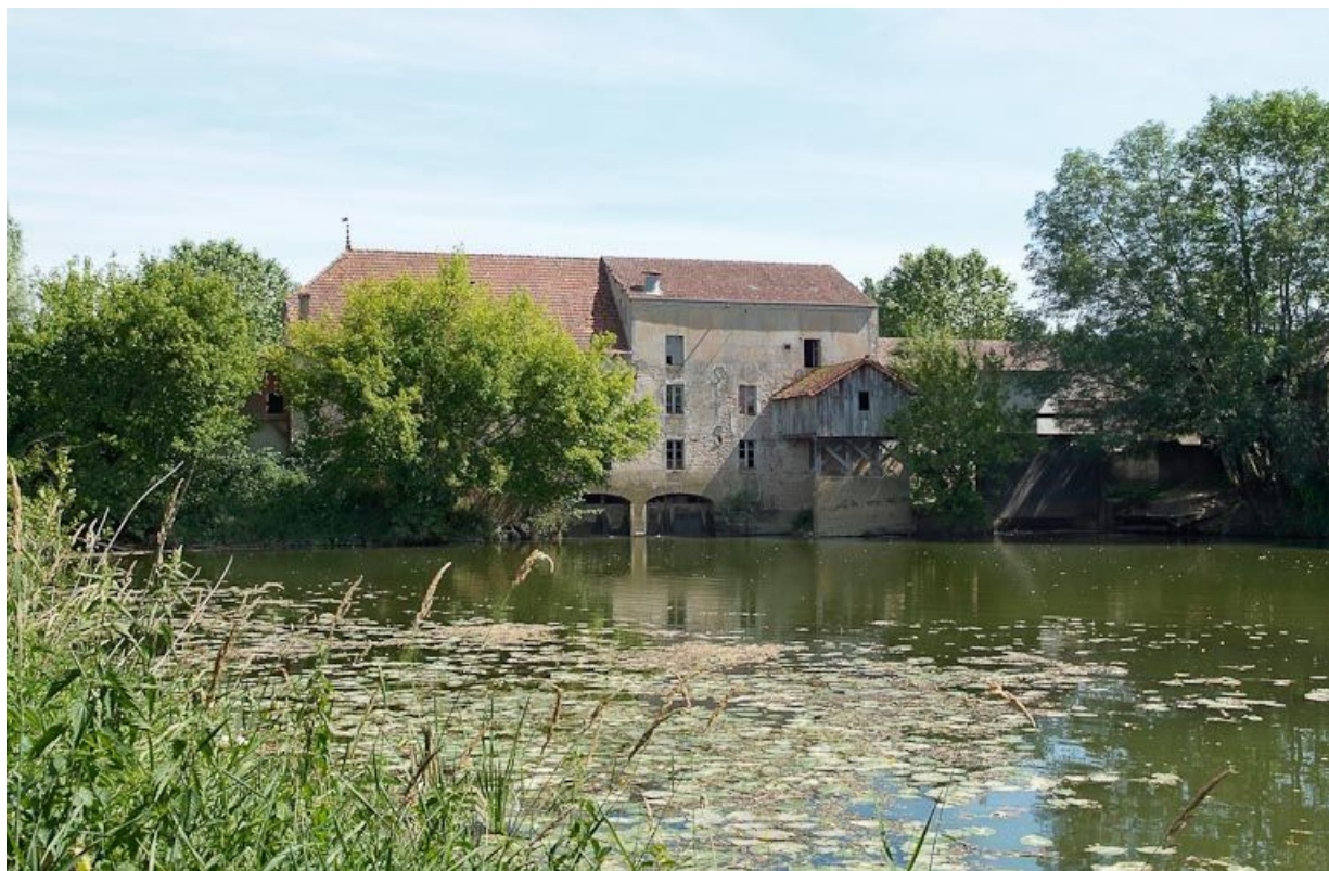
Vue d'ensemble des moulins de Branges, prise d'aval.