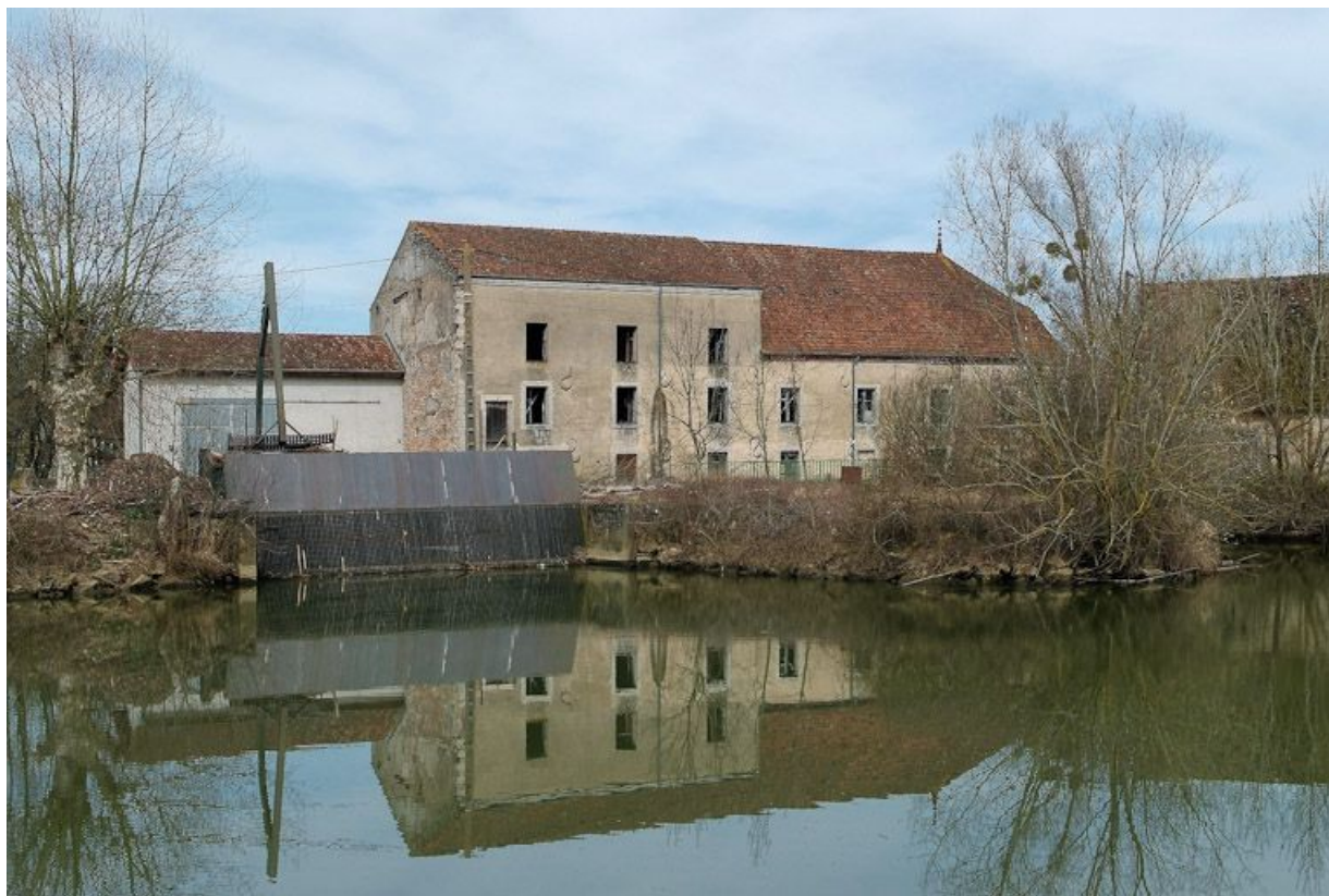
Vue d'ensemble des moulins de Branges, prise d'amont.