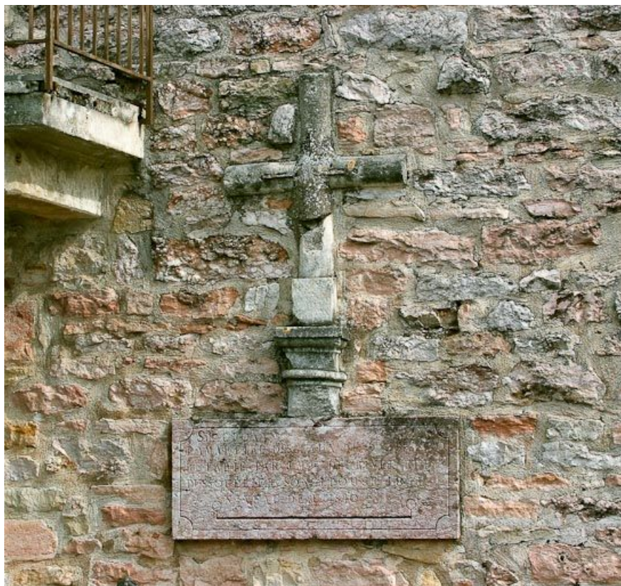
Maison située sur la rive droite de la Seille, sur le pignon : détail de la croix commémorative de la crue de la Seille de 1841. 71, Louhans