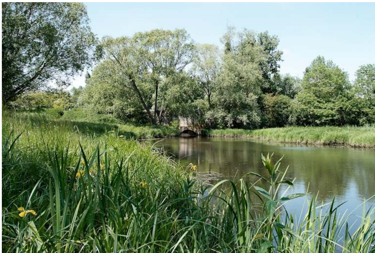
Paysage de la Seille avec pont sous la RD 971, Seille au premier plan. 71, Louhans