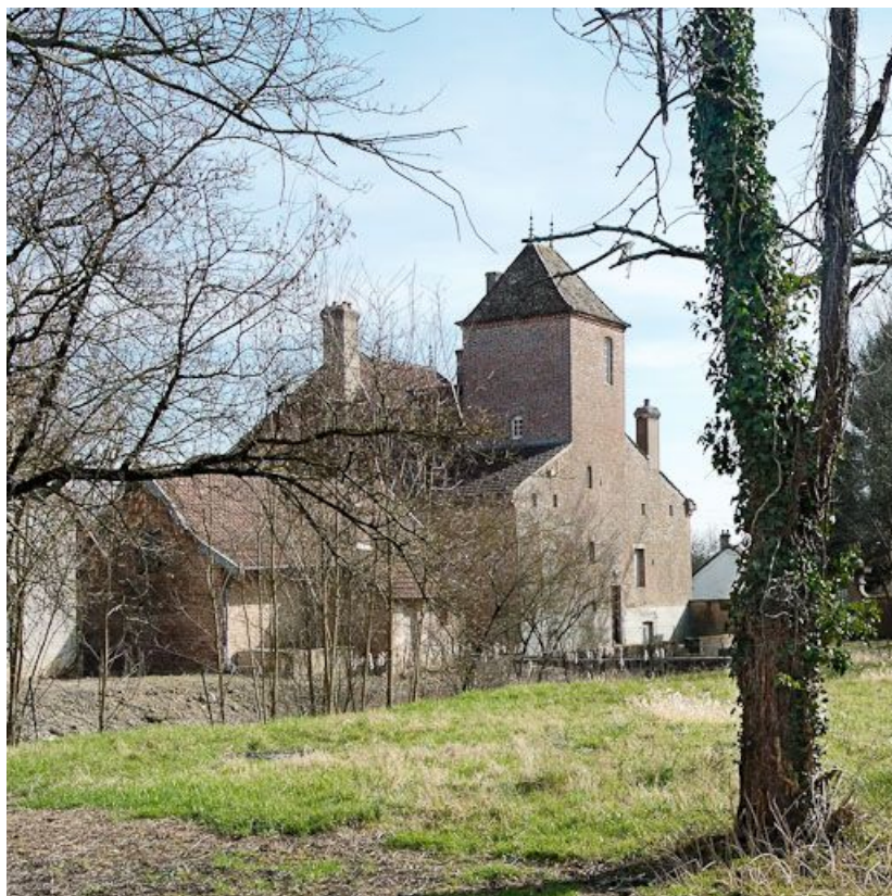
Demeure à la sortie du village, le long de la Seille.