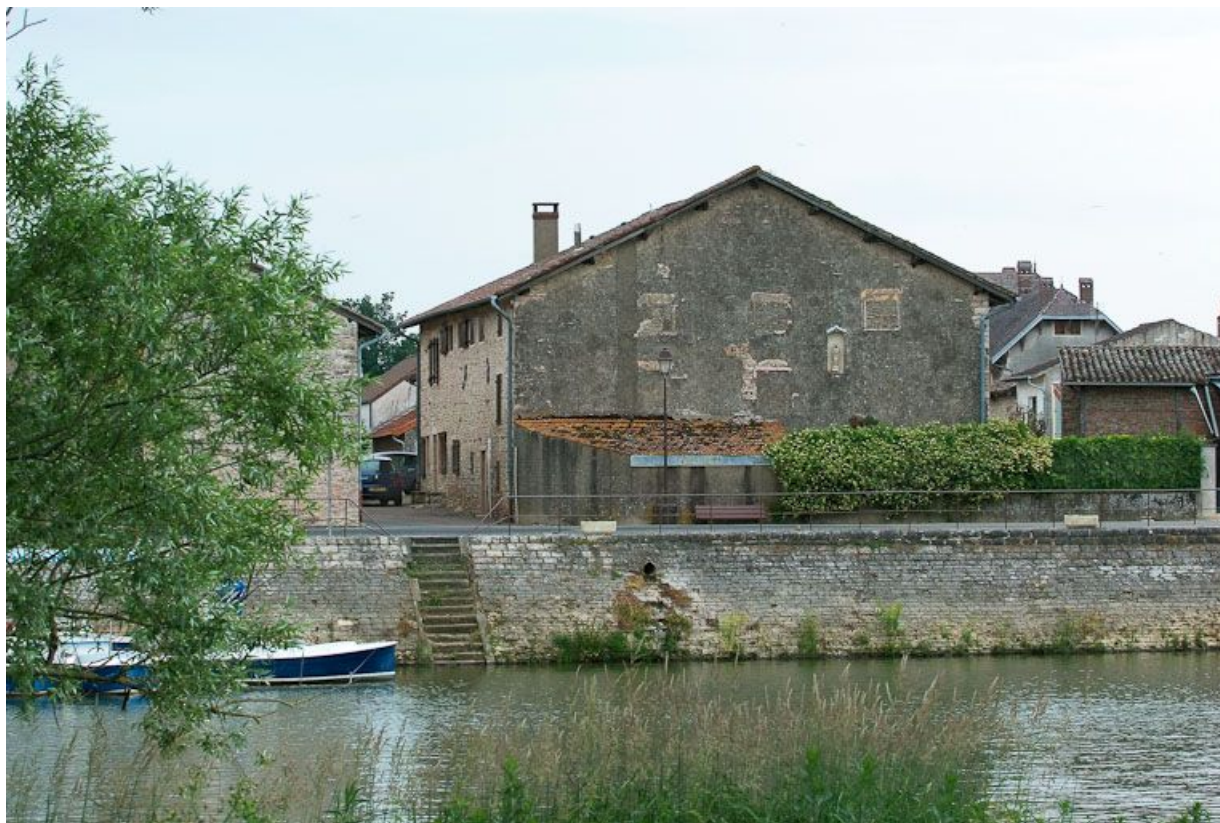
Vue d'ensemble d'une maison (pignon nord) avec Vierge à l'Enfant dans une niche, face aux quais de la Seille. La Seille au premier plan.