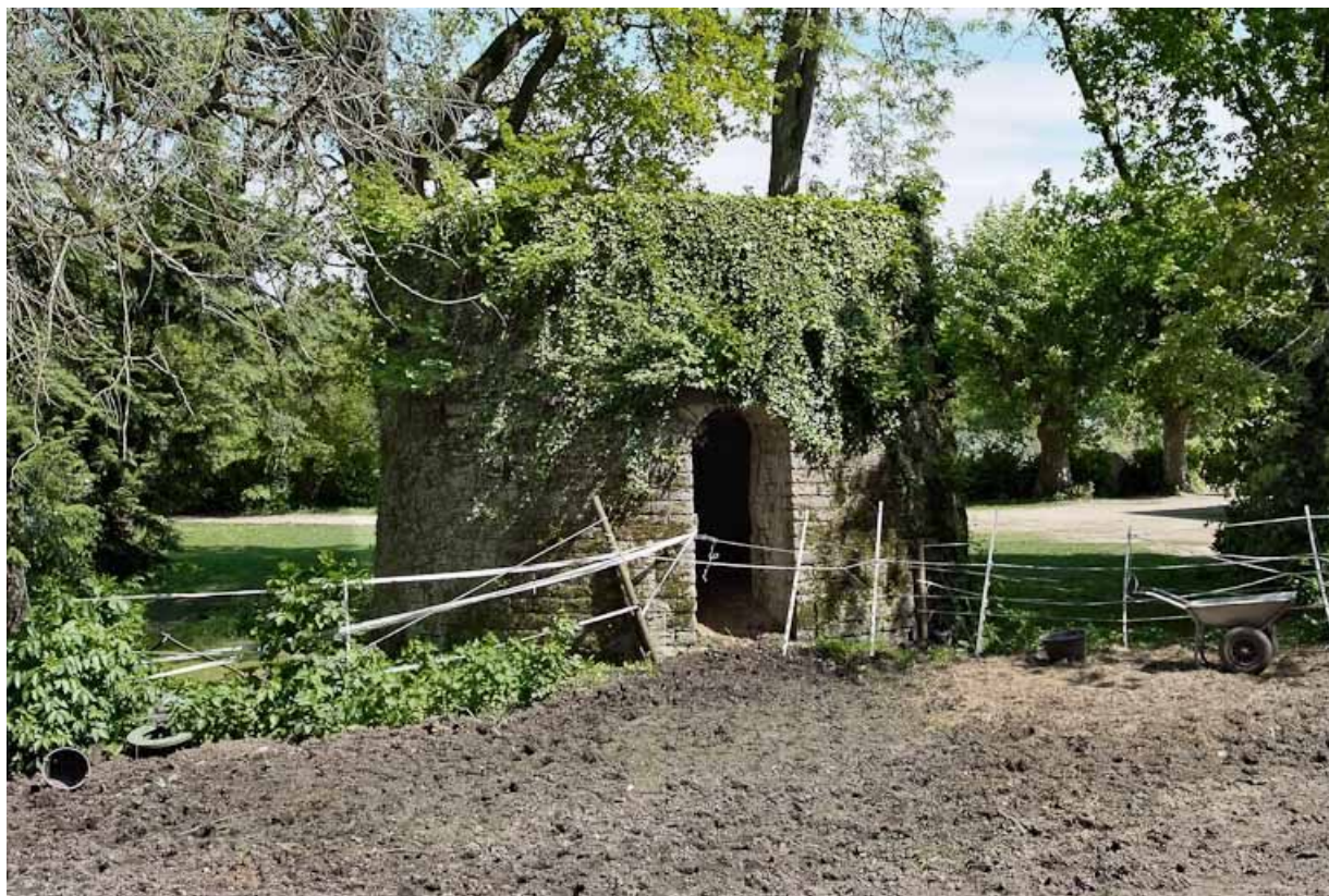
Tuilerie située avant du moulin : restes de la cheminée. 71, Louhans