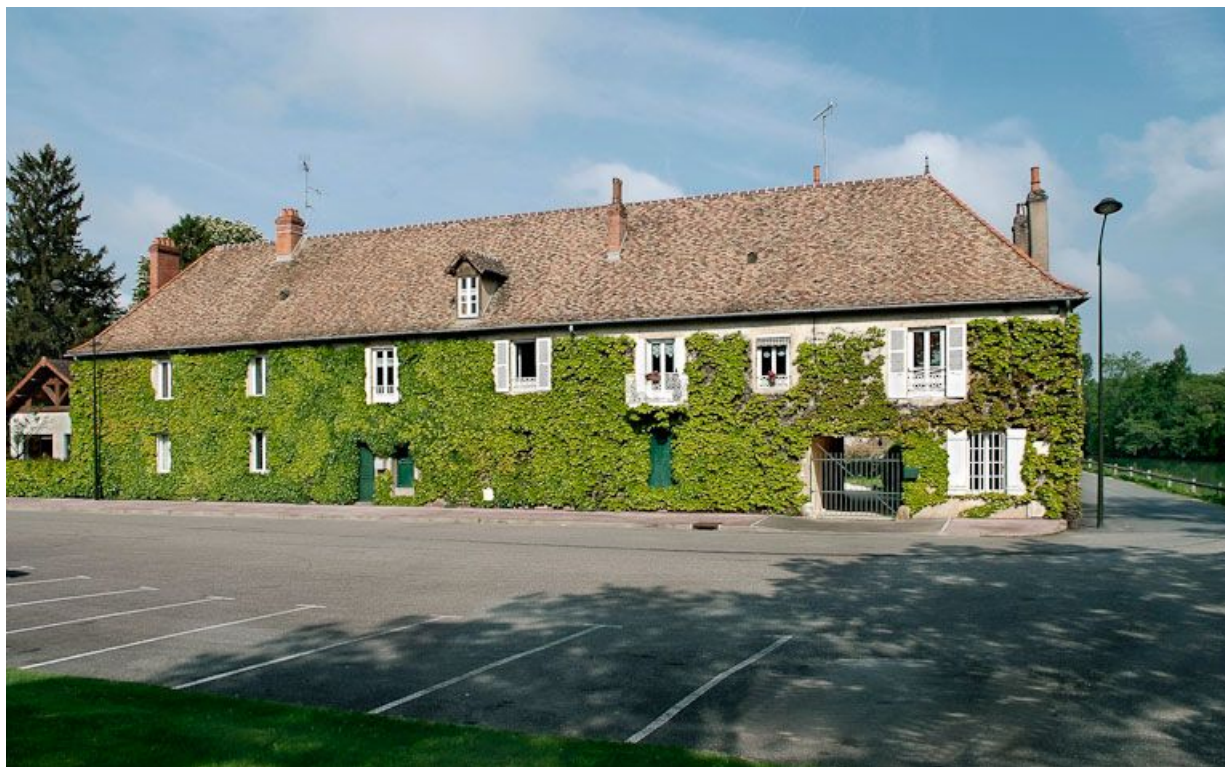
Cette demeure située sur la rive gauche de la Seille, juste en amont du port, est certainement une ancienne auberge. 71, Louhans