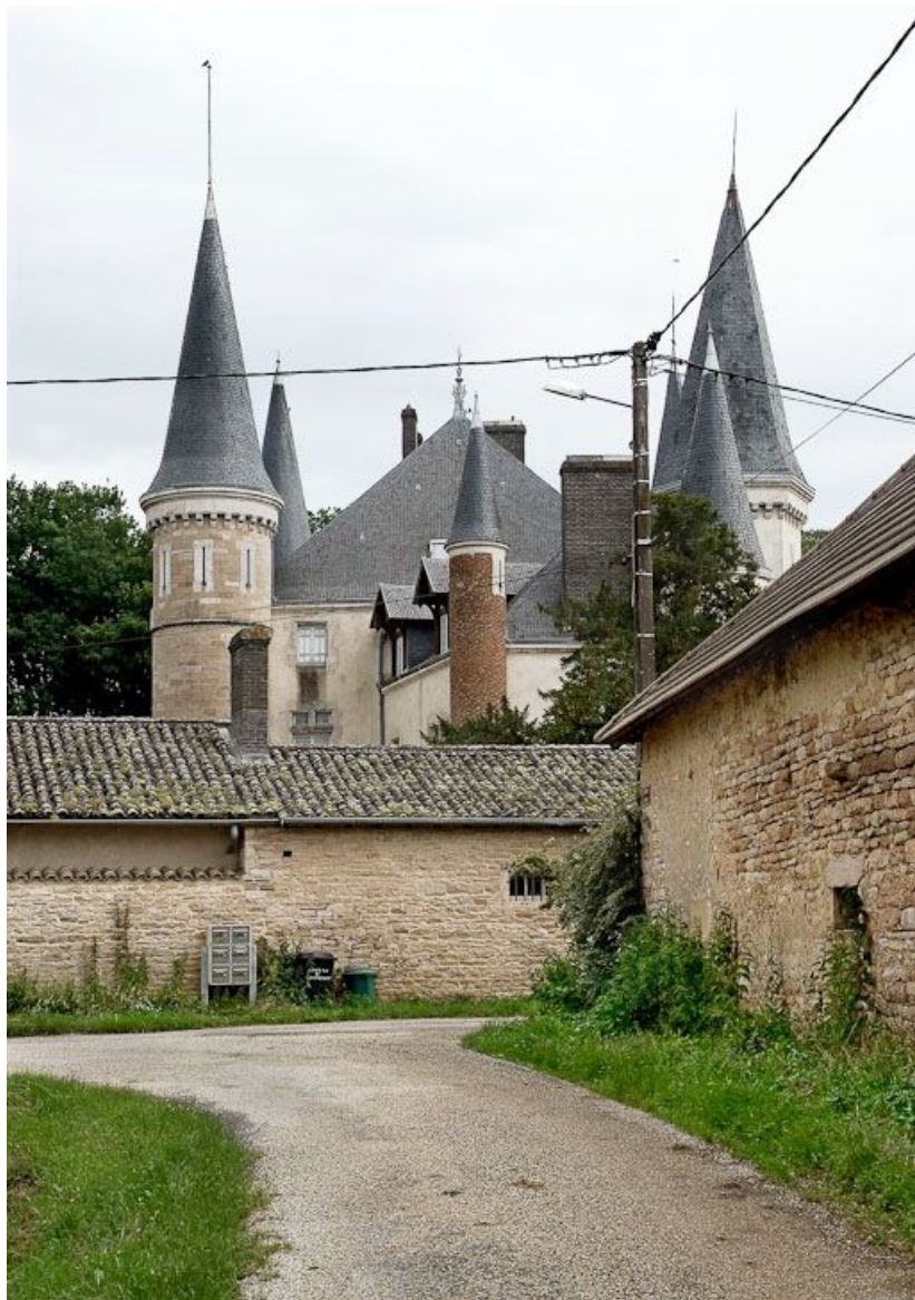
Le château de Montrevault.