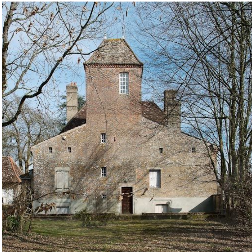
Demeure à la sortie du village, le long de la Seille.