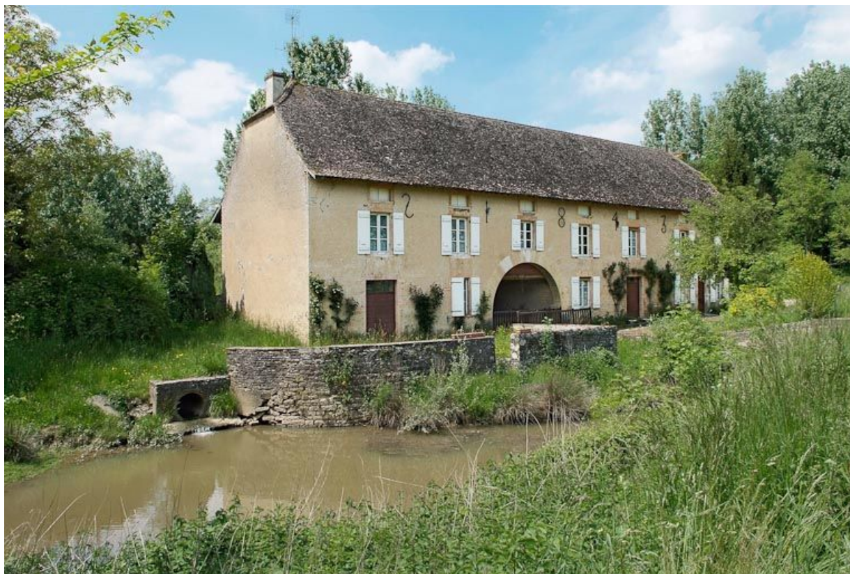
Moulin de La Folie, son bief est visible au premier plan.