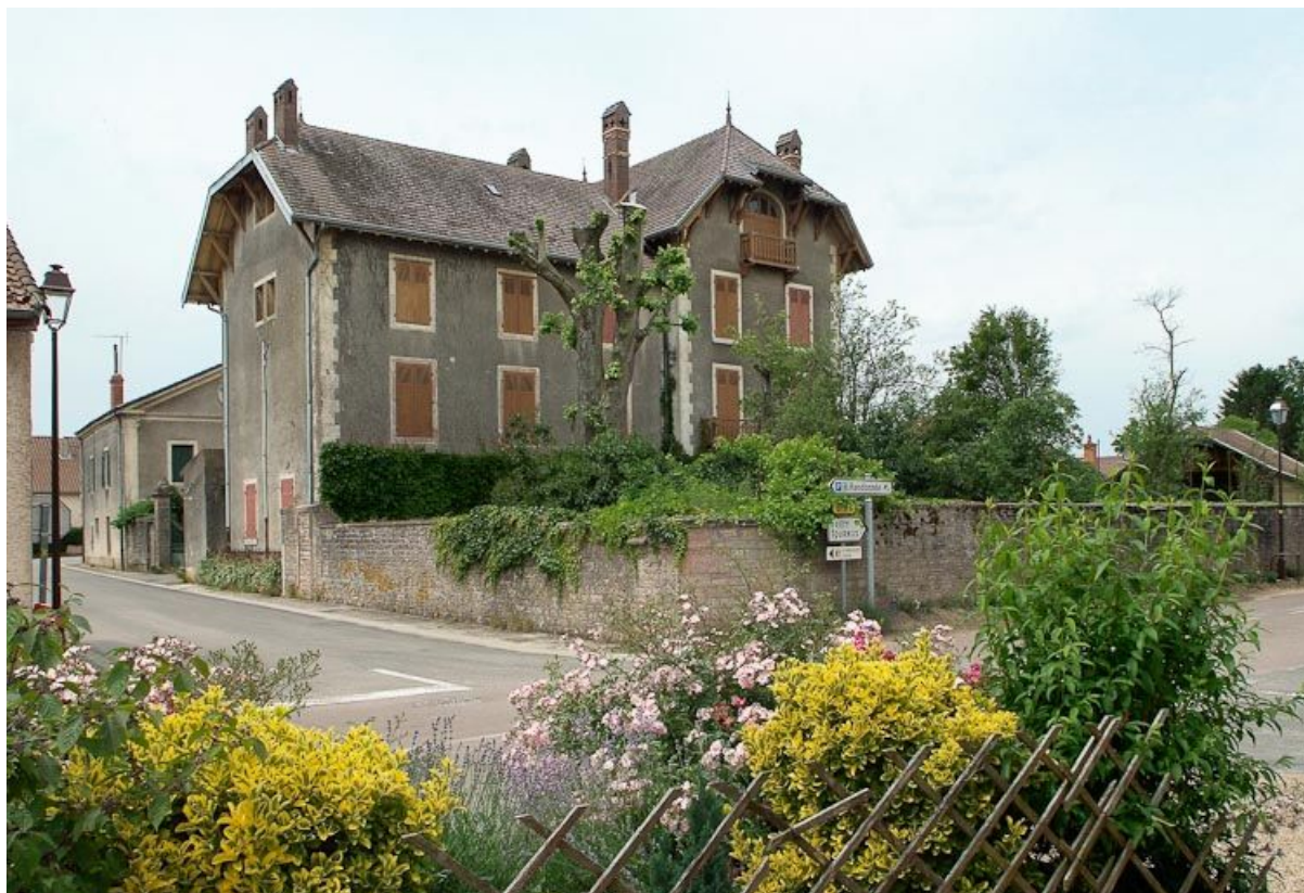
Demeure, dite "Château de La Truchère", années 1920. 71, Louhans