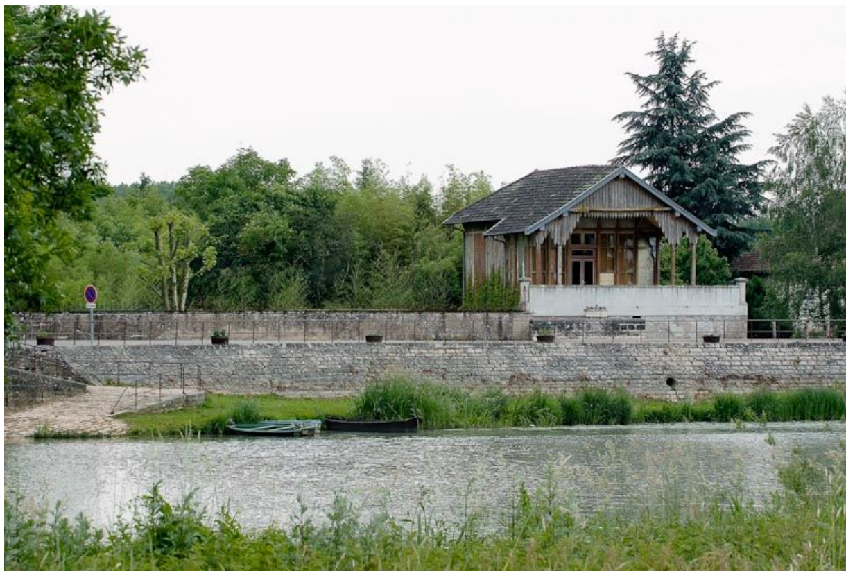
Vue du village de La Truchère, abreuvoir à gauche ; chalet à droite. 71, Louhans