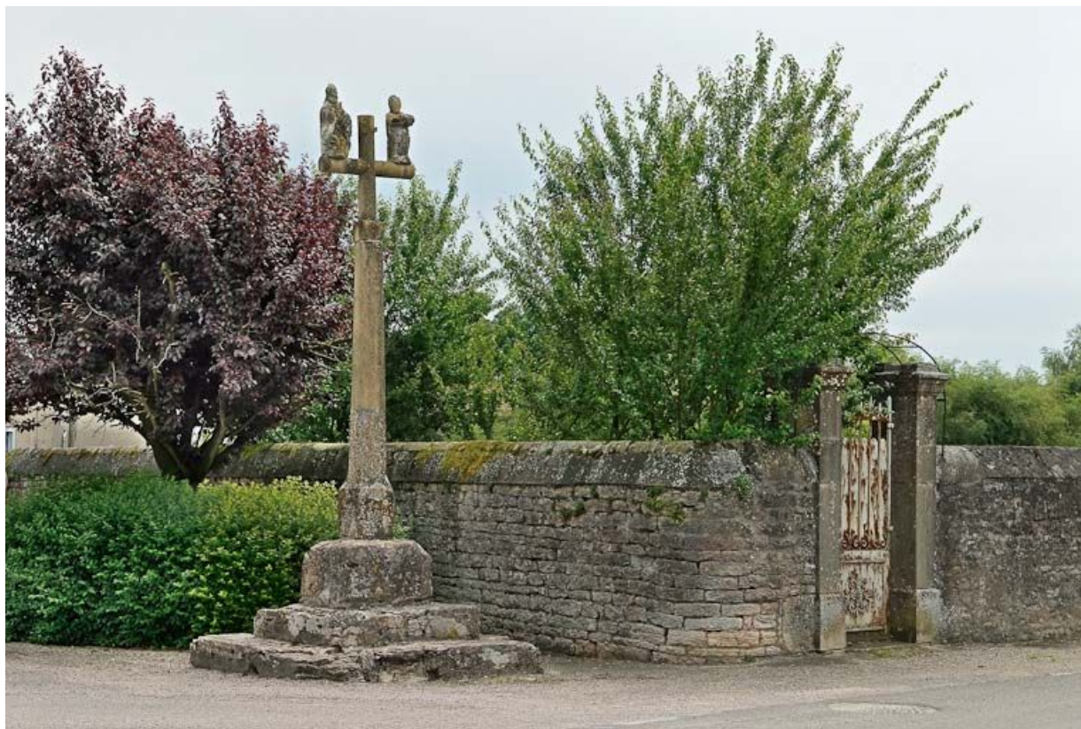
Croix de chemin au centre de La Truchère.