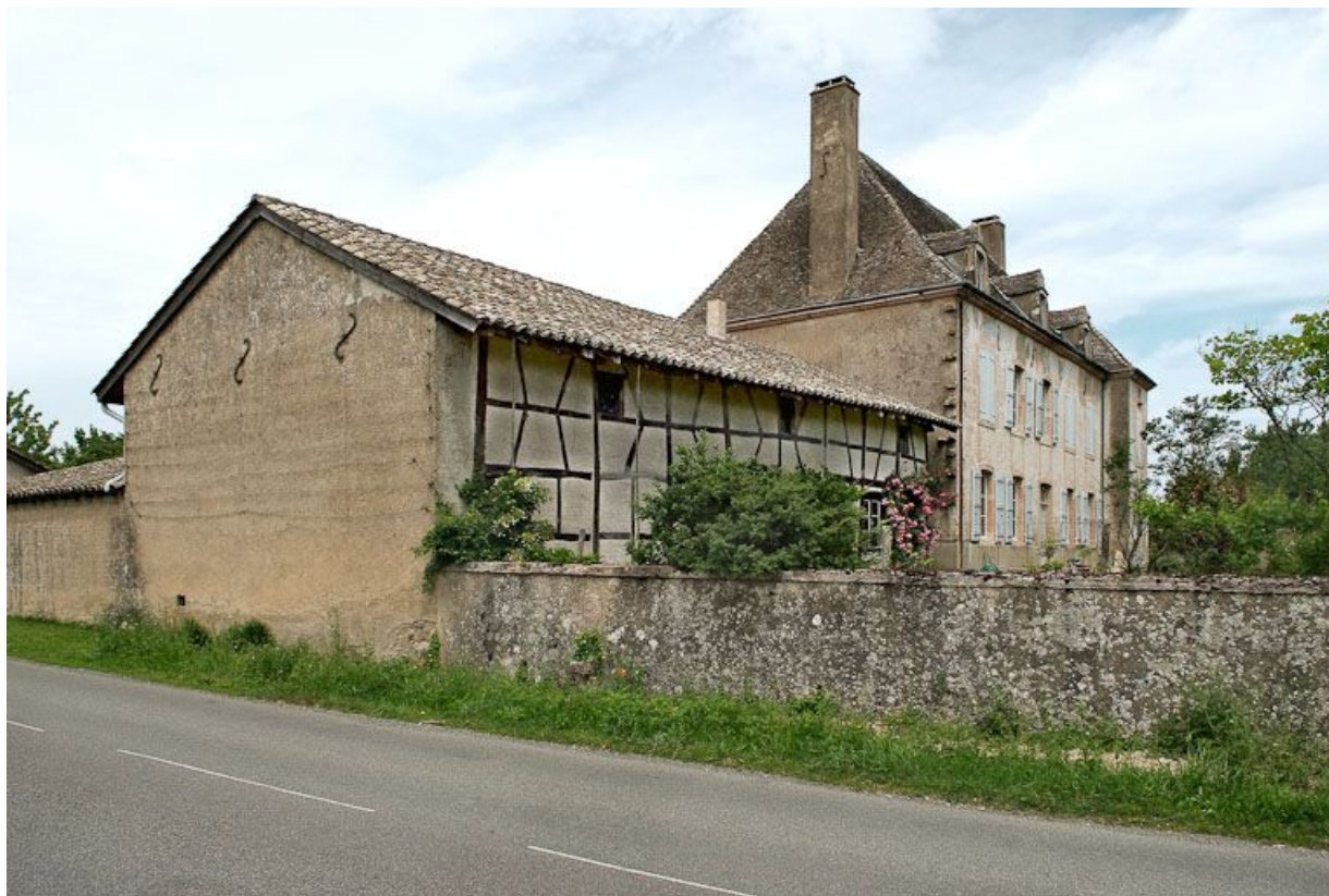
Demeure le long de la Seille.