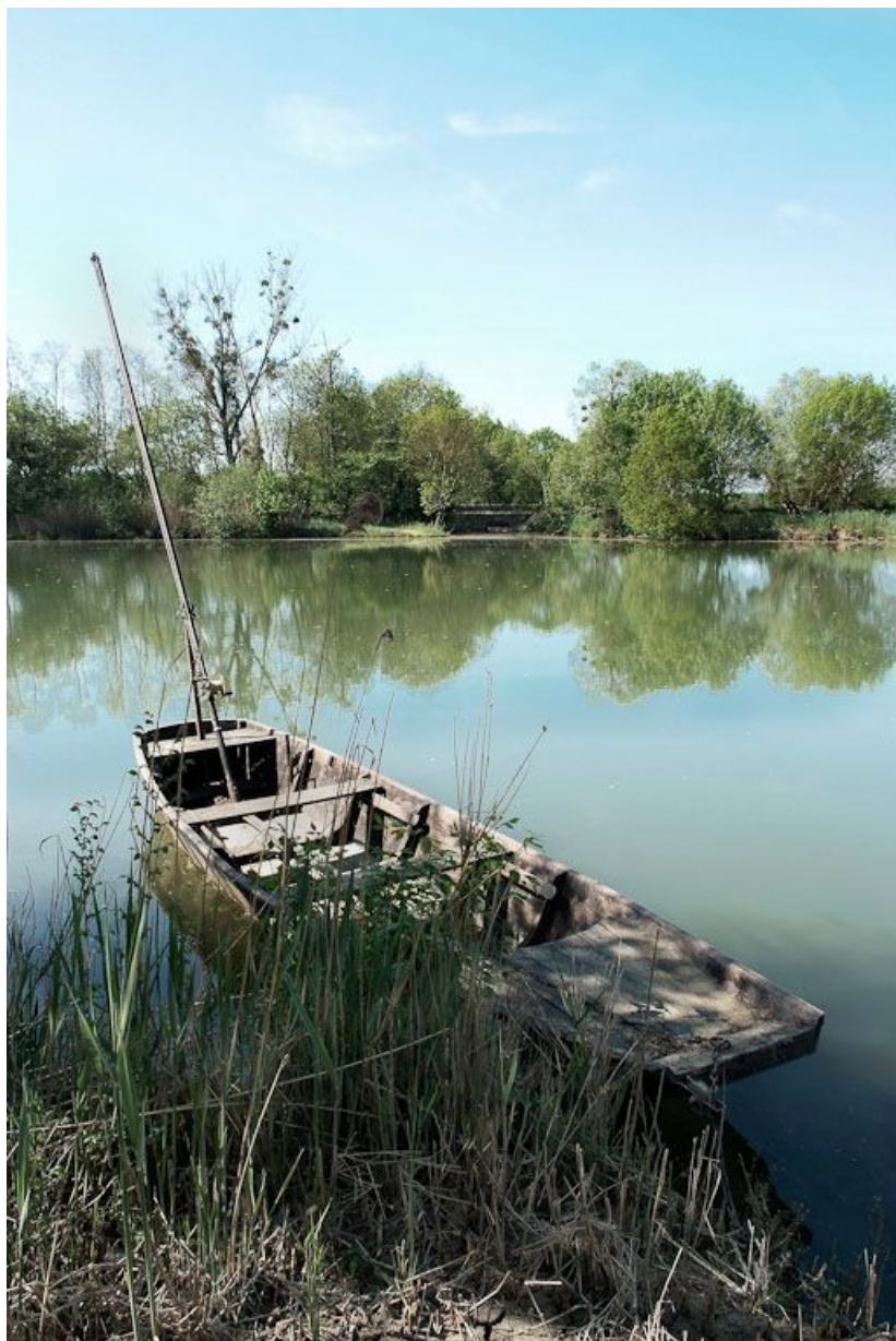
Une barque sur la Seille.