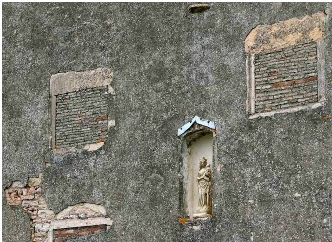
Détail d'une maison (pignon nord) avec Vierge à l'Enfant dans une niche, face aux quais de la Seille. 71, Louhans