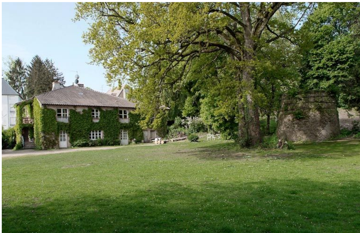
Tuilerie située avant le moulin : bâtiments et vestiges de la cheminée.