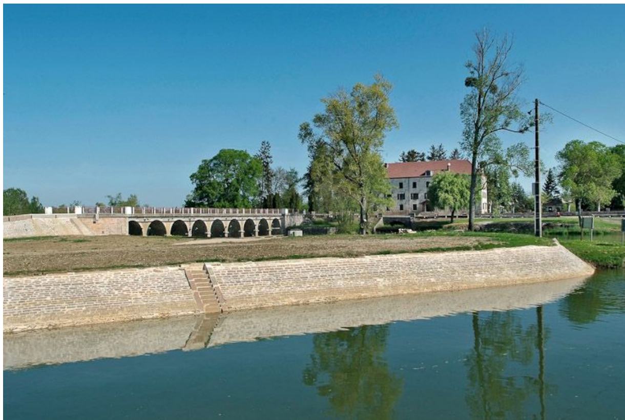
Barrage et pont de La Truchère à gauche, moulin à droite, au fond. Au premier plan : perré de l'écluse de La Truchère. 71, Louhans