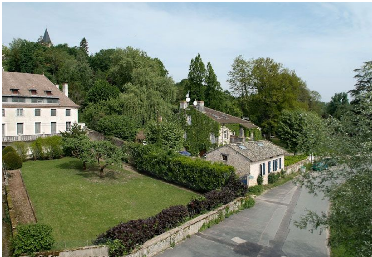
Tuilerie située avant le moulin : vue du dessus de son ancien emplacement. 71, Louhans