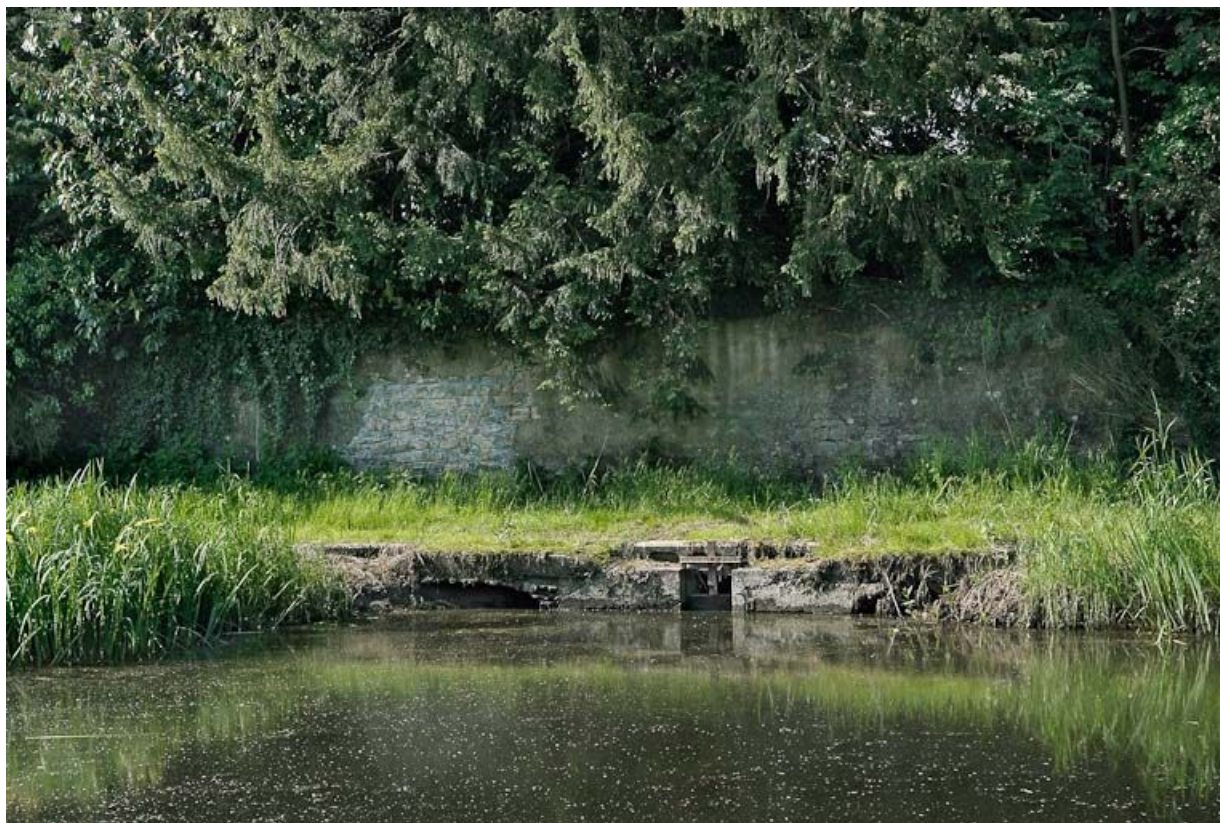
Aqueduc avant l'ancienne tuilerie.