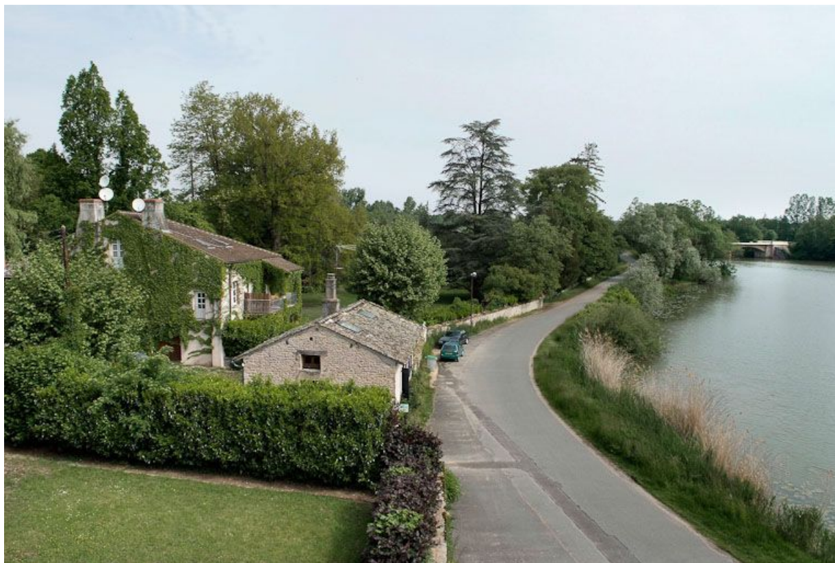
Tuilerie située avant le moulin : vue du dessus de son ancien emplacement. 71, Louhans