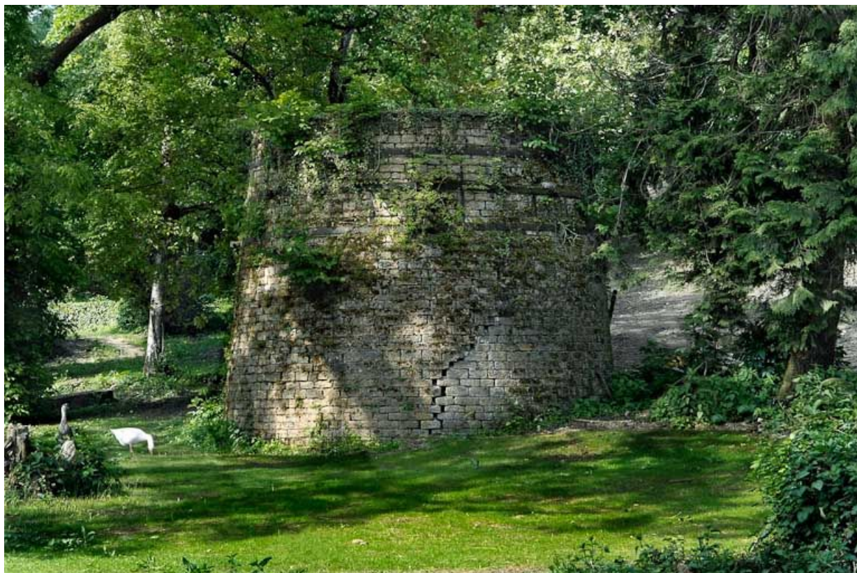
Tuilerie située avant le moulin : restes de la cheminée.