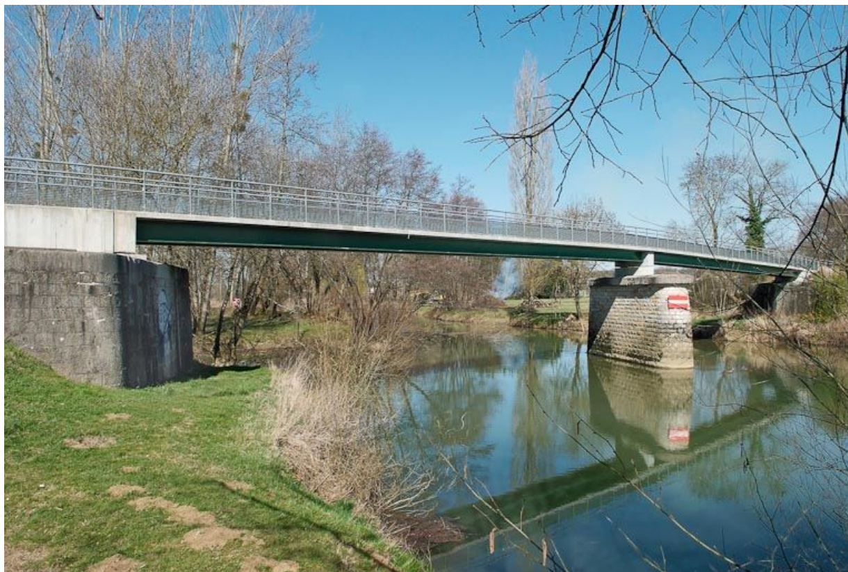
Passerelle sur la Seille, en amont de Louhans. Cette réalisation moderne vient remplacer un ancien pont de chemin de fer désaffecté.