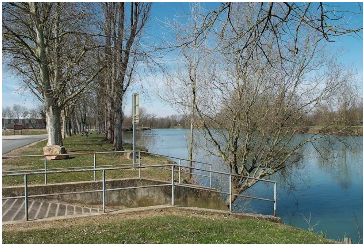
Alignement de platanes, rive gauche, en aval du port de Louhans. 71, Louhans