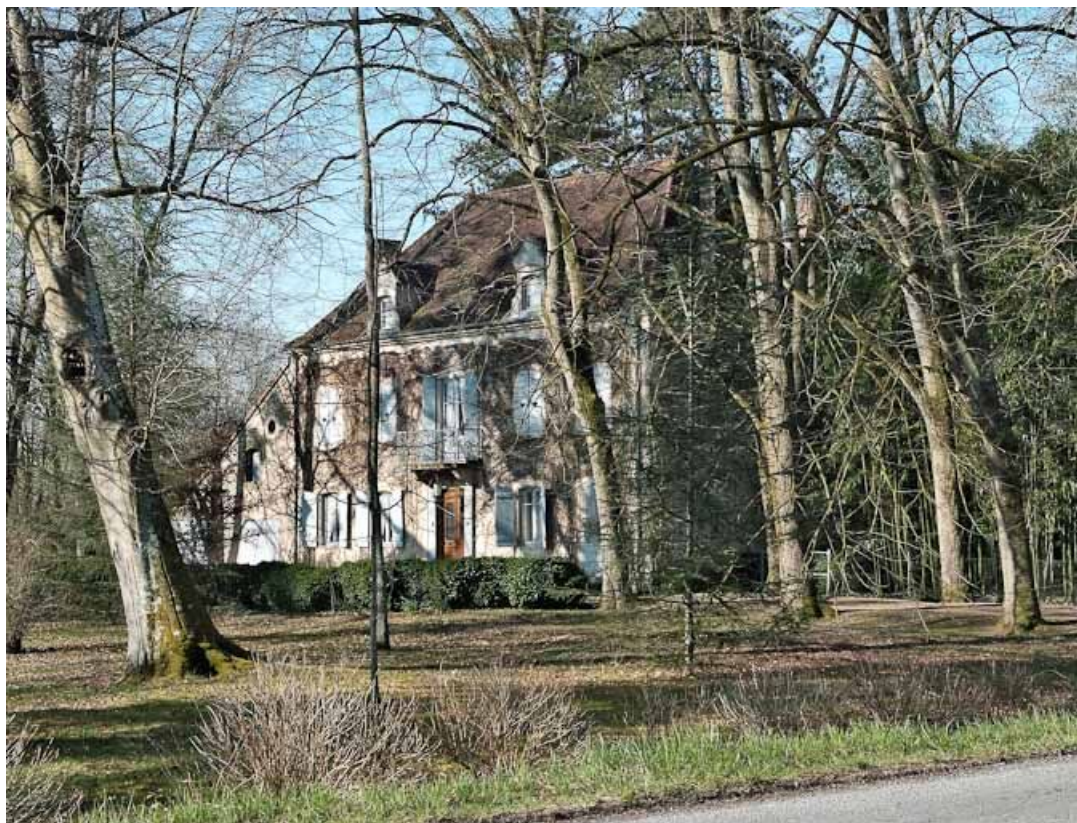
Demeure à la sortie du village, dans un méandre de la Seille. Cette maison est déjà présente sur un plan de bornage de la Seille (1897 ; Archives VNF-direction territoriale Centre-Bourgogne, subdivision de Montceau-les-Mines).