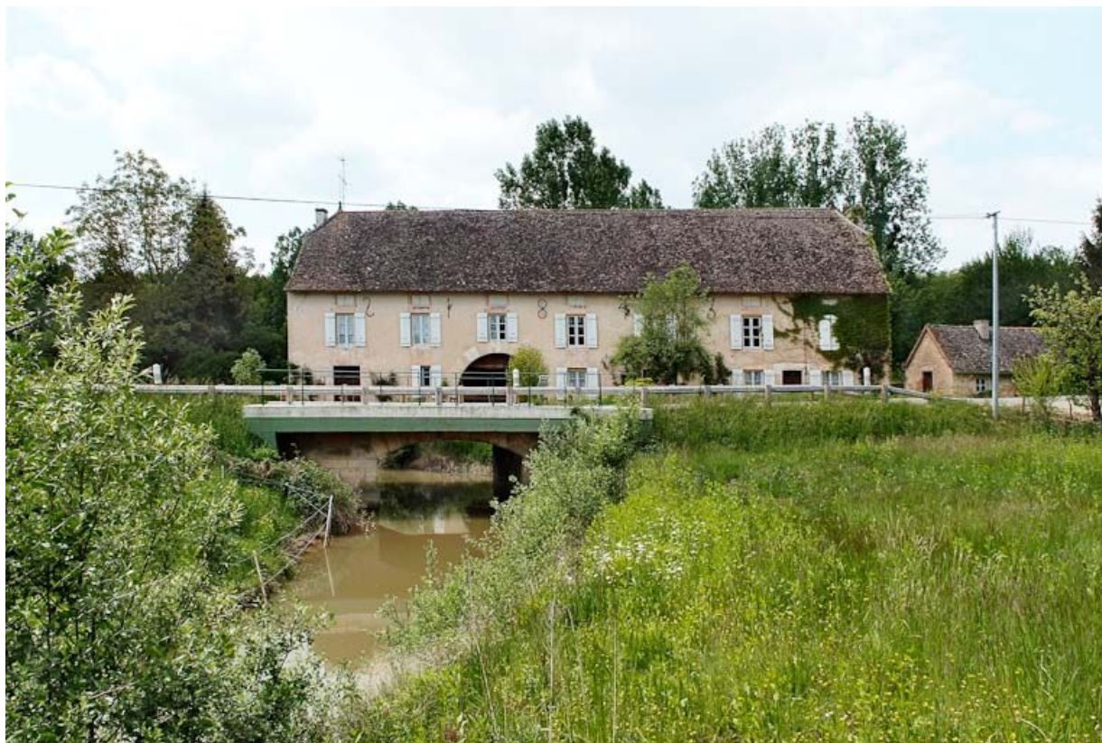
Moulin de La Folie, son bief est visible au premier plan.