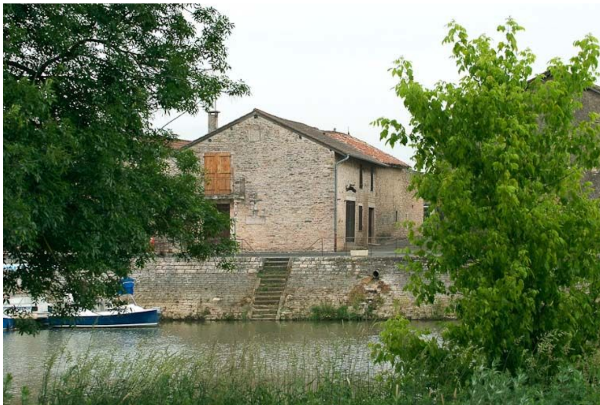
Maison située sur la rive droite de la Seille, sur le pignon : croix commémorative de la crue de la Seille de 1841. 71, Louhans