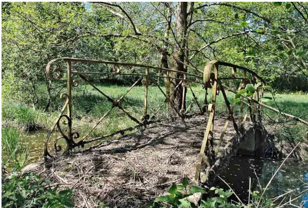
Passerelle métallique sur le Bief Michaud. 71, Louhans