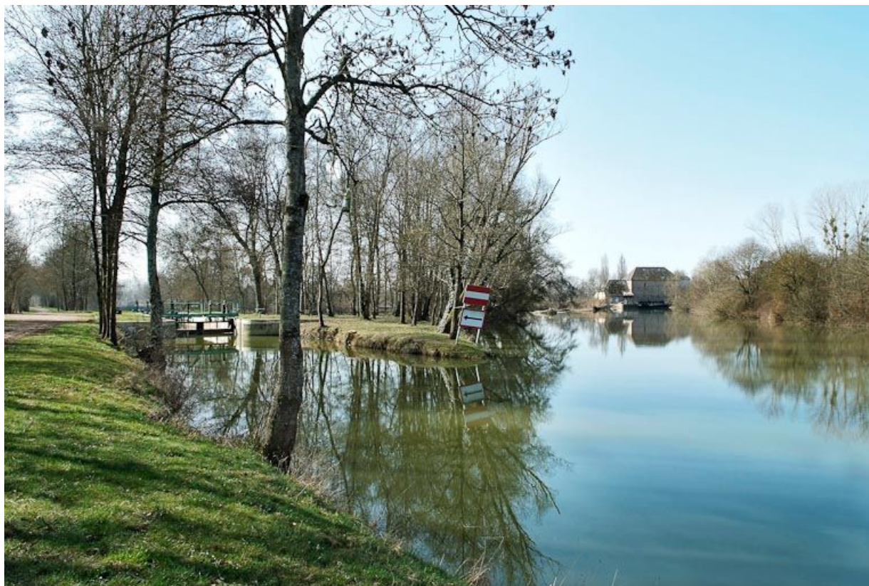
Vue d'ensemble du site d'écluse de Loisy sur la dérivation du canal. A droite, le moulin de Loisy. 71, Louhans