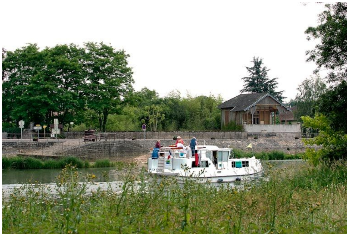
Vue du village de La Truchère, abreuvoir à gauche ; chalet à droite. Bateau de plaisance au premier plan. 71, Louhans