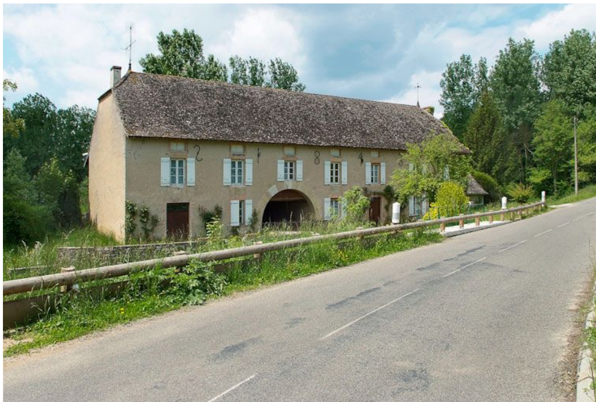
Moulin de La Folie.