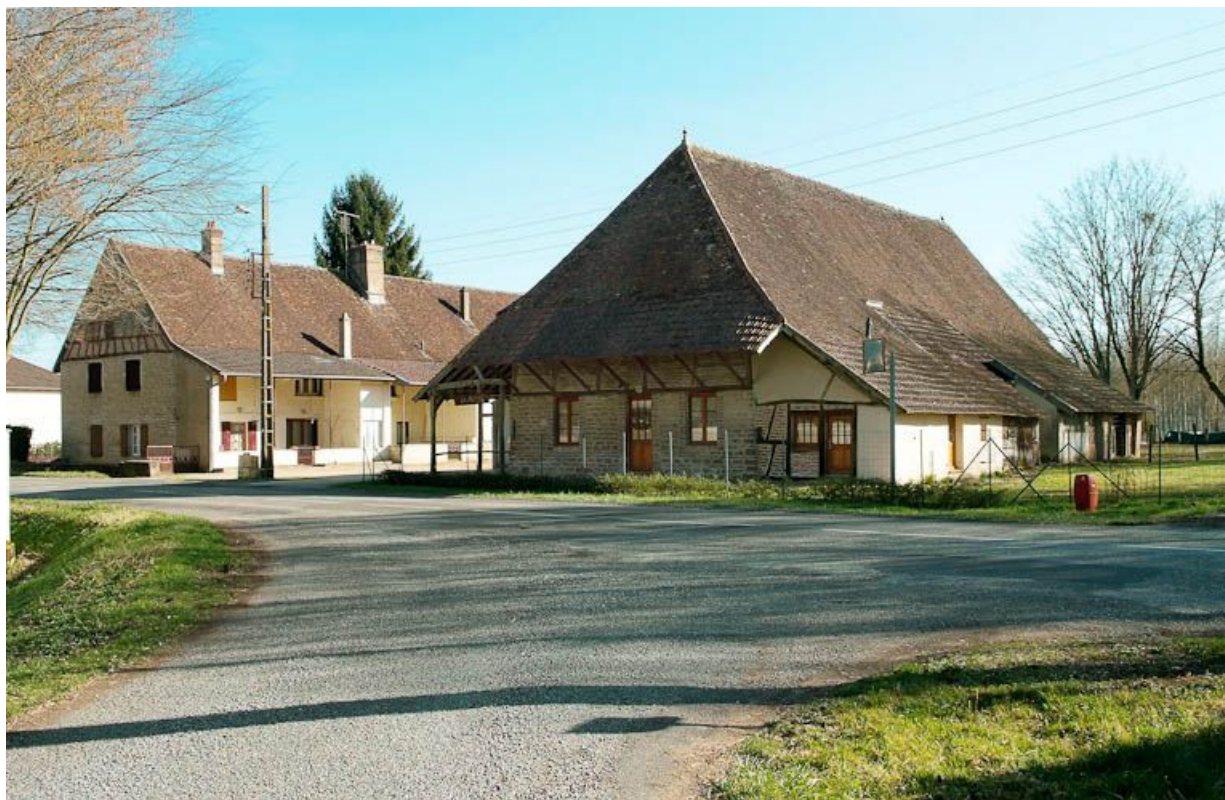
Emplacement d'une ancienne forge le long de la Seille.