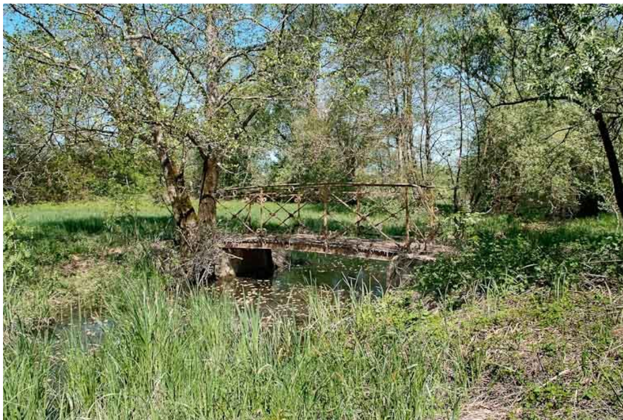
Passerelle métallique sur le Bief Michaud.