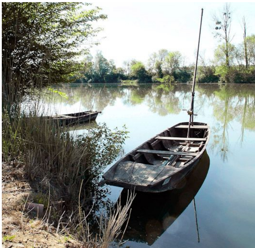
Une barque sur la Seille.