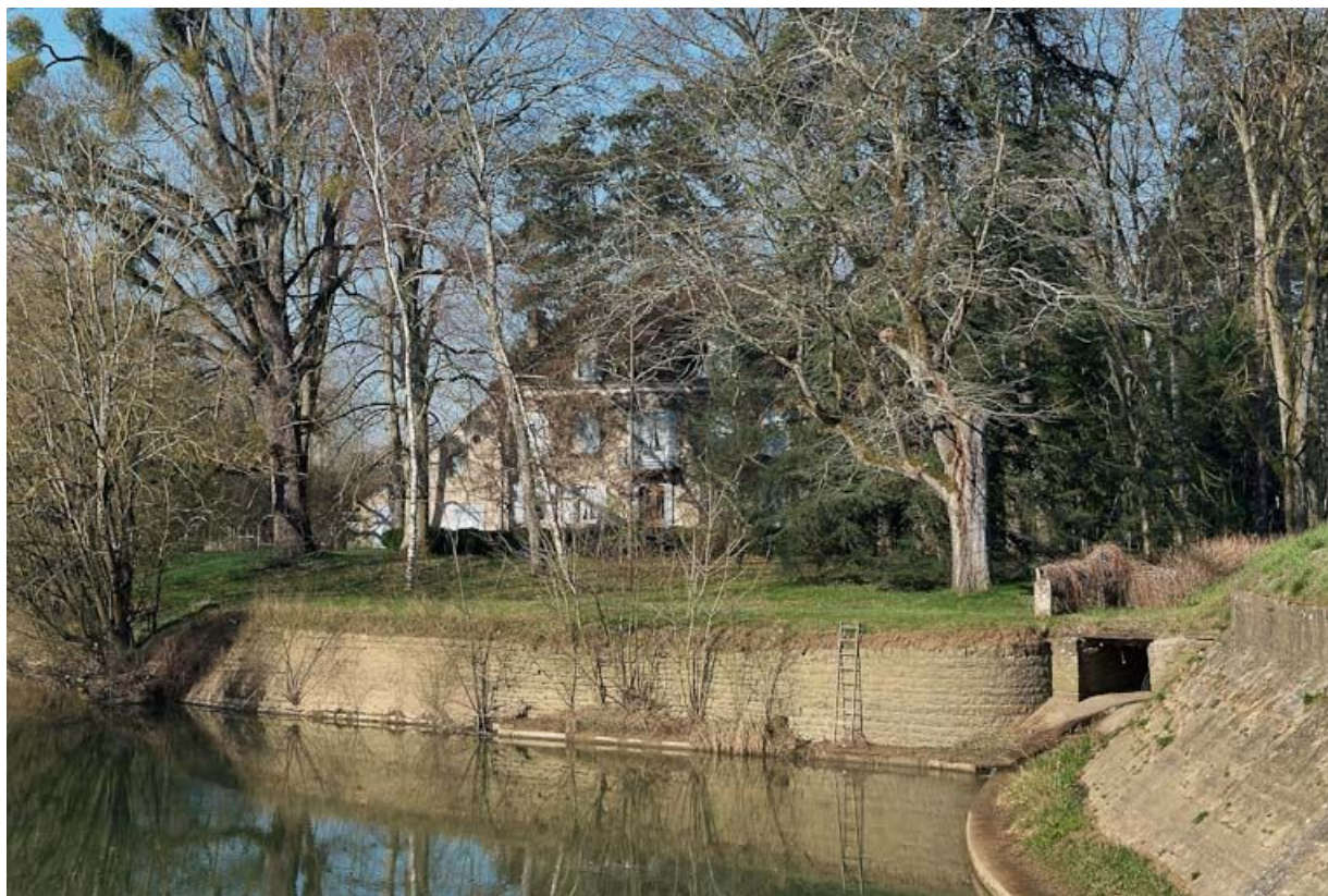
Demeure à la sortie du village, dans un méandre de la Seille. Cette maison est déjà présente sur un plan de bornage de la Seille (1897 ; Archives VNF-direction territoriale Centre-Bourgogne, subdivision de Montceau-les-Mines).