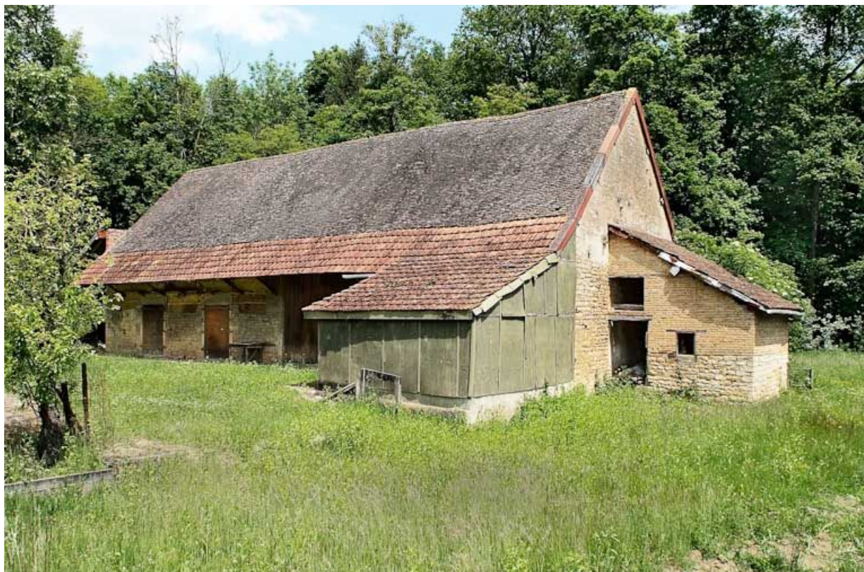
Moulin de La Folie, une dépendance.