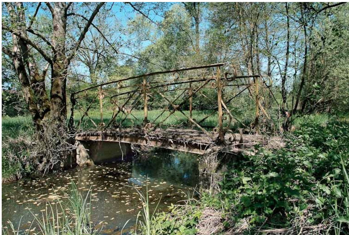
Passerelle métallique sur le Bief Michaud.