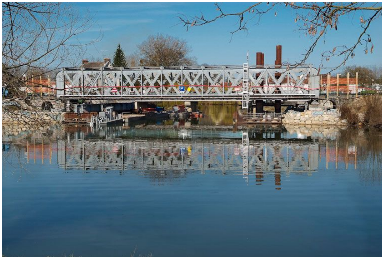
Ancien pont de chemin de fer, vu d'amont.