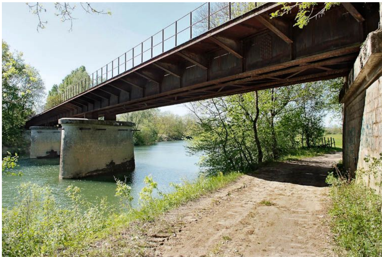
Pont de chemin de fer désaffecté, vu du dessous.