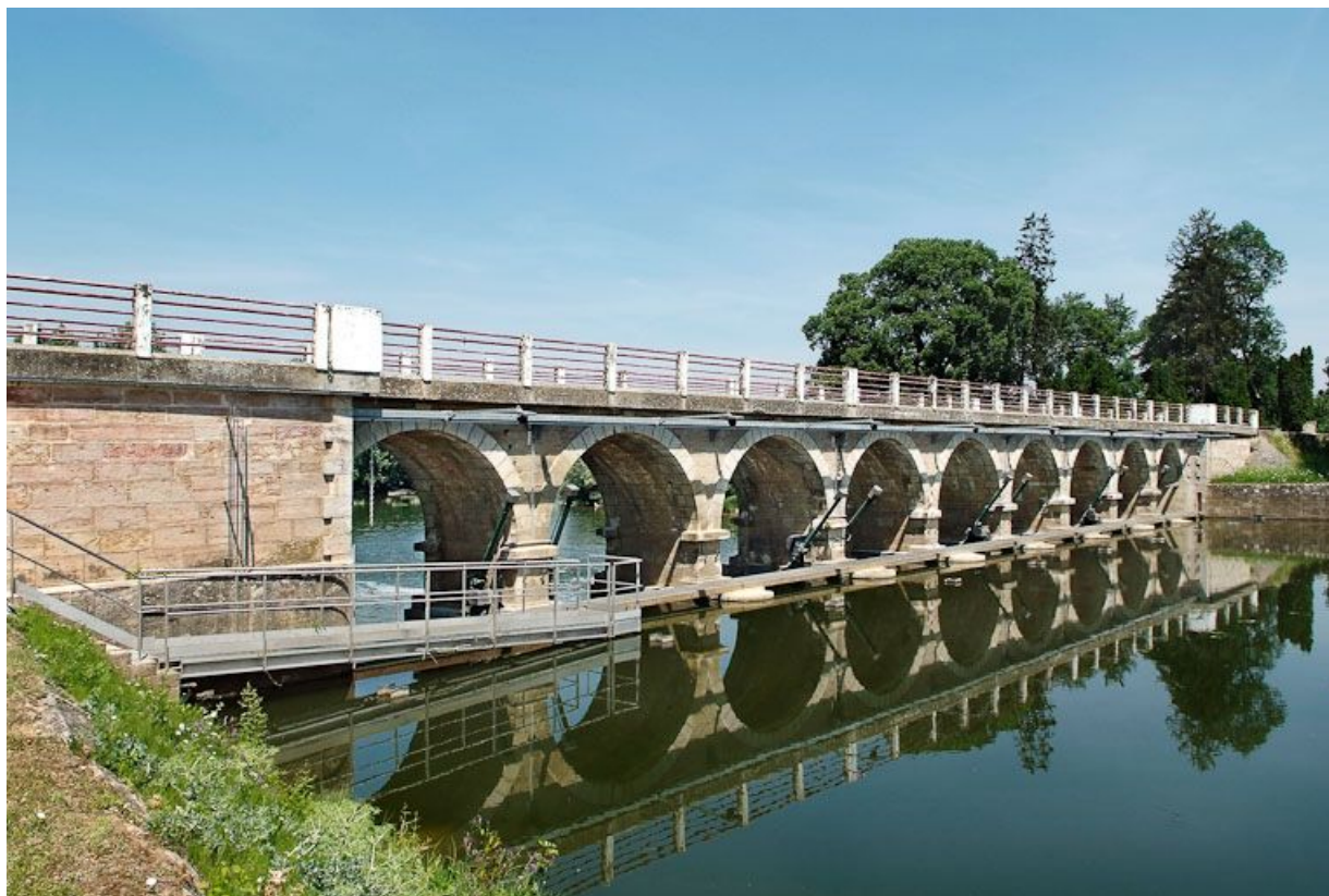
Barrage et pont de La Truchère, vus de la rive gauche de la Seille.