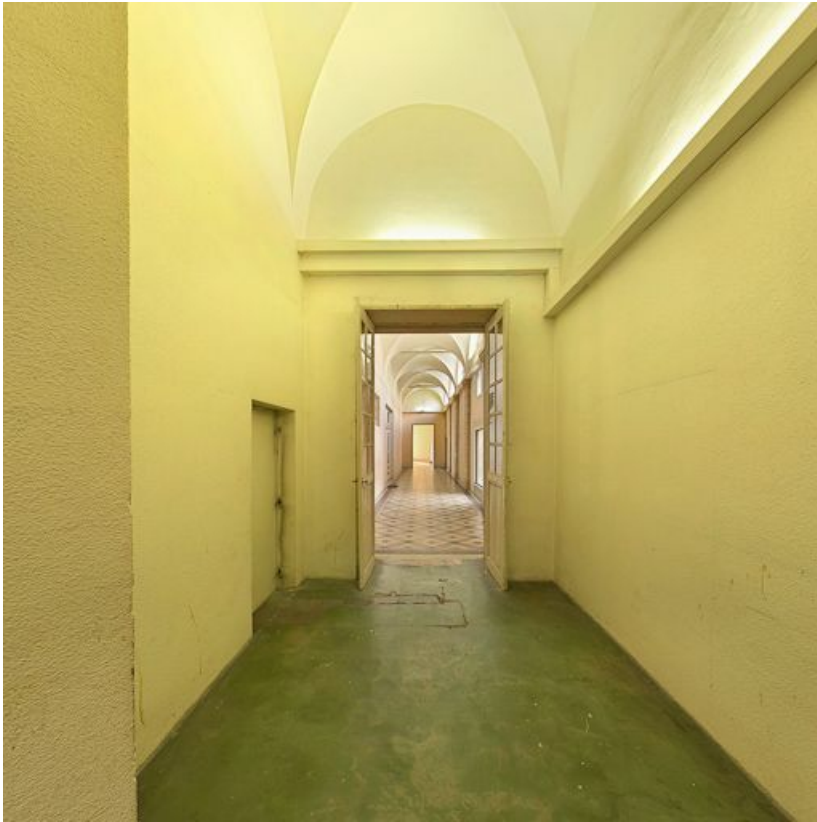
Couloir précédant la rotonde.