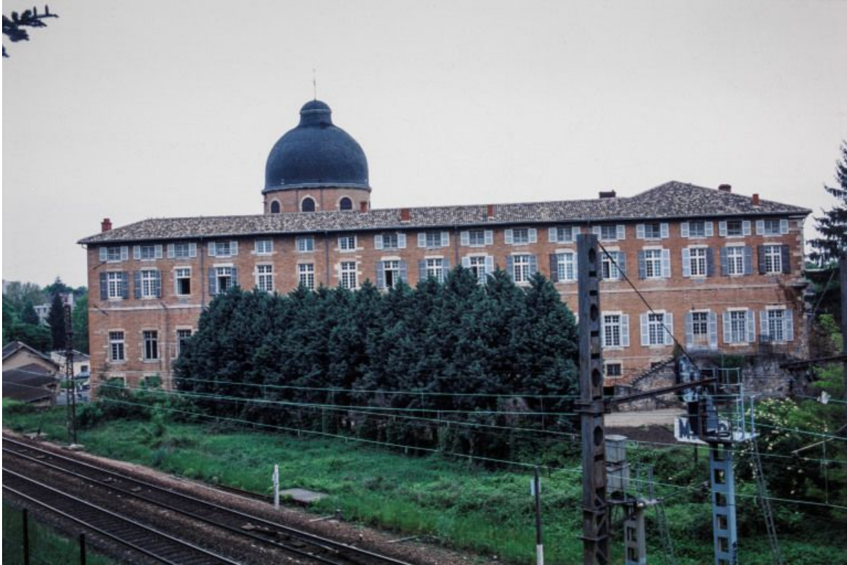
Elévation latérale gauche.