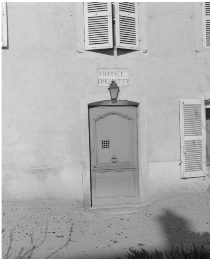
Façade antérieure détail de la porte (datée 1777).

71, Sennecey-le-Grand, 61 avenue du 4 septembre 1944