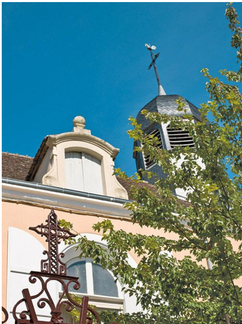
Corps de bâtiment principal : détail de la grille datée 1862, lucarne et campanile. 71, Sennecey-le-Grand, 61 avenue du 4 septembre 1944