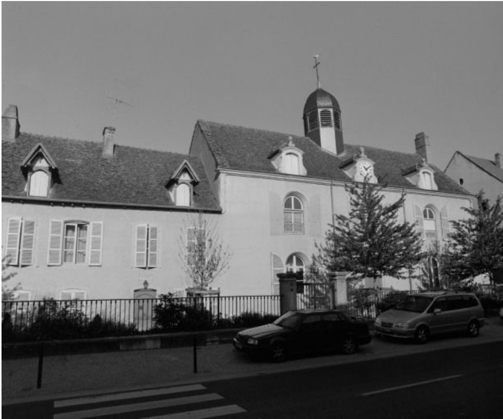
Vue d'ensemble de la façade antérieure.

71, Sennecey-le-Grand, 61 avenue du 4 septembre 1944