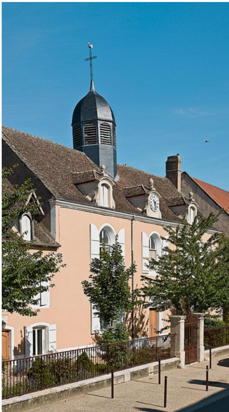
Corps de bâtiment principal, façade sur rue.

71, Sennecey-le-Grand, 61 avenue du 4 septembre 1944