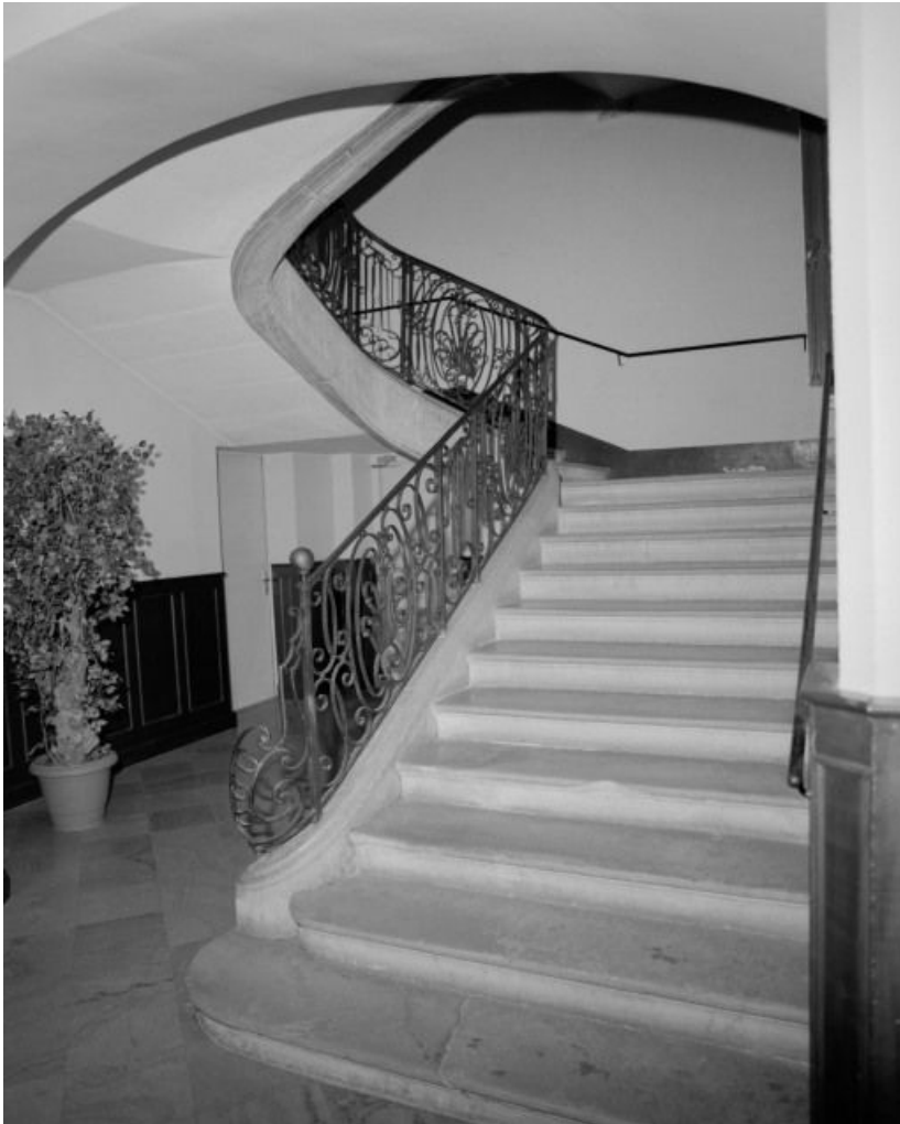
Vue d'ensemble de l'escalier.

71, Sennecey-le-Grand, 61 avenue du 4 septembre 1944