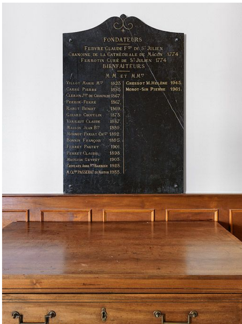
Plaque commémorative des fondateurs et bienfaiteurs.

71, Sennecey-le-Grand, 61 avenue du 4 septembre 1944