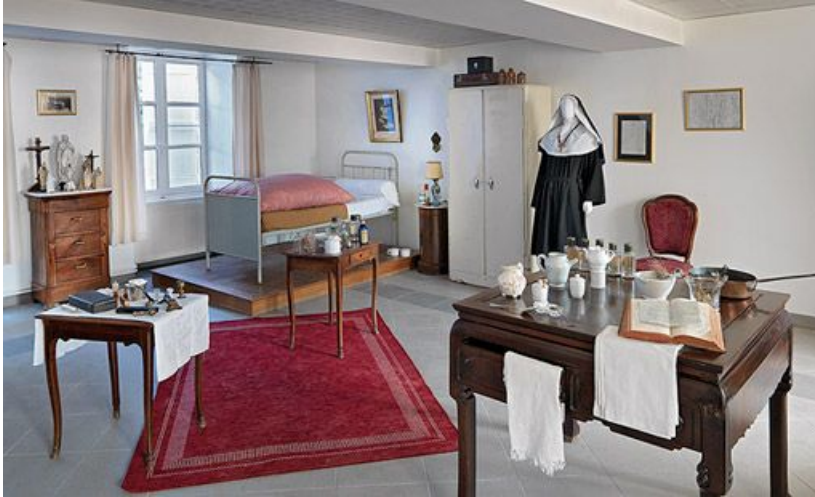
Petit musée situé au rez-de-chaussée.

71, Sennecey-le-Grand, 61 avenue du 4 septembre 1944