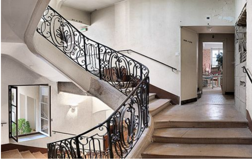
Escalier monumental, palier du 1er étage.

71, Sennecey-le-Grand, 61 avenue du 4 septembre 1944