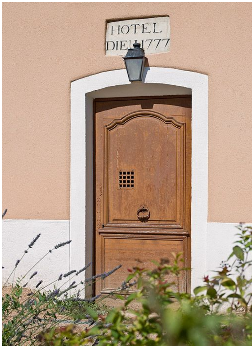
Porte d'entrée datée 1777.

71, Sennecey-le-Grand, 61 avenue du 4 septembre 1944