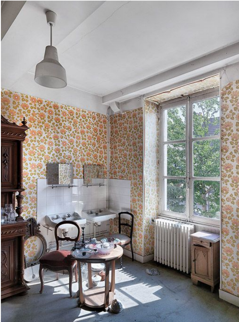
Chambre du 1er étage.

71, Sennecey-le-Grand, 61 avenue du 4 septembre 1944