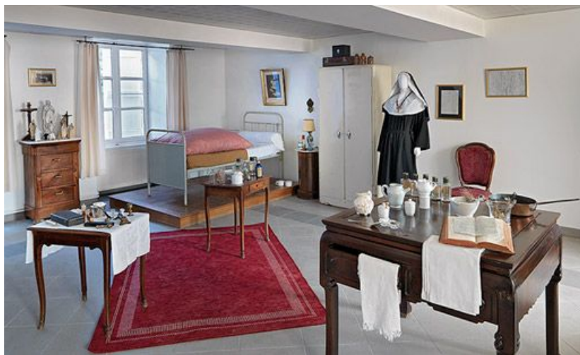
Petit musée situé au rez-de-chaussée.

71, Sennecey-le-Grand, 61 avenue du 4 septembre 1944