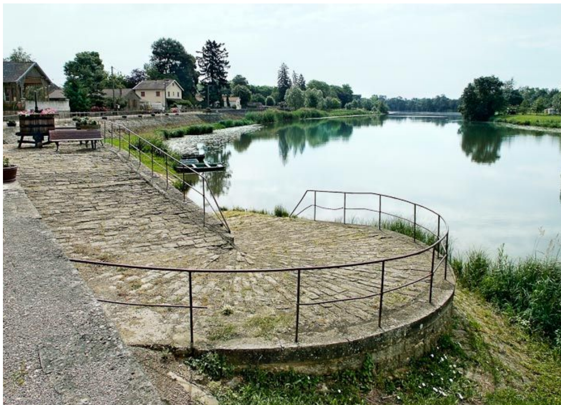
Dans le village de La Truchère, descente vers l'abreuvoir aménagé sur le quai.