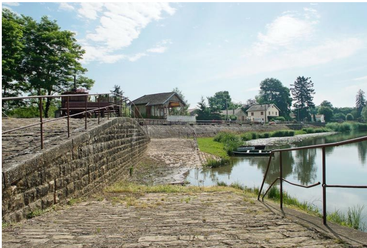
Vue du village de La Truchère, abreuvoir aménagé sur le quai.