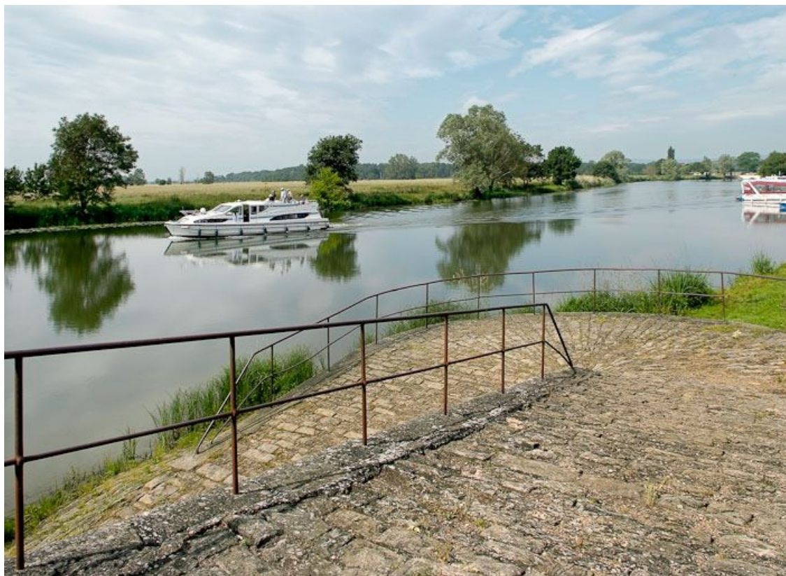
Dans le village de La Truchère, descente vers l'abreuvoir aménagé sur le quai. Bateaux à l'arrière-plan.