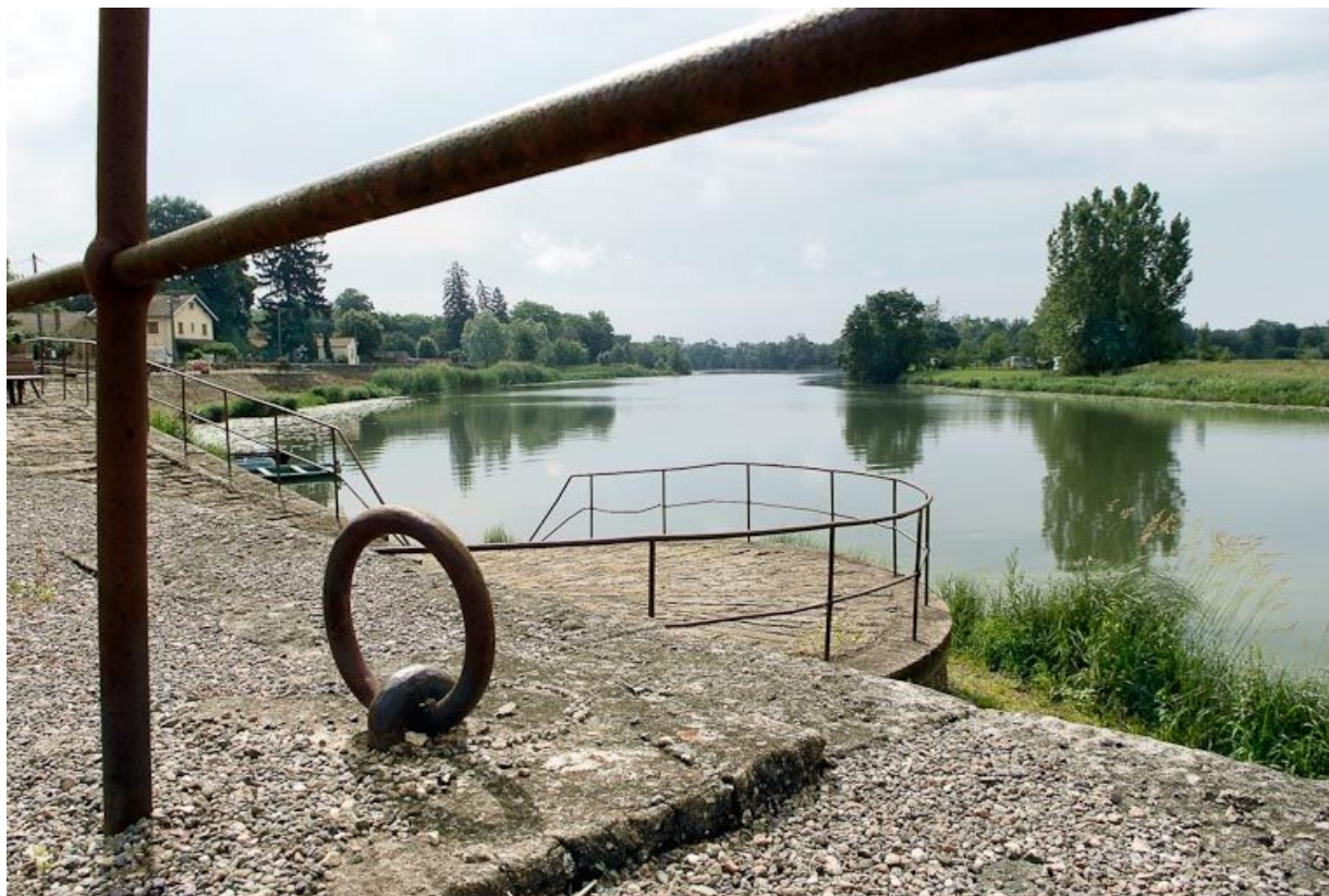
Descente vers l'abreuvoir aménagé sur le quai. Un anneau d'amarrage.