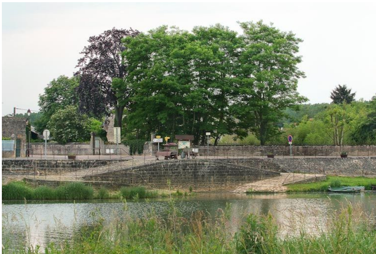
Vue du village de La Truchère, abreuvoir aménagé sur le quai.