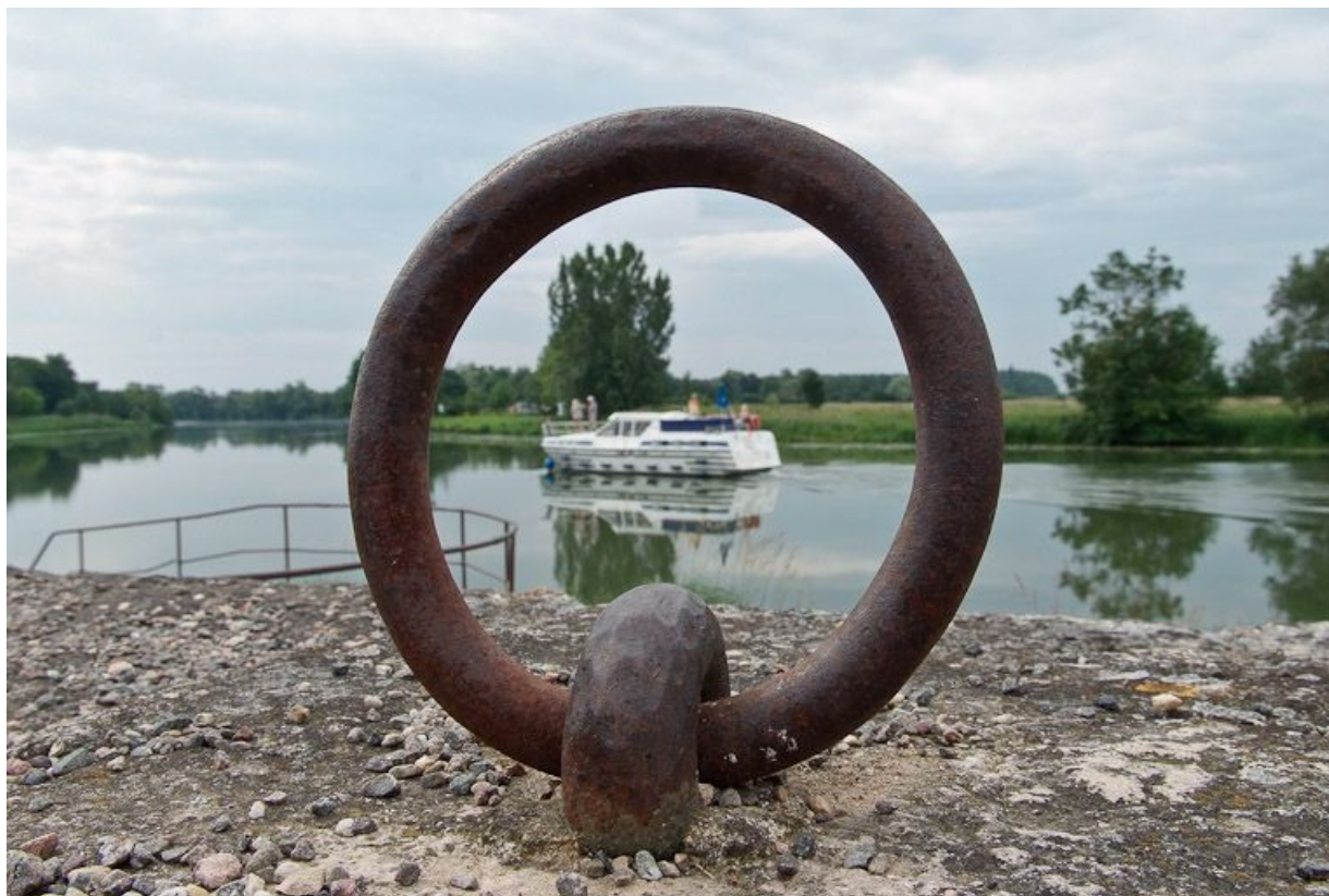
Descente vers l'abreuvoir aménagé sur le quai. Bateau visible dans l'anneau d'amarrage.