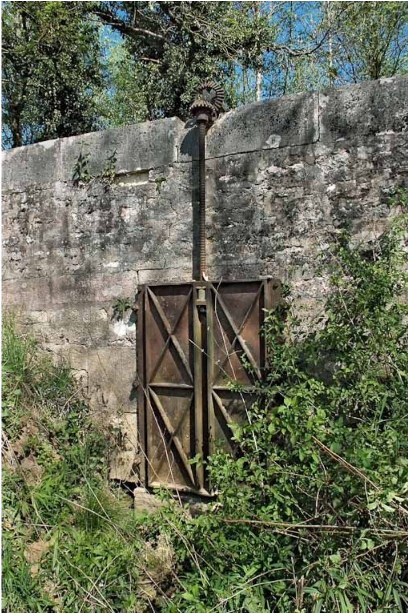
Vanne de l'aqueduc.