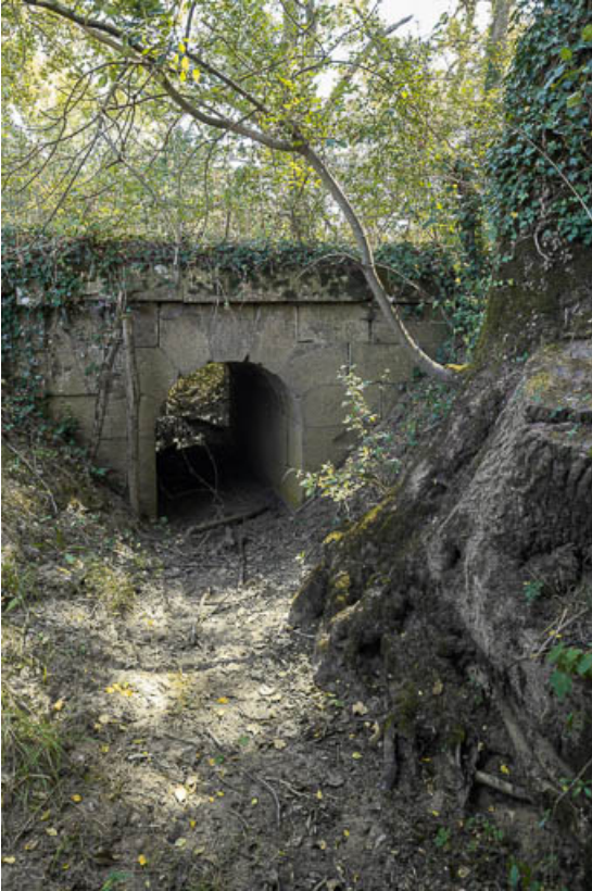
Vue du ponceau.