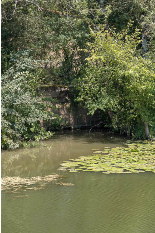
Vue du ponceau.