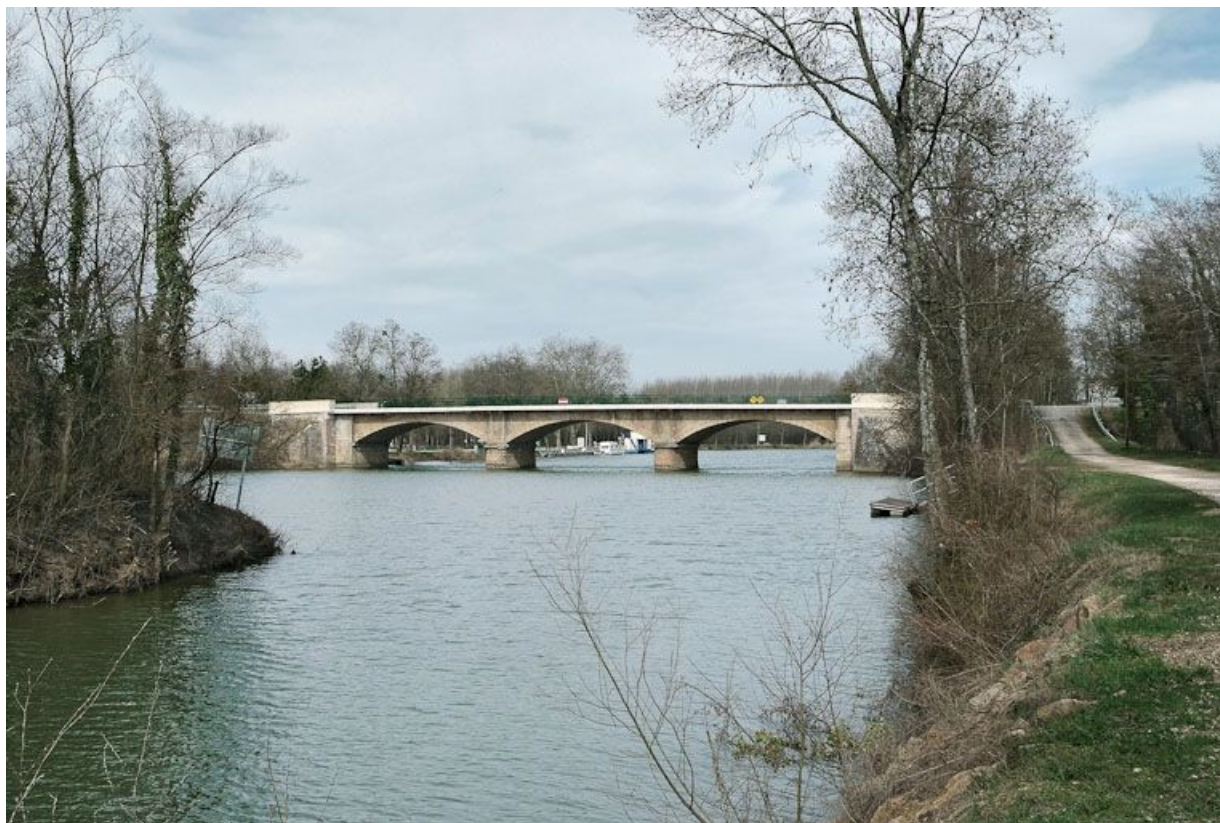
Le pont de Cuisery, vu d'amont.