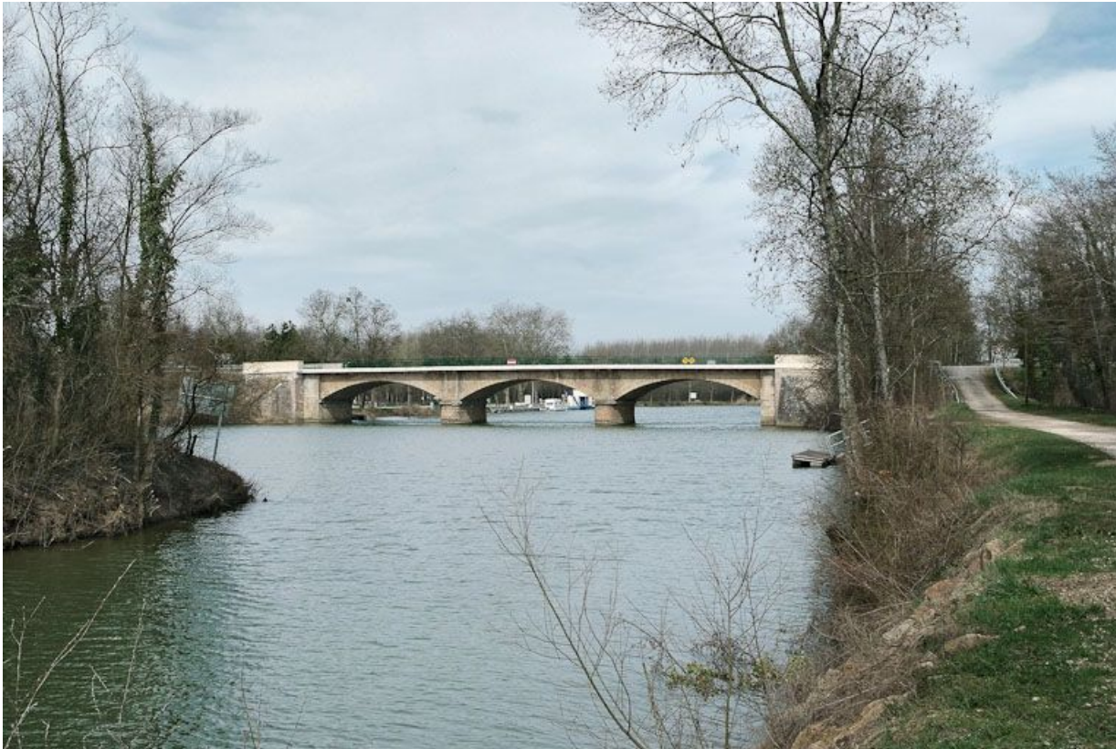
Le pont de Cuisery, vu d'aval.