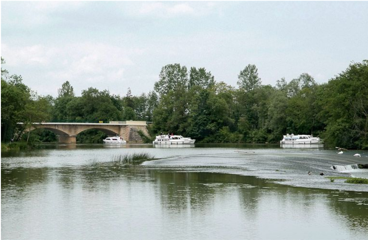
Le pont de Cuisery, vu d'aval.