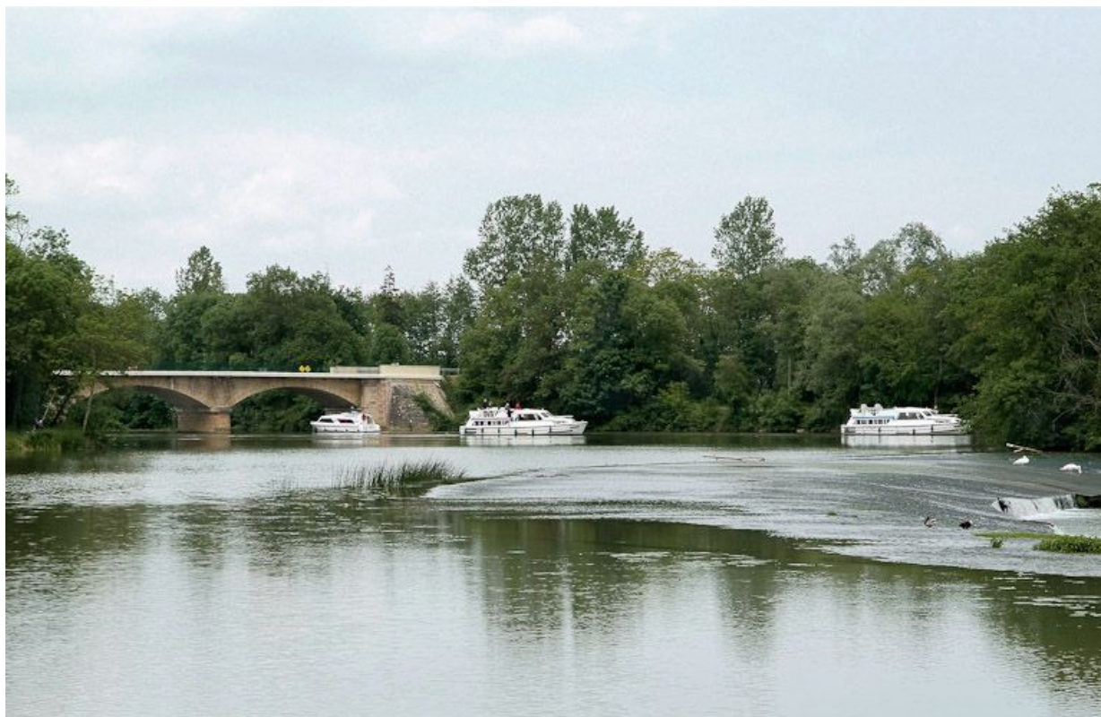
Le pont de Cuisery, vu d'aval.