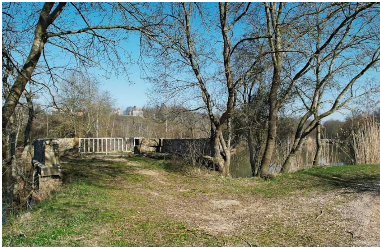
Arrivée sur la pile de l'ancien pont à bascule, vue du chemin de halage.