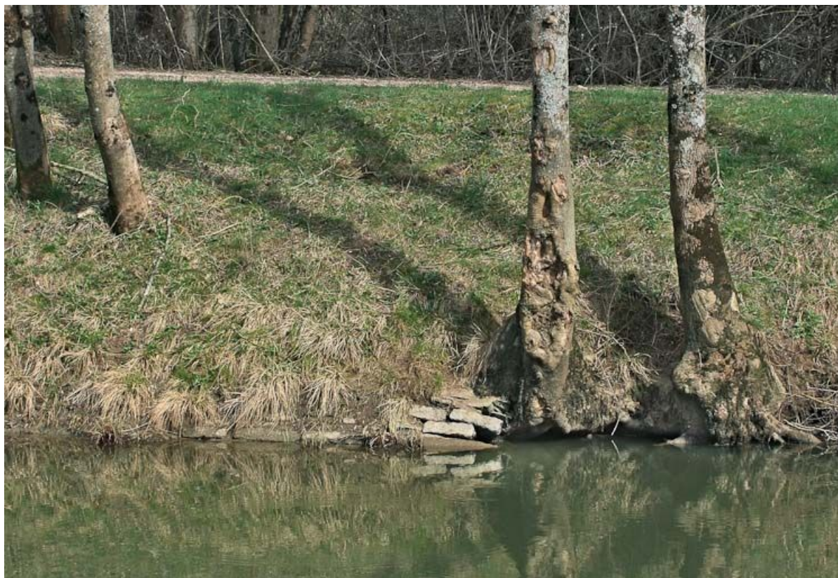
Emplacement de l'aqueduc du Pont à Bascule, désordres dans le perré.

71, Jouvençon, lieudit : Pré des Chèvres