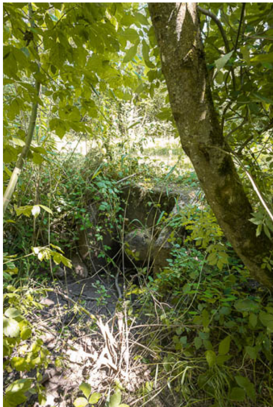
Vue de l'aqueduc.