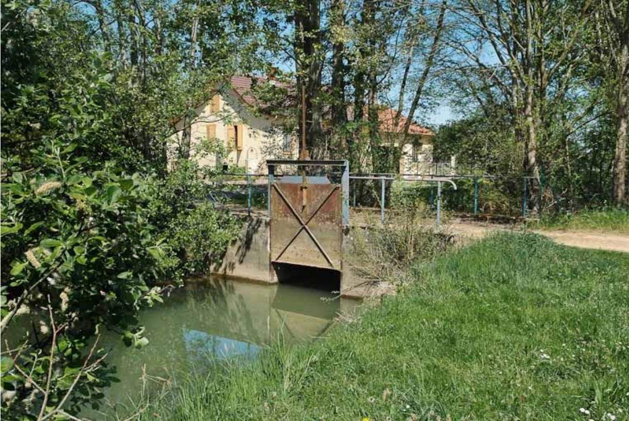
Vue d'ensemble : vanne.