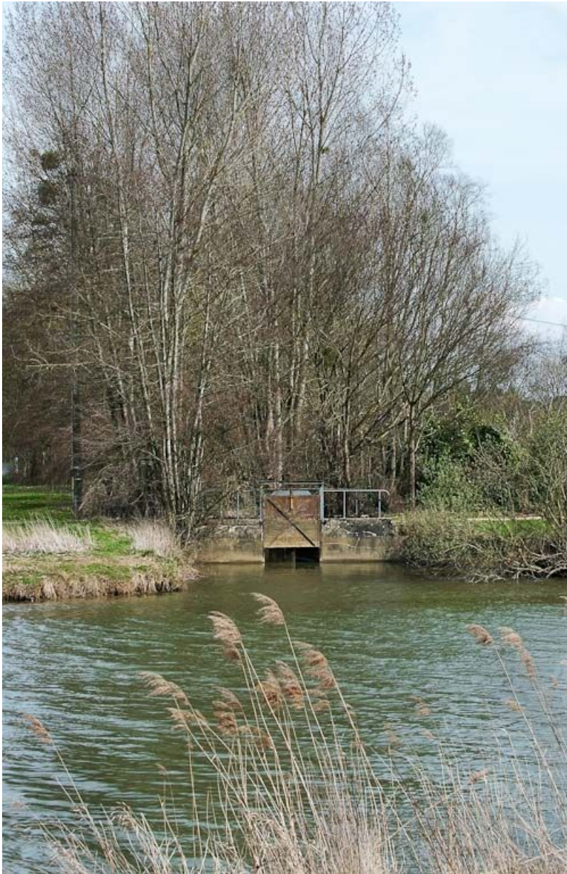
Vue d'ensemble : vanne.