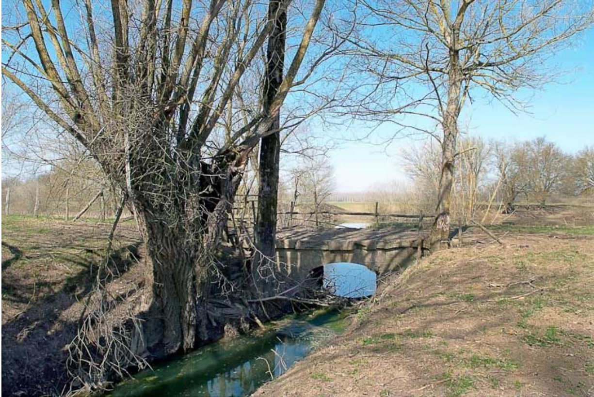
Ponceau : vue d'ensemble.

71, Sornay, lieudit : Les Andains Saint-Georges