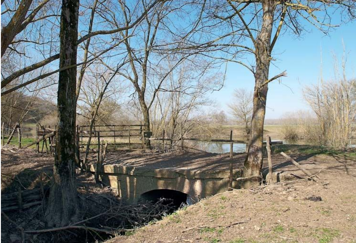
Ponceau : vue rapprochée.

71, Sornay, lieudit : Les Andains Saint-Georges