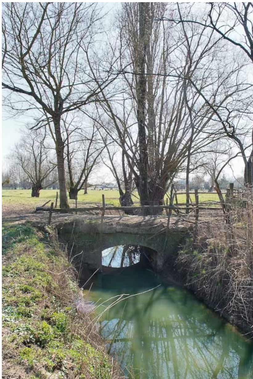
Ponceau : vue rapprochée.

71, Sornay, lieudit : Les Andains Saint-Georges