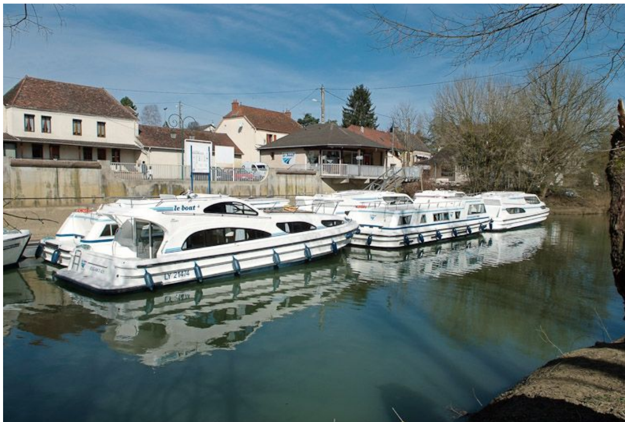
Le port de plaisance de Branges. Bateaux de plaisance. 71, Branges