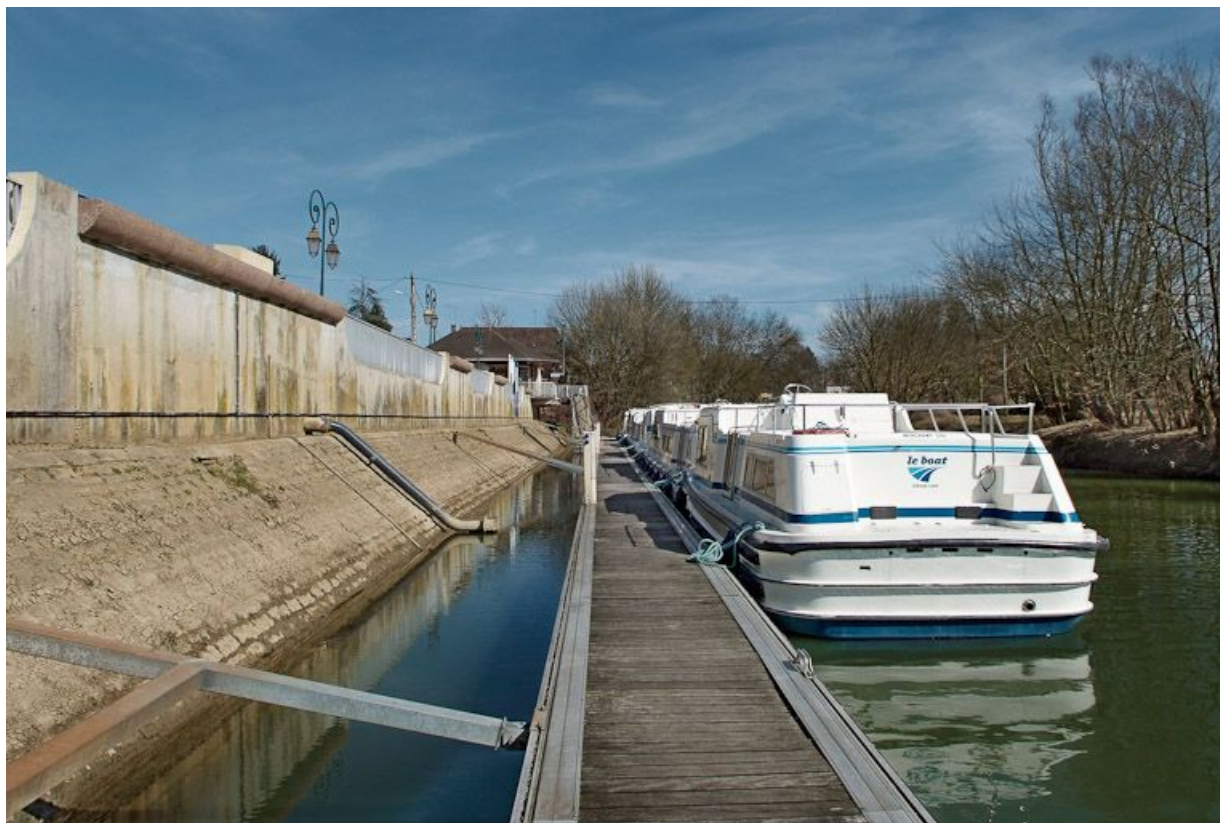
Le port de plaisance de Branges avec appontement moderne. 71, Branges