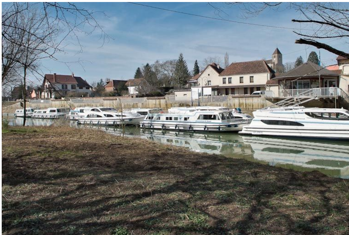
Le port de plaisance de Branges pris de la rive gauche de la Seille, avec le village en arrière-plan. Bateaux de plaisance. 71, Branges