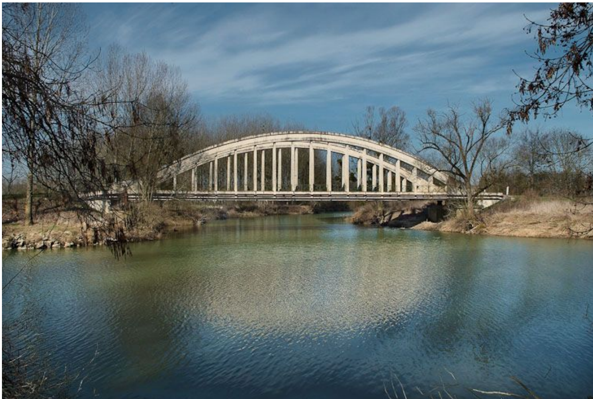
Pont de la Culée, il permet de traverser la Seille en direction de Branges.