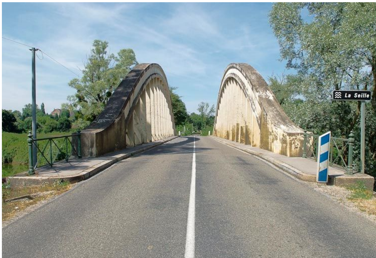
Pont de la Culée, il permet de traverser la Seille en direction de Branges. Vue rapprochée de la chaussée avec panneau "La Seille". 71, Branges, lieudit : La Culée