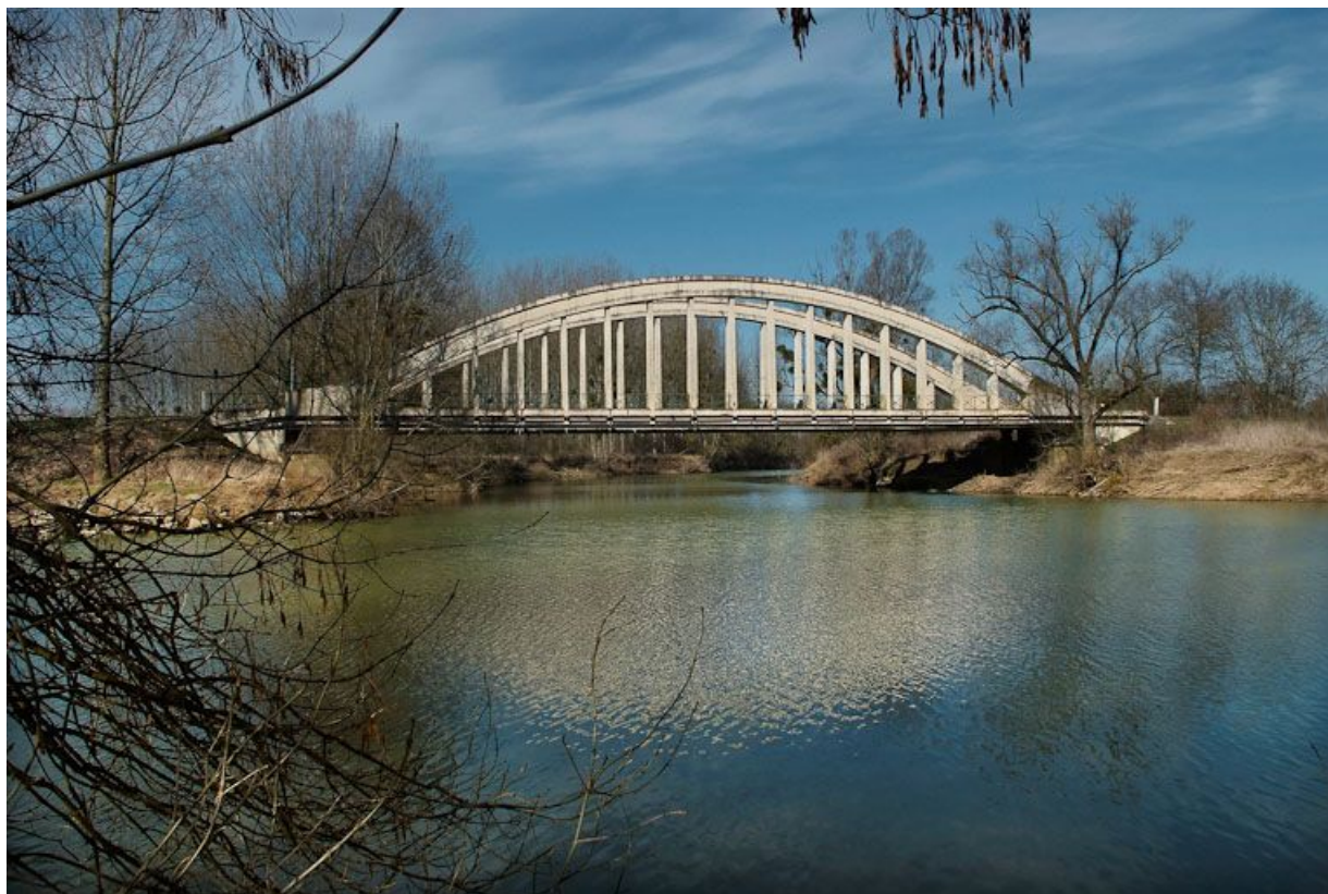
Pont de la Culée, il permet de traverser la Seille en direction de Branges.