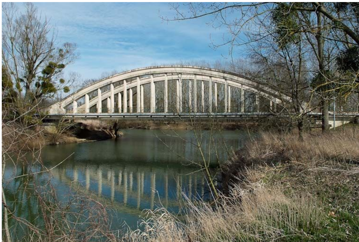
Pont de la Culée, il permet de traverser la Seille en direction de Branges.