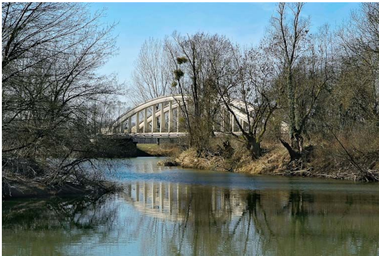
Pont de la Culée, il permet de traverser la Seille en direction de Branges.