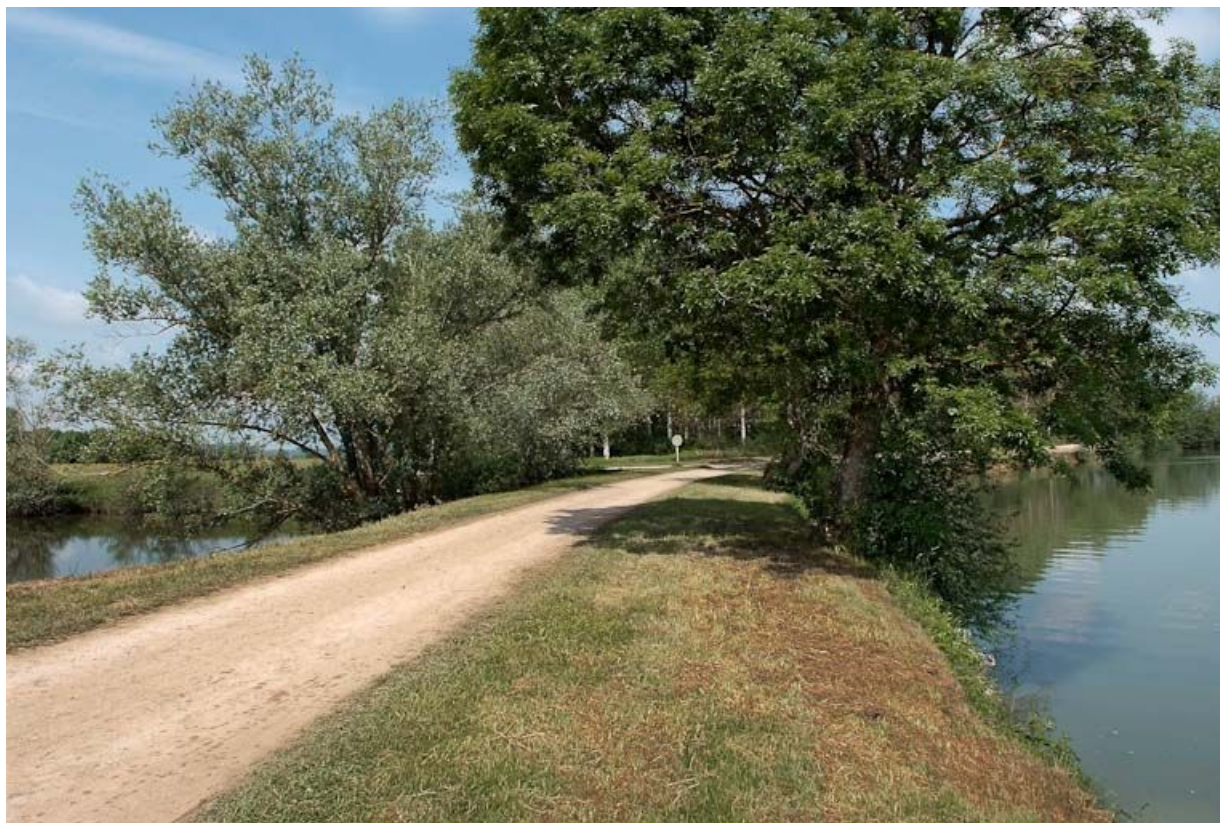
Digue aval coupant la boucle de la Grande Seugnière.