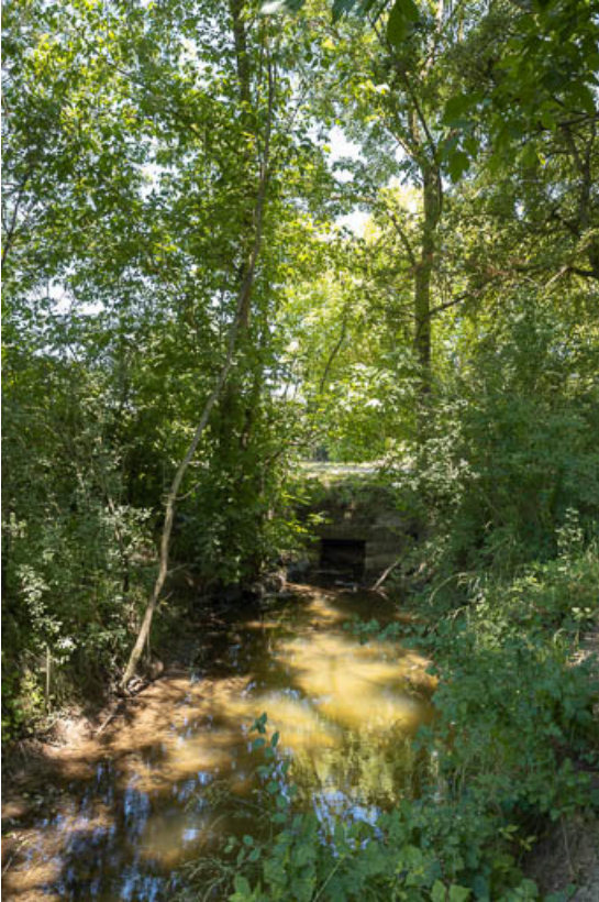
Vue de l'aqueduc.