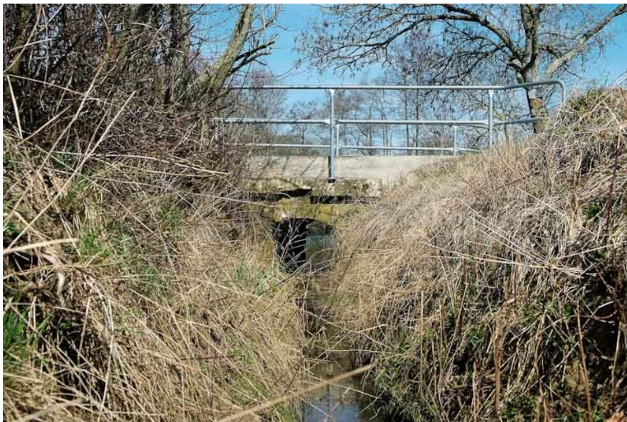
Ponceau, vue rapprochée.