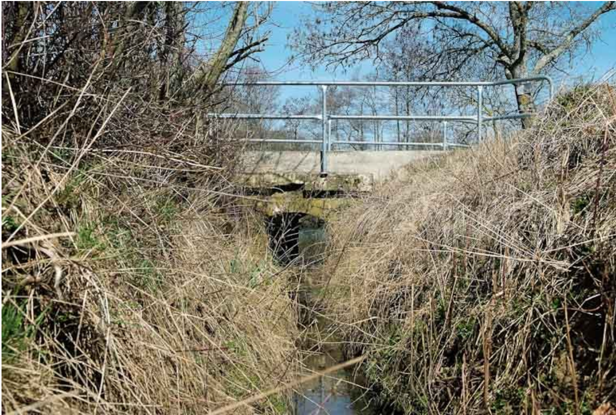
Ponceau, vue rapprochée.