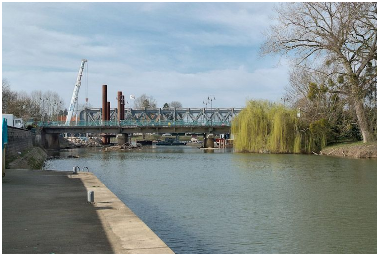
Ancien pont de chemin de fer, vu d'amont. 71, Louhans