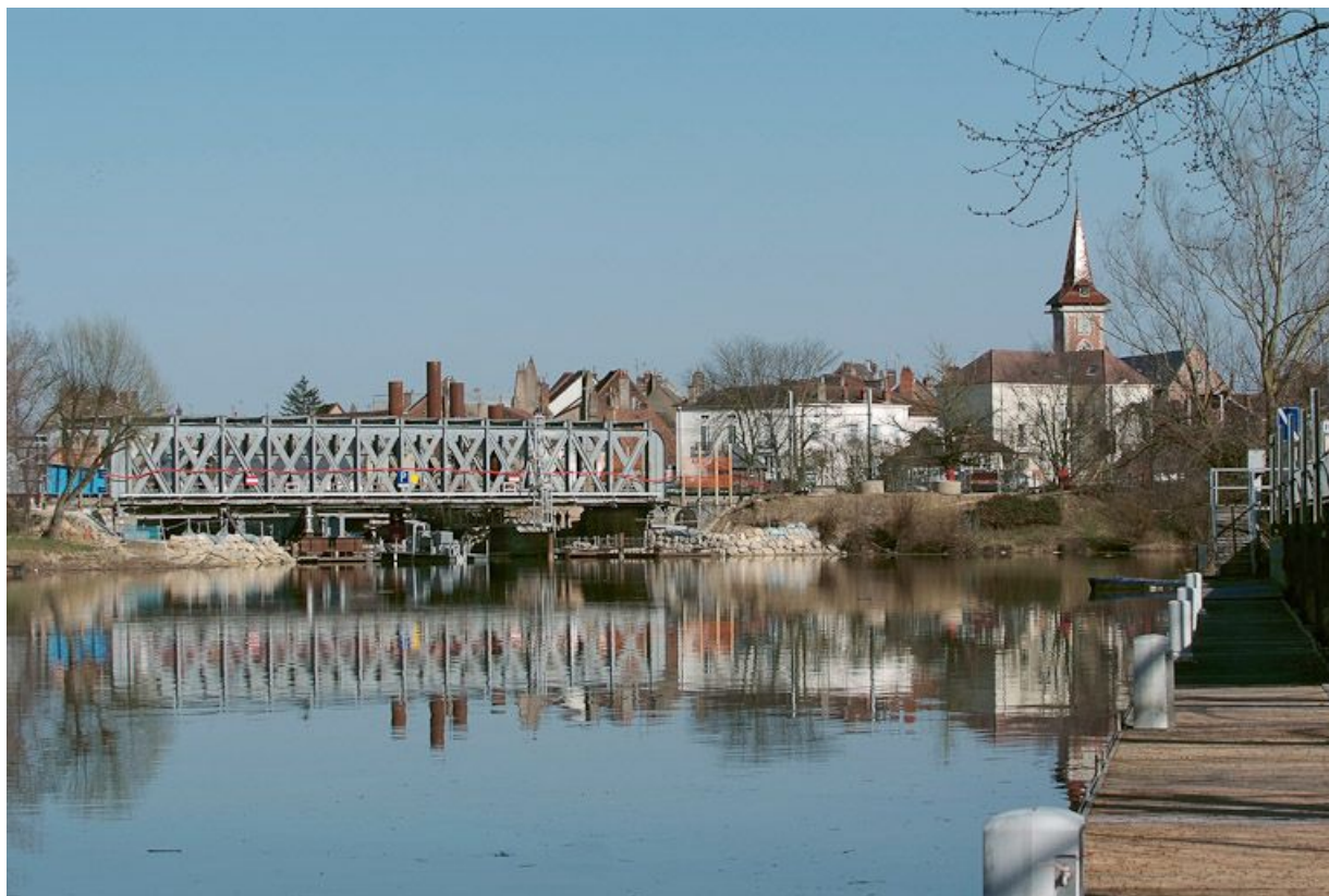
Ancien pont de chemin de fer, vu d'amont. 71, Louhans