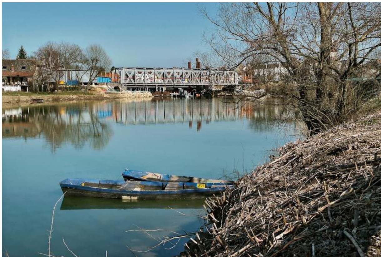
Ancien pont de chemin de fer, vu d'amont. 71, Louhans