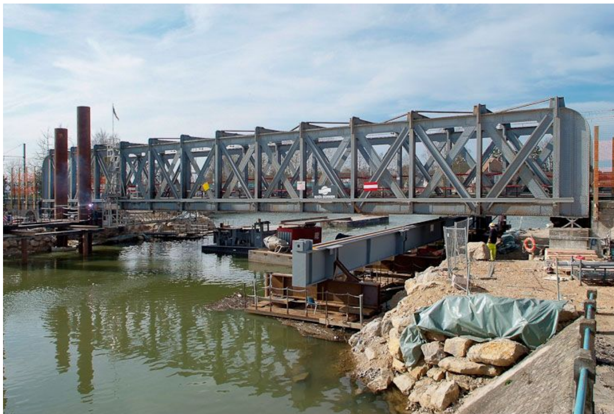
Ancien pont de chemin de fer, vue rapprochée. 71, Louhans