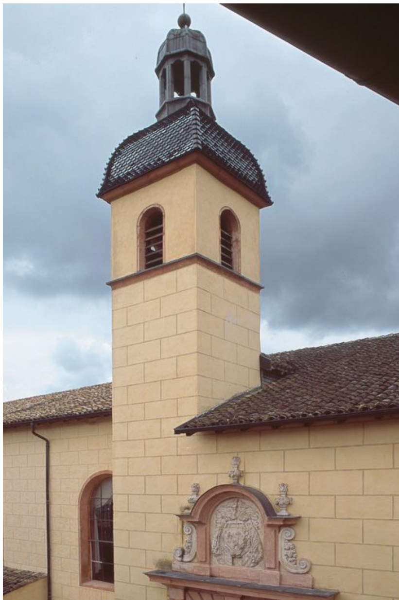
Clocher de la chapelle du Saint-Sacrement.