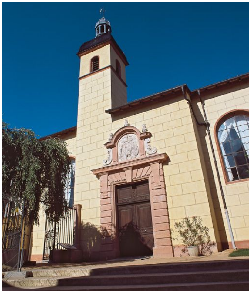
Façade de la chapelle.