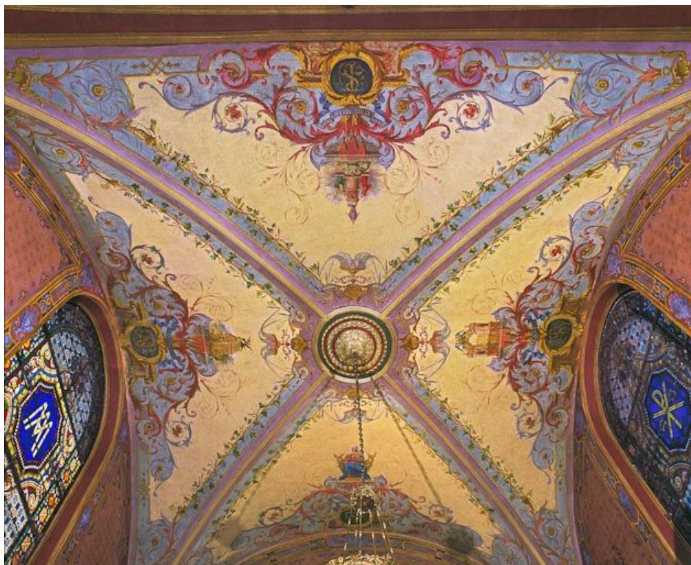
Voûte de la chapelle de la salle des soldats.