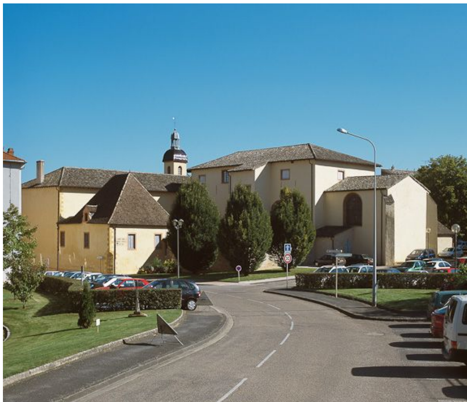
Vue d'ensemble des bâtiments depuis la rue.