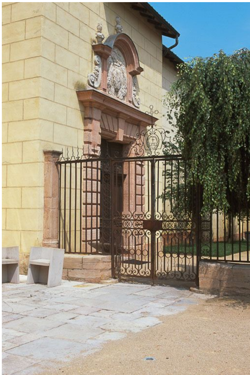
Chapelle du Saint-Sacrement : grille et porte d'entrée.