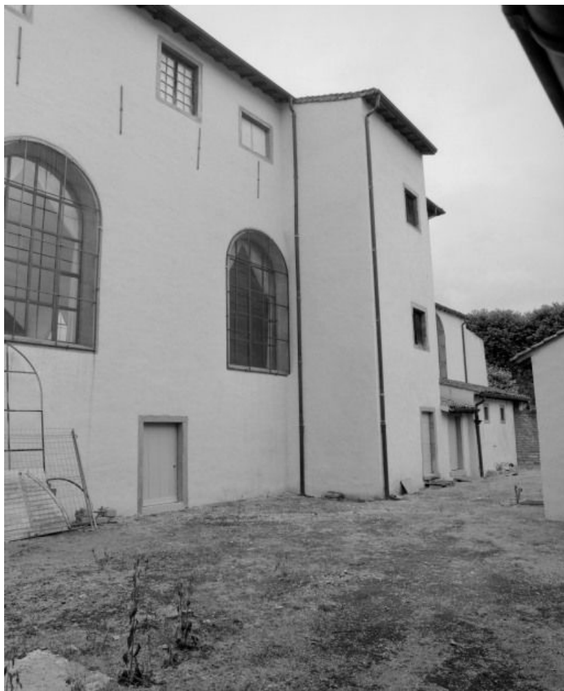
Vue d'ensemble sur la salle des soldats.