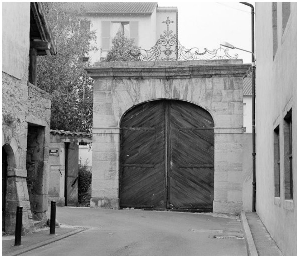
Portail d'entrée rue Jean Macé.