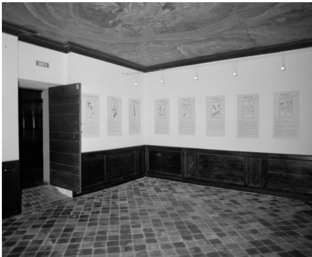
Vue d'ensemble de la salle d'histoire.