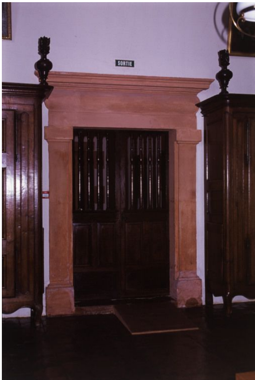
Salle des femmes, détail : porte.