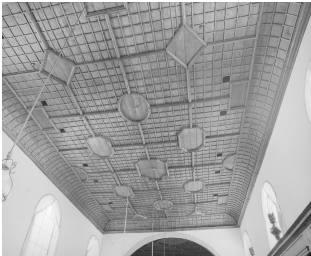
Salle des femmes, vue d'ensemble du plafond.