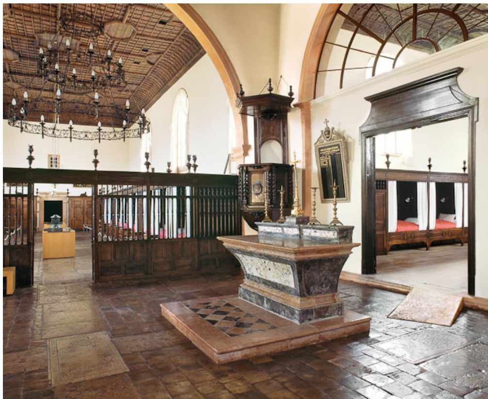
Vue d'ensemble de la chapelle du Saint-Sacrement.