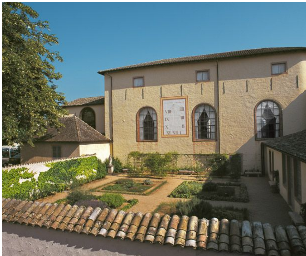
Salle des soldats, élévation sur le jardin.