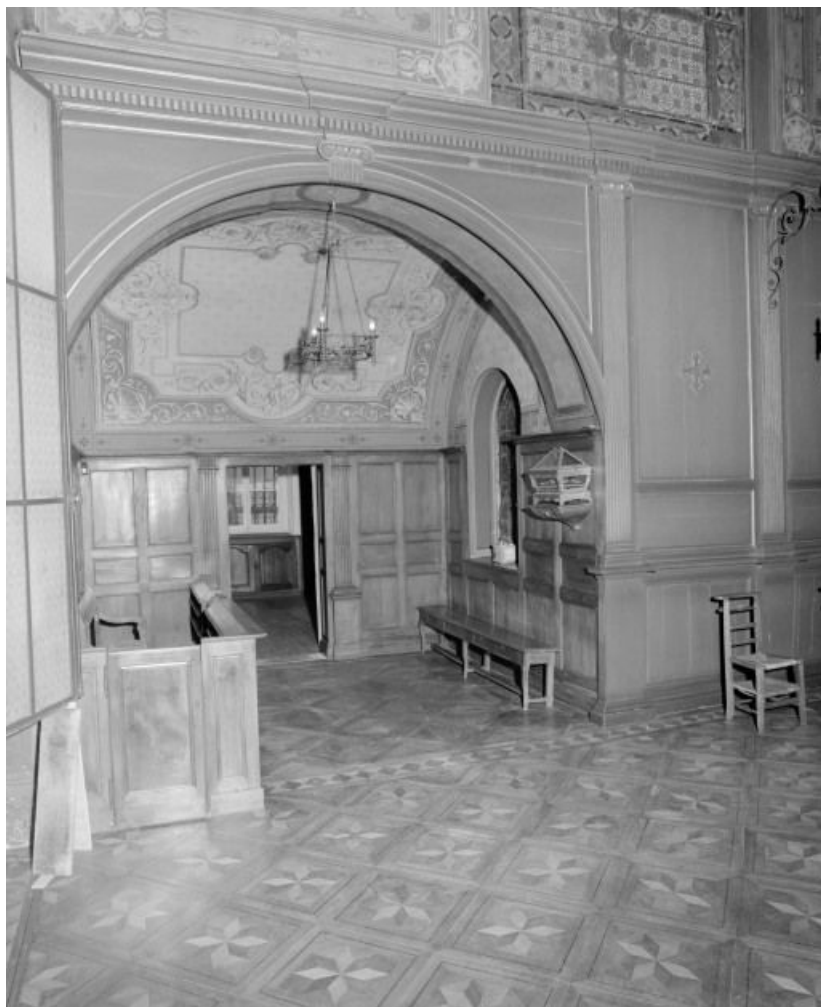
Chapelle du saint-sacrement, vue sur la chapelle latérale gauche.