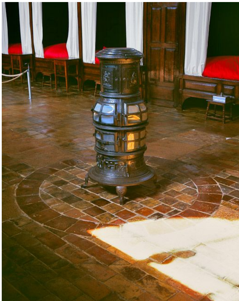
Salle des hommes, poêle de chauffage.