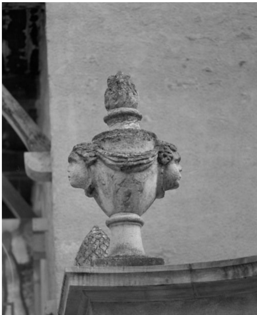
Portail d'entrée : détail d'un pot a feu.