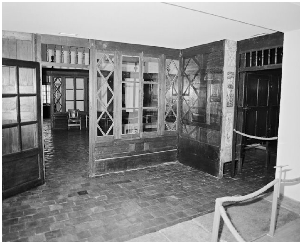
Cabinet des soeurs (salle des femmes).