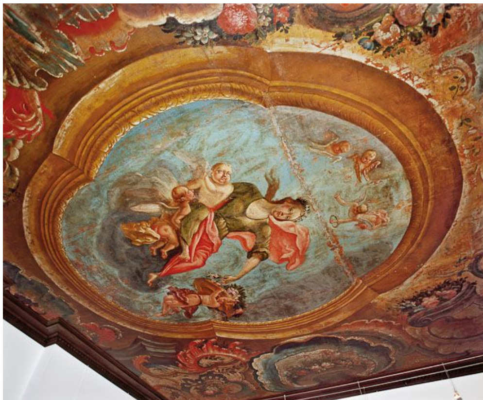
Toile peinte : la Charité (ancien plafond de l'apothicairerie).