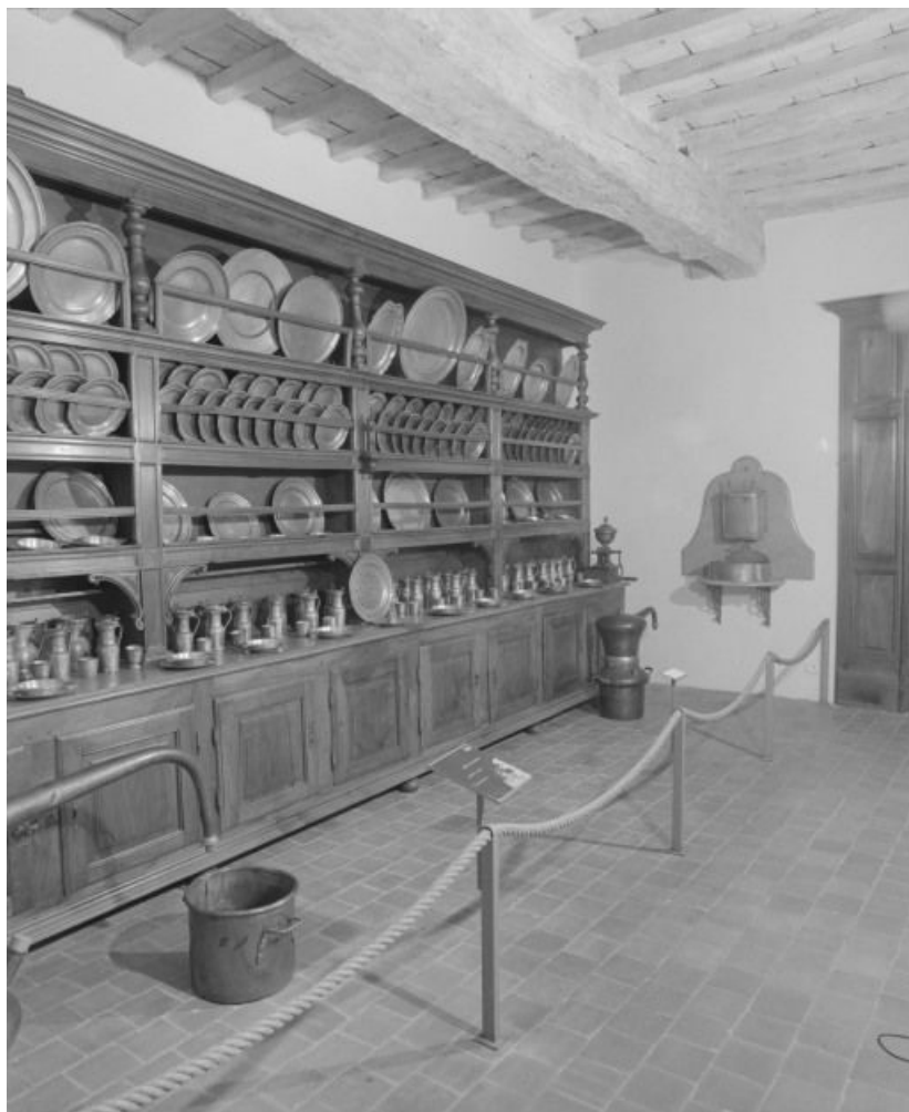
Vue d'ensemble de la salle des étains.