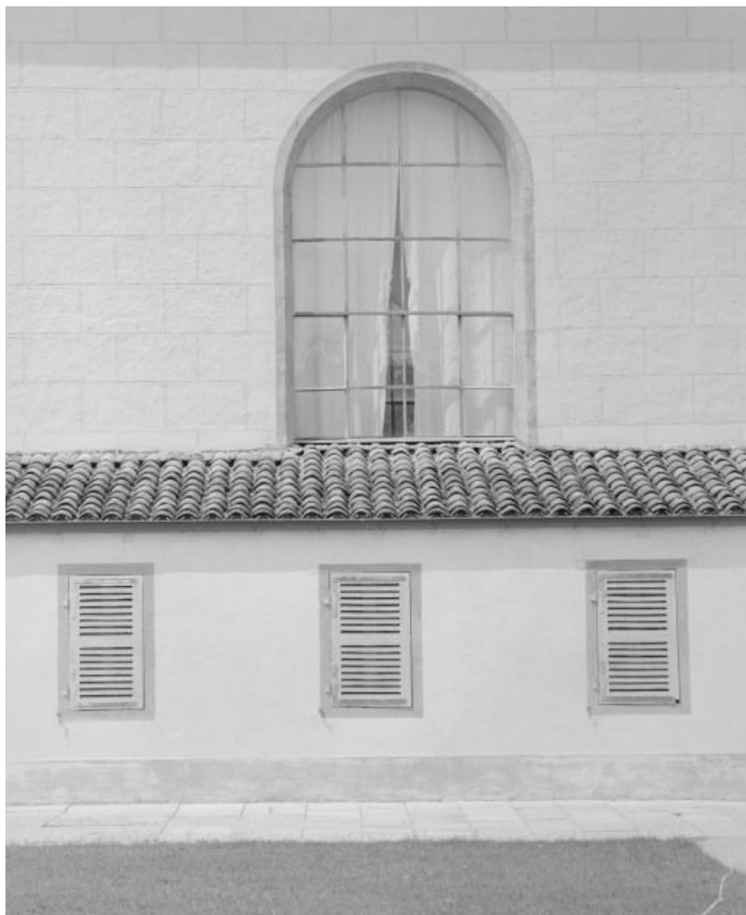
Façade de la salle des femmes, détail d'une fenêtre.