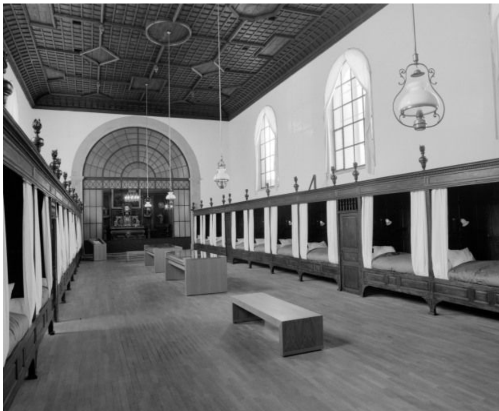
Vue d'ensemble de la salle des soldats.