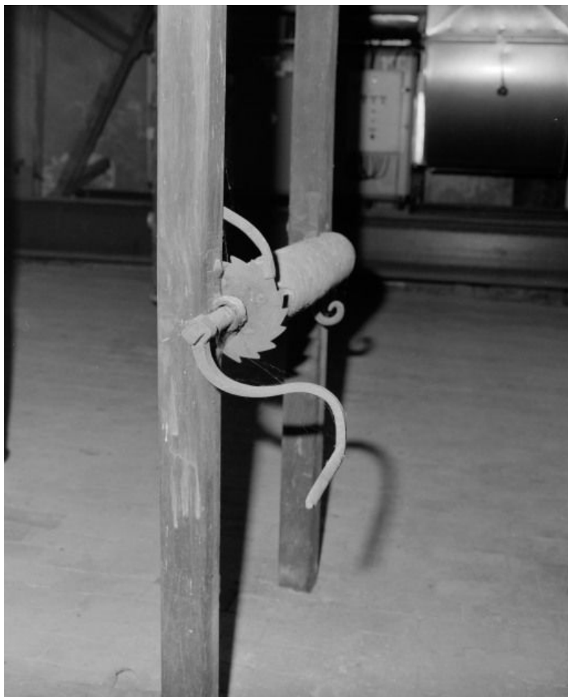
Manivelle de la machinerie pour le linge, se trouvant dans les combles.