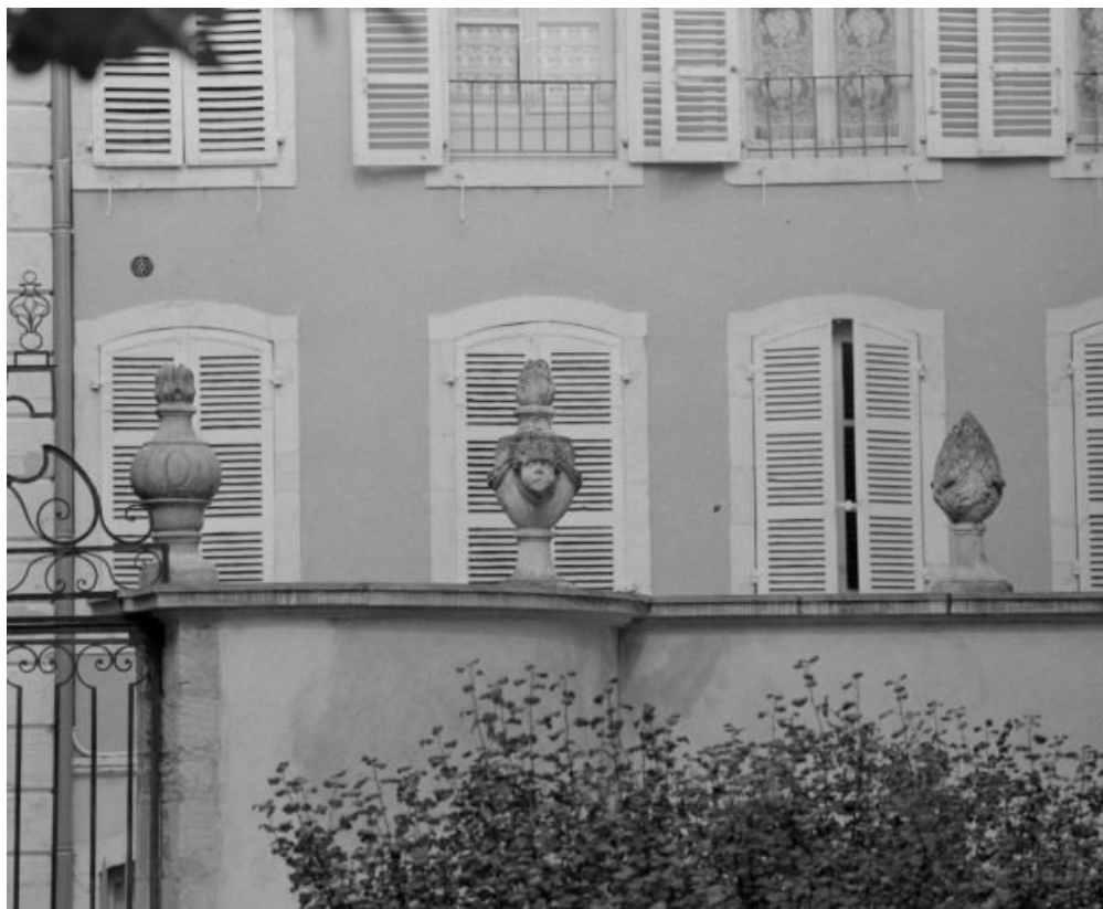
Portail d'entrée : détail des pots à feu.