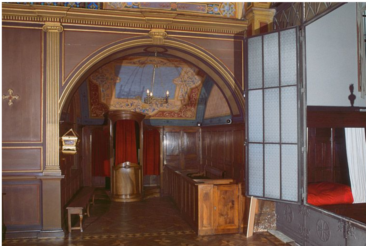
Chapelle latérale droite de la chapelle de la salle des soldats.