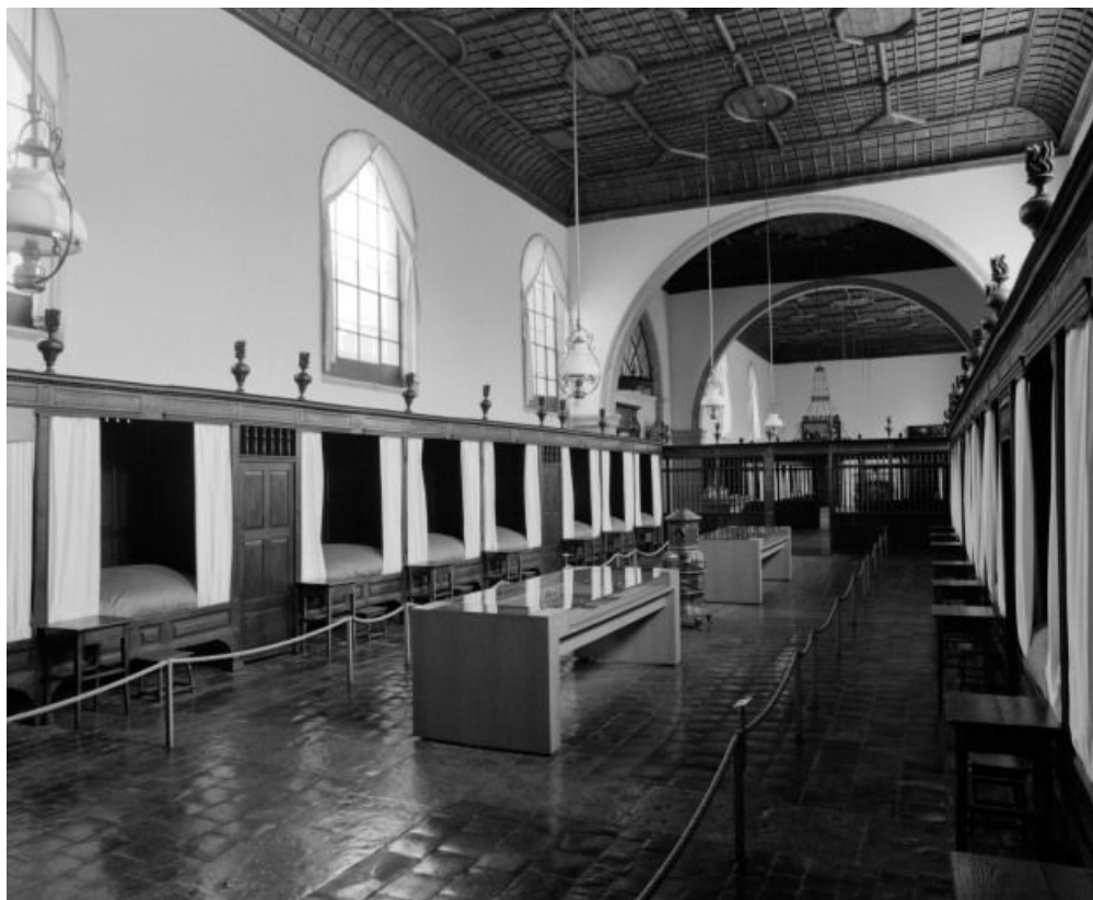
Vue d'ensemble de la salle des femmes.