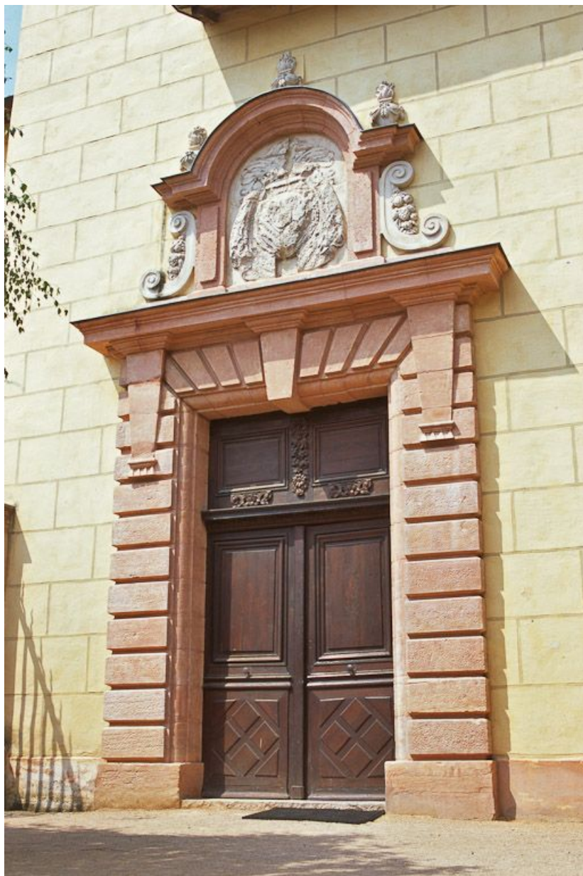
Chapelle du Saint-Sacrement, porte d'entrée.