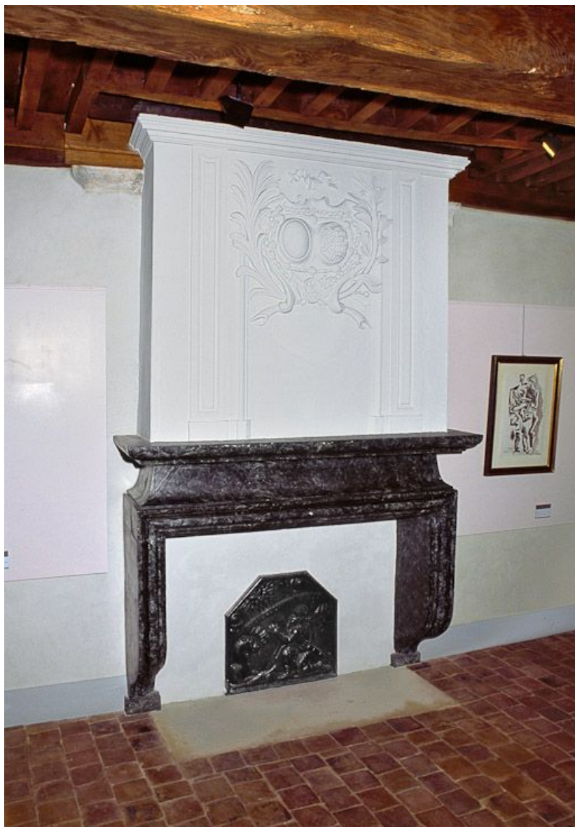
Cheminée de l'ancienne salle du Conseil située au premier étage.