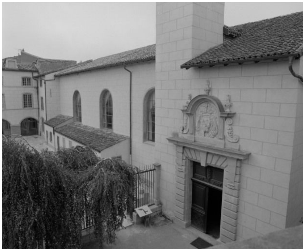
Vue sur la façade, de la salle des femmes.