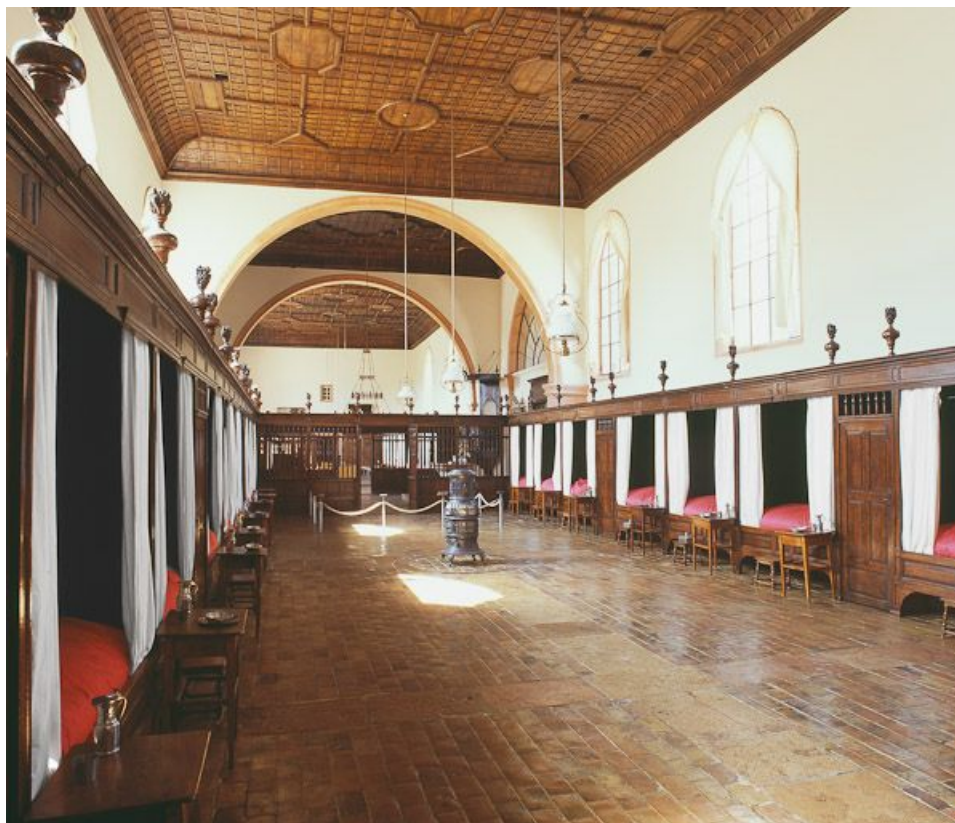
Salle des hommes vue d'ensemble.