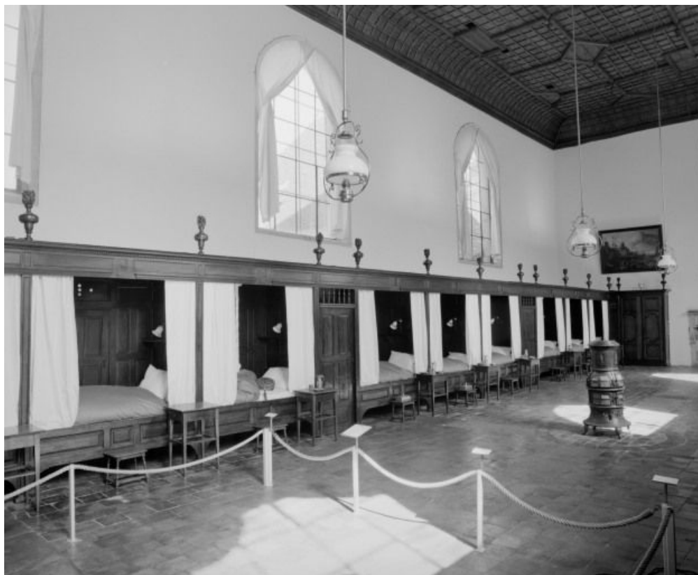
Vue d'ensemble de la salle des hommes.