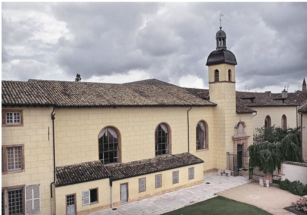
Salle des femme, élévation sur le jardin.