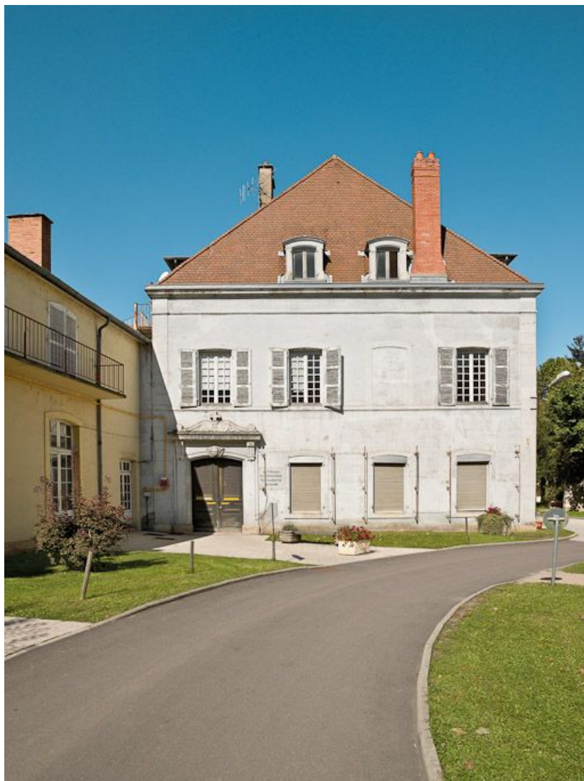
Bâtiment en L, mur de croupe sud.