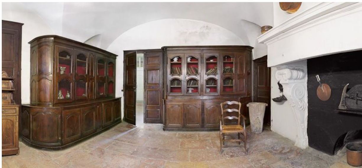
Bâtiment en L, ancienne cuisine.