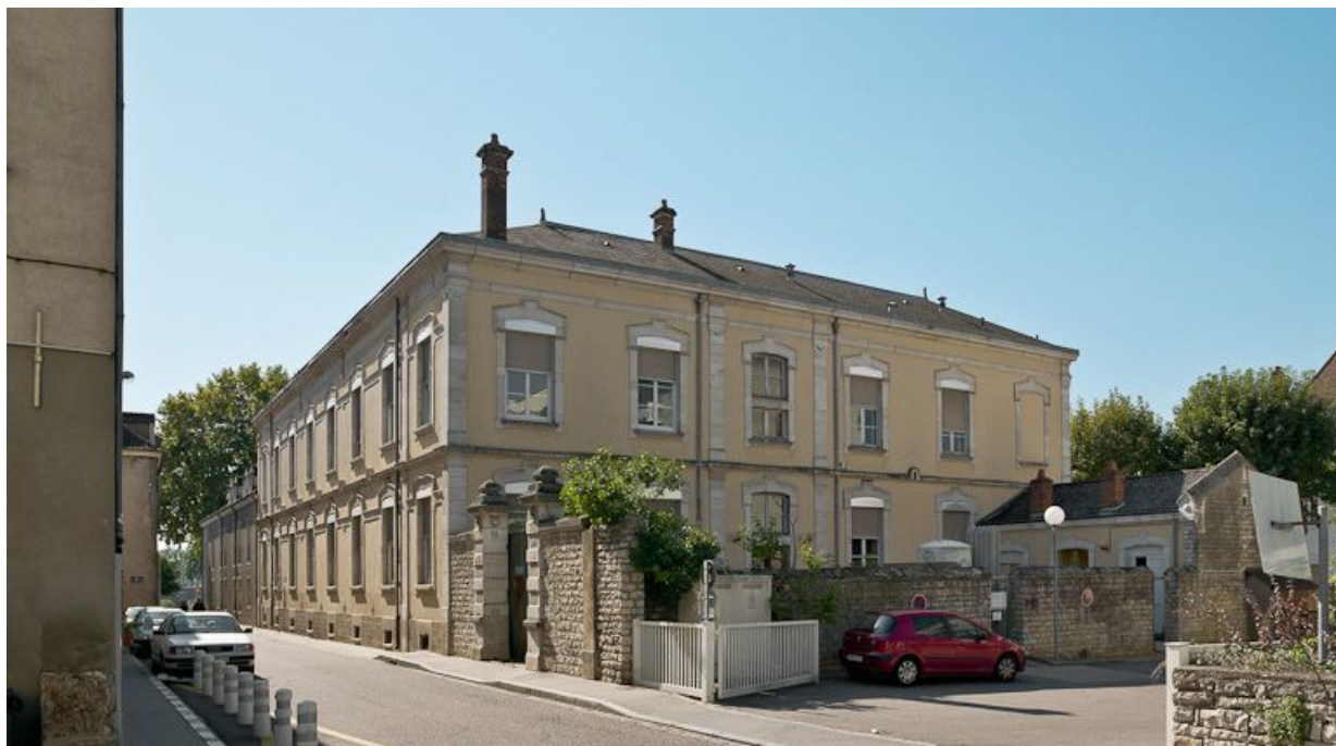
Bâtiment en U, élévation sur la rue de Traves. 71, Chalon-sur-Saône, 3 rue de Traves