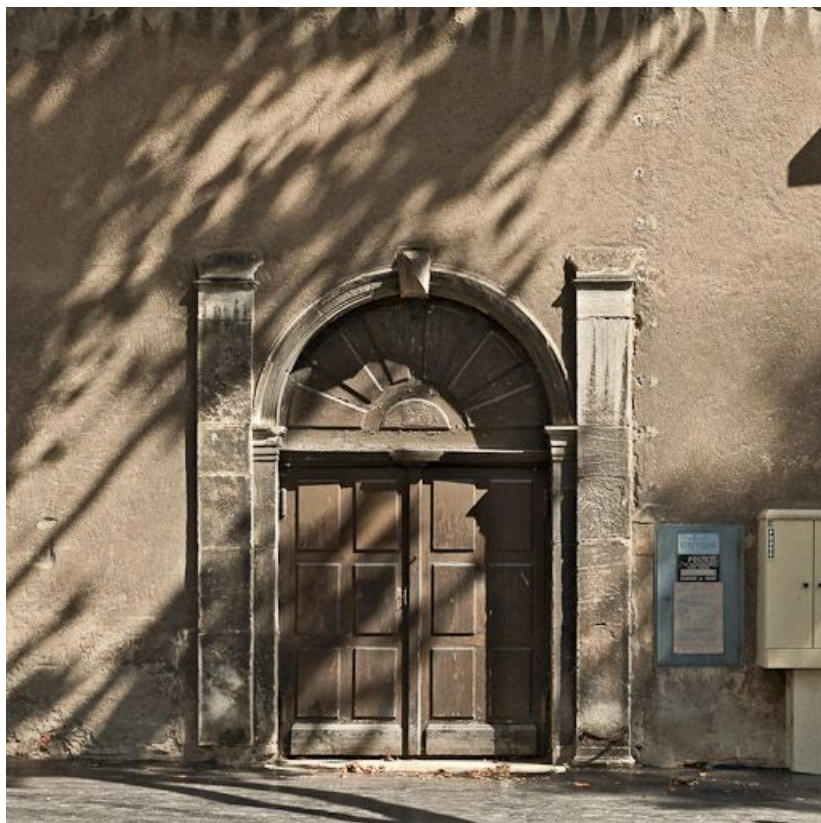
Portail de l'ancienne chapelle dans le mur de clôture du côté du rempart Sainte-Marie. 71, Chalon-sur-Saône, 3 rue de Traves

N° de l'illustration : 20107100693NUC4AQ