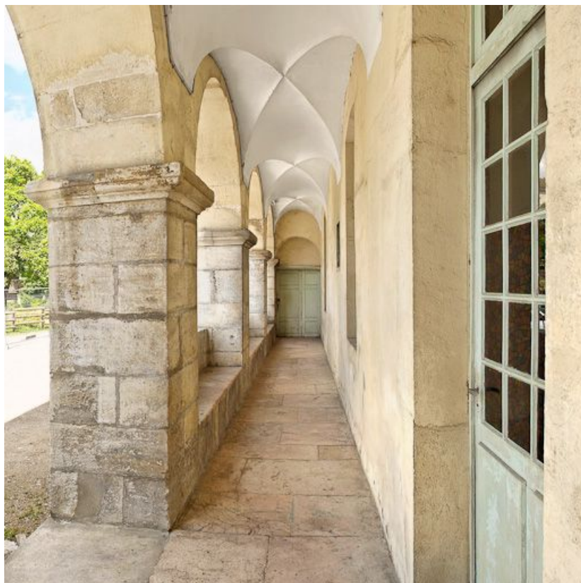
Bâtiment en L, vue de la galerie nord.