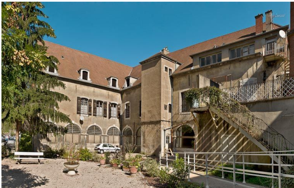
Bâtiment en L, élévations sur la petite cour sud-ouest.