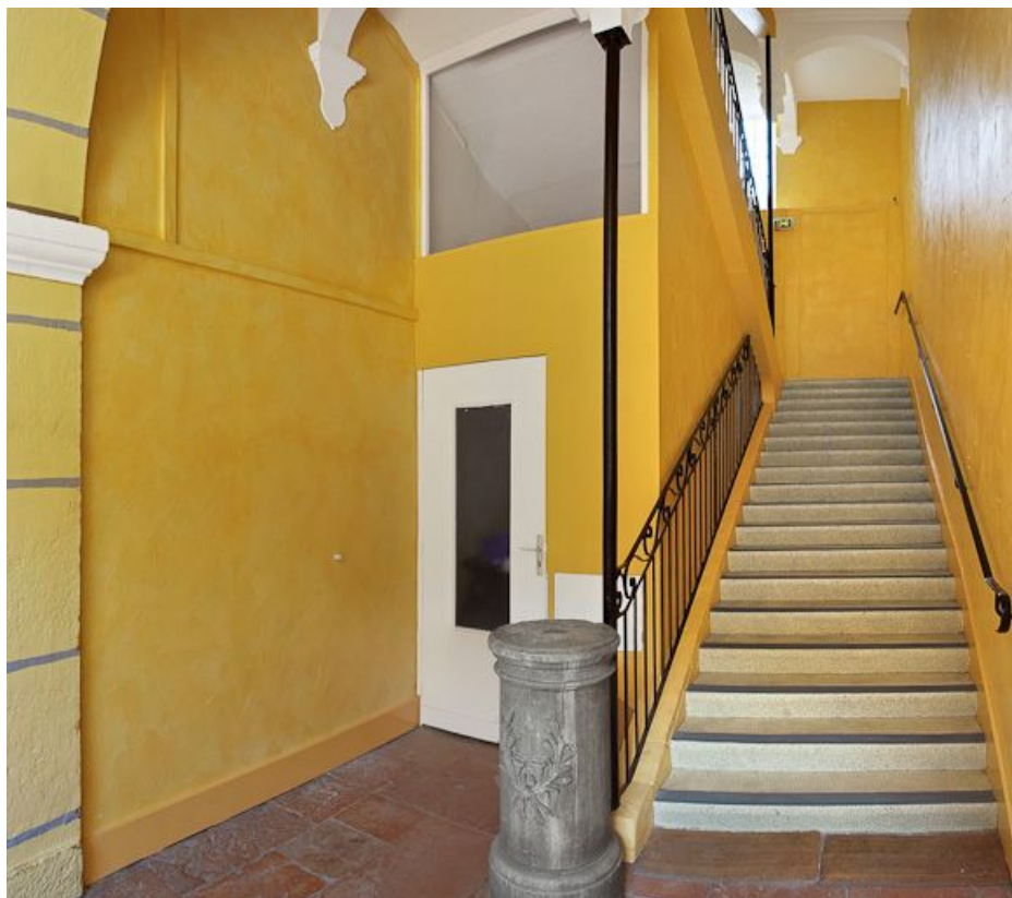
Bâtiment en L, escalier rampe sur rampe. 71, Chalon-sur-Saône, 3 rue de Traves

N° de l'illustration : 20107101068NUC2AQ