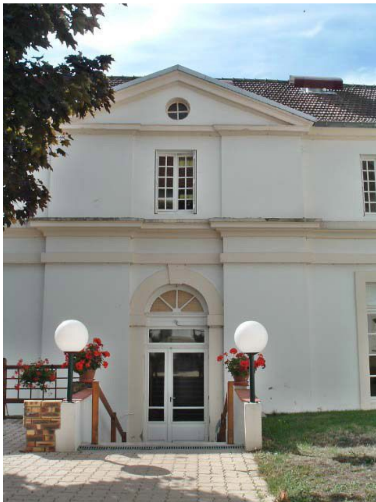
Bâtiment Dalivert (1781-1784), vue rapprochée de la façade antérieure, avant-corps central. 71, Montcenis Eglise