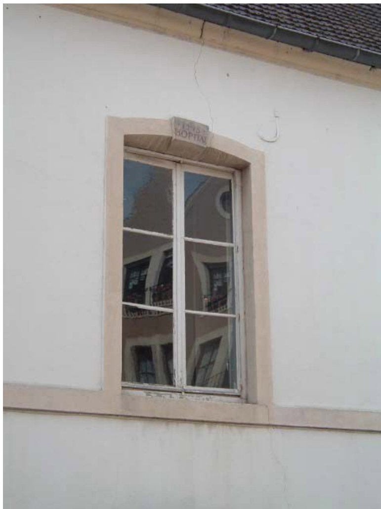
Bâtiment Caristie (vers 1752), vue de détail de la façade antérieure, fenêtre portant l'inscription JHS, HOPITAL. 71, Montcenis Eglise