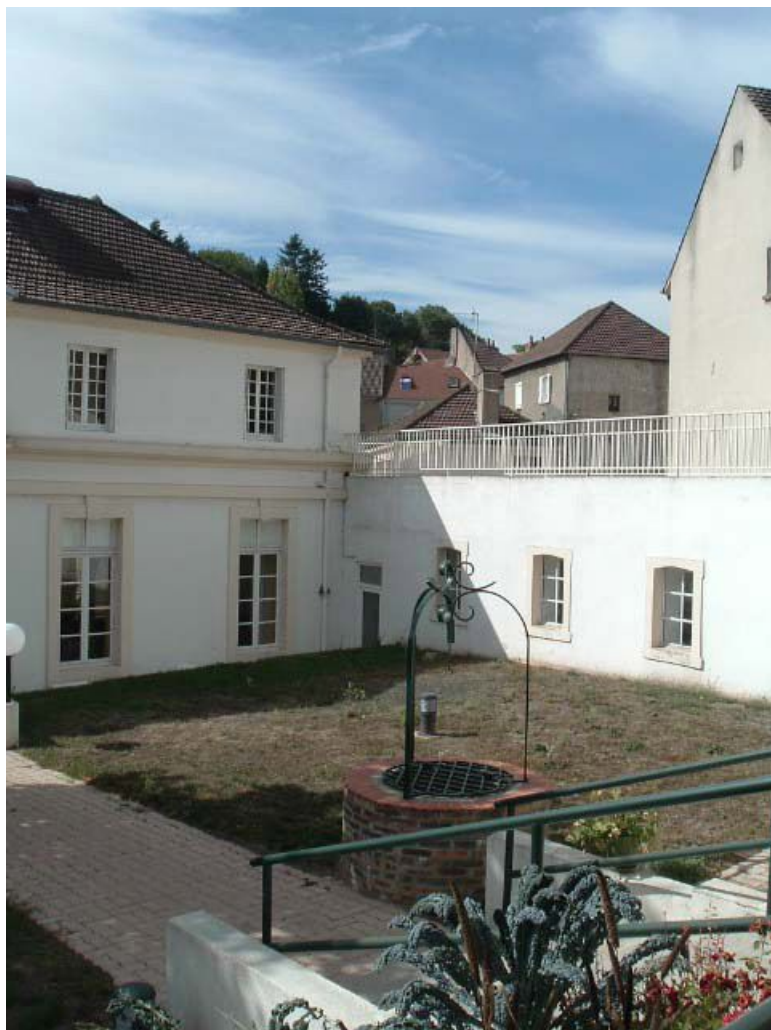
Bâtiment Dalivert (1781-1784), vue partielle de la façade antérieure depuis le bâtiment Caristie (vers 1752), jardin et galerie de liaison contemporaine.