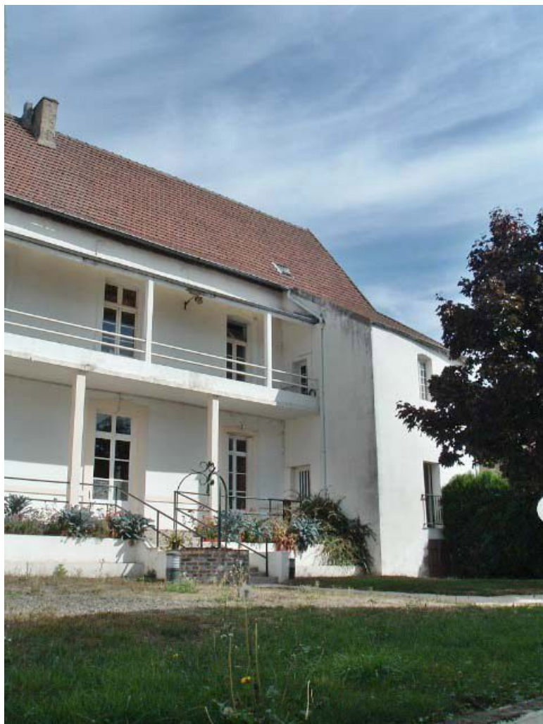
Bâtiment ancien Caristie (vers 1752), façade postérieure sur le jardin, remaniée et aile en retour droite. 71, Montcenis Eglise