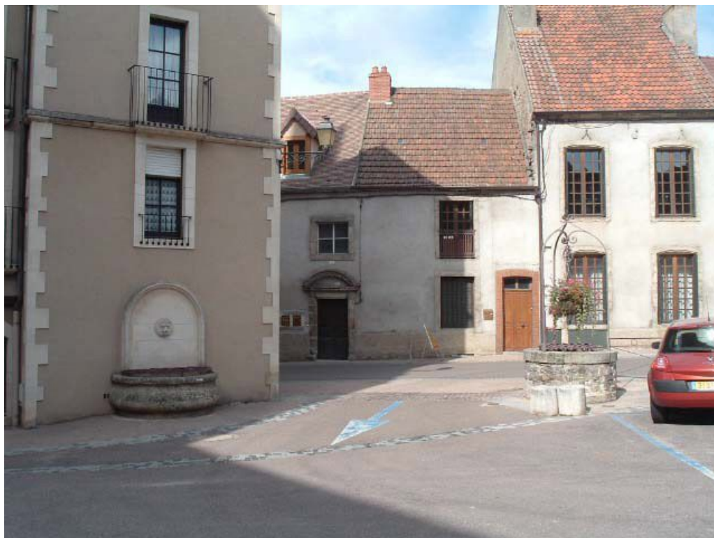
Place de l'église et maison appartenant à l'hôpital, aile droite de l'hôpital, bâtiment ancien Caristie, vers 1752, extension 1788. 71, Montcenis Eglise