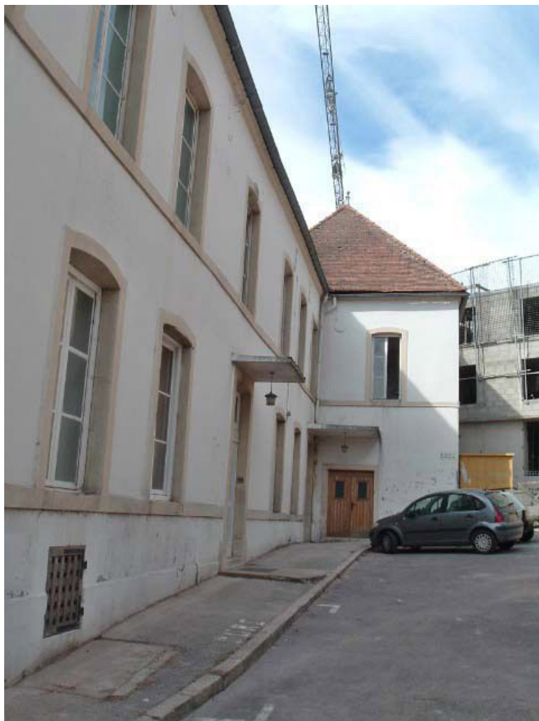
Vue générale latérale de la façade antérieure du bâtiment Caristie (vers 1752). 71, Montcenis Eglise