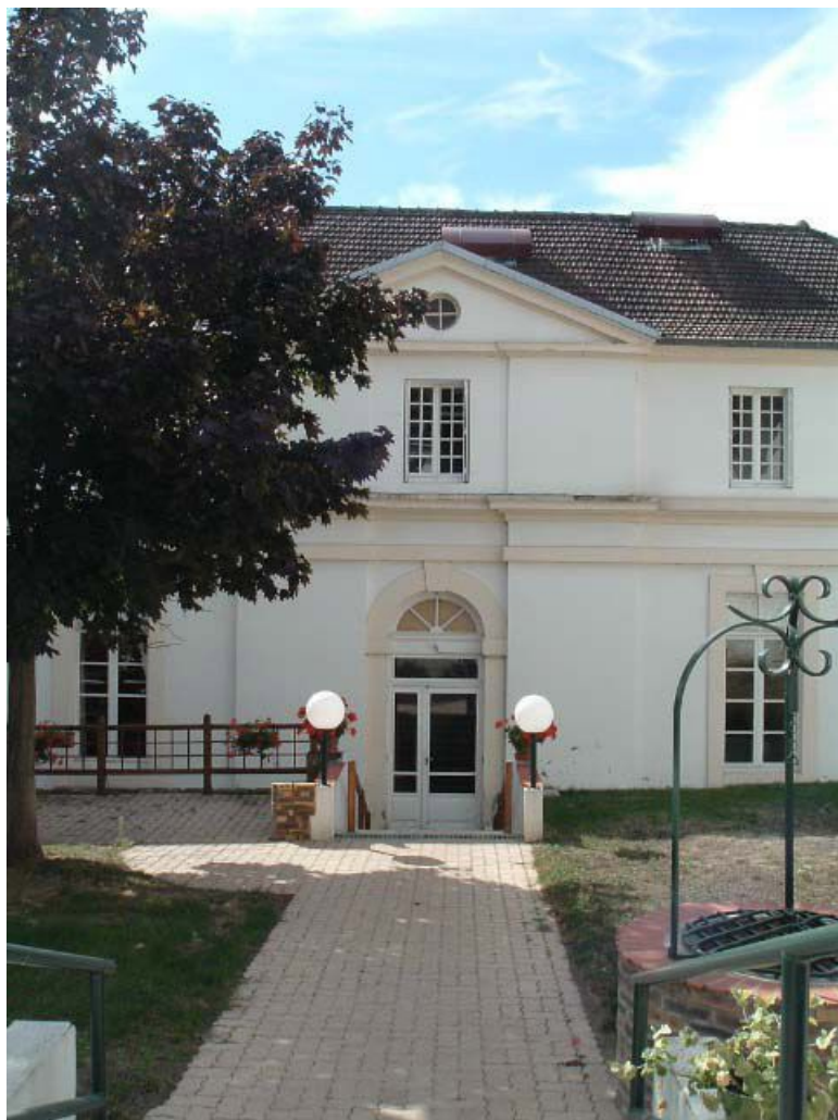
Bâtiment Dalivert (1781-1784), vue partielle de la façade antérieure, avant-corps central. 71, Montcenis Eglise