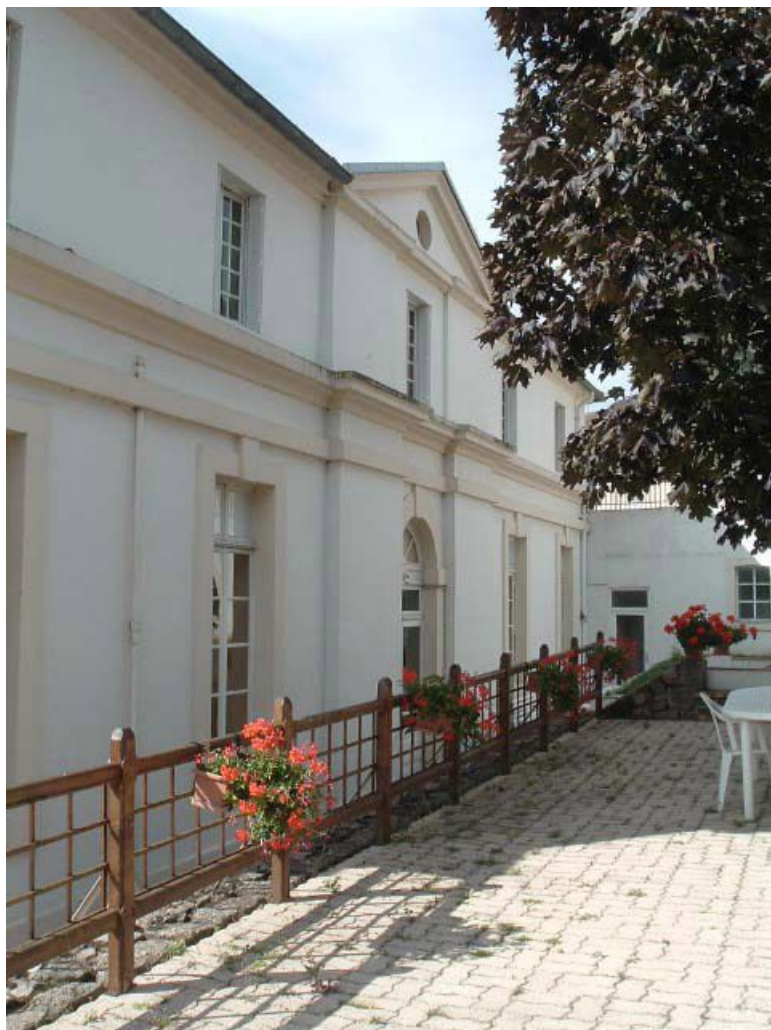
Bâtiment Dalivert (1781-1784), façade antérieure, vue générale latérale, depuis la terrasse du jardin contemporain. 71, Montcenis Eglise