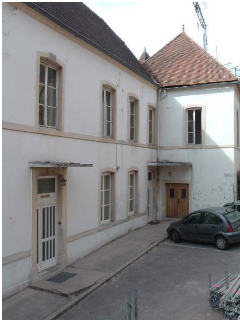
Bâtiment Caristie (vers 1752), vue partielle latérale de la façade antérieure. 71, Montcenis Eglise