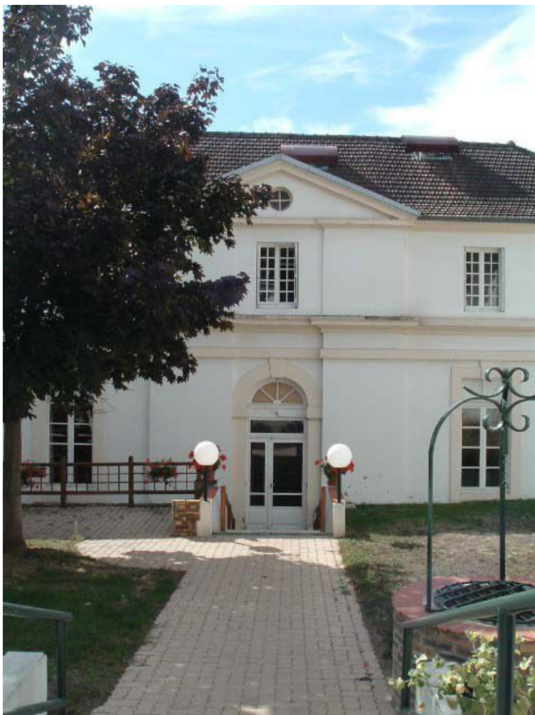
Bâtiment Dalivert (1781-1784), vue partielle de la façade antérieure, avant-corps central. 71, Montcenis Eglise