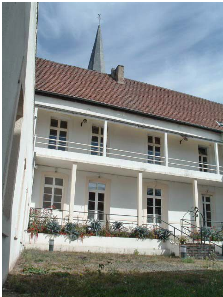
Bâtiment ancien Caristie (vers 1752), façade postérieure sur le jardin (remaniée) et galerie de liaison contemporaine. 71, Montcenis Eglise