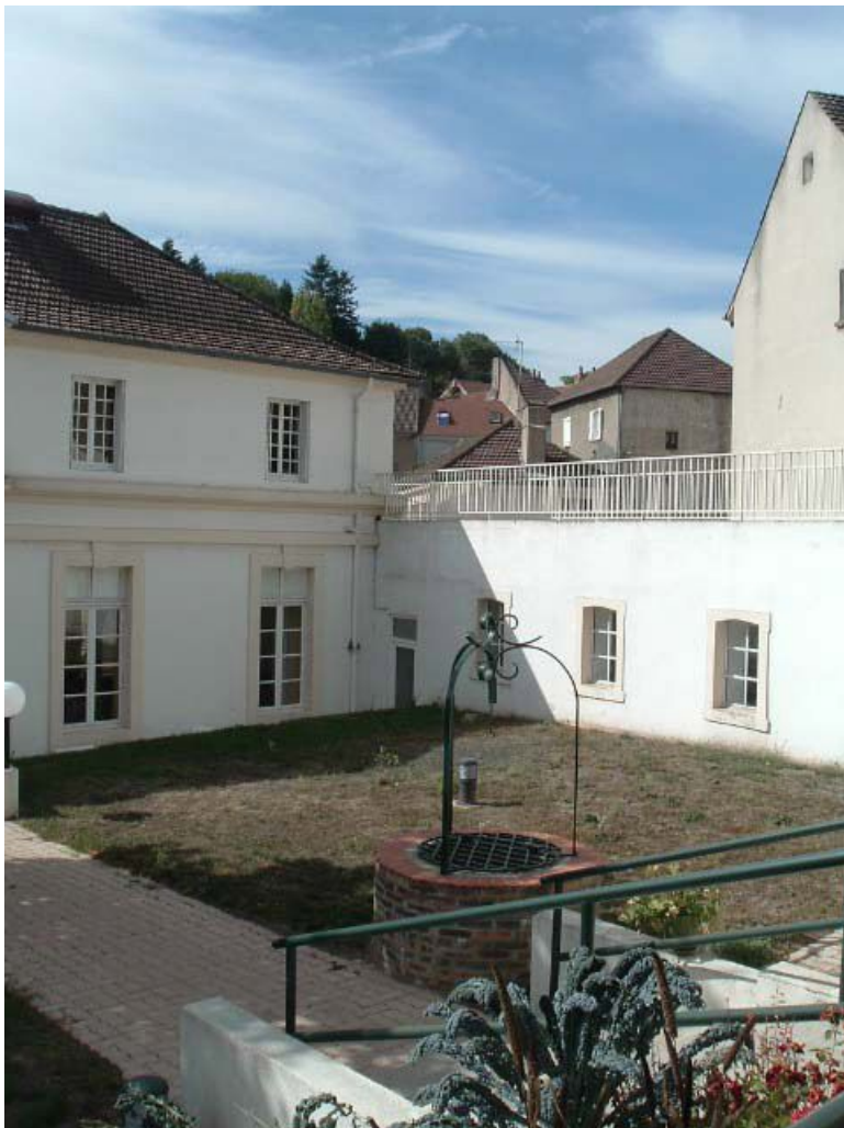
Bâtiment Dalivert (1781-1784), vue partielle de la façade antérieure depuis le bâtiment Caristie (vers 1752), jardin et galerie de liaison contemporaine.