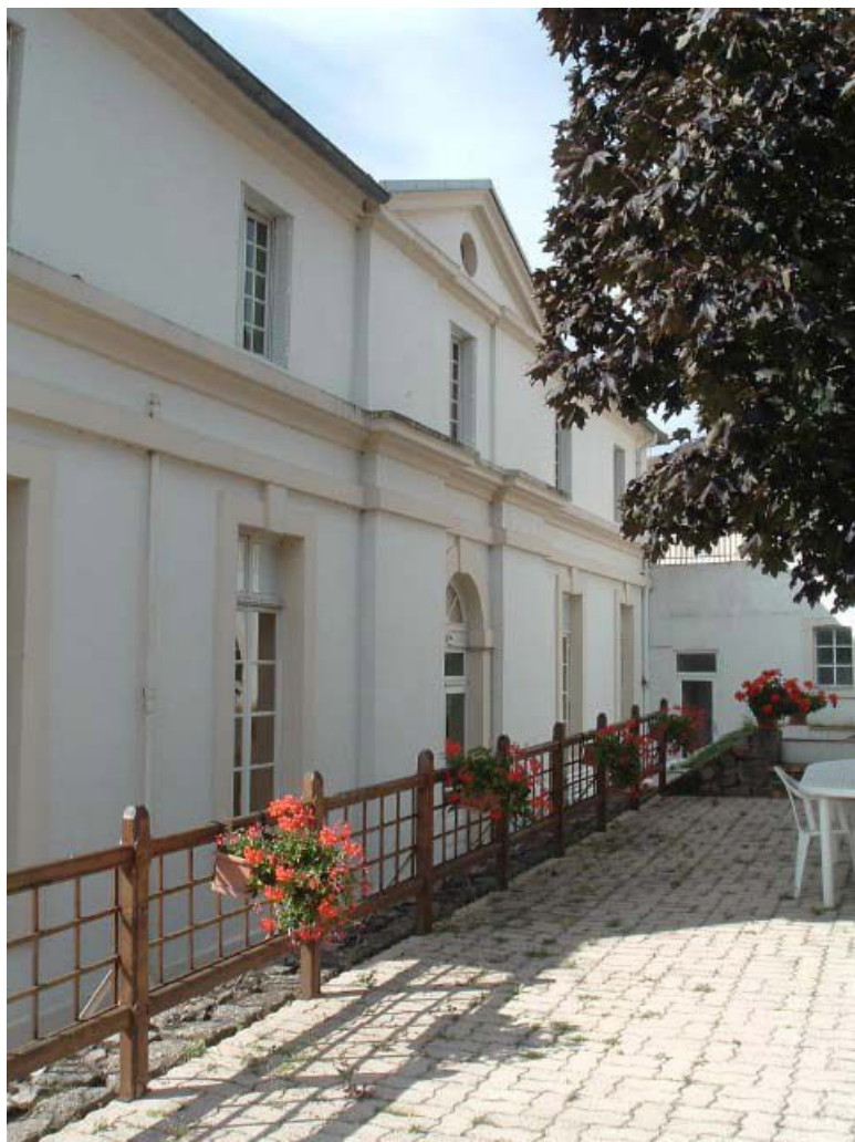
Bâtiment Dalivert (1781-1784), façade antérieure, vue générale latérale, depuis la terrasse du jardin contemporain. 71, Montcenis Eglise