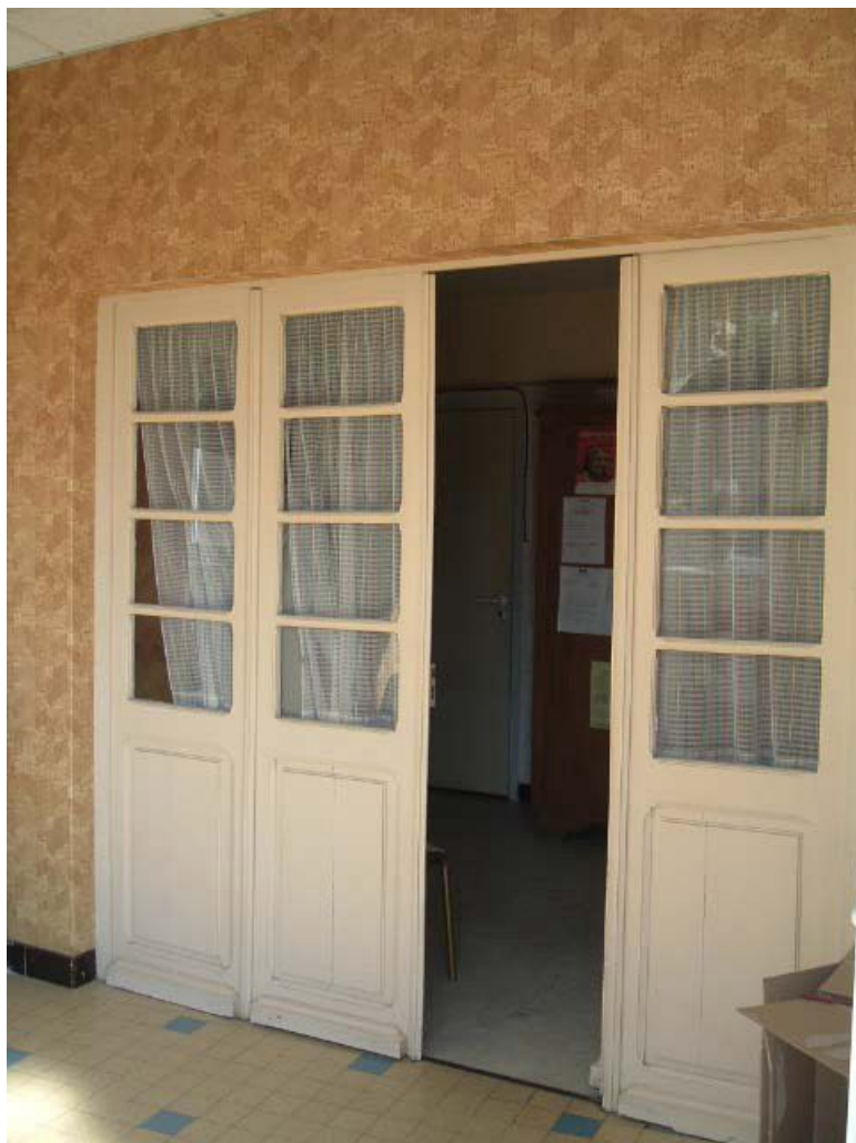
Vue intérieure, détail, porte vitrée à panneaux pleins et petits bois.