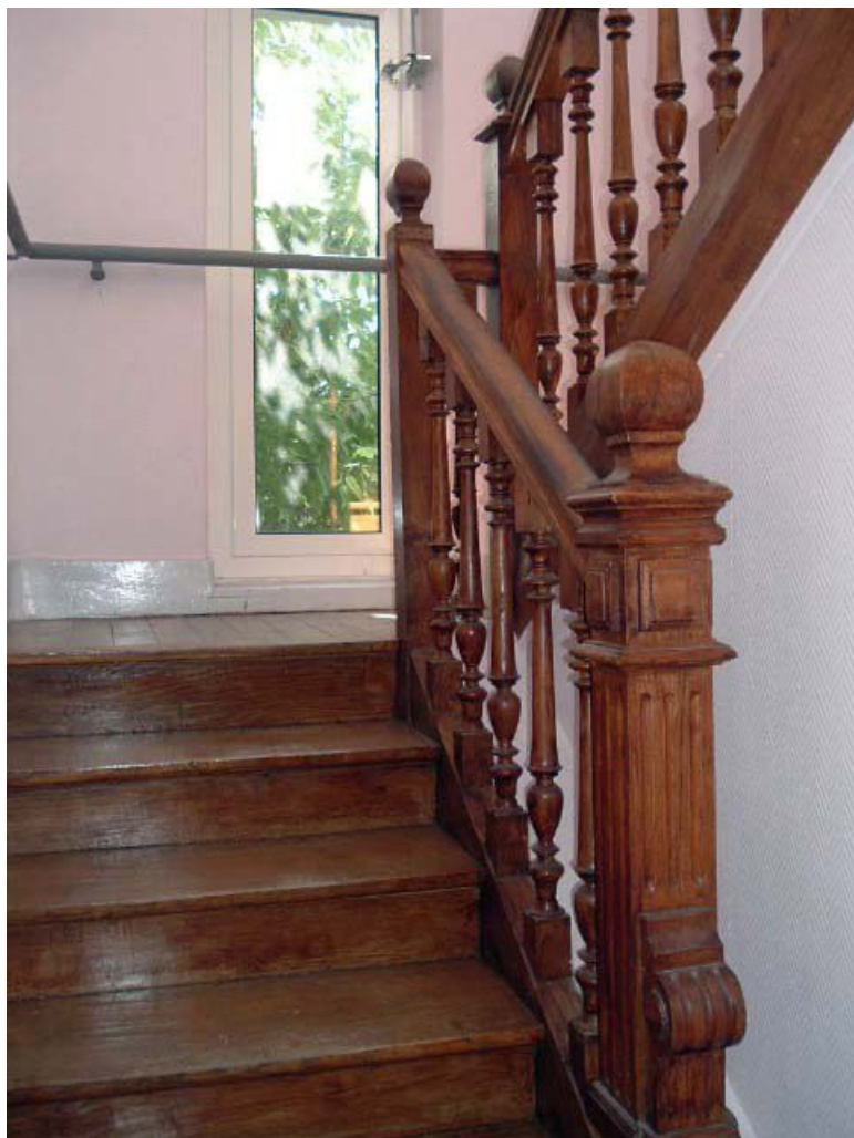
Vue de l'ancien escalier, bois tourné et sculpté.