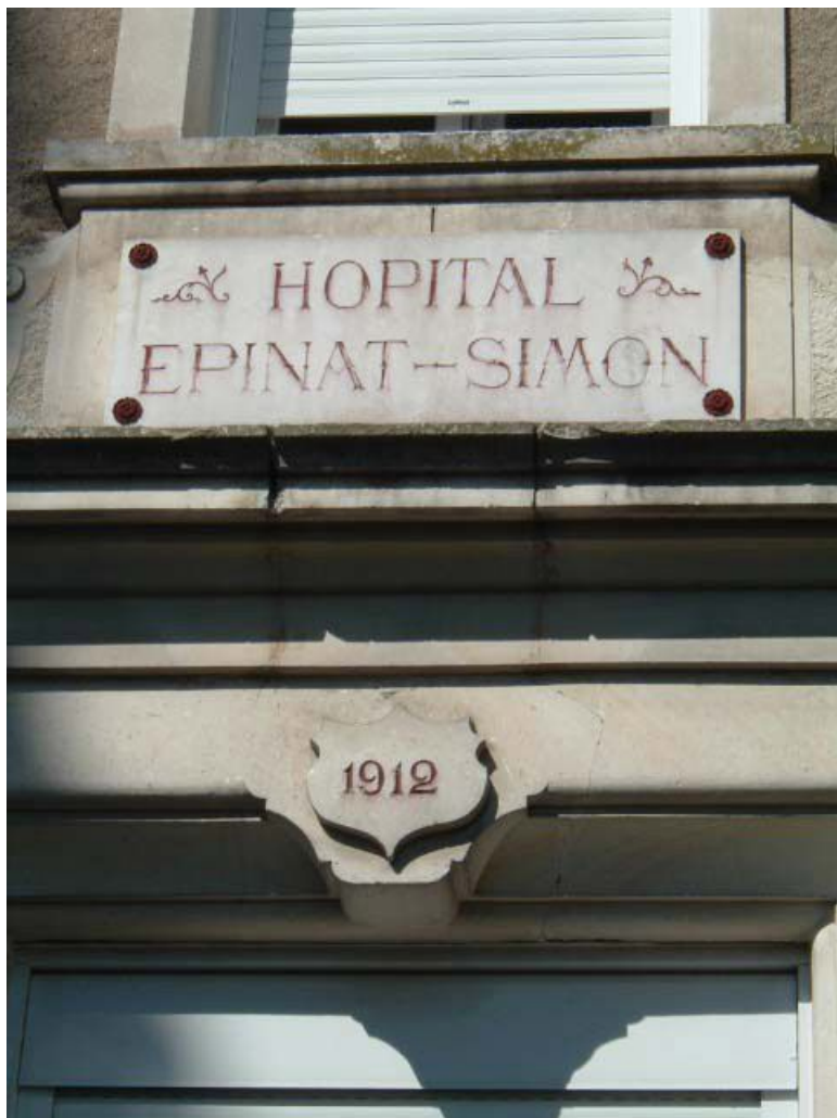
Vue de détail de la façade latérale, portant l'inscription "HOPITAL EPINAT-SIMON 1912". 71, Issy-l'Évêque, 7 rue des Emigrés