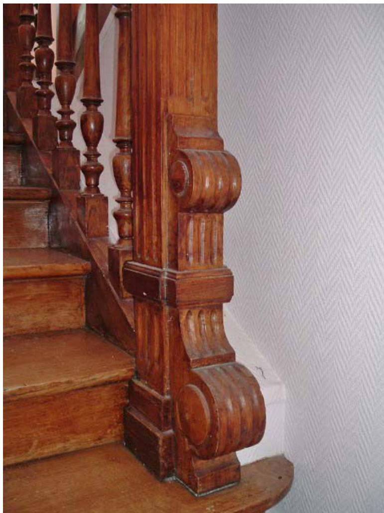
Vue de détail du départ de l'escalier d'origine, décor de volutes et cannelures, balustres en bois tourné. 71, Issy-l'Évêque, 7 rue des Emigrés