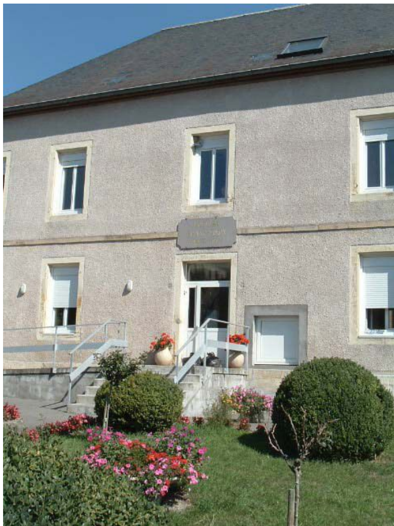
Vue de détail de la façade antérieure du bâtiment d'origine.