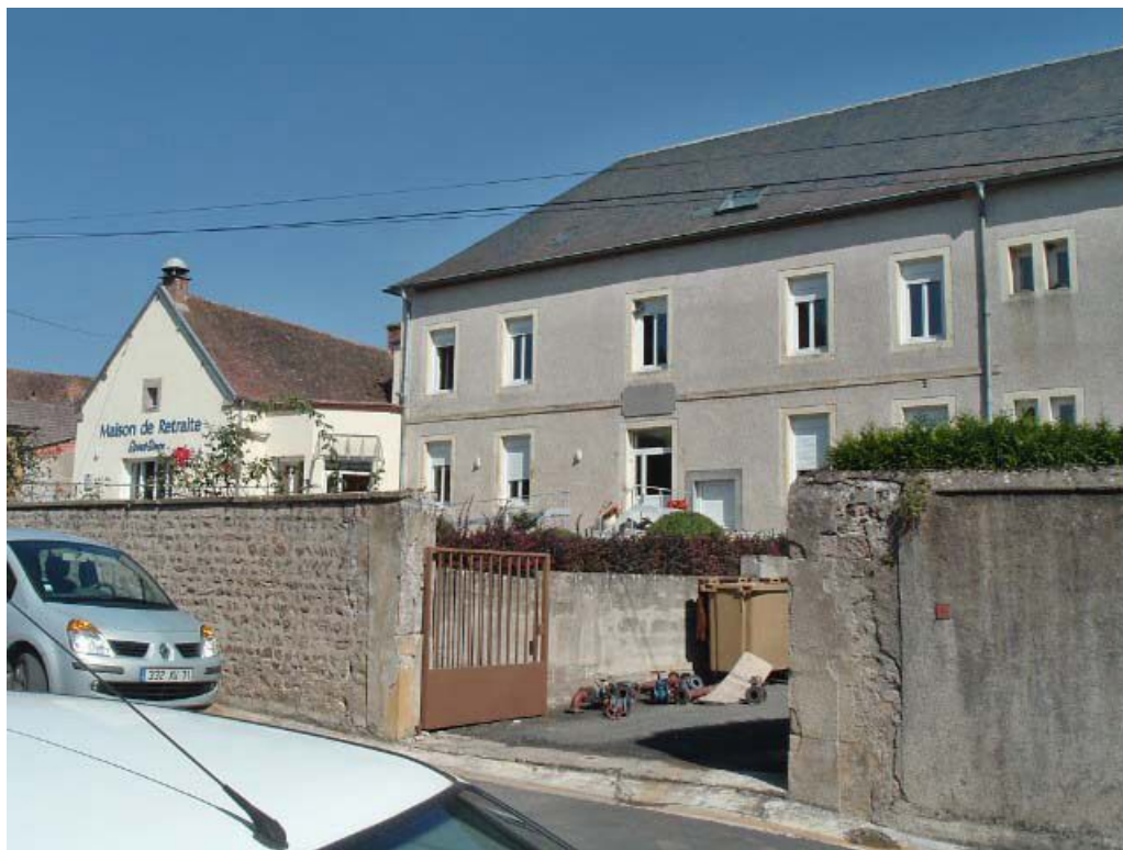
Vue partielle de la façade antérieure du bâtiment d'origine, vue depuis la rue. 71, Issy-l'Évêque, 7 rue des Emigrés