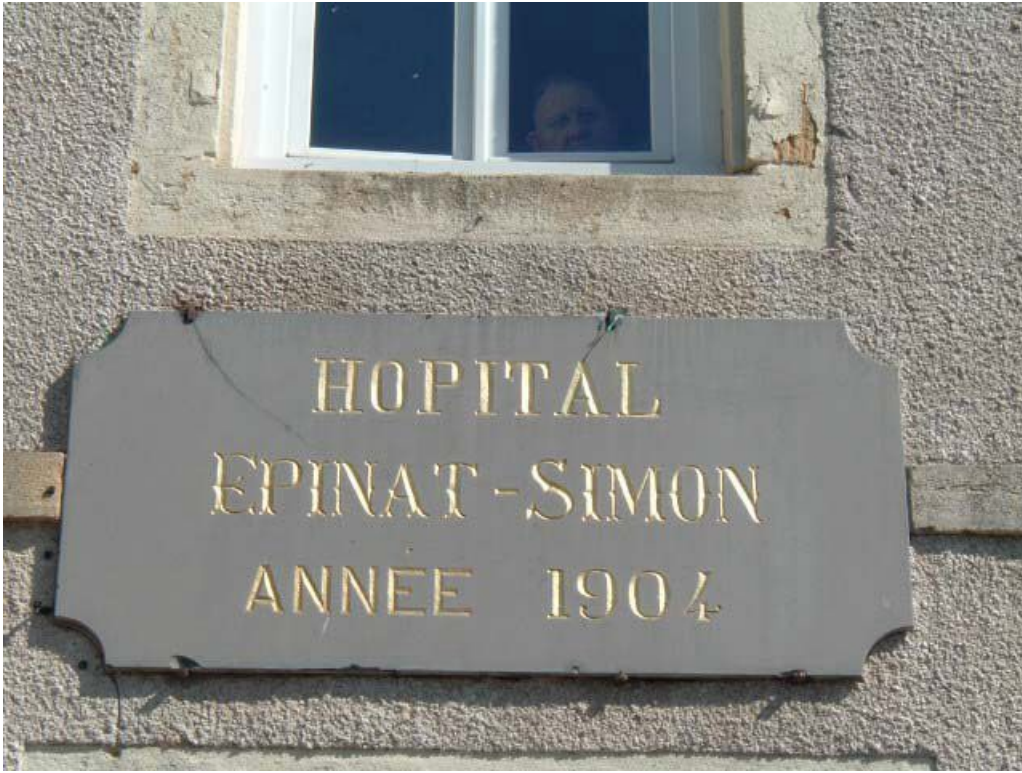
Vue de détail de la plaque gravée de l'hôpital, portant l'inscription "HOPITAL EPINAT-SIMON ANNEE 1904". 71, Issy-l'Évêque, 7 rue des Emigrés