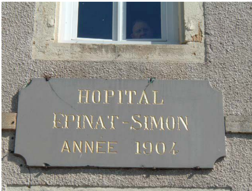
Vue de détail de la plaque gravée de l'hôpital, portant l'inscription "HOPITAL EPINAT-SIMON ANNEE 1904". 71, Issy-l'Évêque, 7 rue des Emigrés