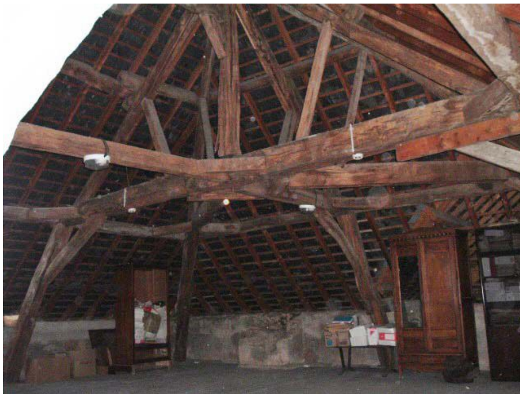
Vue de détail de la charpente, noeud de charpente, comble.