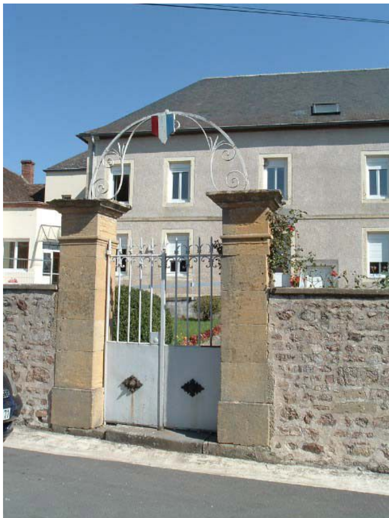
Portail d'entrée du bâtiment d'origine, vue de détail.