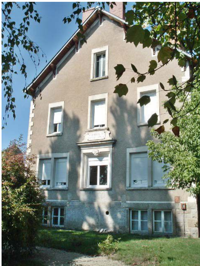
Vue rapprochée de la façade latérale du bâtiment d'origine.