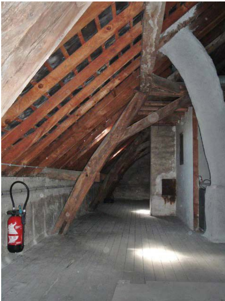
Vue intérieure des pannes de la charpente, comble.