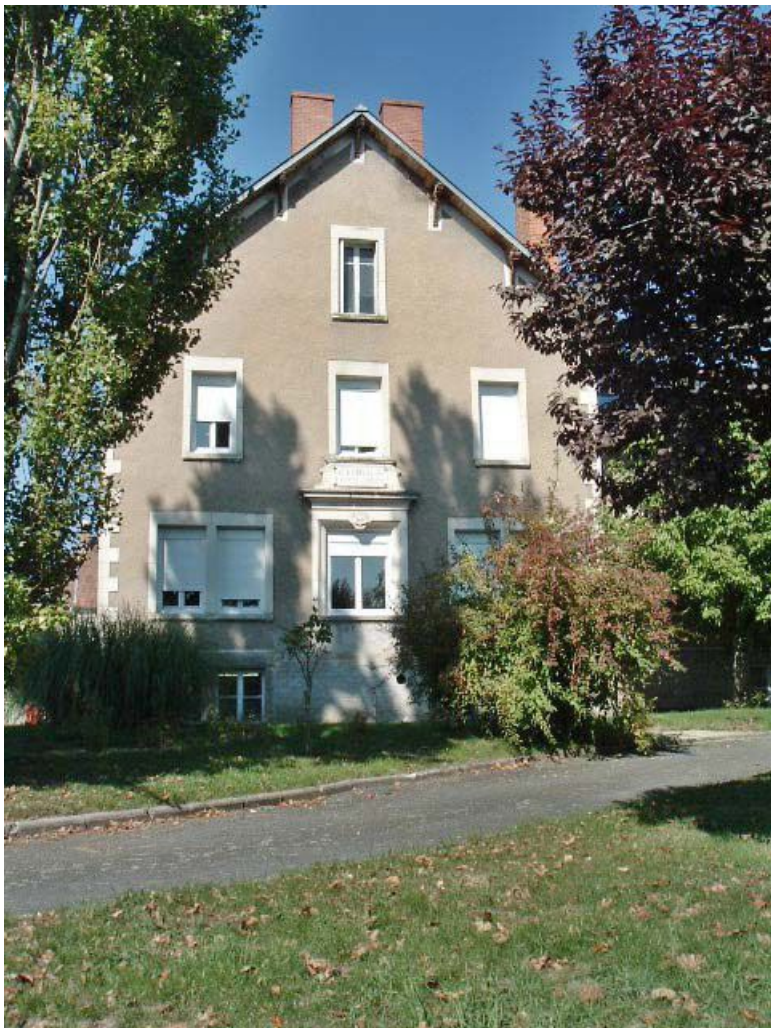
Vue d'ensemble de la façade latérale du bâtiment d'origine, depuis le jardin. 71, Issy-l'Évêque, 7 rue des Emigrés