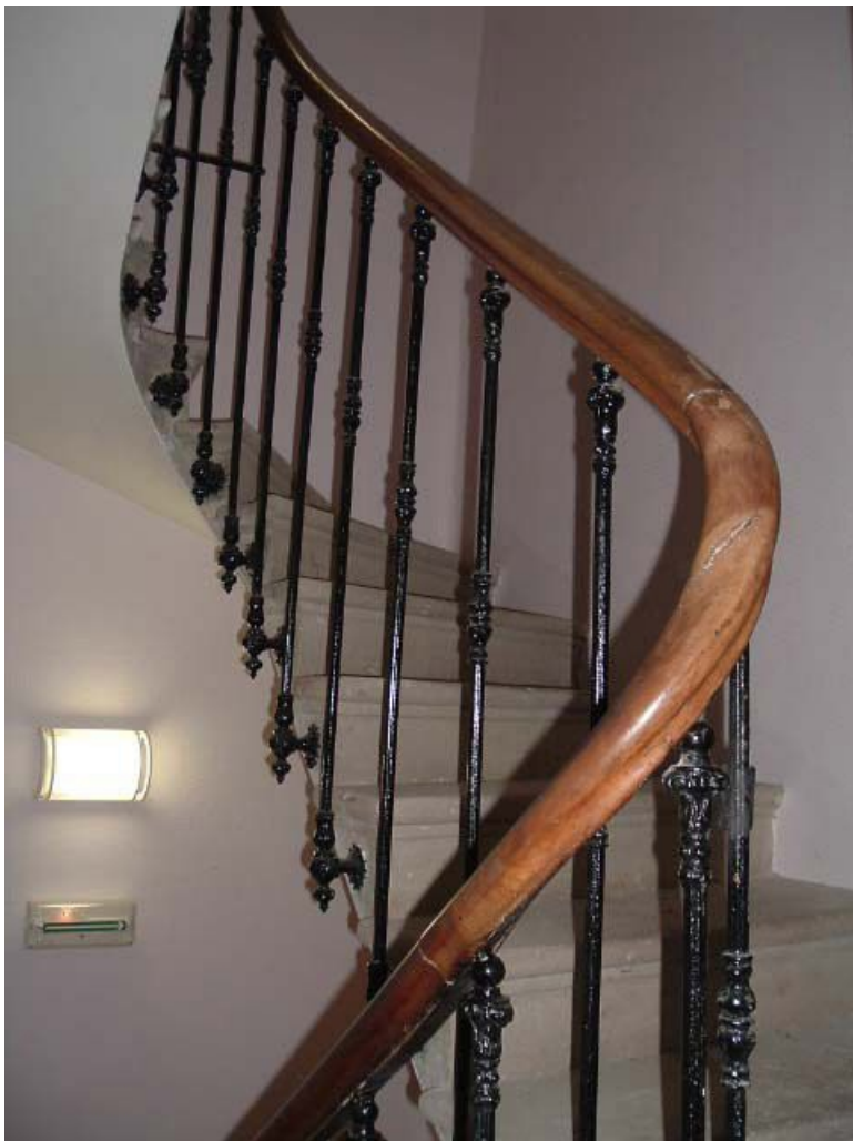
Vue intérieure d'un escalier secondaire d'origine, en fonte.