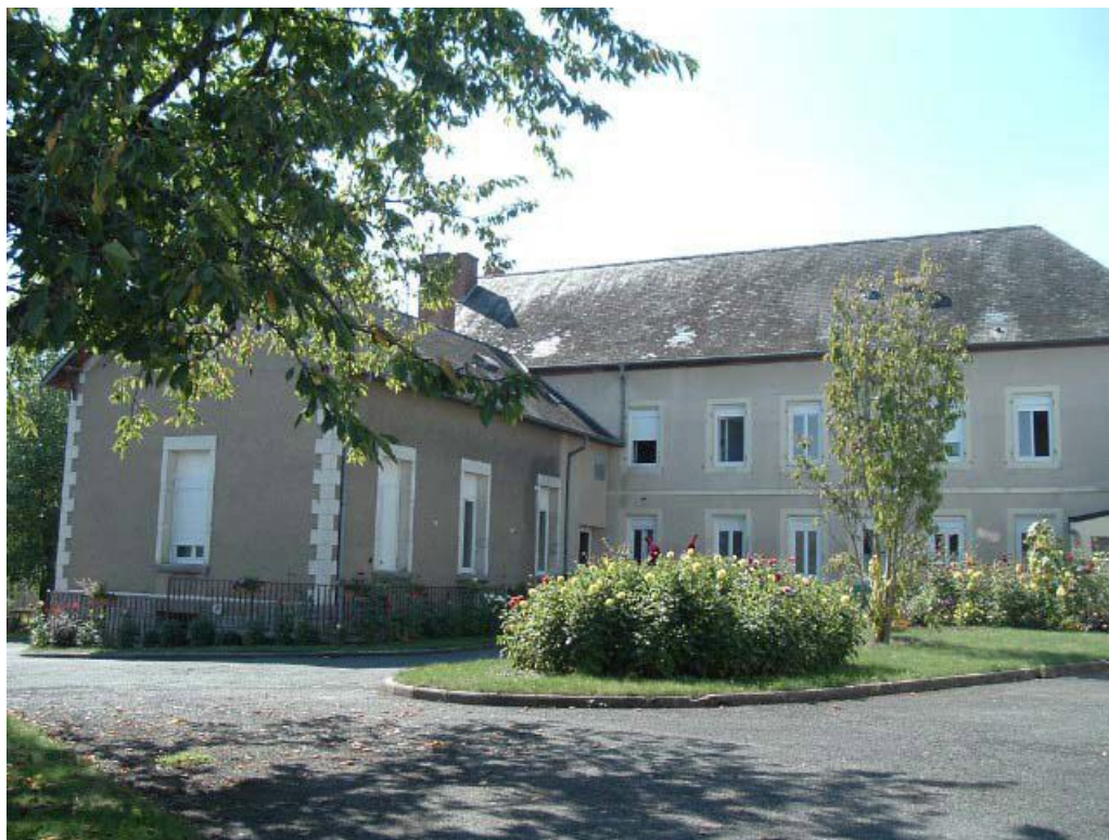
Vue d'ensemble de la façade postérieure.