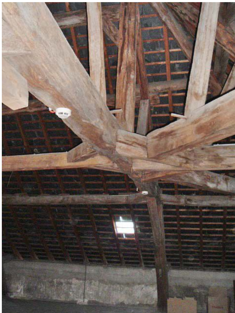
Vue intérieure de la charpente, comble.