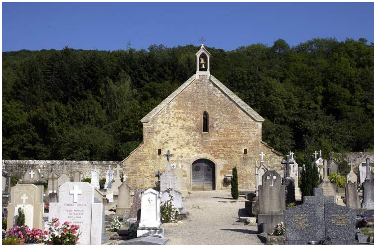
Façade antérieure de face. 71, Cuiseaux Quatre-bornes