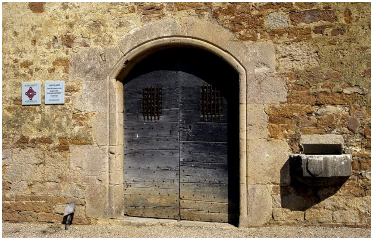
Détail du portail d'entrée et du bénitier.