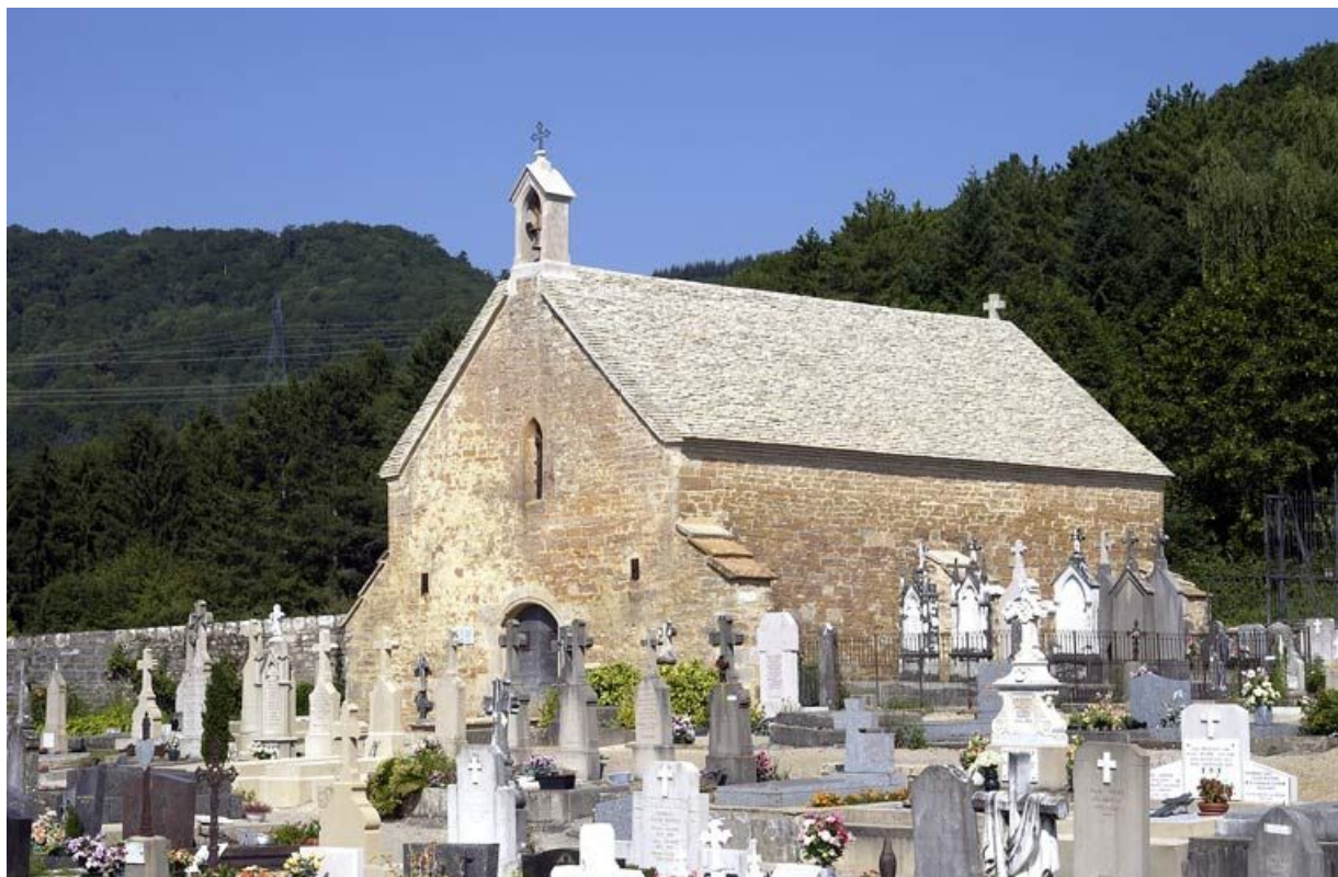
Façade antérieure et façade droite.