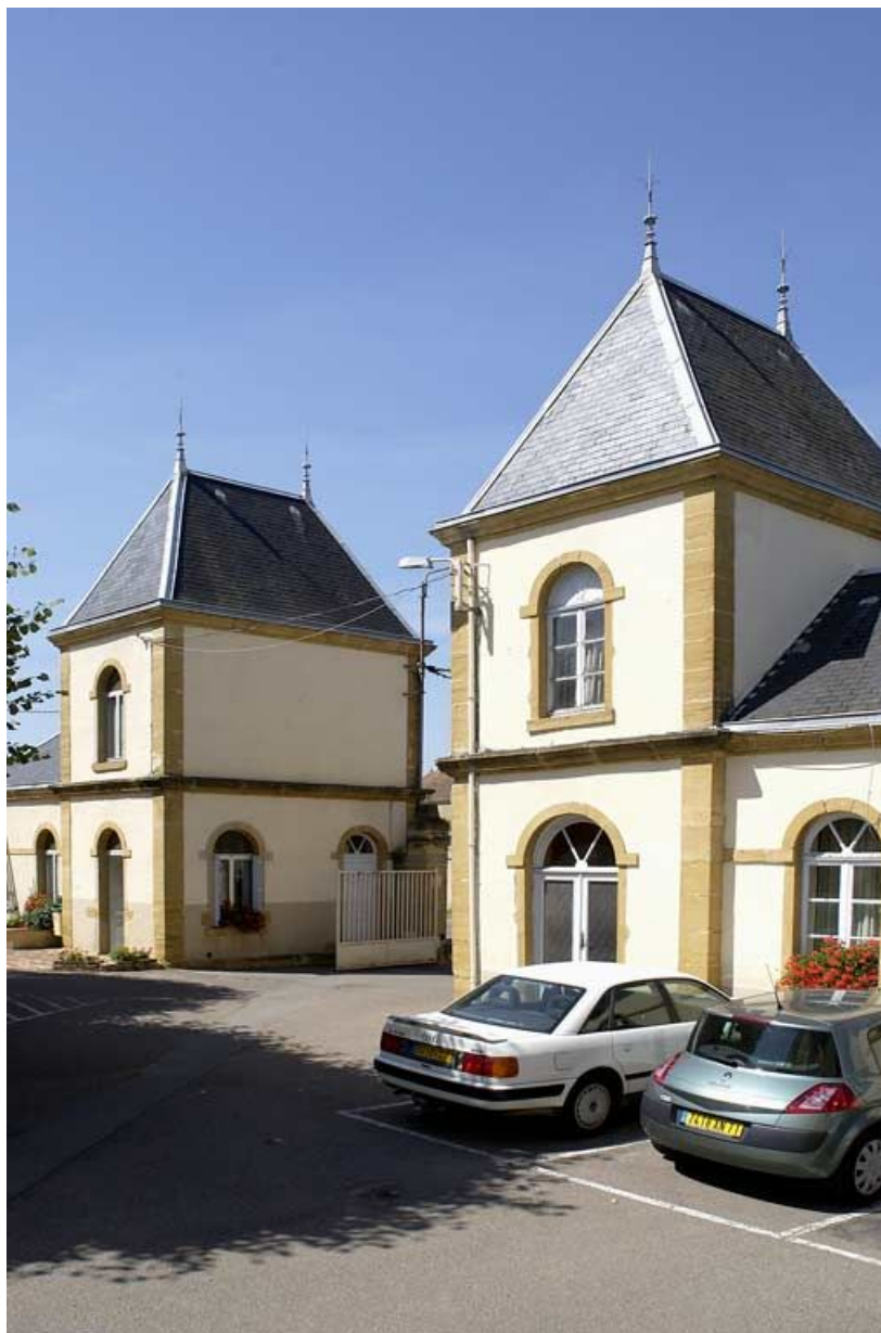
Pavillons d'entrée, vue générale depuis la cour. 71, Charolles, 6 rue du Prieuré