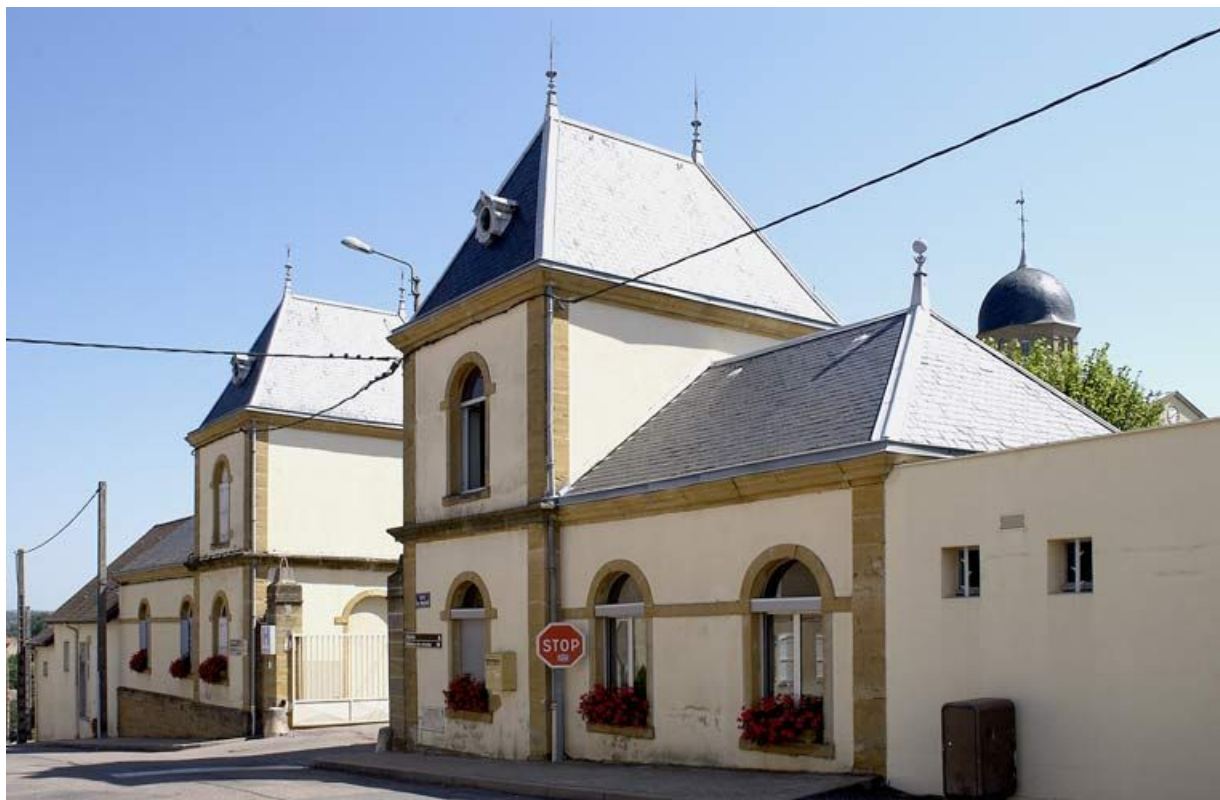
Pavillons d'entrée, vue générale depuis la rue. 71, Charolles, 6 rue du Prieuré