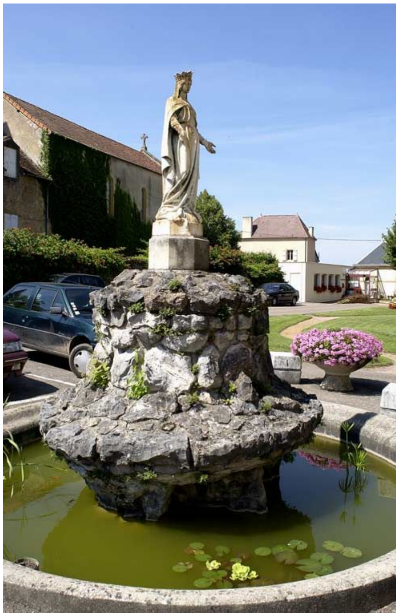
Bassin et statue de la Vierge dans le jardin.