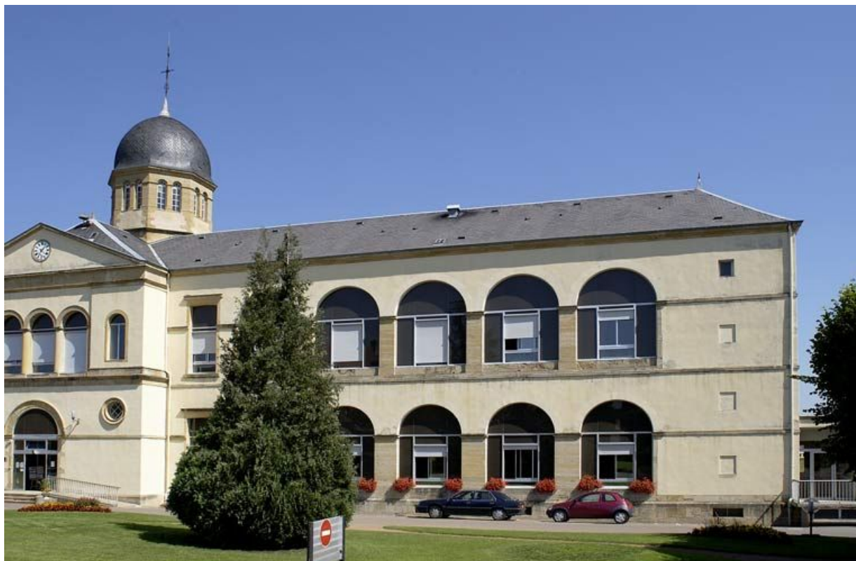
Façade antérieure, vue d'ensemble de la partie droite. 71, Charolles, 6 rue du Prieuré