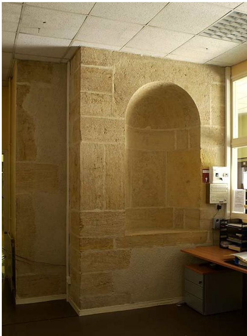
Niche à l'intérieur de l'actuel hall d'accueil.