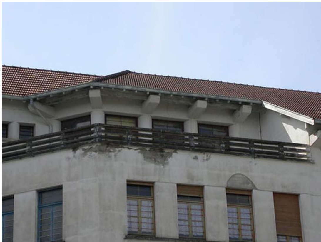
Aile des services : détail de la terrasse.

71, Bergesserin Bois de la Châtelaine, lieudit : bois de la Châtelaine