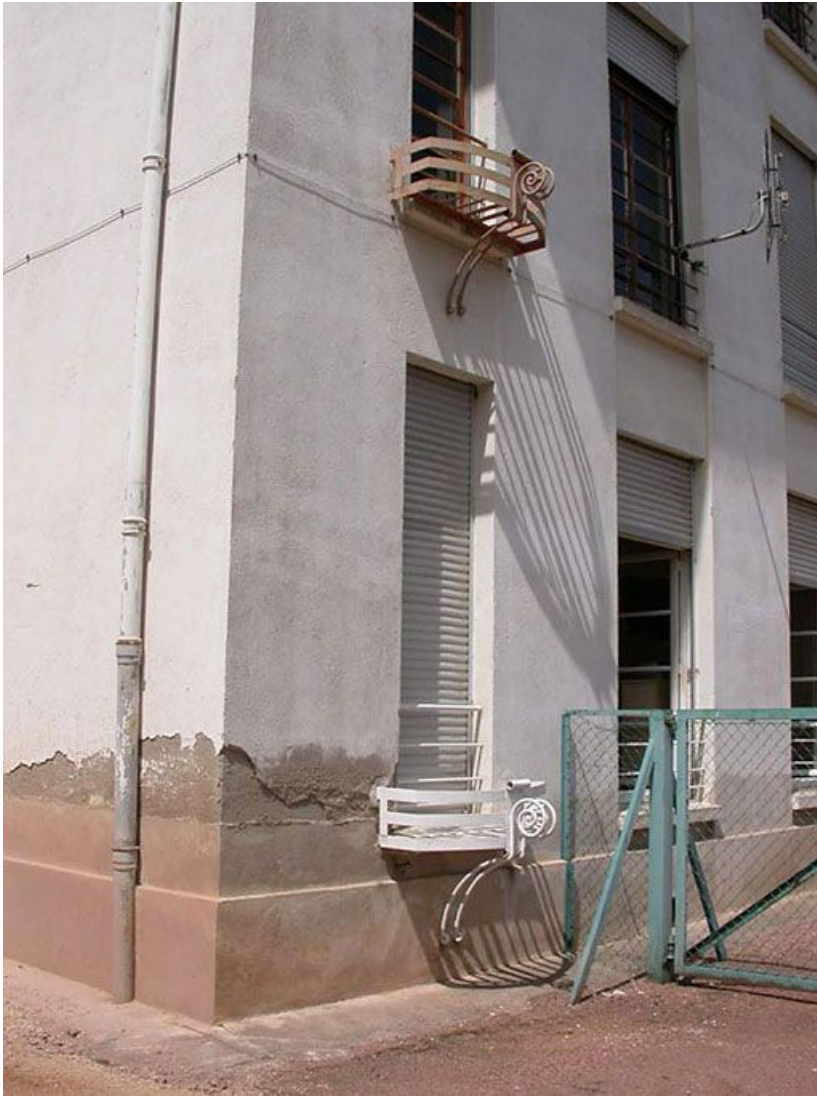
Aile des soins médicaux : détail des garde-corps.

71, Bergesserin Bois de la Châtelaine, lieudit : bois de la Châtelaine