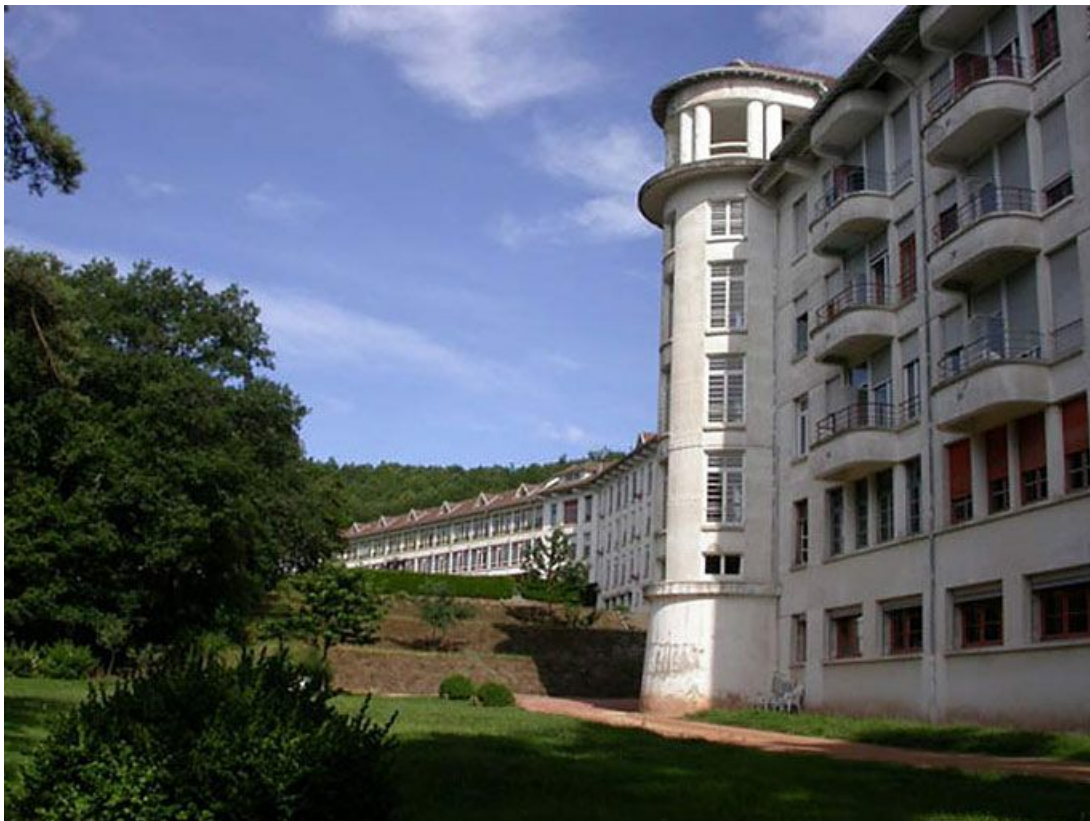
Vue générale de l'aile de soins et de cure.

71, Bergesserin Bois de la Châtelaine, lieudit : bois de la Châtelaine