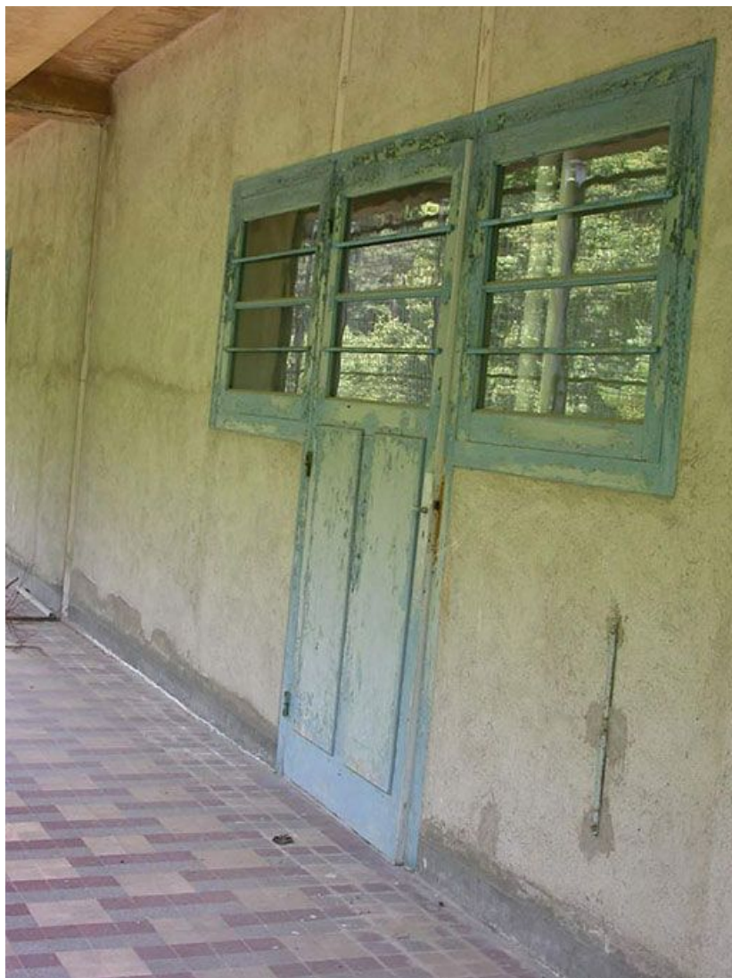
Galerie de cure nord dite "froide" : détail d'une porte et d'une fenêtre.

71, Bergesserin Bois de la Châtelaine, lieudit : bois de la Châtelaine