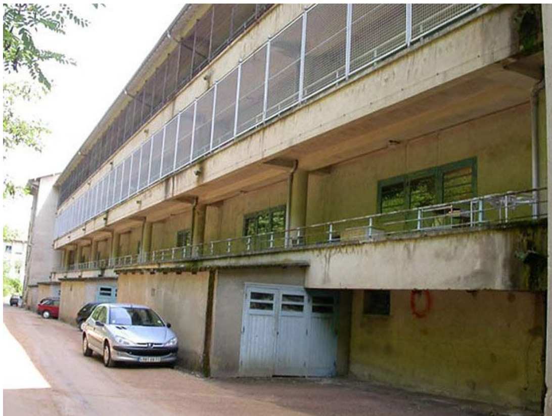
Galerie de cure nord, dite "froide", vue d'ensemble extérieure.

71, Bergesserin Bois de la Châtelaine, lieudit : bois de la Châtelaine