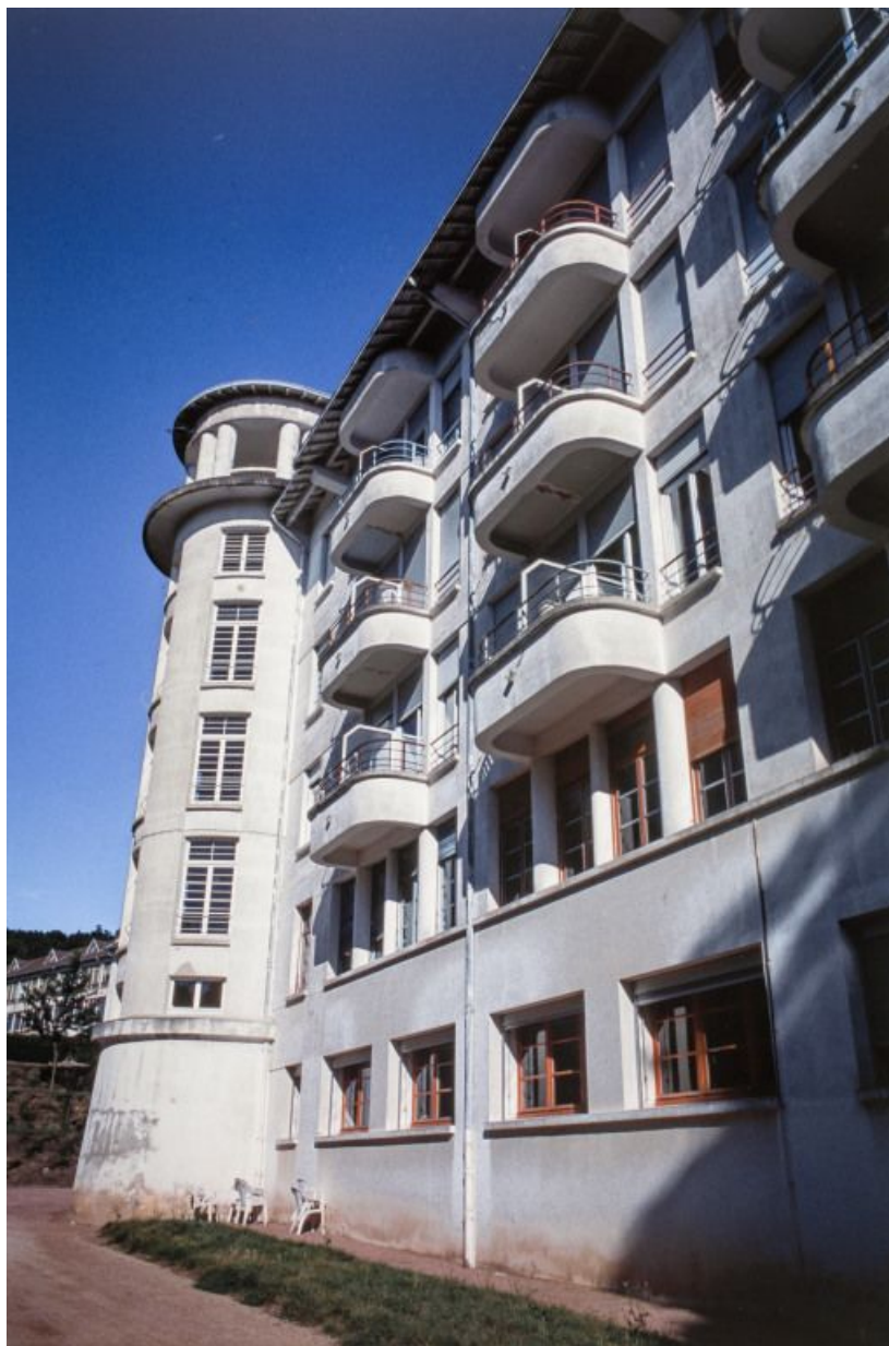
Aile des soins : vue générale.

71, Bergesserin Bois de la Châtelaine, lieudit : bois de la Châtelaine