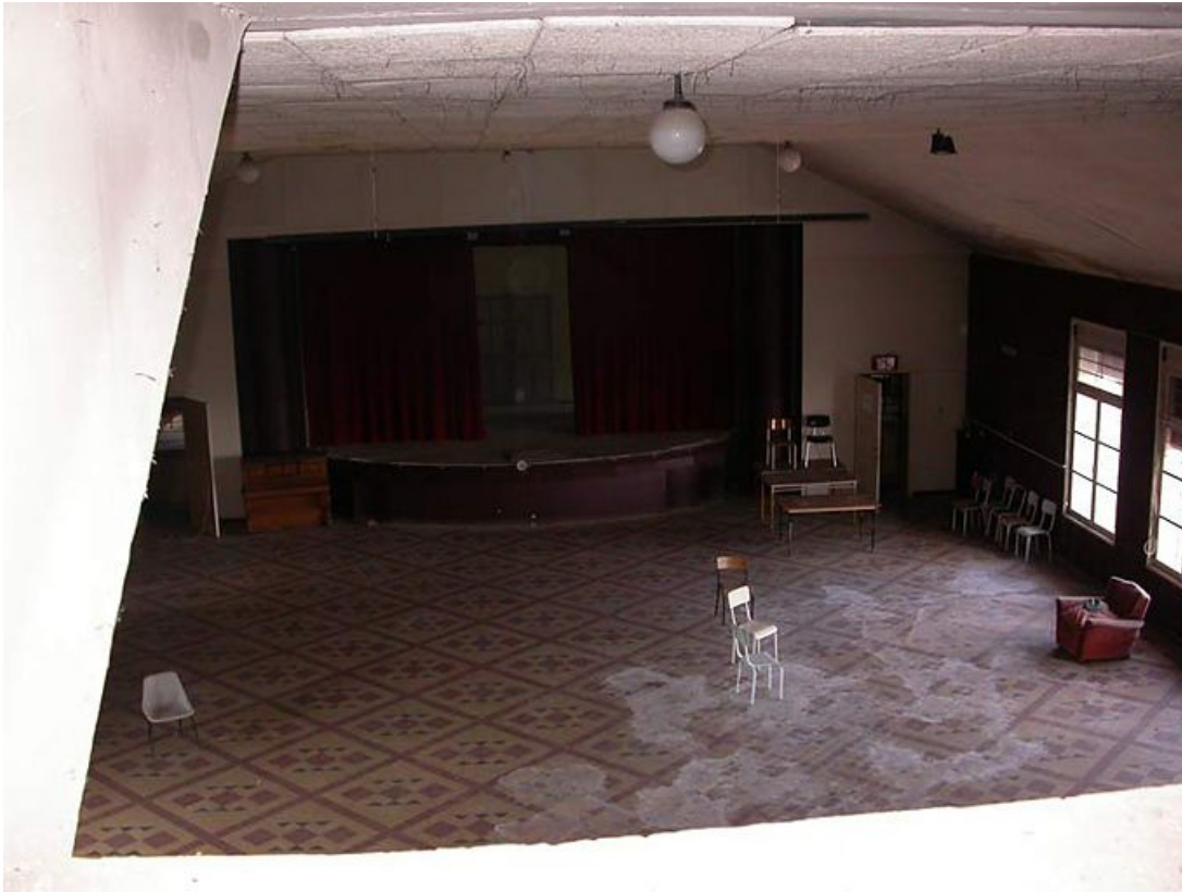
Vue intérieure de la salle des fêtes.

71, Bergesserin Bois de la Châtelaine, lieudit : bois de la Châtelaine