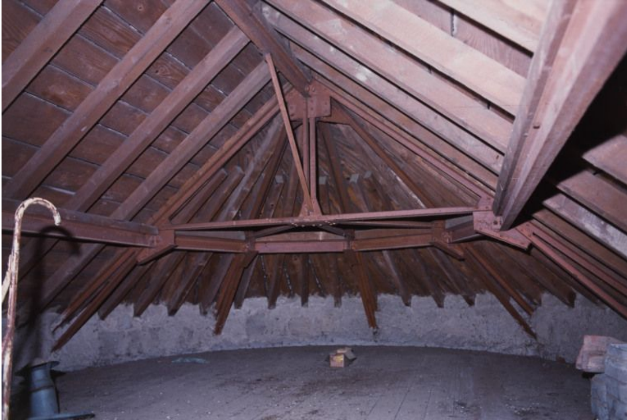
Combles : structure métallique et tuiles plates mécaniques de Saint-Romain.

71, Bergesserin Bois de la Châtelaine, lieudit : bois de la Châtelaine