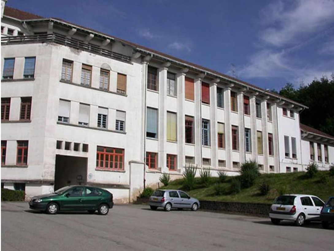
Aile des services : vue d'ensemble.

71, Bergesserin Bois de la Châtelaine, lieudit : bois de la Châtelaine