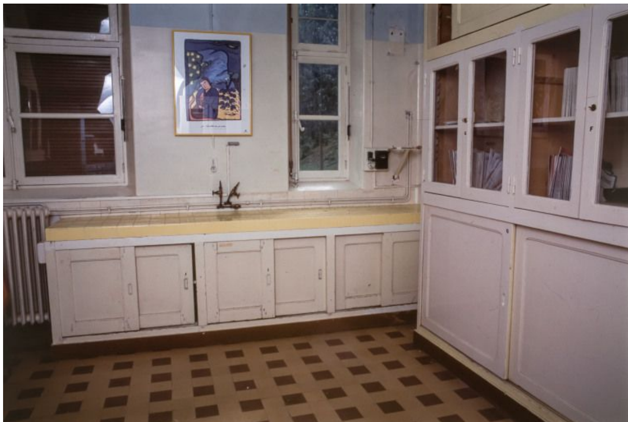
Laboratoire pharmaceutique : vue intérieure.

71, Bergesserin Bois de la Châtelaine, lieudit : bois de la Châtelaine