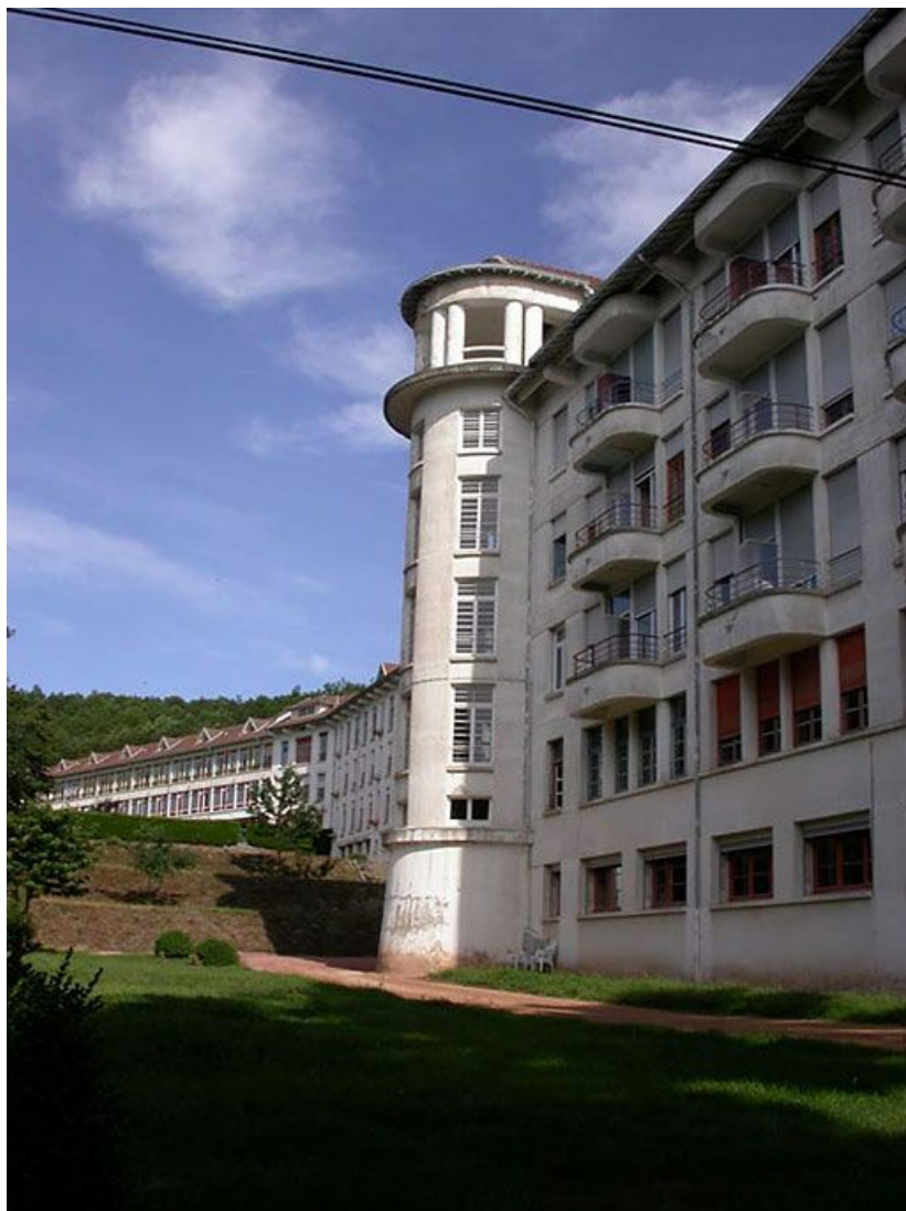
Vue générale de l'aile de soins et de cure.

71, Bergesserin Bois de la Châtelaine, lieudit : bois de la Châtelaine