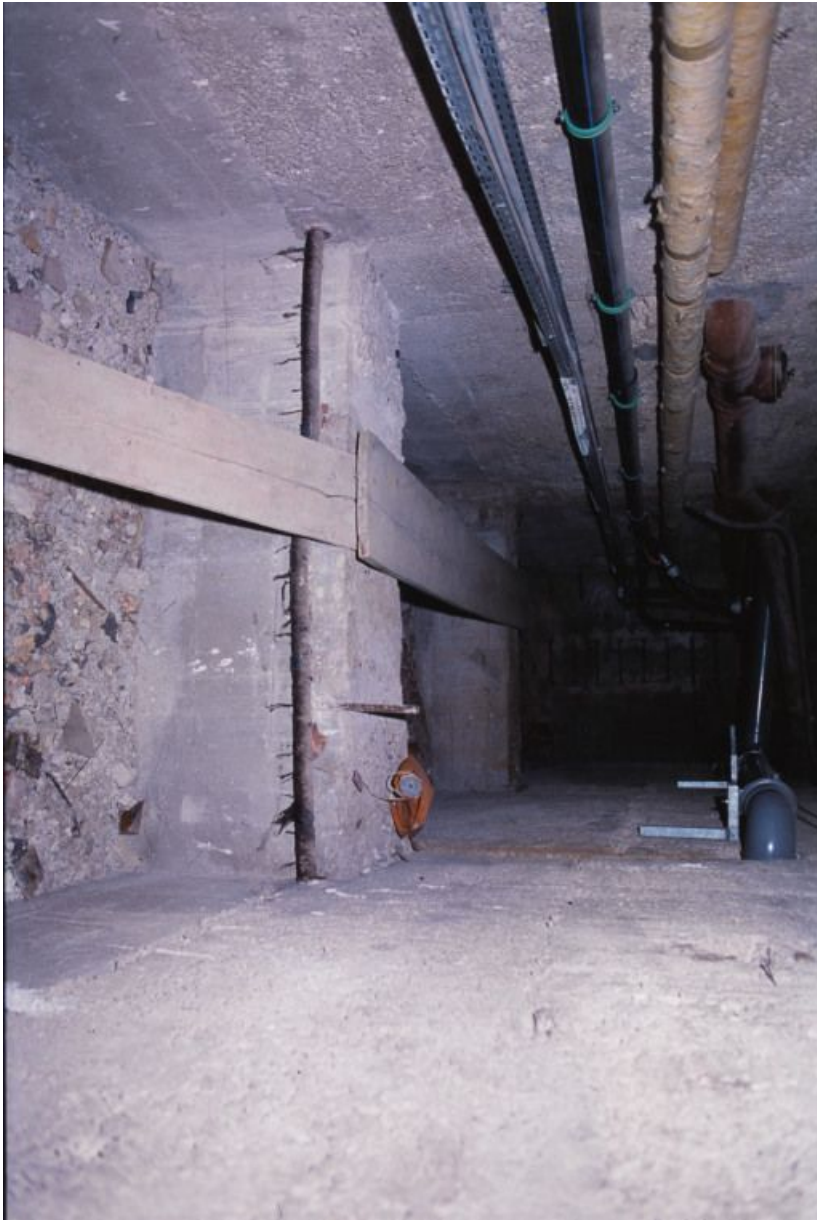
Chaufferie : vue intérieure de la galerie de visite.

71, Bergesserin Bois de la Châtelaine, lieudit : bois de la Châtelaine