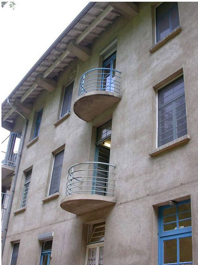
Aile des soins médicaux, façade postérieure : détail des balcons.

71, Bergesserin Bois de la Châtelaine, lieudit : bois de la Châtelaine