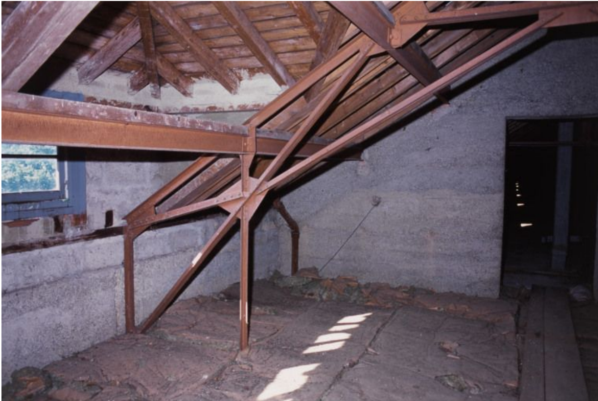
Combles : structure métallique et tuiles plates mécaniques de Saint-Romain.

71, Bergesserin Bois de la Châtelaine, lieudit : bois de la Châtelaine