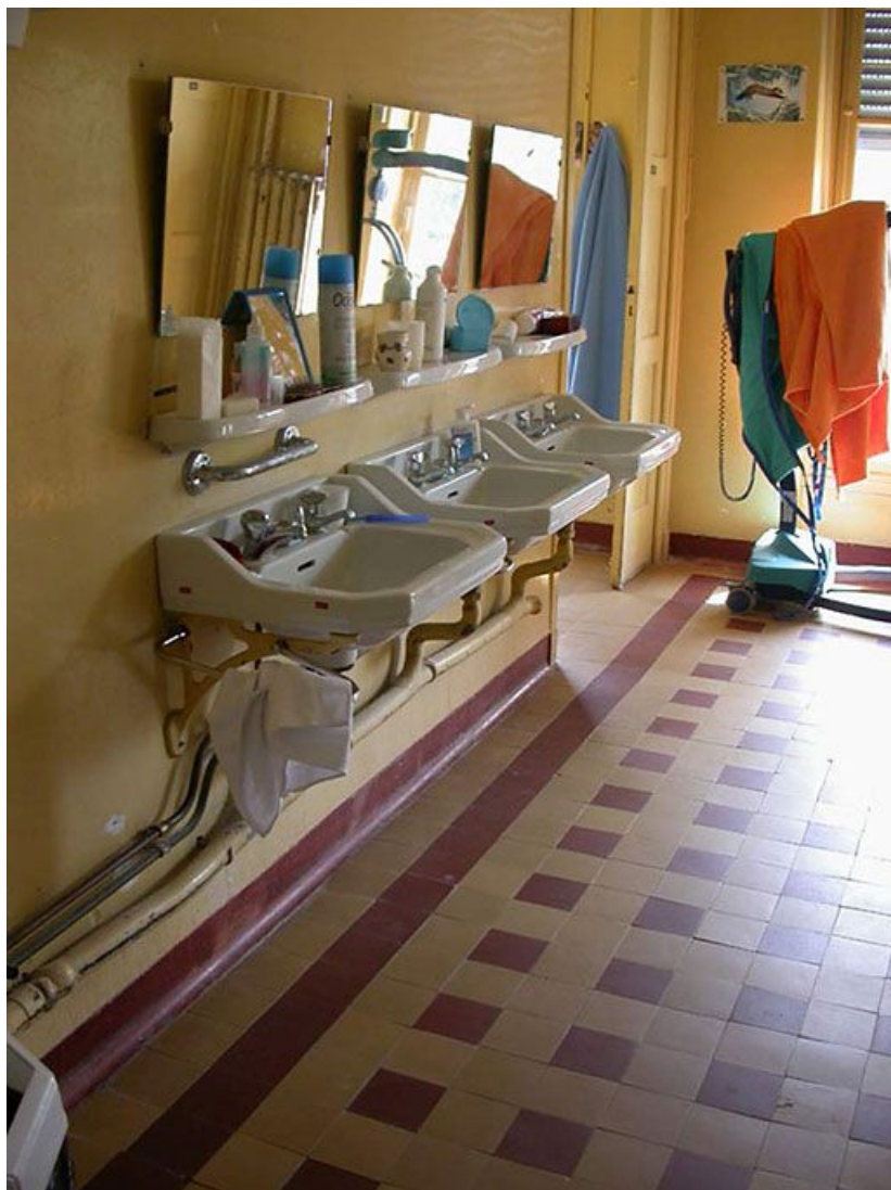
Aile des soins : vue d'un bloc sanitaire.

71, Bergesserin Bois de la Châtelaine, lieudit : bois de la Châtelaine