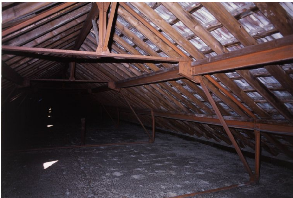
Combles : structure métallique et tuiles plates mécaniques de Saint-Romain.

71, Bergesserin Bois de la Châtelaine, lieudit : bois de la Châtelaine