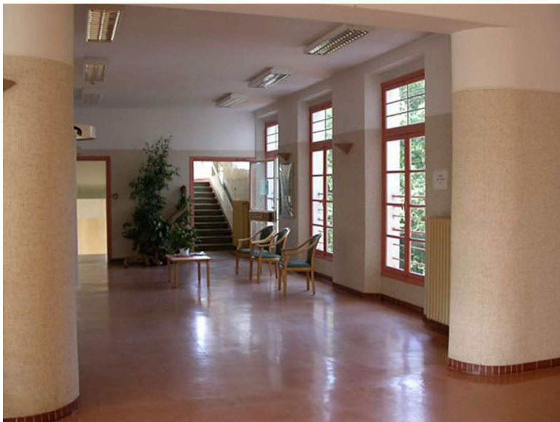
Hall d'accueil : vue intérieure.

71, Bergesserin Bois de la Châtelaine, lieudit : bois de la Châtelaine