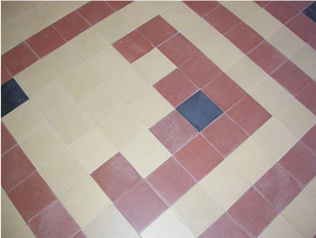
Détail du sol en grès cérame de la salle à manger.

71, Bergesserin Bois de la Châtelaine, lieudit : bois de la Châtelaine