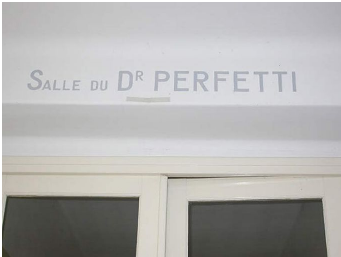
Entrée de la salle du docteur Perfetti.

71, Bergesserin Bois de la Châtelaine, lieudit : bois de la Châtelaine