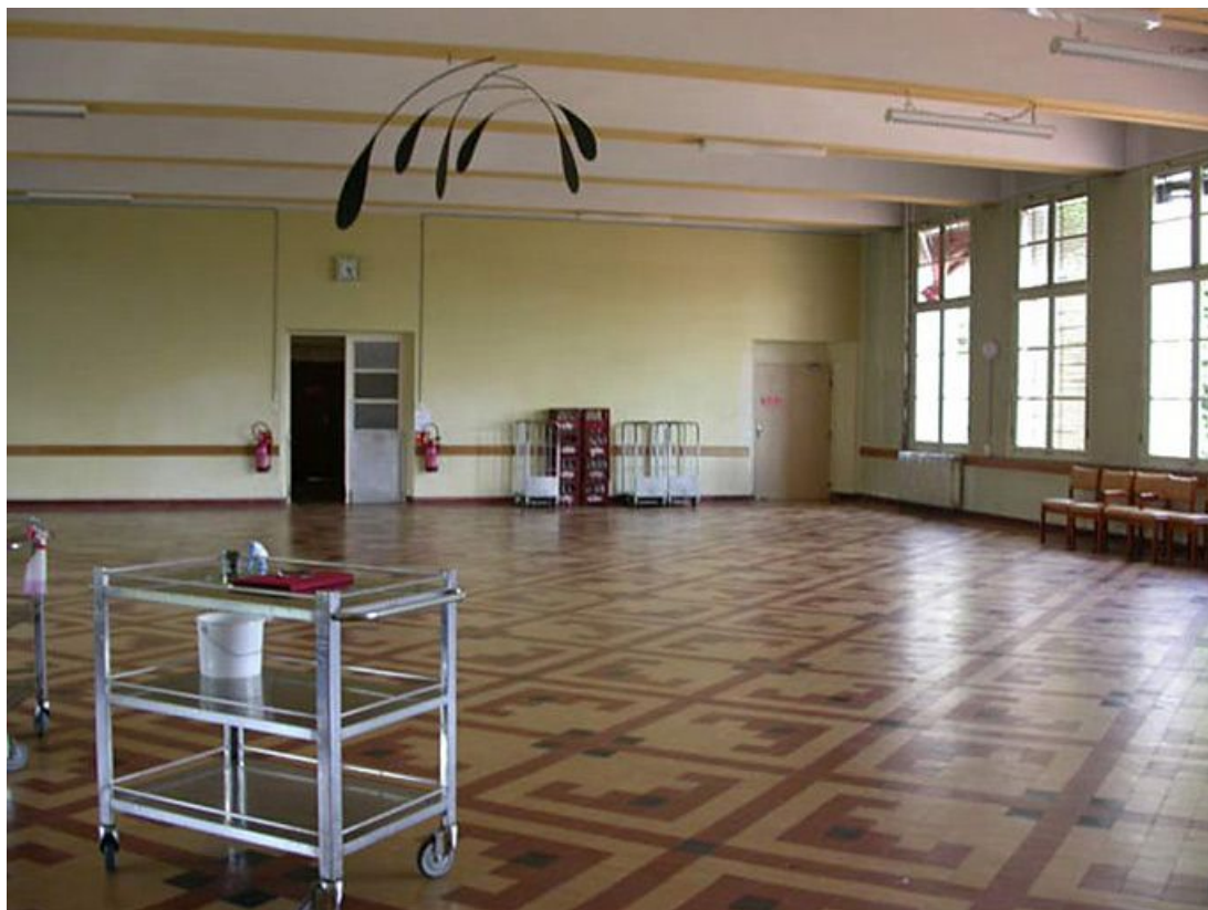
Salle à manger : vue générale intérieure.

71, Bergesserin Bois de la Châtelaine, lieudit : bois de la Châtelaine