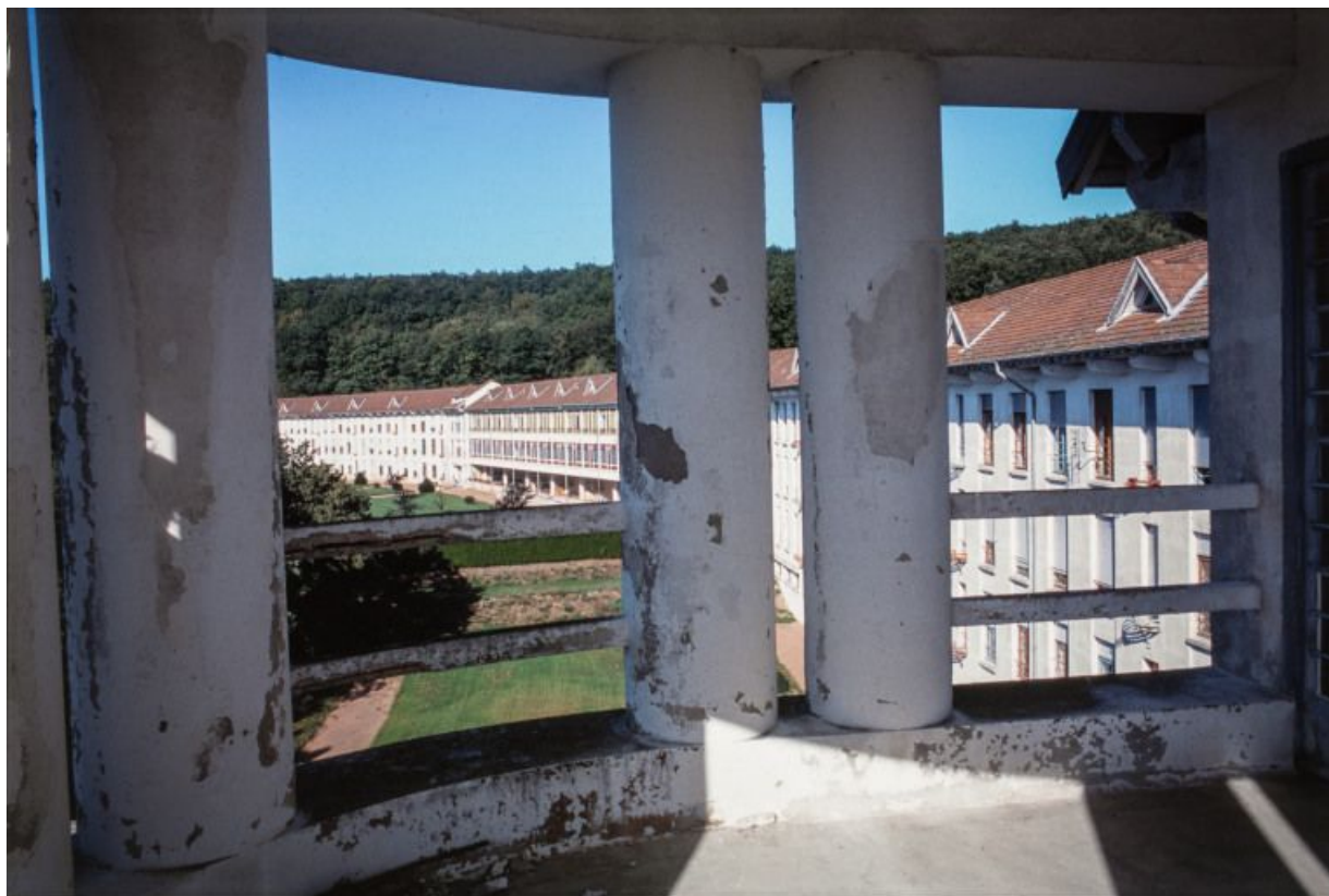
Deuxième et troisième ailes des soins, vues en enfilade depuis la cage d'escalier.

71, Bergesserin Bois de la Châtelaine, lieudit : bois de la Châtelaine