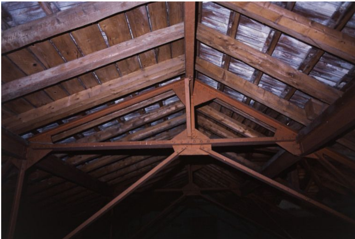
Combles : structure métallique et tuiles plates mécaniques de Saint-Romain.

71, Bergesserin Bois de la Châtelaine, lieudit : bois de la Châtelaine