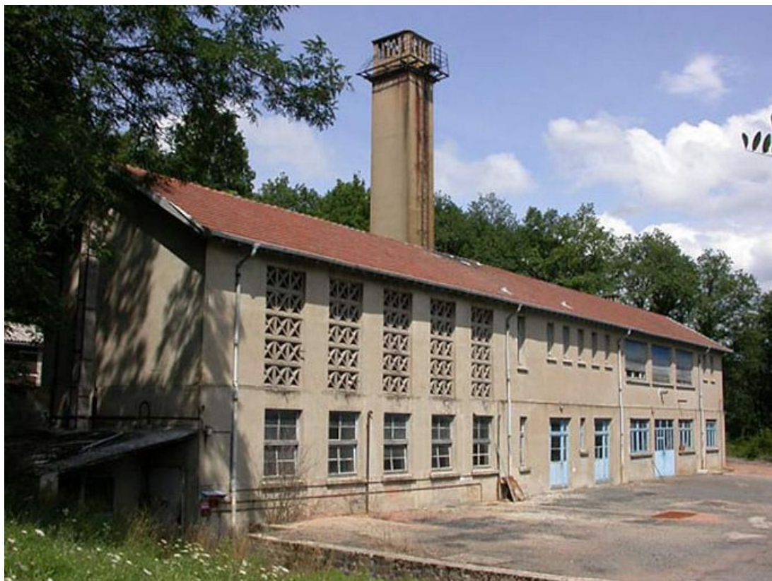
Vue d'ensemble de la chaufferie et des ateliers.

71, Bergesserin Bois de la Châtelaine, lieudit : bois de la Châtelaine