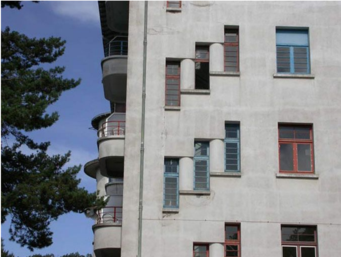
Aile des soins médicaux : vue rapprochée des baies.

71, Bergesserin Bois de la Châtelaine, lieudit : bois de la Châtelaine