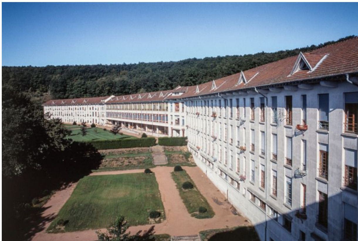
Deuxième et troisième ailes des soins, vues en enfilade depuis la cage d'escalier.

71, Bergesserin Bois de la Châtelaine, lieudit : bois de la Châtelaine