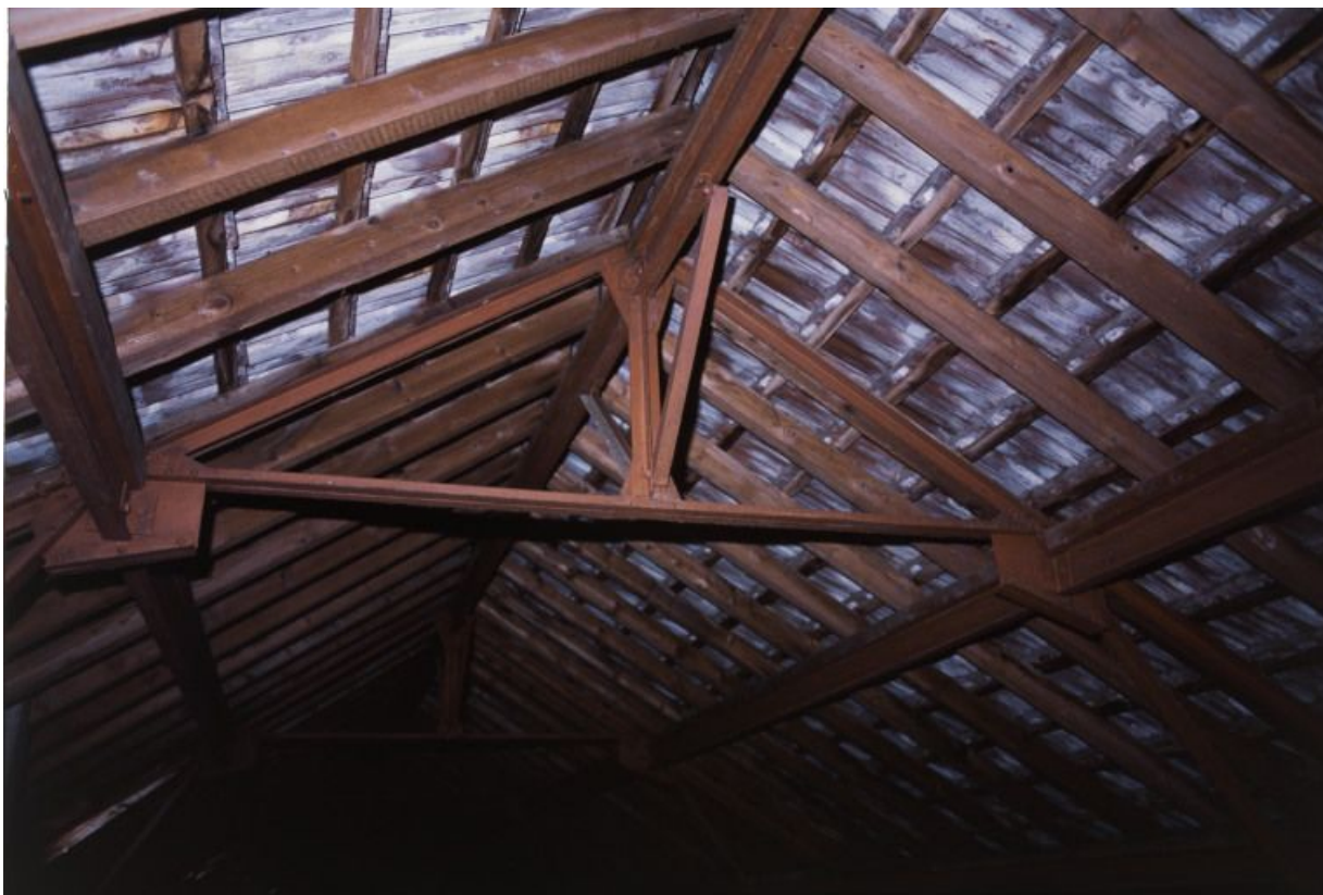
Combles : structure métallique et tuiles plates mécaniques de Saint-Romain.

71, Bergesserin Bois de la Châtelaine, lieudit : bois de la Châtelaine