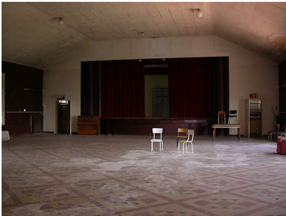
Vue intérieure de la salle des fêtes.

71, Bergesserin Bois de la Châtelaine, lieudit : bois de la Châtelaine