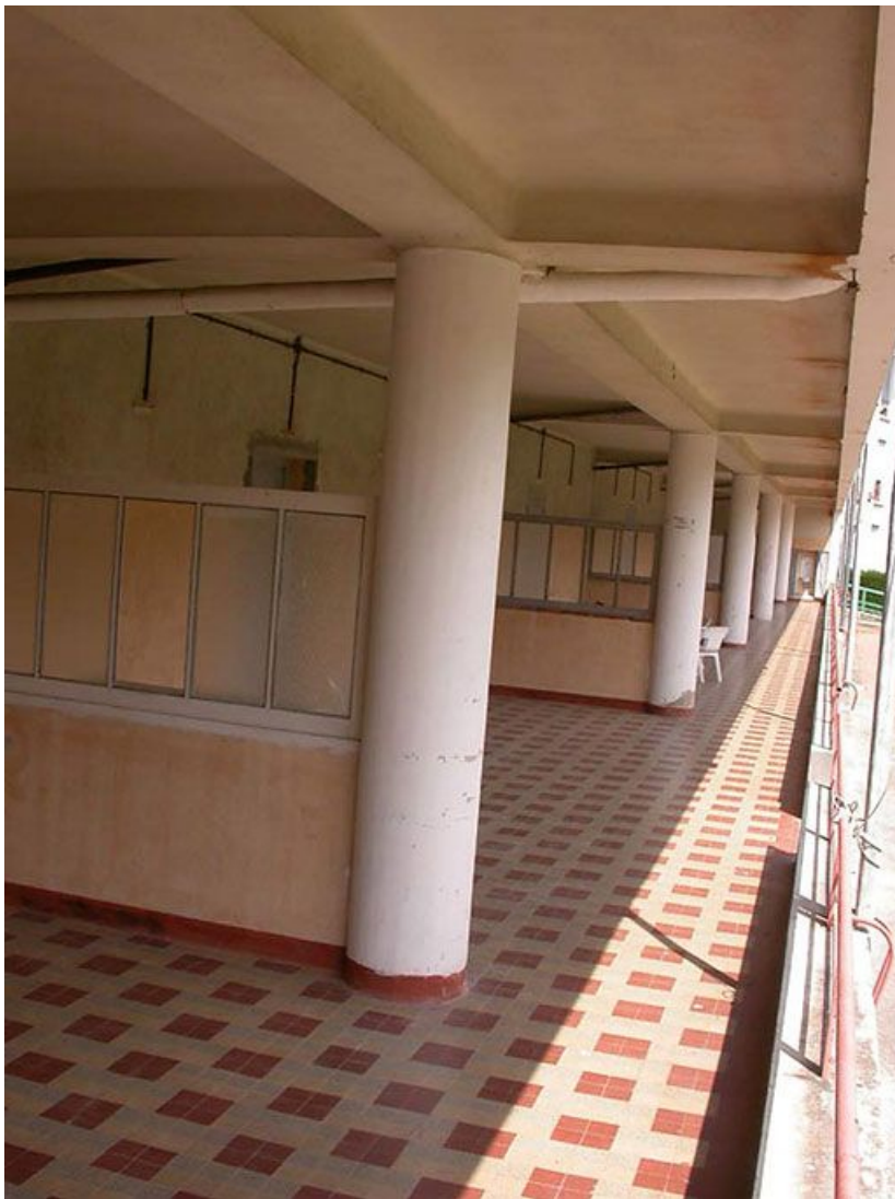
Galerie de cure sud, au rez-de-chaussée : détail des alcôves. 71, Bergesserin Bois de la Châtelaine, lieudit : bois de la Châtelaine