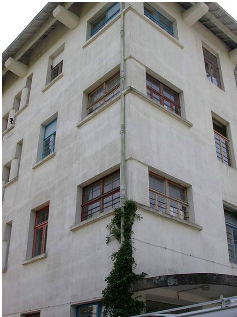
Aile des soins médicaux : détail des fenêtres.

71, Bergesserin Bois de la Châtelaine, lieudit : bois de la Châtelaine