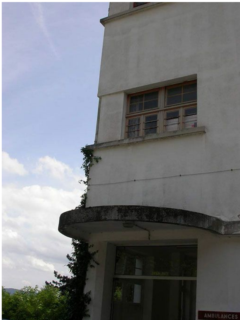
Aile des soins médicaux : détail de l'auvent et d'une fenêtre.

71, Bergesserin Bois de la Châtelaine, lieudit : bois de la Châtelaine