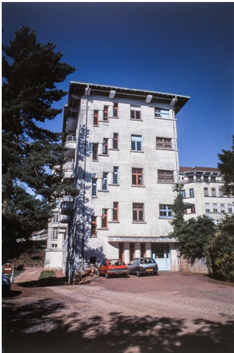
Aile des soins : vue générale.

71, Bergesserin Bois de la Châtelaine, lieudit : bois de la Châtelaine