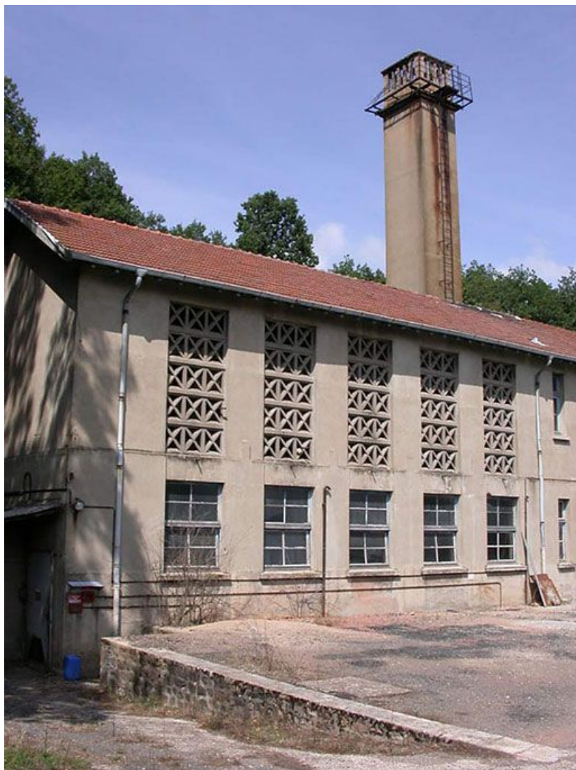
Vue d'ensemble de la chaufferie et des ateliers : claustra en béton.

71, Bergesserin Bois de la Châtelaine, lieudit : bois de la Châtelaine