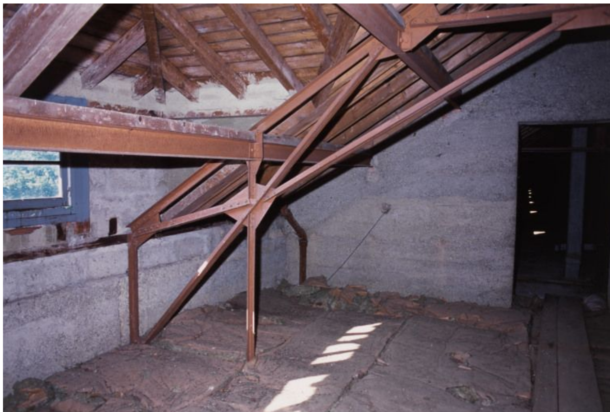
Combles : structure métallique et tuiles plates mécaniques de Saint-Romain.

71, Bergesserin Bois de la Châtelaine, lieudit : bois de la Châtelaine