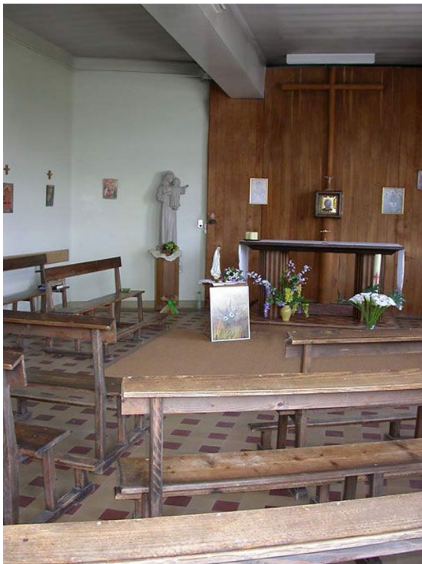
Vue intérieure de la chapelle.

71, Bergesserin Bois de la Châtelaine, lieudit : bois de la Châtelaine