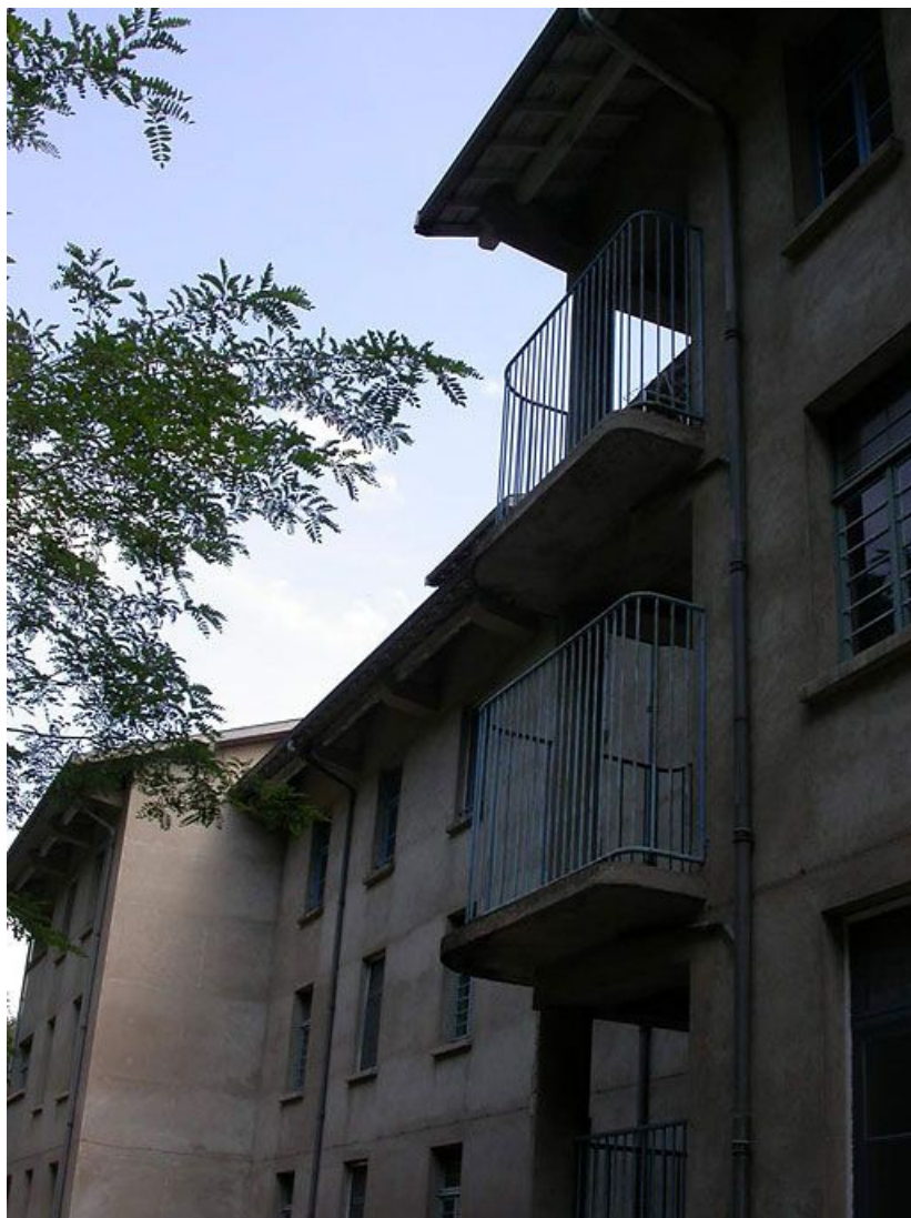
Aile des soins médicaux : détail des balcons.

71, Bergesserin Bois de la Châtelaine, lieudit : bois de la Châtelaine