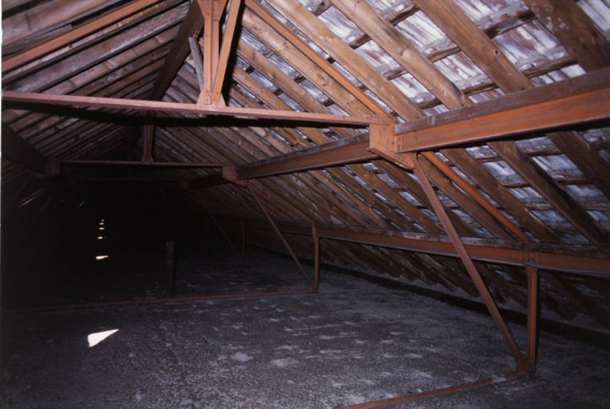
Combles : structure métallique et tuiles plates mécaniques de Saint-Romain.

71, Bergesserin Bois de la Châtelaine, lieudit : bois de la Châtelaine