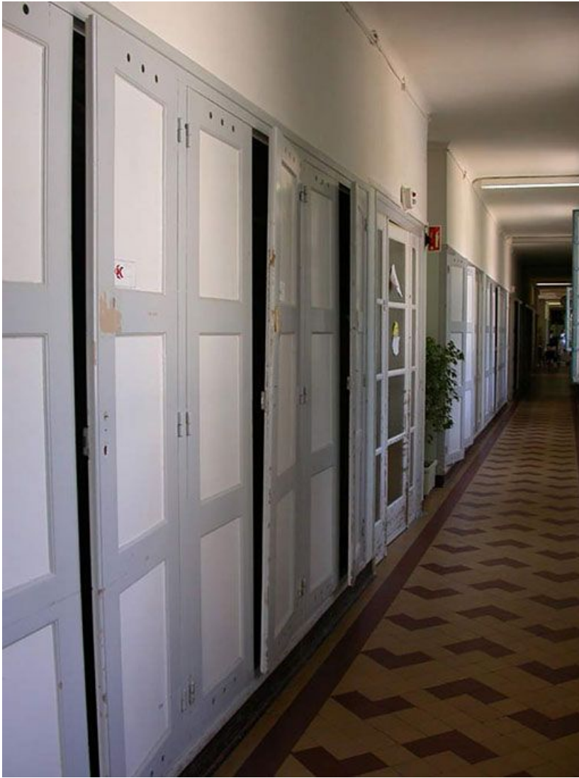
Aile des soins : vue des placards du grand couloir.

71, Bergesserin Bois de la Châtelaine, lieudit : bois de la Châtelaine