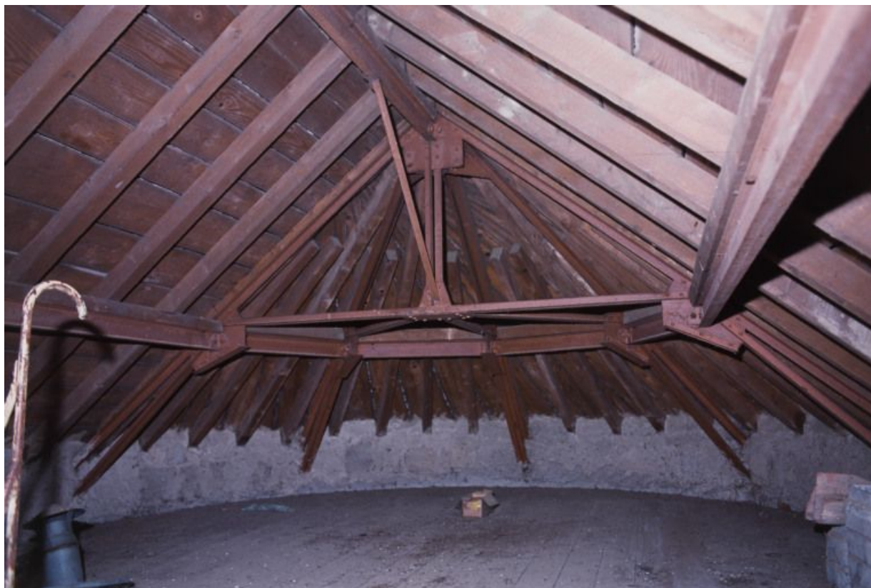
Combles : structure métallique et tuiles plates mécaniques de Saint-Romain.

71, Bergesserin Bois de la Châtelaine, lieudit : bois de la Châtelaine