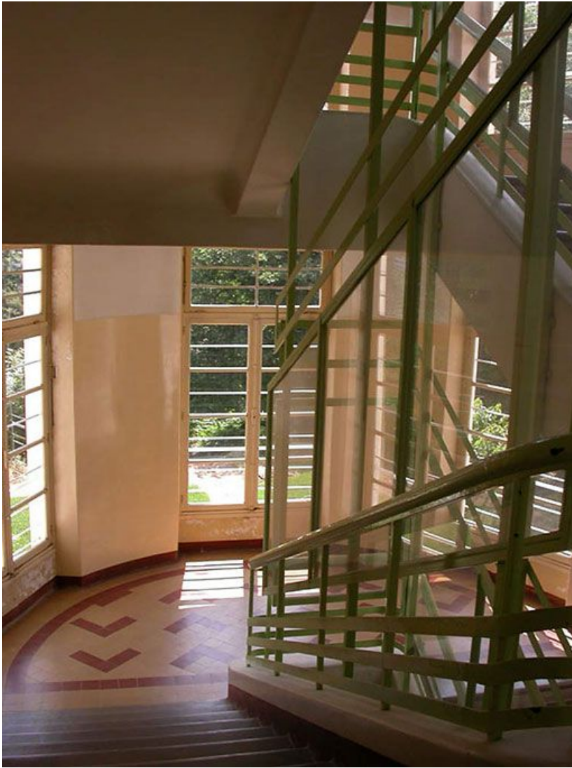
Aile des soins : vue intérieure de l'escalier.

71, Bergesserin Bois de la Châtelaine, lieudit : bois de la Châtelaine