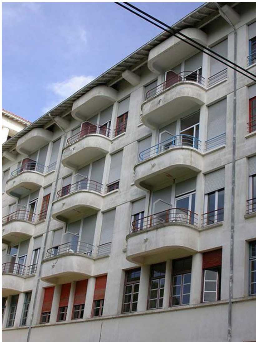
Détail des balcons de l'aile des soins.

71, Bergesserin Bois de la Châtelaine, lieudit : bois de la Châtelaine