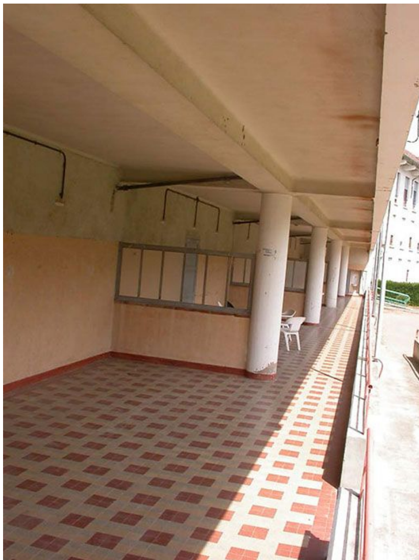
Galerie de cure sud, au rez-de-chaussée : vue d'ensemble.

71, Bergesserin Bois de la Châtelaine, lieudit : bois de la Châtelaine