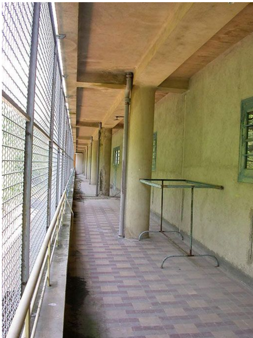
Galerie de cure nord dite "froide" : vue intérieure.

71, Bergesserin Bois de la Châtelaine, lieudit : bois de la Châtelaine