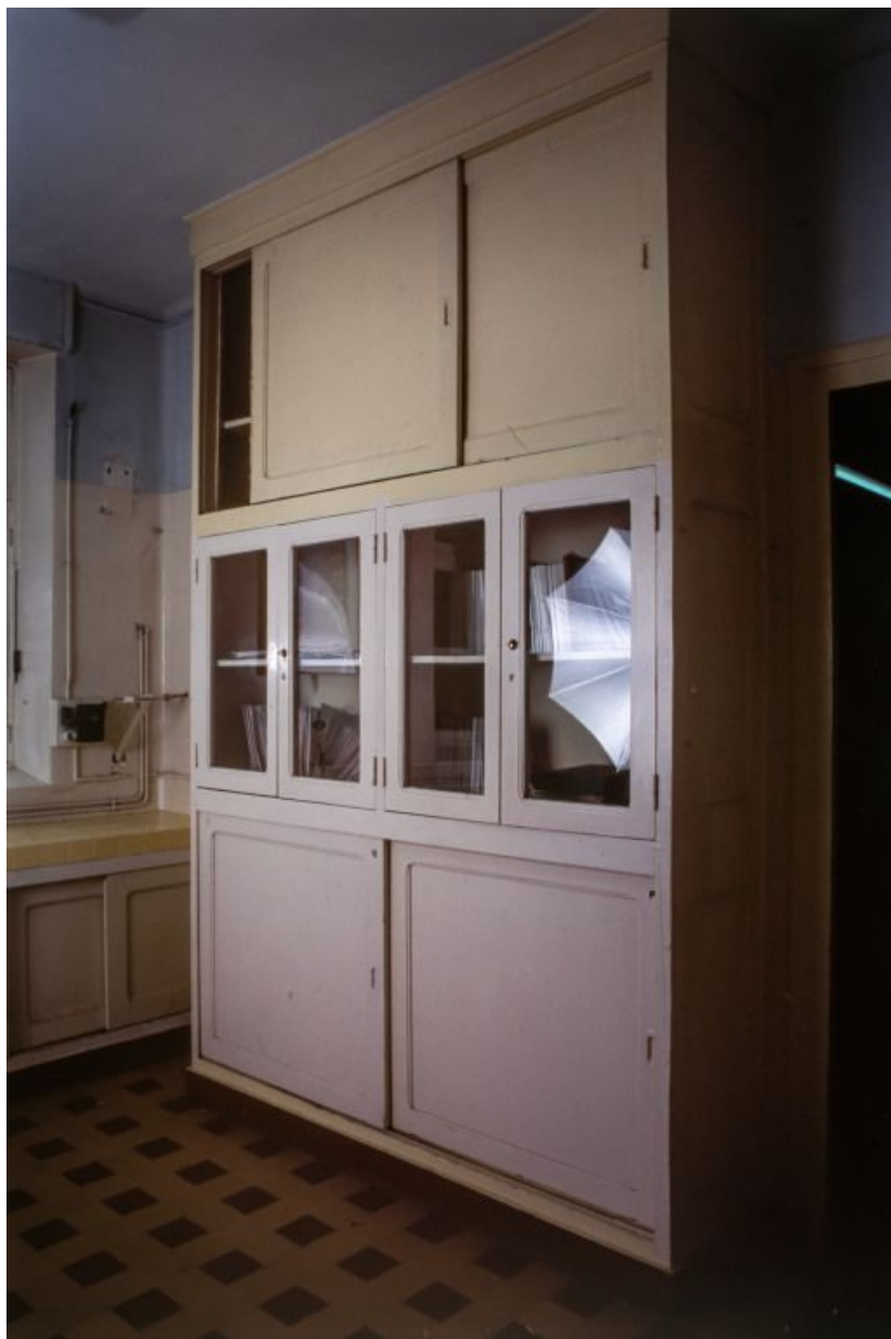
Laboratoire pharmaceutique : vue intérieure sur les placards. 71, Bergesserin Bois de la Châtelaine, lieudit : bois de la Châtelaine