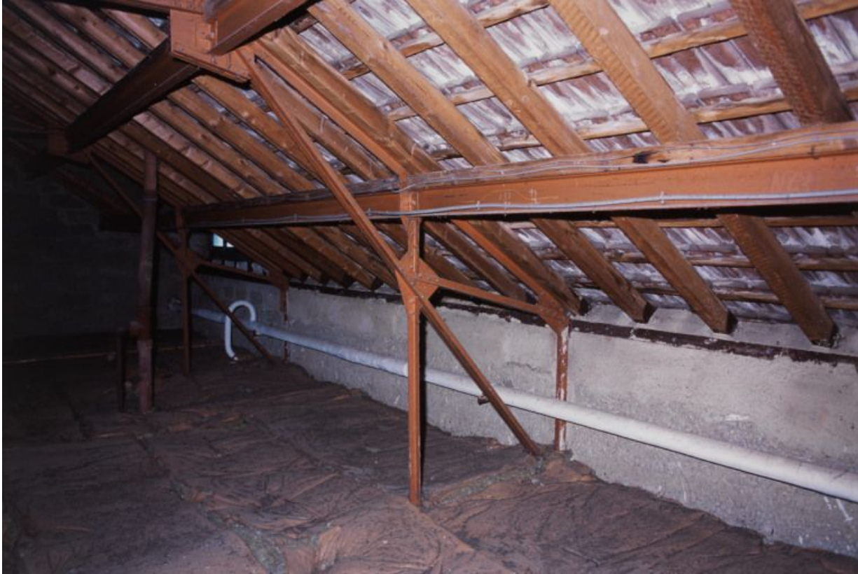
Combles : structure métallique et tuiles plates mécaniques de Saint-Romain.

71, Bergesserin Bois de la Châtelaine, lieudit : bois de la Châtelaine