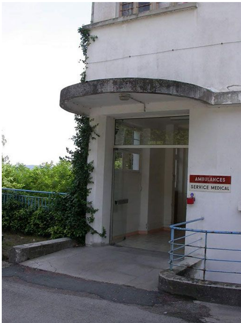
Aile des soins médicaux : détail de l'entrée avec auvent.

71, Bergesserin Bois de la Châtelaine, lieudit : bois de la Châtelaine