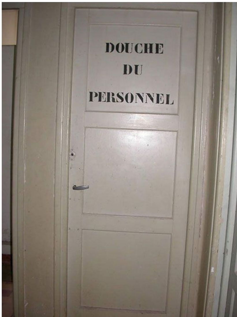
Aile des soins, rez-de-chaussée : détail de la porte des douches du personnel. 71, Bergesserin Bois de la Châtelaine, lieudit : bois de la Châtelaine