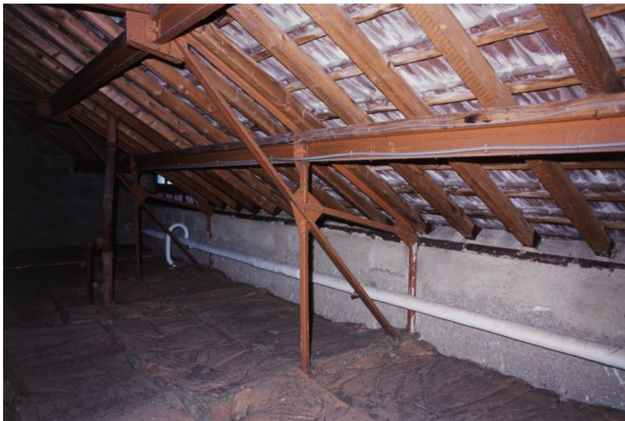
Combles : structure métallique et tuiles plates mécaniques de Saint-Romain.

71, Bergesserin Bois de la Châtelaine, lieudit : bois de la Châtelaine