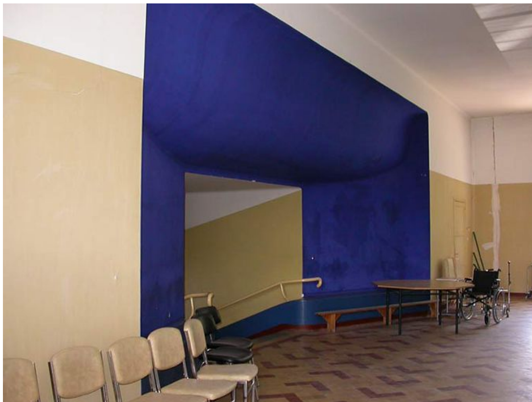
Entrée de la salle des fêtes.

71, Bergesserin Bois de la Châtelaine, lieudit : bois de la Châtelaine