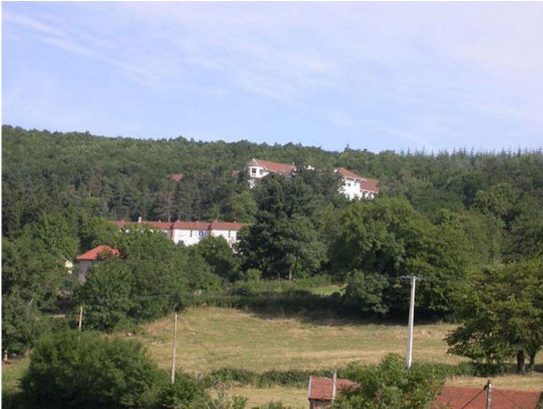
Vue générale du bâtiment dans la forêt.

71, Bergesserin Bois de la Châtelaine, lieudit : bois de la Châtelaine