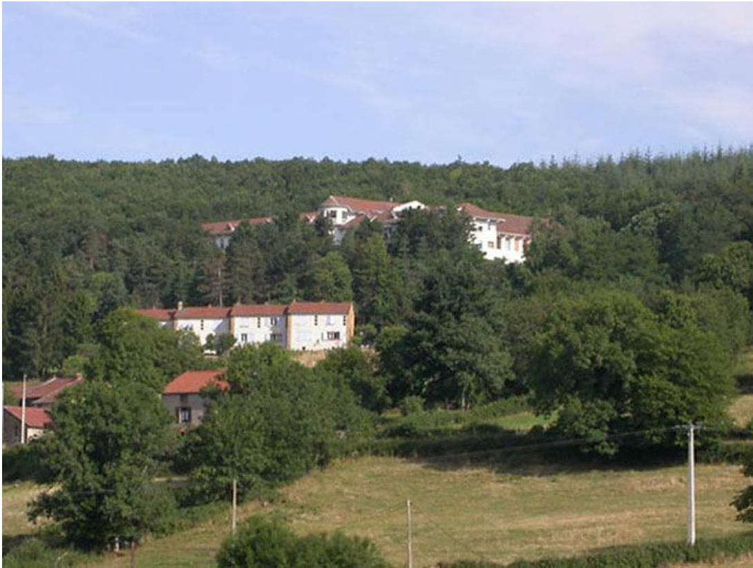
Vue générale du bâtiment dans la forêt.

71, Bergesserin Bois de la Châtelaine, lieudit : bois de la Châtelaine