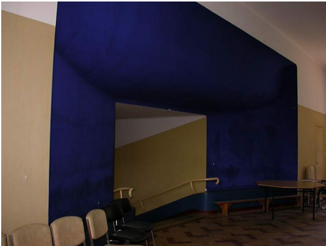
Entrée de la salle des fêtes.

71, Bergesserin Bois de la Châtelaine, lieudit : bois de la Châtelaine