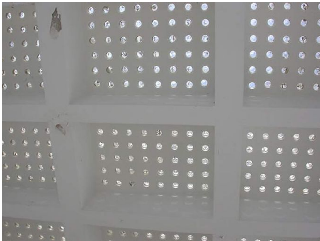
Détail de la marquise du perron du hall d'accueil.

71, Bergesserin Bois de la Châtelaine, lieudit : bois de la Châtelaine