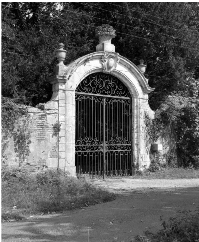
Portail donnant sur le "Sentier des Moines".

71, Saint-Loup-Géanges R.D. 62, lieudit : Saint-Loup-de-la-Salle