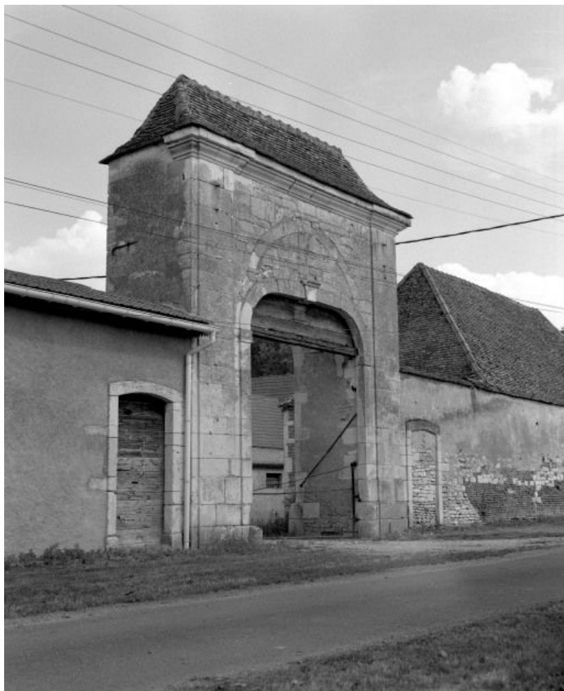
Porterie donnant sur le "Sentier des Moines".

71, Saint-Loup-Géanges R.D. 62, lieudit : Saint-Loup-de-la-Salle