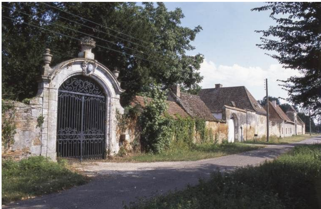
Bâtiments bordant le chemin dit le "Sentier des Moines". 71, Saint-Loup-Géanges R.D. 62, lieudit : Saint-Loup-de-la-Salle