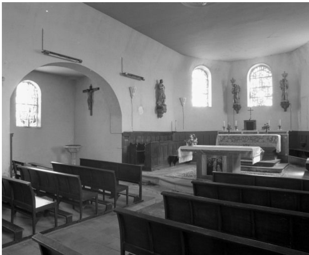
Choeur et chapelle gauche.