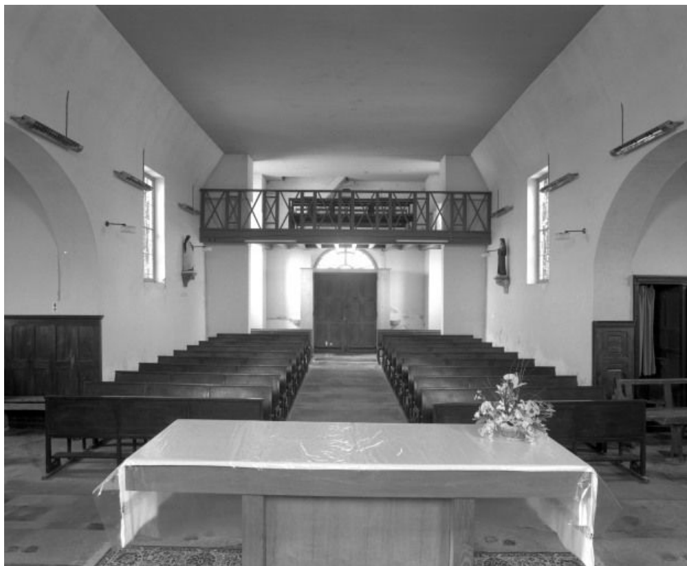
Vue d'ensemble depuis le chœur.