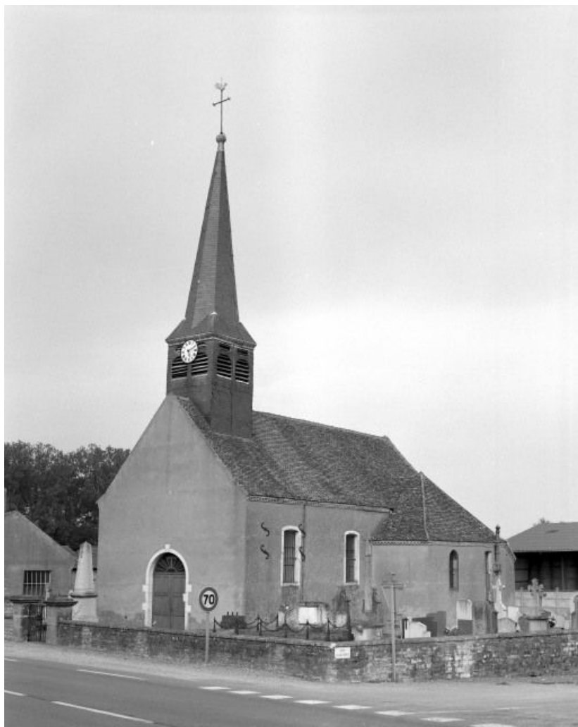
Façade et élévation droite.