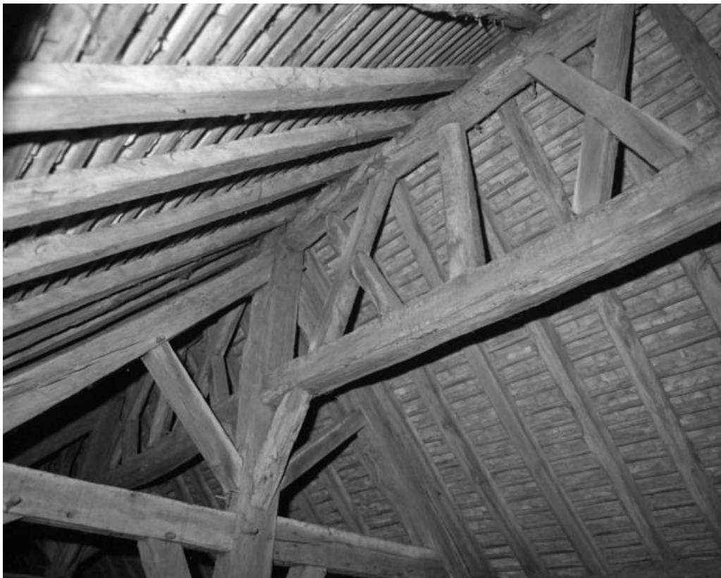
Charpente de la nef, détail du contreventement.