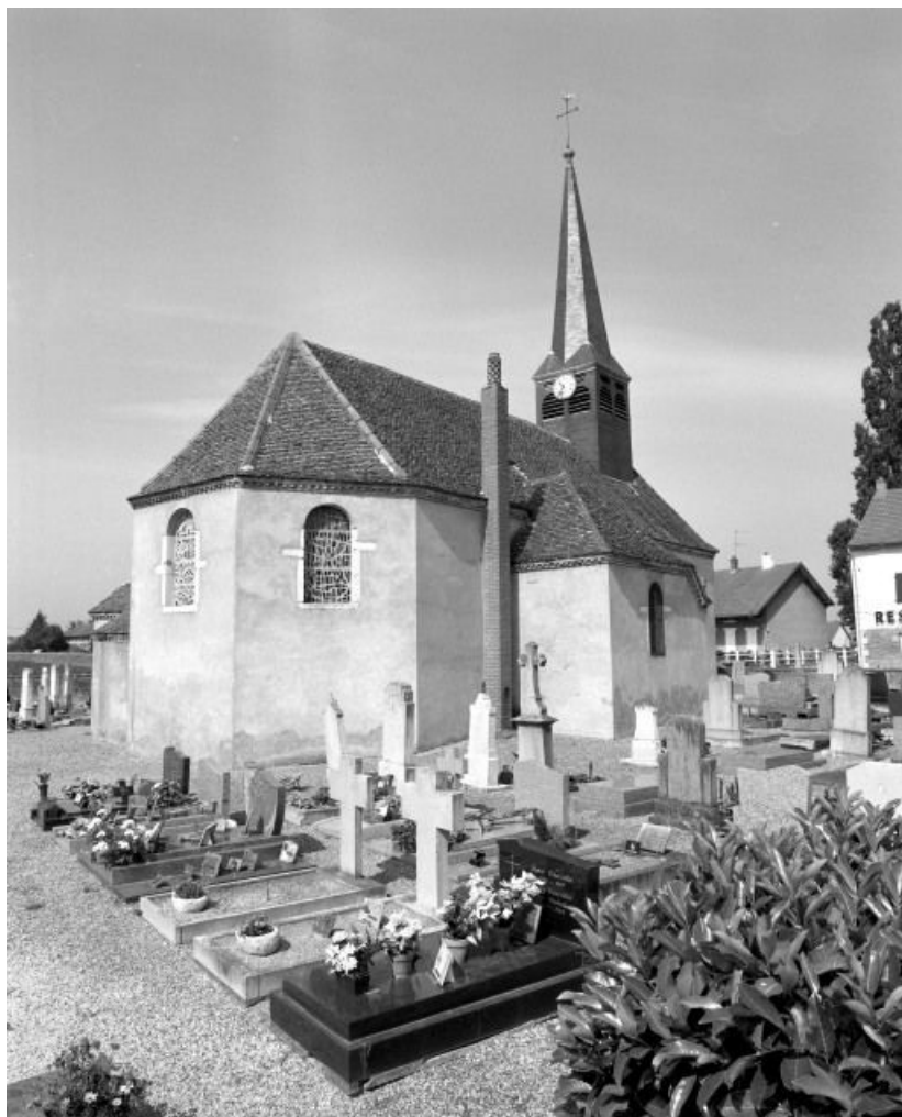
Chevet et élévation gauche.