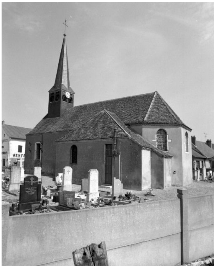
Élévation droite et chevet.