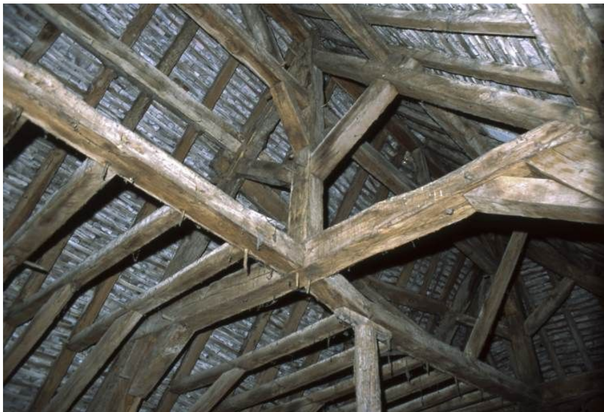
Logis secondaire, partie supérieure de la charpente.

71, Pontoux, 37 rue Puchêne, lieudit : Le Prieuré