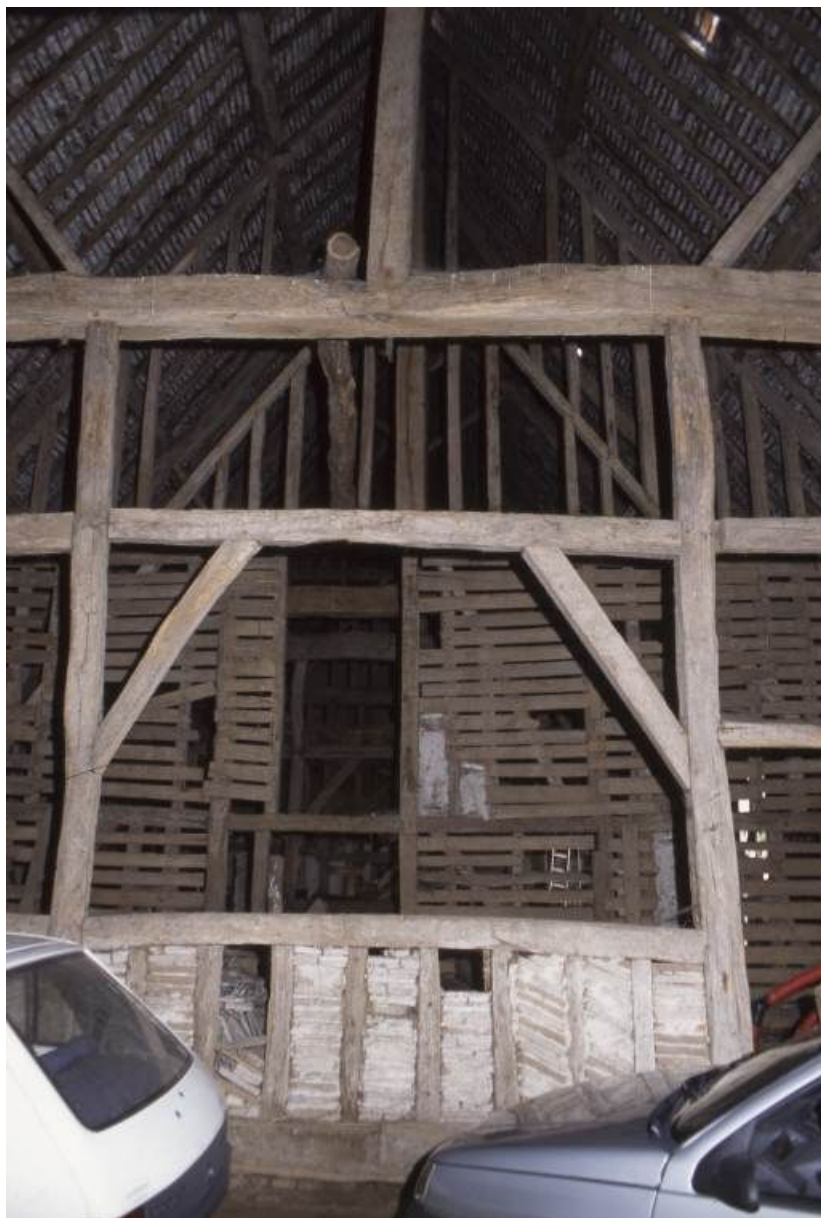
Grandes dépendances, cloisonnement intérieur.

71, Pontoux, 37 rue Puchêne, lieudit : Le Prieuré