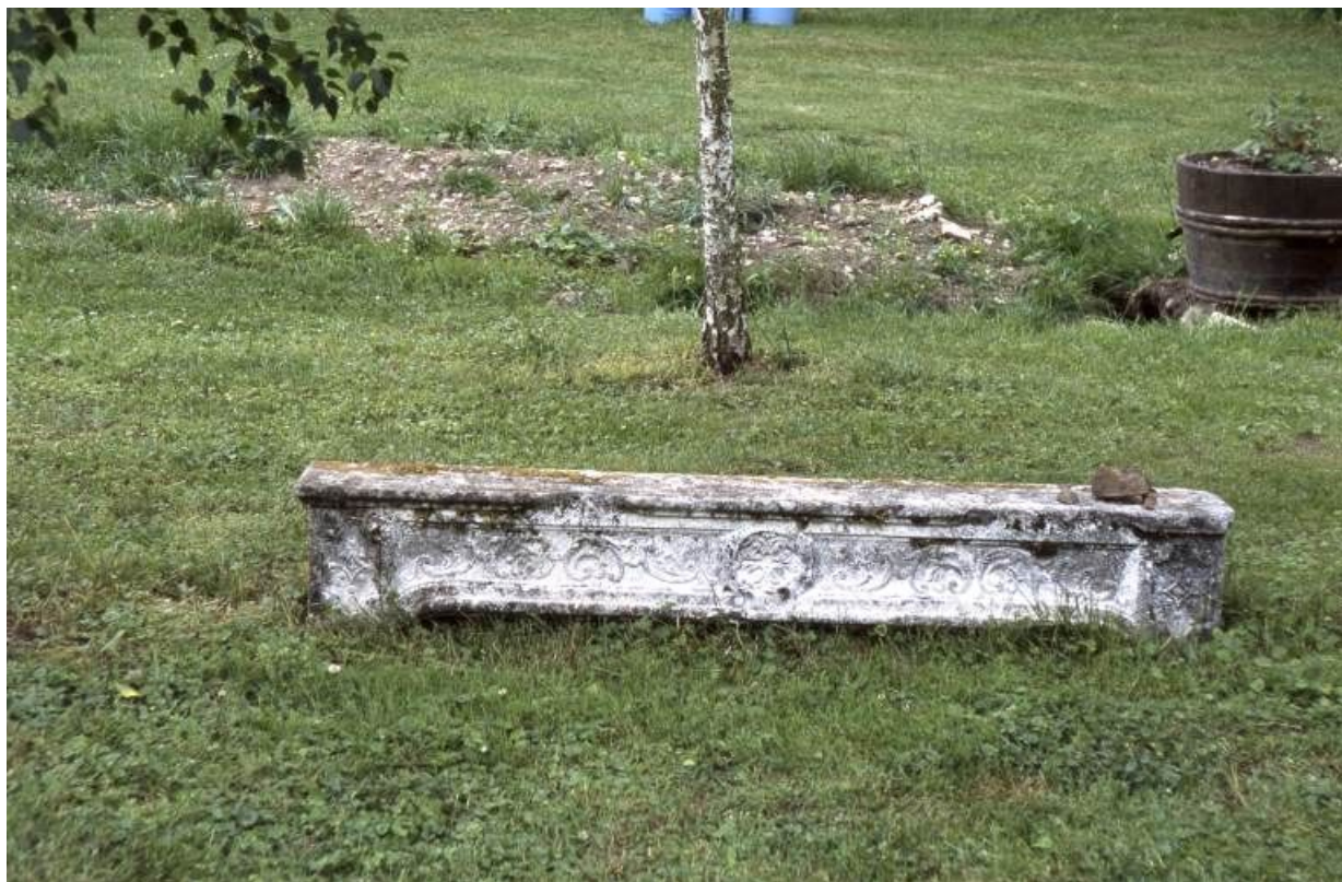
Linteau de cheminée déposé dans la cour.

71, Pontoux, 37 rue Puchêne, lieudit : Le Prieuré