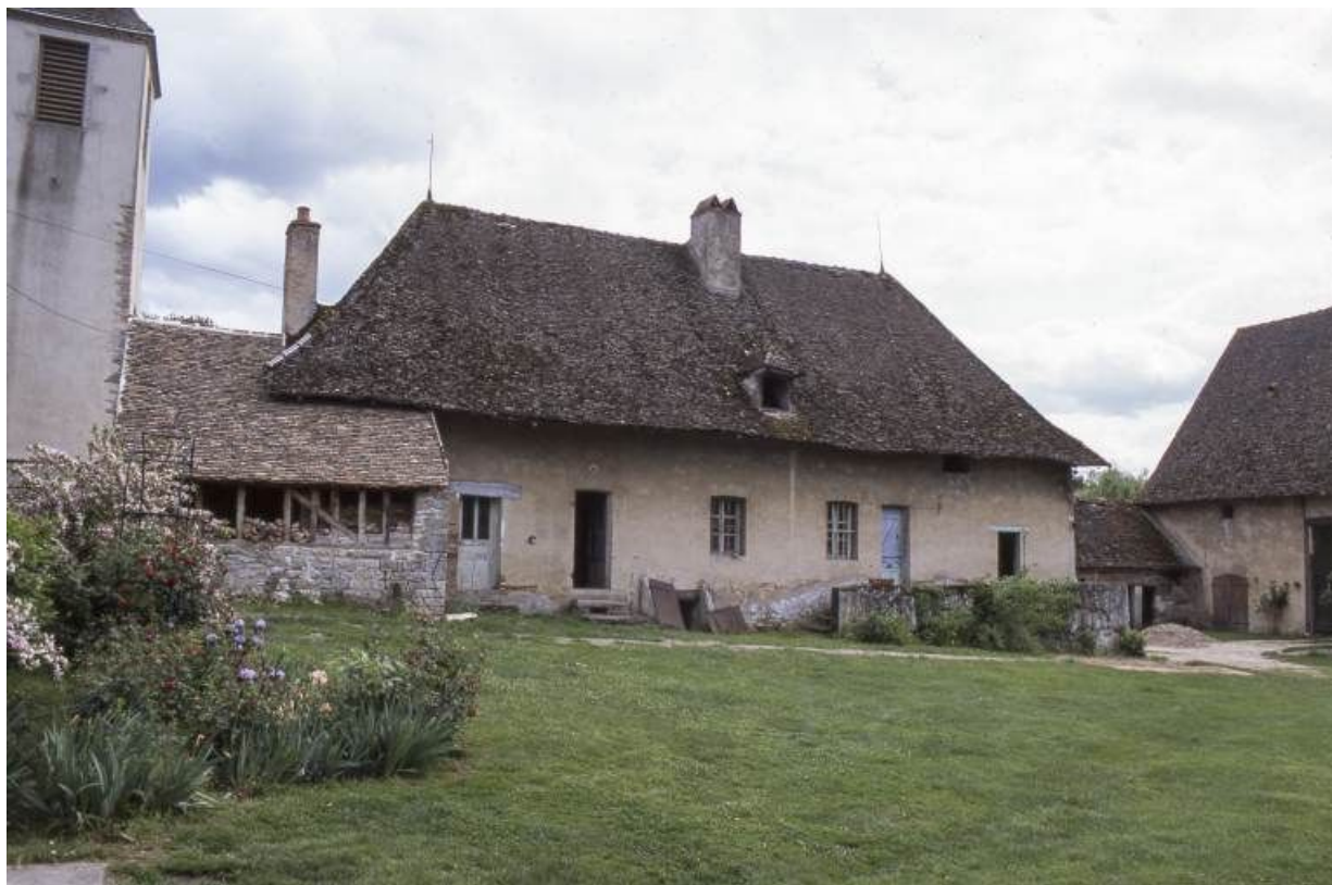
Logis secondaire et fournil à gauche.

71, Pontoux, 37 rue Puchêne, lieudit : Le Prieuré