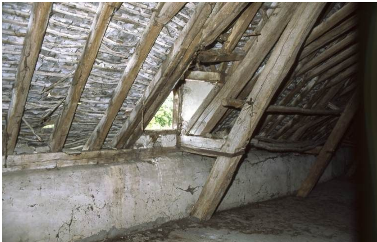
Logis secondaire, lucarne du comble vue de l'intérieur.

71, Pontoux, 37 rue Puchêne, lieudit : Le Prieuré