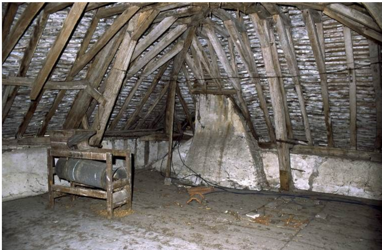
Logis secondaire, angle droit du comble avec conduit de cheminée.

71, Pontoux, 37 rue Puchêne, lieudit : Le Prieuré