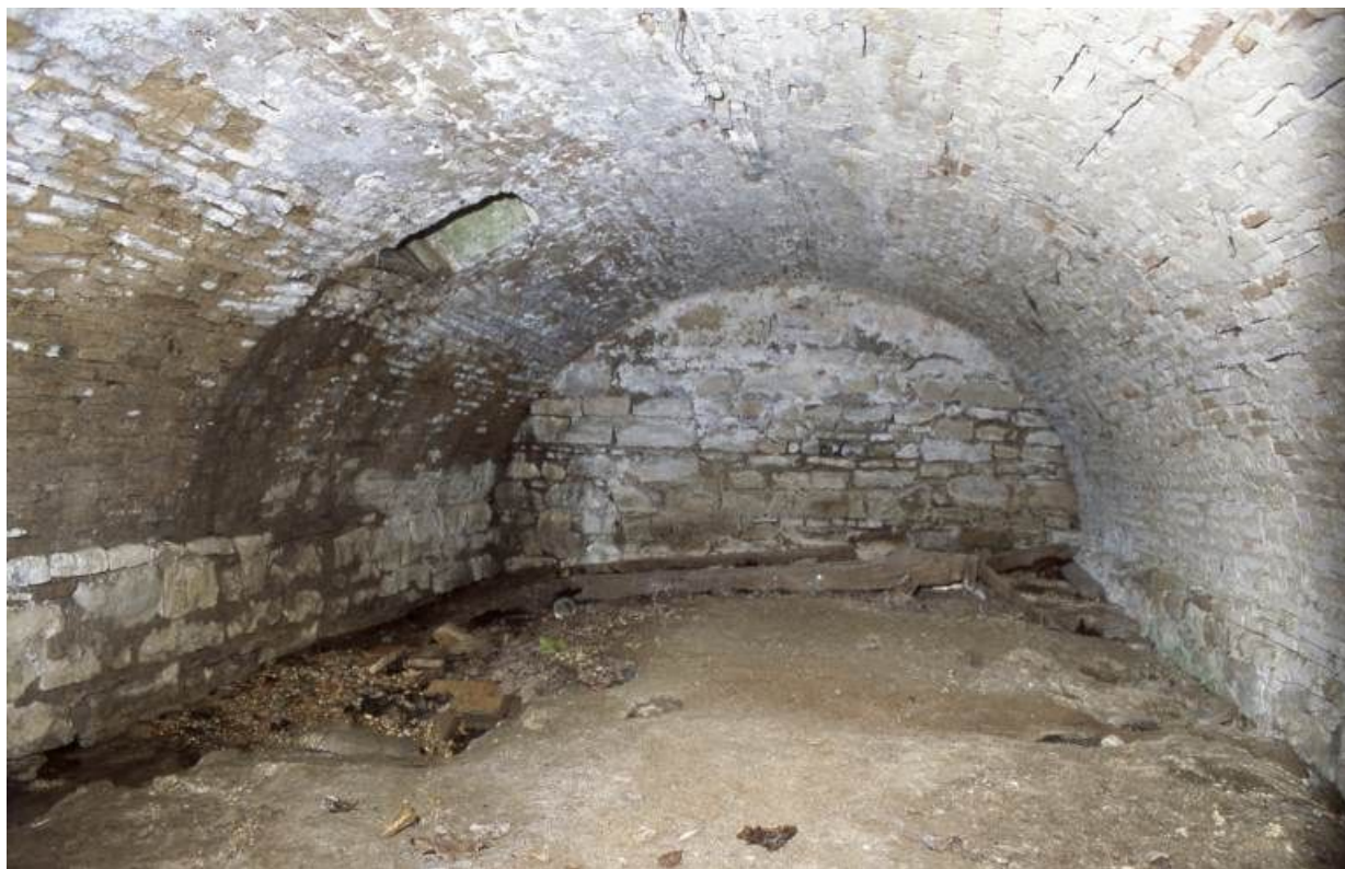
Logis secondaire, 2e cave (côté cimetière)

71, Pontoux, 37 rue Puchêne, lieudit : Le Prieuré