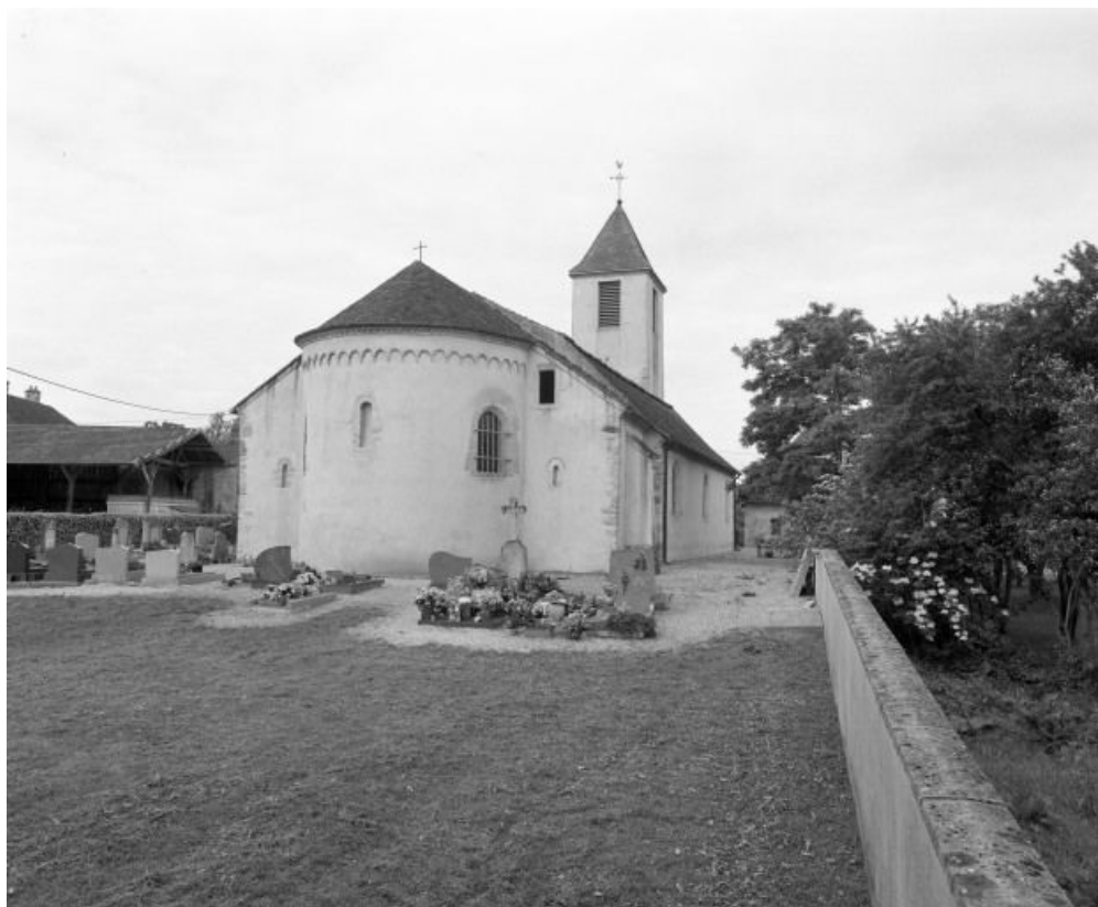
Chevet et élévation gauche.