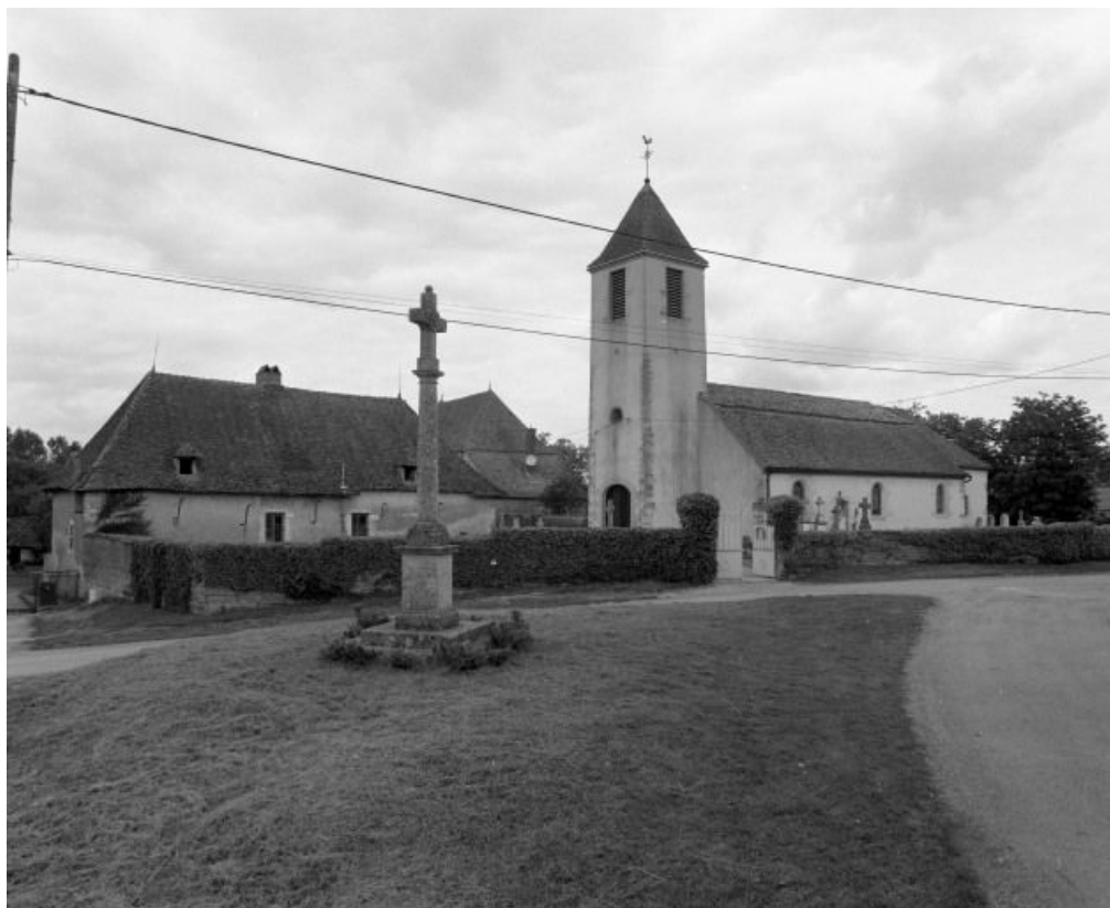
Vue d'ensemble de l'église et de l'ancien presbytère.