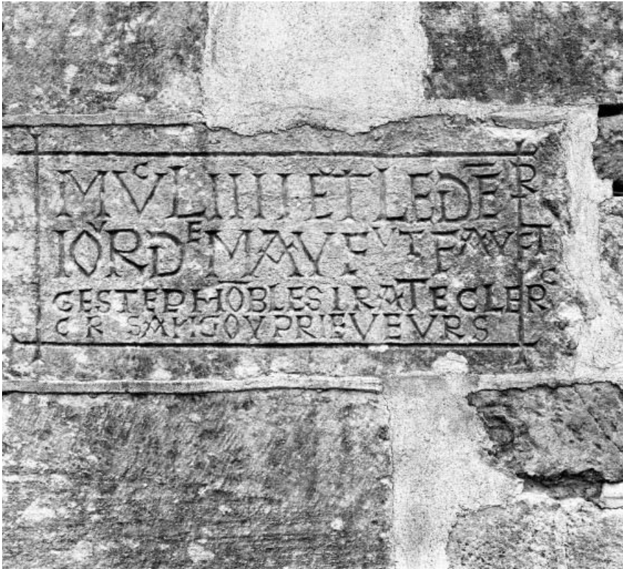
Pierre de fondation.