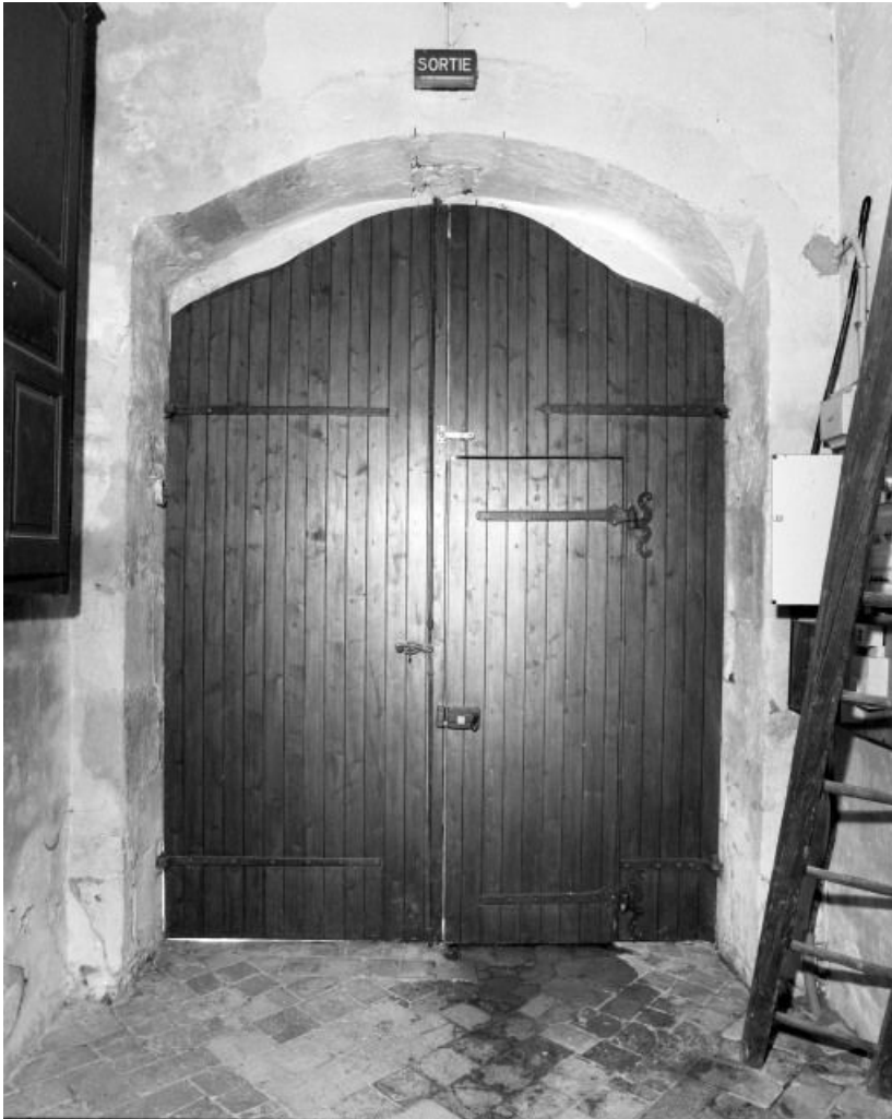
Porche : porte de le nef