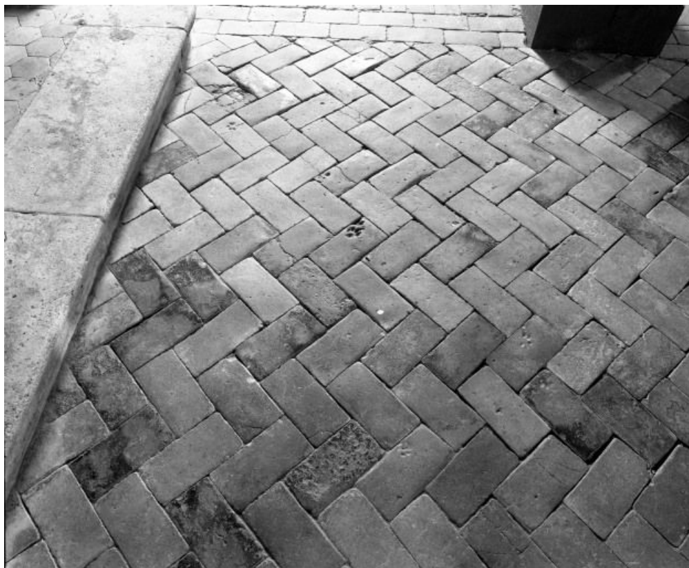
Détail du carrelage en terre cuite.