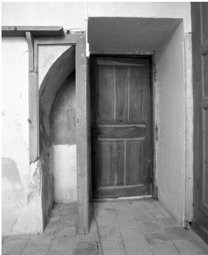
Sacristie gauche : vestiges de l'arcade qui ouvrait dans le Choeur. 71, Pontoux Eglise