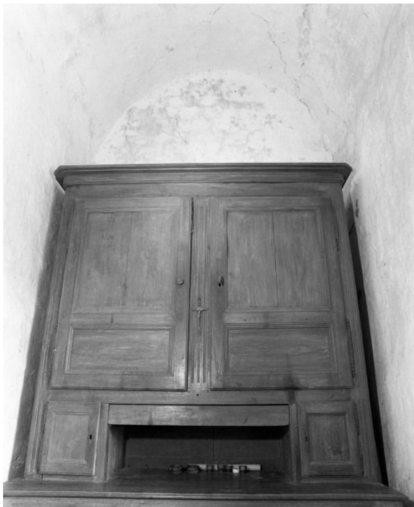
Sacristie droite, mur postérieur.