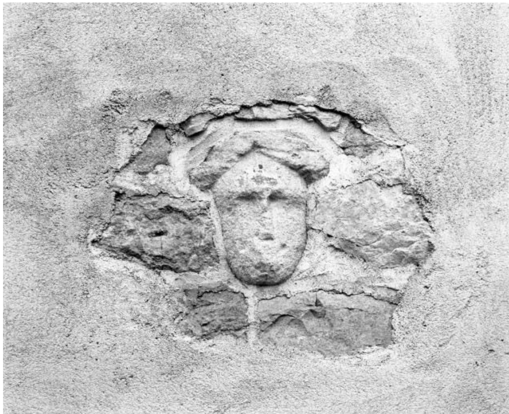
Tête employée dans le mur de l'abside.