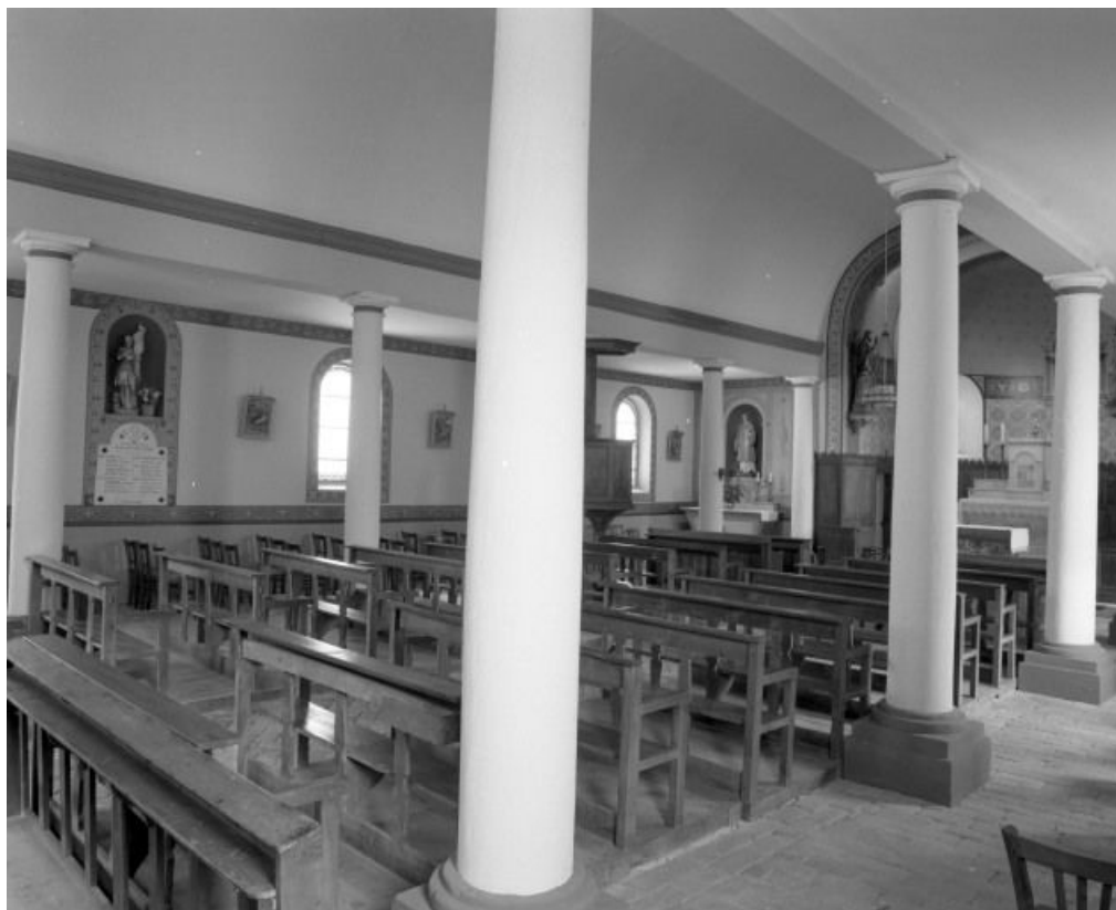
Vue de trois-quarts des trois vaisseaux de la nef.