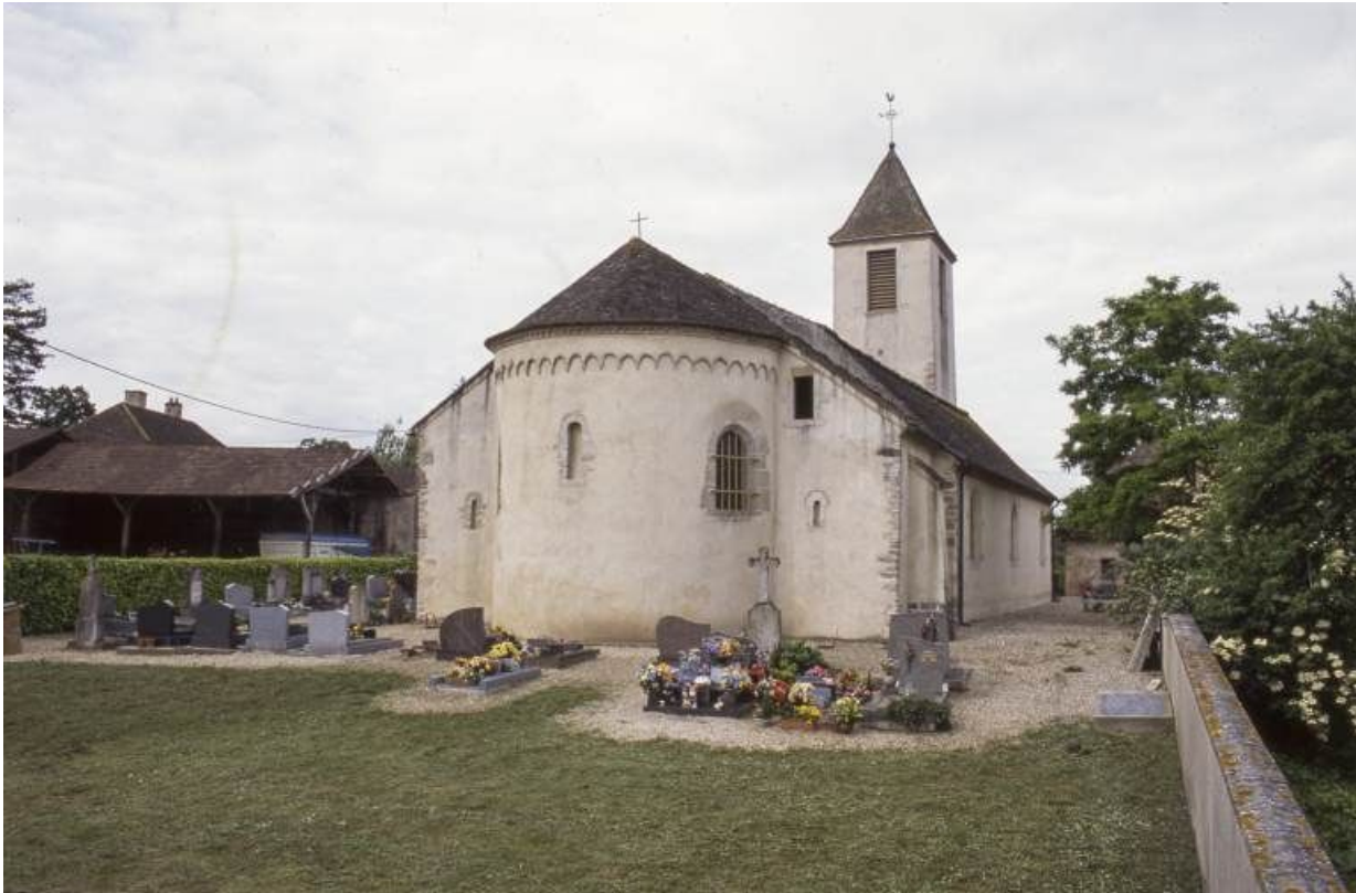
Chevet et élévation gauche.