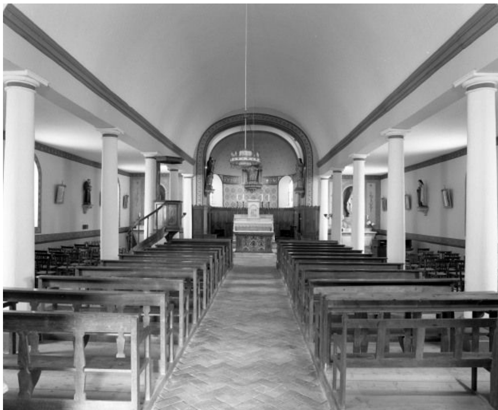
Vue d'ensemble prise de l'entrée.