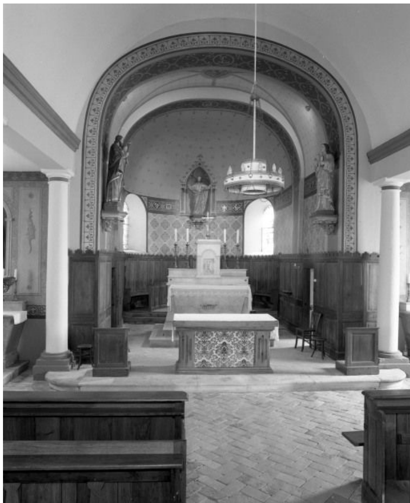
Vue rapprochée du chœur.