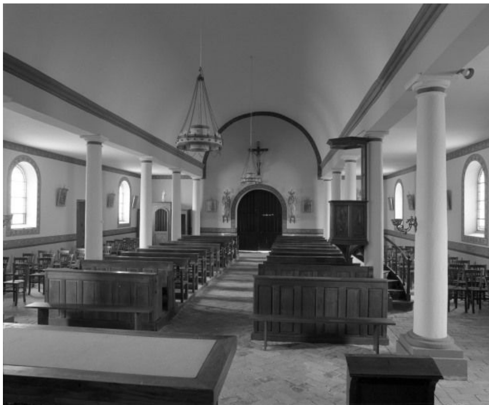
Vue d'ensemble prise du chœur.