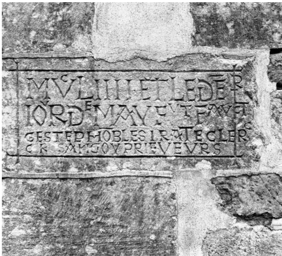
Pierre de fondation.