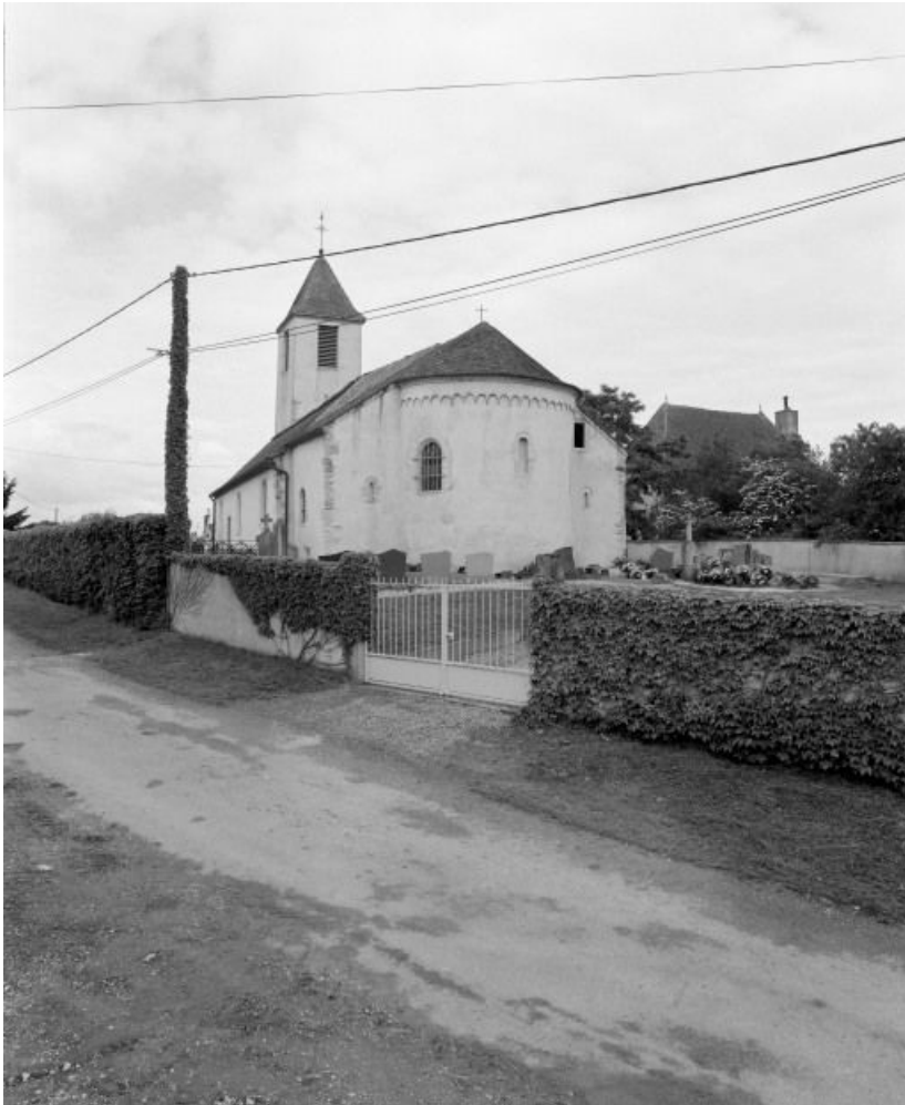
Chevet et élévation droite.