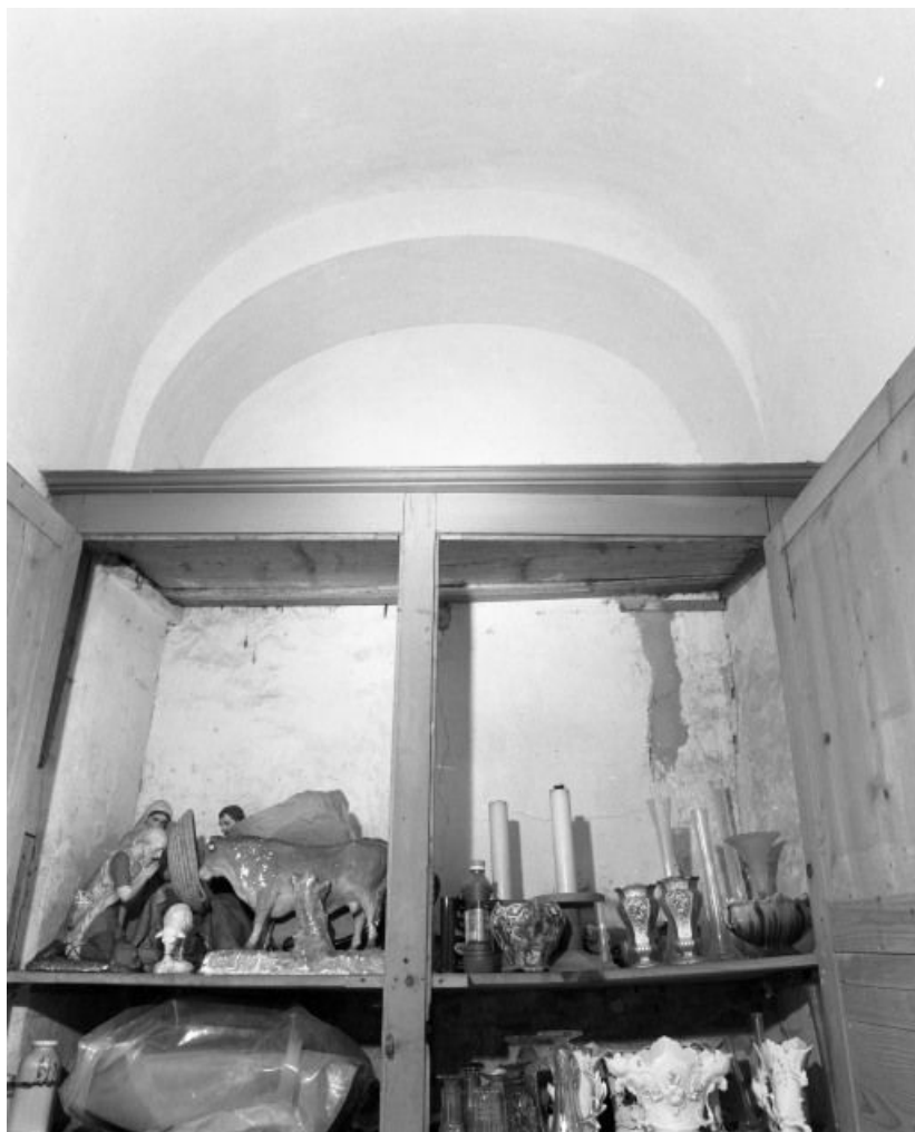
Sacristie gauche, mur antérieur.