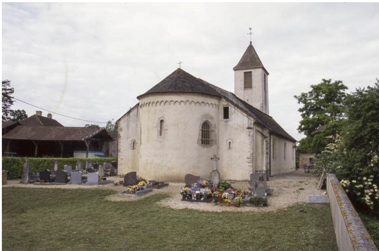
Chevet et élévation gauche.