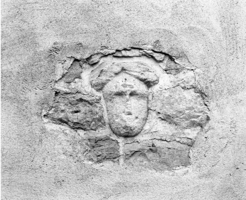
Tête remployée dans le mur de l'abside.