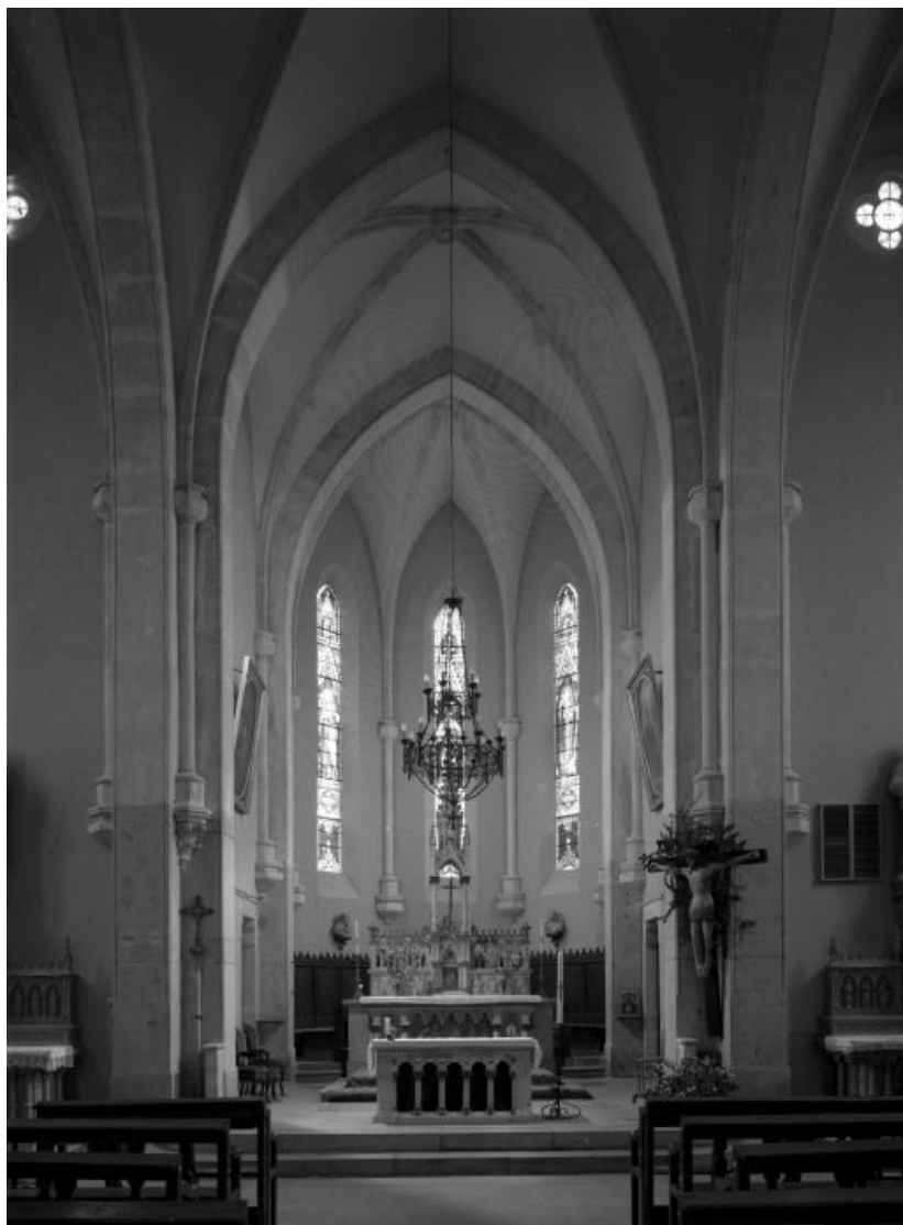
Vue rapprochée du chœur.