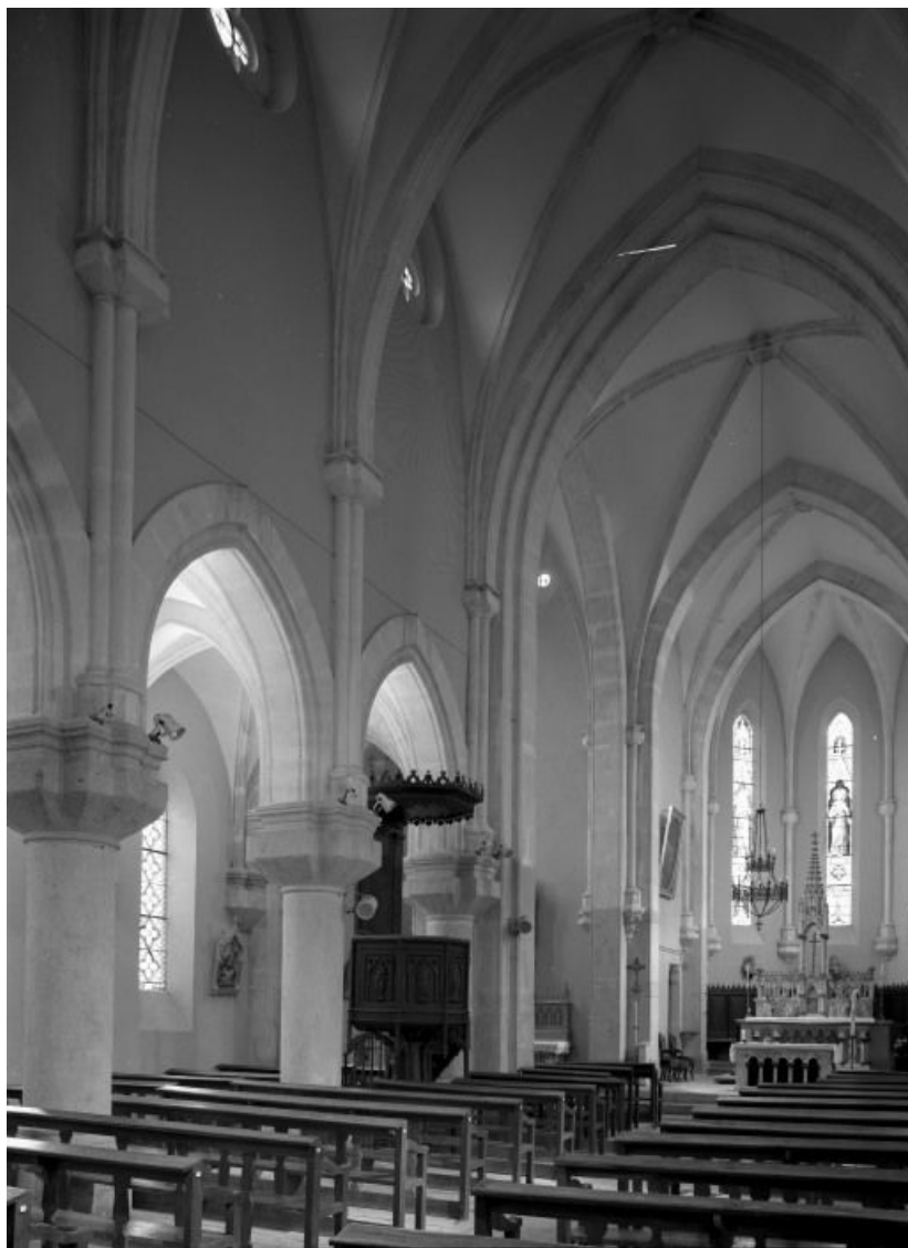
Vue d'ensemble prise de l'entrée.