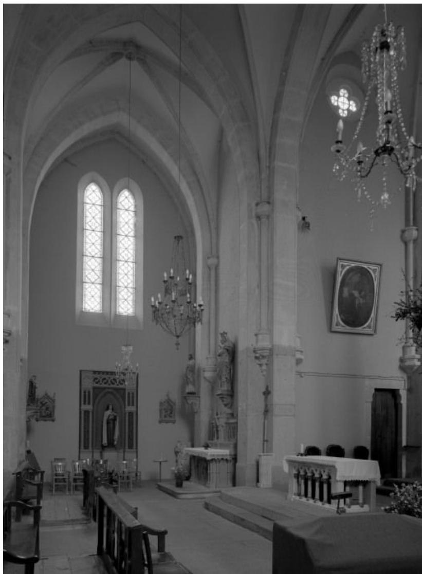
Vue du transept prise du bras droit.