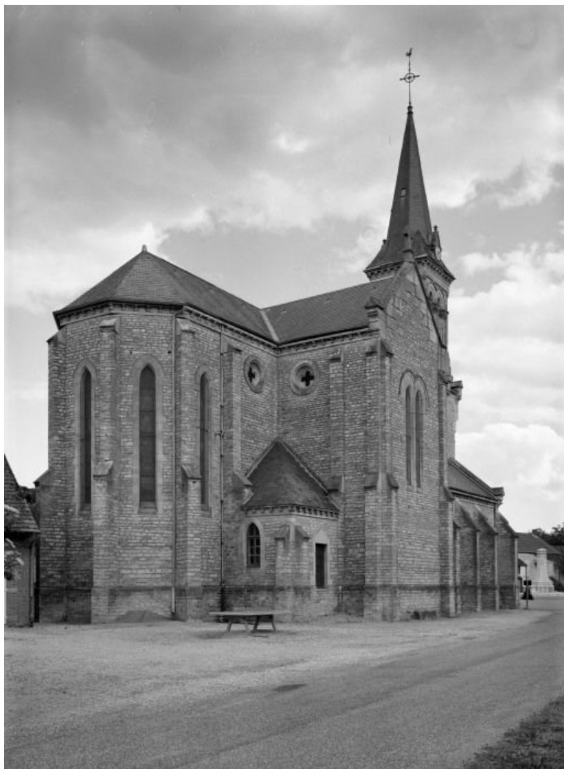
Chevet et élévation gauche.