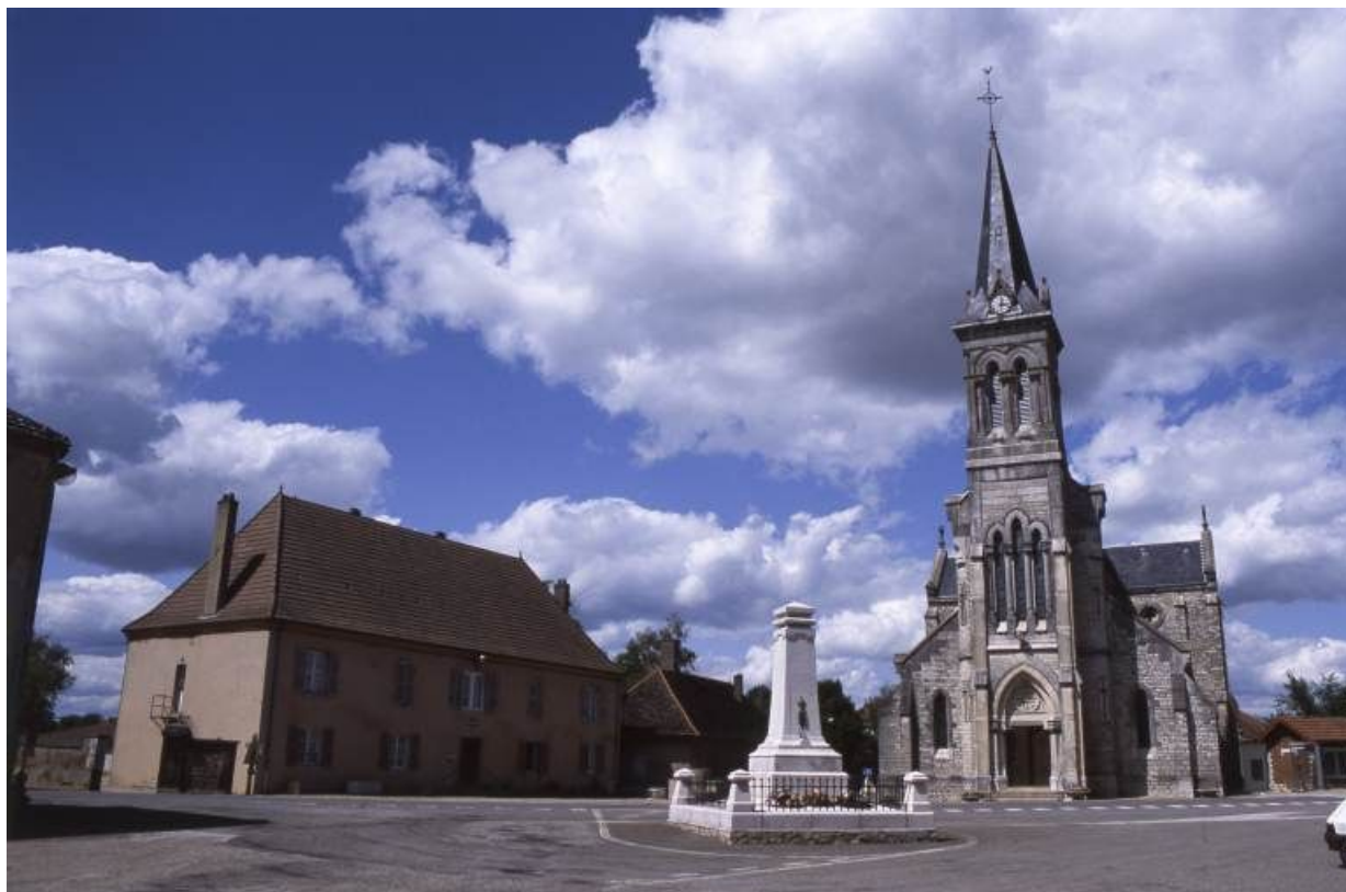
Place de l'église et de la mairie.