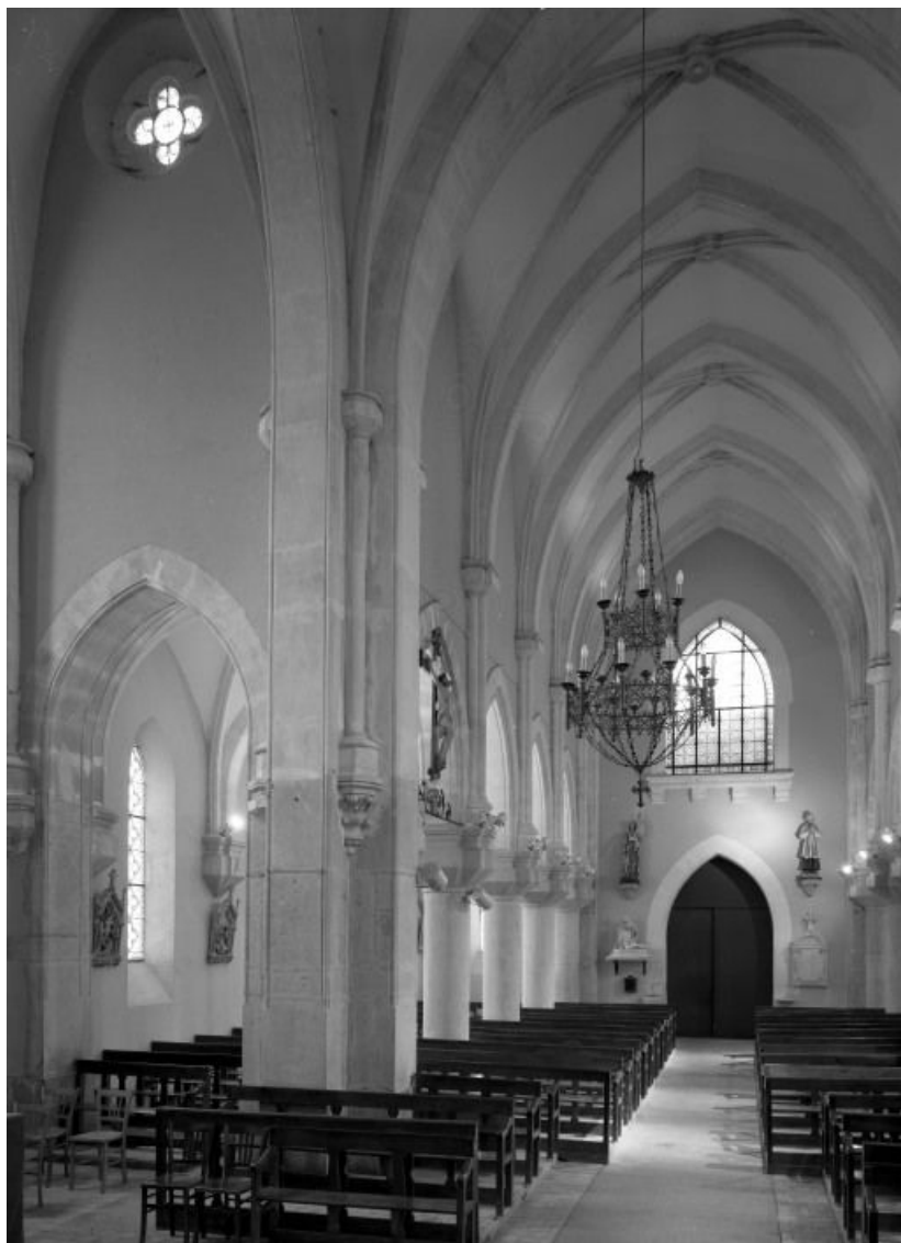
Vue d'ensemble prise du chœur.