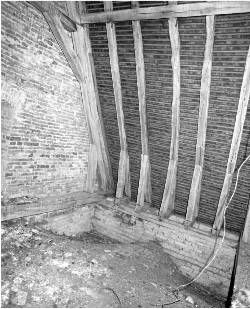
Comble du choeur, angle avec le mur de la nef.