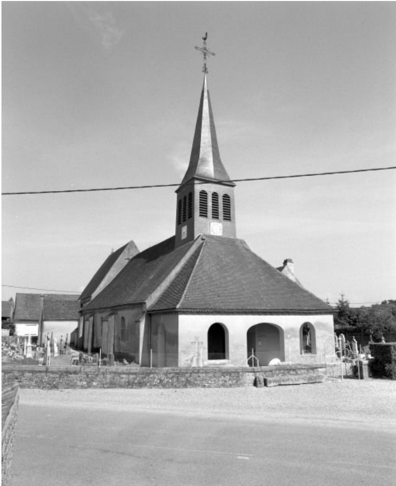
Vue d'ensemble : façade et élévation gauche.