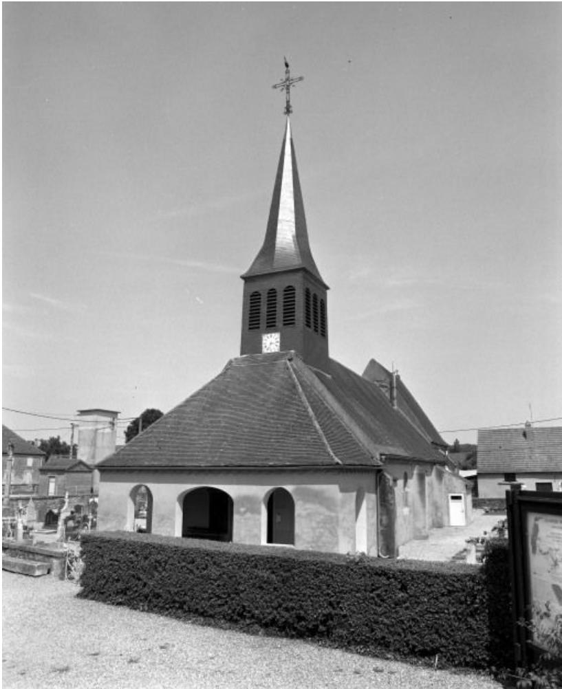
Vue d'ensemble : façade et élévation droite.