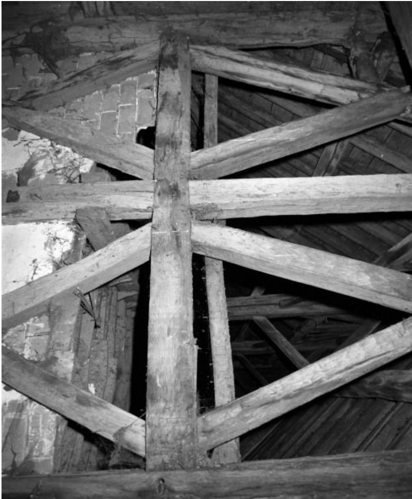
Comble : charpente du beffroi, côté nef.