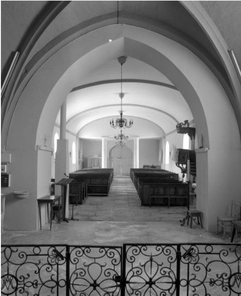
Vue d'ensemble depuis le chœur.