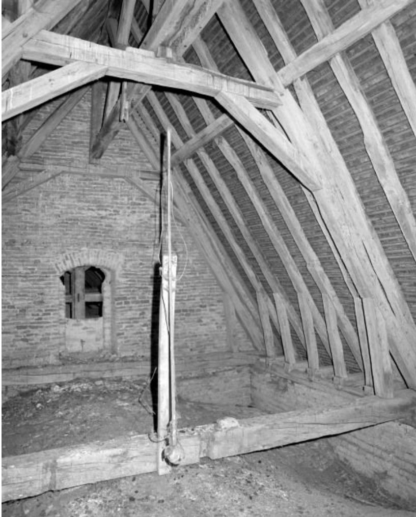
Comble du choeur depuis le mur du chevet.