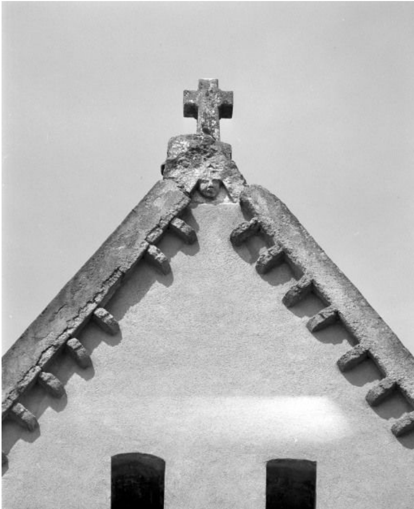
Tête surmontée d'une croix au sommet du pignon du choeur.