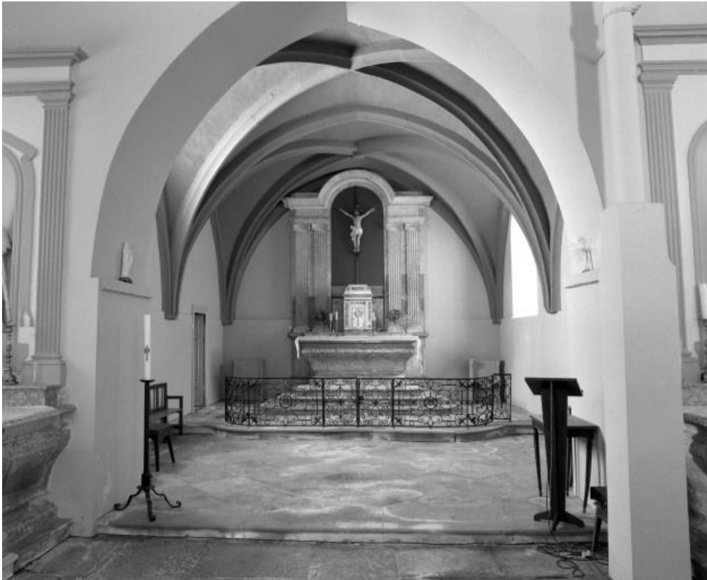
Vue rapprochée du chœur.