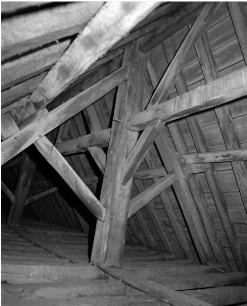
Comble : charpente de la nef.