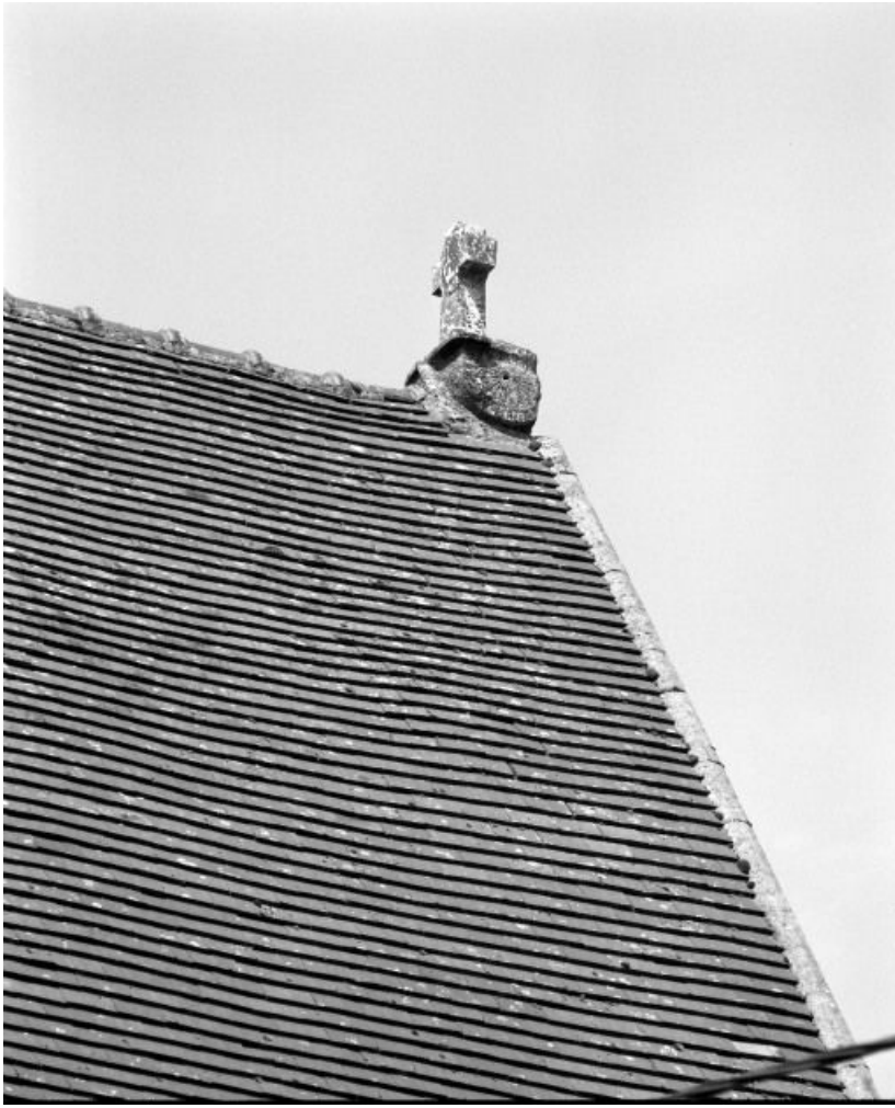
Cadran solaire sous la croix du pignon du chœur.