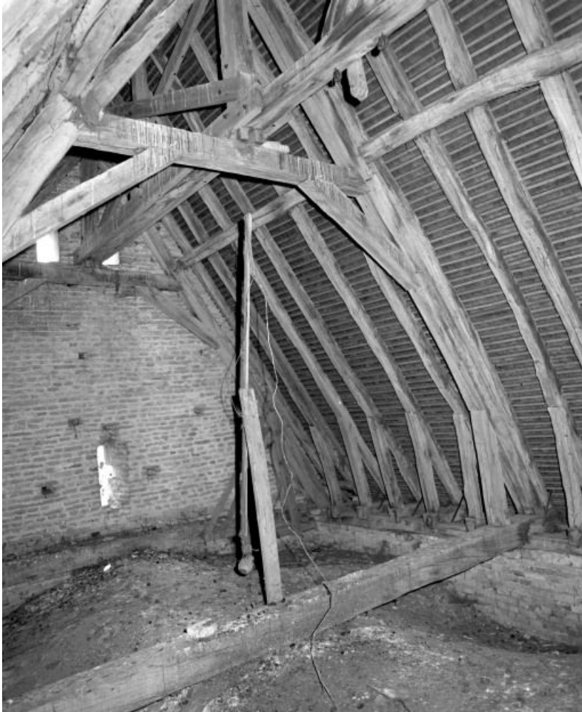
Comble du choeur depuis le mur de la nef. 71, Longepierre Bourg