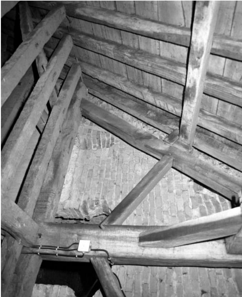
Comble : mur avec petite niche entre la nef et le chœur.