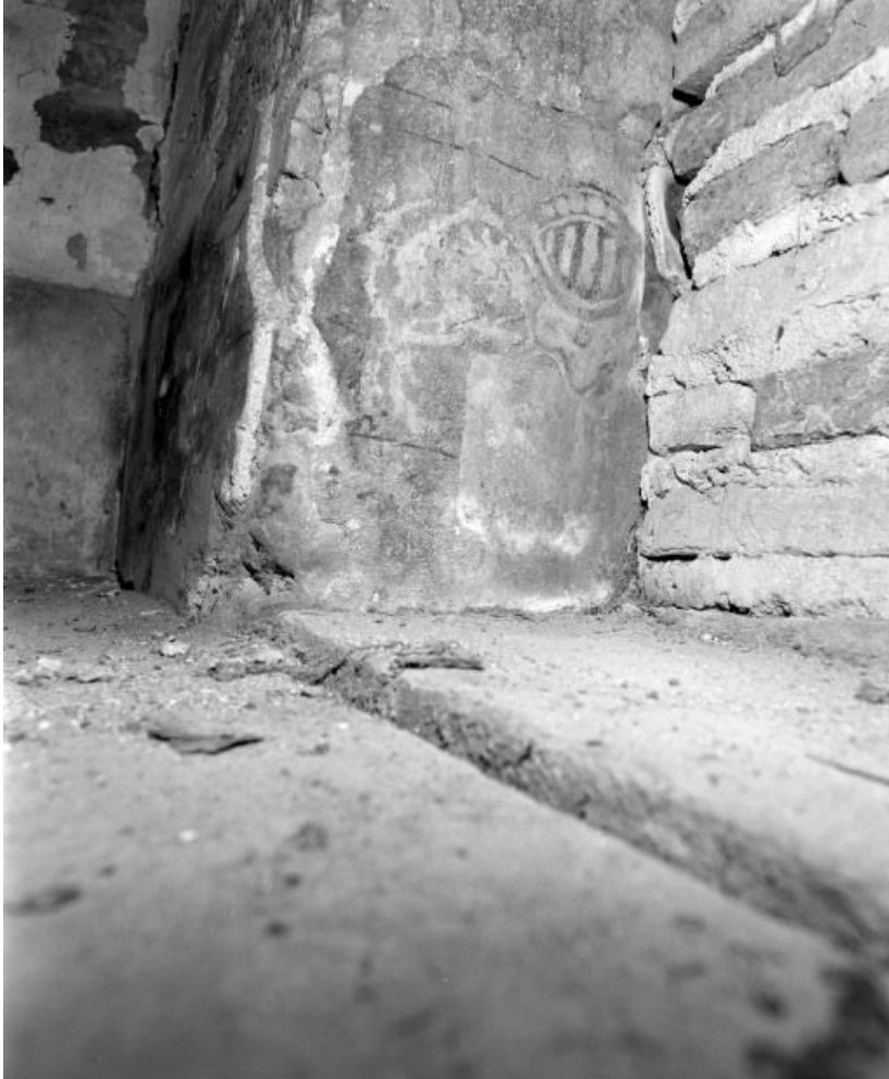
Porche : litre funéraire sur le contrefort situé dans la cage de l'escalier du comble. 71, Longepierre Bourg