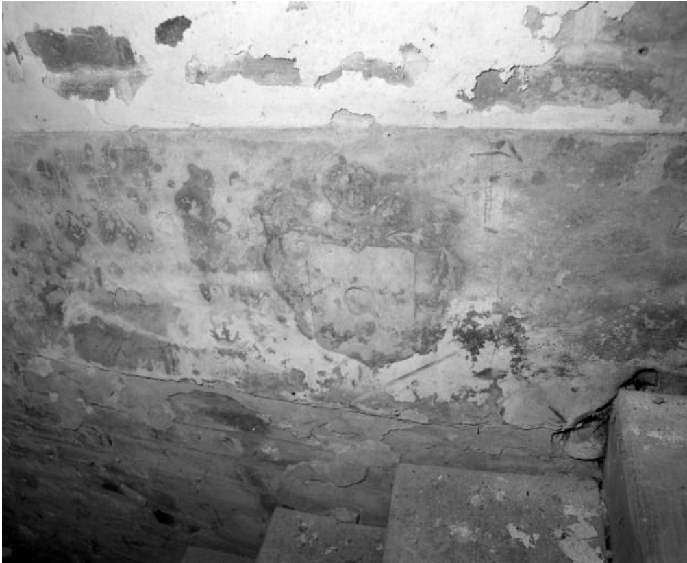
Porche : litre funéraire sur le mur de la nef dans la cage de l'escalier du comble.