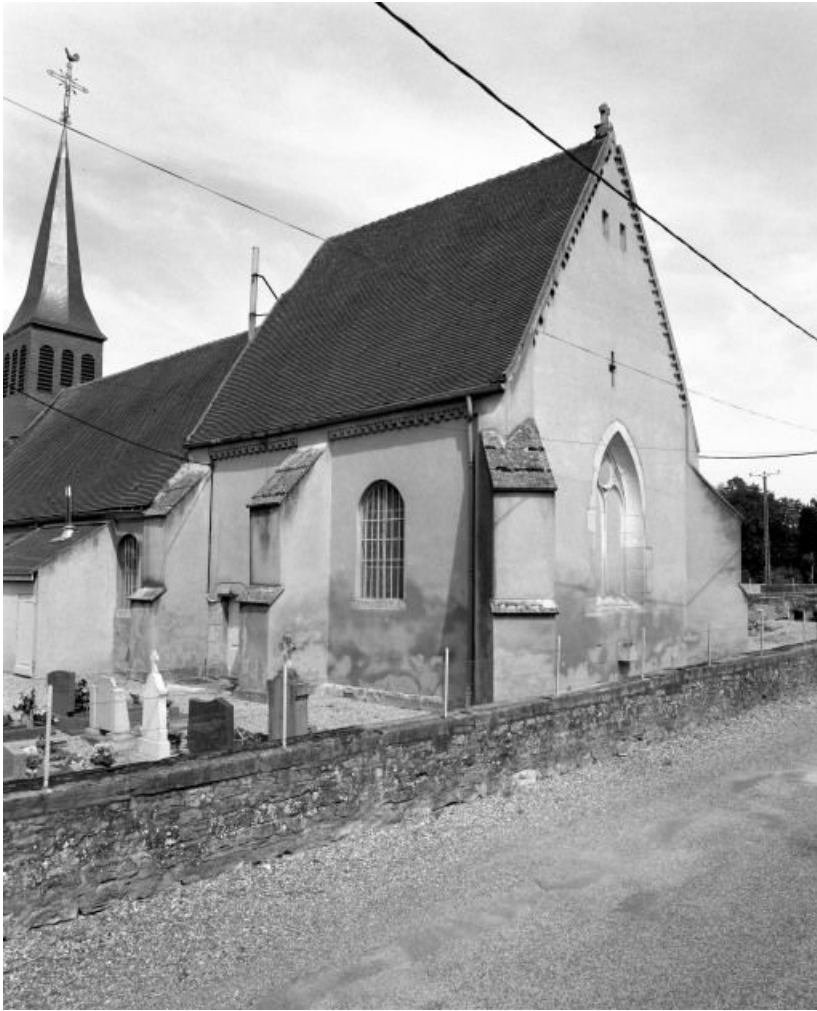
Choeur, vue de trois-quarts.