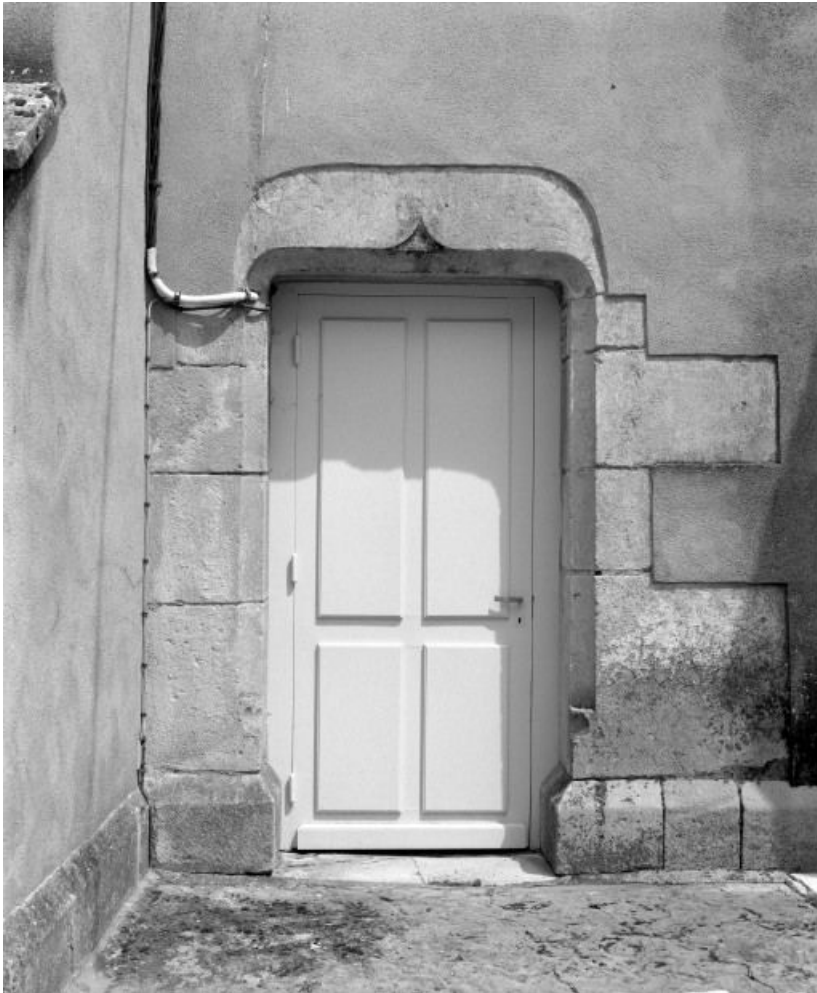
Choeur, porte latérale droite.